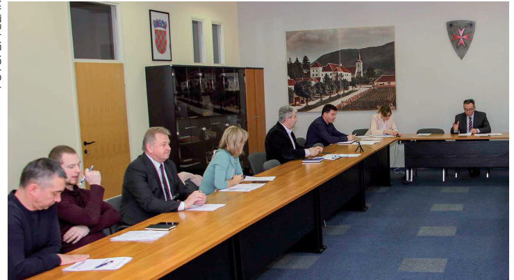
S prve ovogodišnje sjednice Vijeća za prevenciju Grada Ivanca

Ako je danas žrtva vaš susjed, sutra to možete biti vi! Susjedski nadzor nije samo zabadanje nosa u tuđe dvorište, već često znači i sigurnu kuću, stan, vikendicu, parkirano vozilo... Dobrosusjedski odnosi i komunikacija u ulici ili selu znače veću zaštitu imovine. Policijska praksa pokazuje da pravodobna informacija građana o počinjenju kaznenog djela u relativno kratkom vremenu dovodi do hvatanja počinitelja i takvo područje jedno vrijeme nije interesantno lopovima.