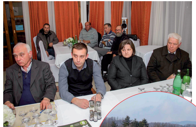
Na Zboru nije bilo teških riječi, ali građani su jasno rekli da im je strpljenje pri kraju Peradarska farma na Horvatskom: Inspeksijski očevid pokazao je da u radu farme nema nikakvih nepravilnosti

Gradonačelnik Batinić sudionike sastanka obavijestio je da je, temeljem njihovih zahtjeva, Grad Ivanec već u par navrata tražio