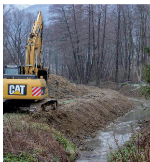
Očišćen je potok Ivanuševac na potezu od zapadnog rotora do mosta u Ul. žrtava hrvatskih domovinskih ratova

Ivanuševac. Od nanosa, mulja i raslinja očišćeno je oko 500 metara potoka na potezu od rotora do Ulice žrtava hrvatskih domovinskih ratova. Vrijednost radova je 104.000 kuna. (ljr)