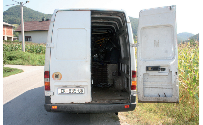
Skupljanje sekundarnih sirovina organiziranoj grupi služi samo kao isprika koja im olakšava ulazak u okućnice i pljačku kuća