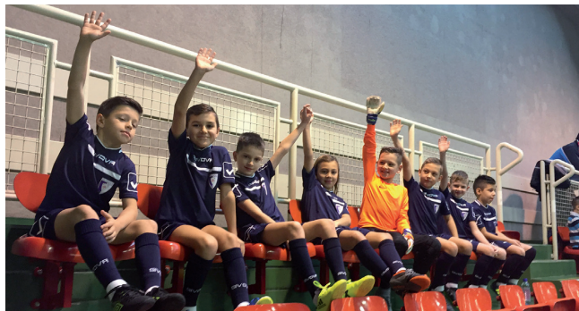
Nogometaši U9 u lipnju će omjeriti snage s vršnjacima iz najvećih europskih klubova

Na turniru u Austriji djeca su bila u pratnji roditelja, trenera D. Belcara, šefa stručnog stožera D. Friščića i predsjednika J. Grđana. (jg)