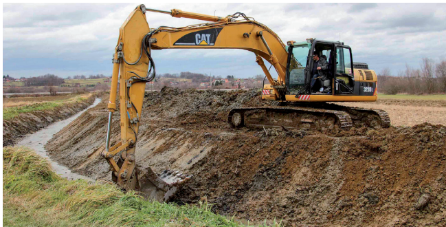
Uređeno je oko 500 metara potoka Vukovec