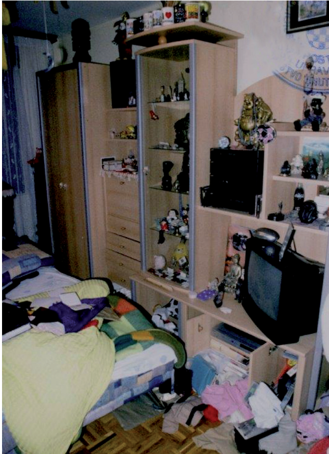
Ovako izgleda stan nakon provala

Isto tako, zatražio je od Ivkoma i drugih nadležnih službi da uvažavaju upozorenja i zahtjeve Udruge invalida ILO Ivanec te da na ispravan način označe parkirališna mjesta na gradskoj špici za invalide. I kod Superkonzuma ih je potrebno urediti na lokaciji pogodnoj za osobe s