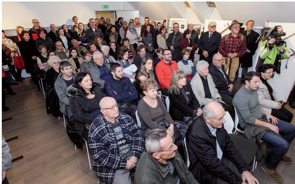
Ivančani su se masovno odazvali manifestaciji Noć muzeja