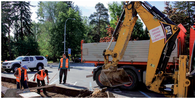
U održavanje nerazvrstanih cesta više od 1,2 milijuna kn