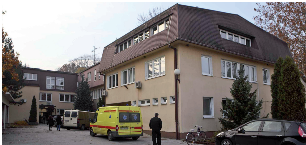
Tvrdnju Varaždinske županije da u Domu zdravlja Ivanec nema prostora za nadstandard Hitne demantiraju sami liječnici

Dogovoreno je da će i Ivanečke novine također redovito objavljivati upozorenja policije, a sve u cilju kvalitetnog informiranja građana i poduzimanja pravodobnih mjera samozaštite. Prvo upozorenje slijedi u nastavku. (Ijr)