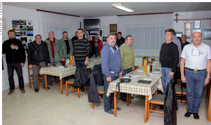
Počast časnika i gostiju hrvatskoj himni