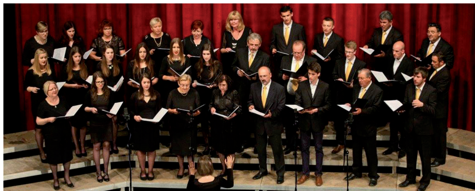
Srebrna plaketa za sjajne članove Mješovitog pjevačkog zbora KUD-a R. Rajter