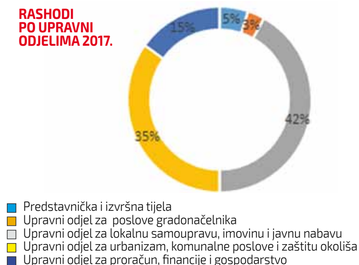
RASHODI PO UPRAVNI ODJELIMA 2017.