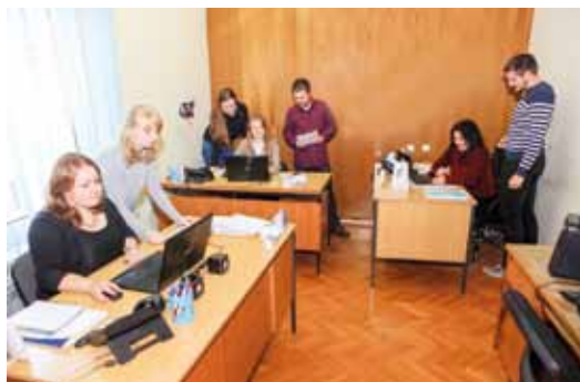
PROJEKTNI URED ZA EU FONDOVE