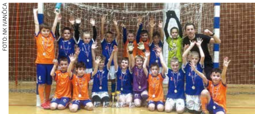
Bravo osvajačima medalja!

Mladost je na kraju jesenskog dijela prvenstva šesta, s 23 boda. U 14 odigranih utakmica izborila je 7 pobjeda, dvaput je odigrala neriješeno, a pet puta je poražena