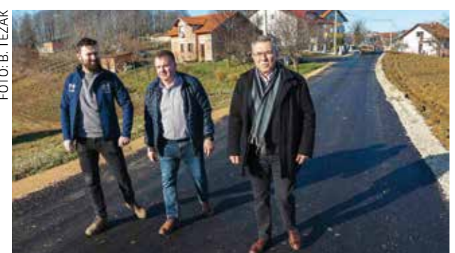
U obilasku završnih radova na asfaltiranju 2,7 km ceste

Unatoč tomu što sredstva za to nisu bila osigurana u proračunu te očiglednih opstrukcija, Grad Ivanec našao je način da proširena cesta ne ostane bez asfalta. Sam je isfinancirao sve radove te omogućio gradonačelniku i nedovoljne širine bila opasna za promet, a pogotovo