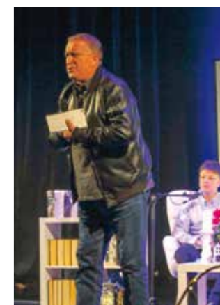
I. Kušteljega: Sveti Duh i dalje svieti...