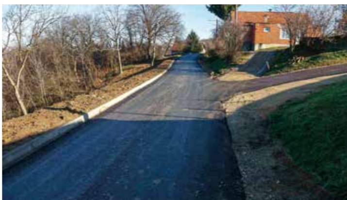
Sanirano klizište i novoasfaltirana cesta

Ovim radovima ujedno je završen program sanacije klizišta Grada Ivanca za 2025. Lani su, podsjećamo, sanirana četiri klizišta - u Radničkoj ulici u Radovanu, u Babinim goricama u Prigorcu, u UL Ivanuševec u Ivancu te ovo zadnje, u Škriljevcu.