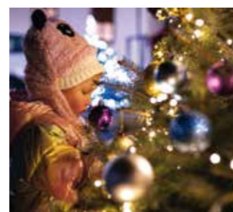
U duhu Božića...

Sv. Nikolu u nabavi darova za djecu pomoglo je više od 20 lokalnih poduzetnika i donatora