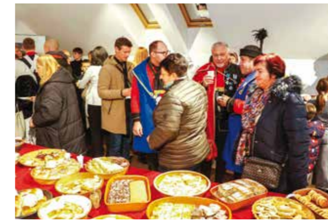
Na rudarskom domjenku u dvorani Muzeja planinarstva

s motivima ivanečkih rudnika i rudara, te izloženim rudarskim predmetima.