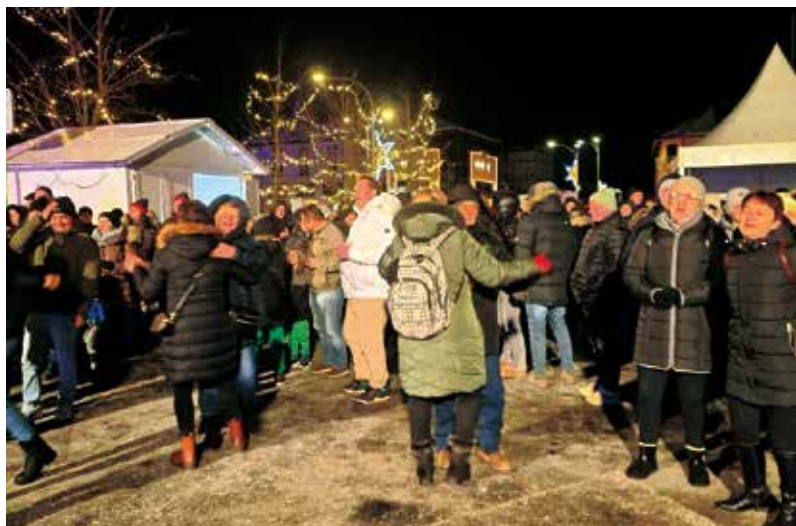
Doček Nove godine na gradskoj špici

S bine su publiku nizom hitova „grijali“ popularni Begini