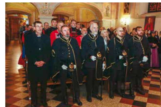
Na rudarskoj misi