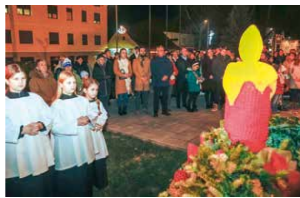
Vjernici okupljeni oko vijenca u danima došašća

NAŠI MALIŠANI Božićni program dječjih vrtića oduševio publiku