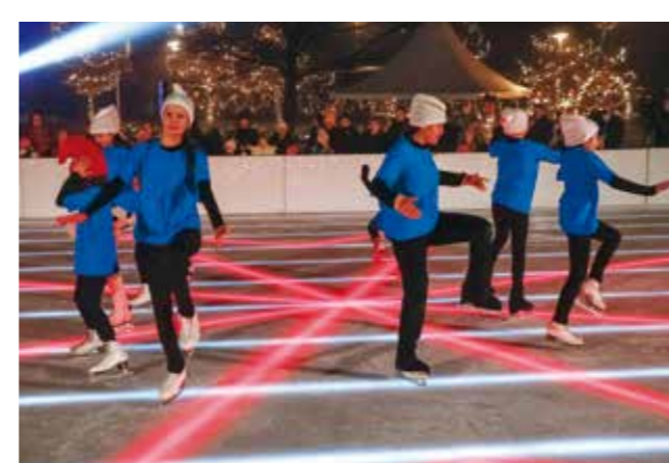
„Čarobna bajka“ Klizačkog kluba Medo iz Zagreba