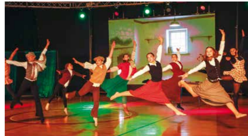
Raskoš tema, koreografija i kostima

Do posljednjeg detalja osmišljene i uvježbane plesne koreografije pratile su radnju slavne božićne priče s kraja 19. stoljeća. U plesnoj produkciji sudjelovale su sve skupine, od seniora i juniora do kadeta i mini kadeta. Cijelu produkciju uvježbale su voditeljice Ana