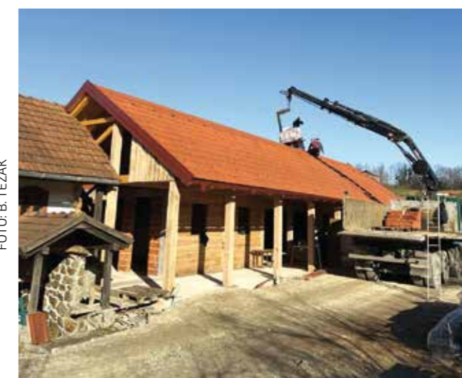
Kompletan novi objekt prekriven je biber crijepom

ETNO KUĆA BEDENEC Završena prva faza dogradnje