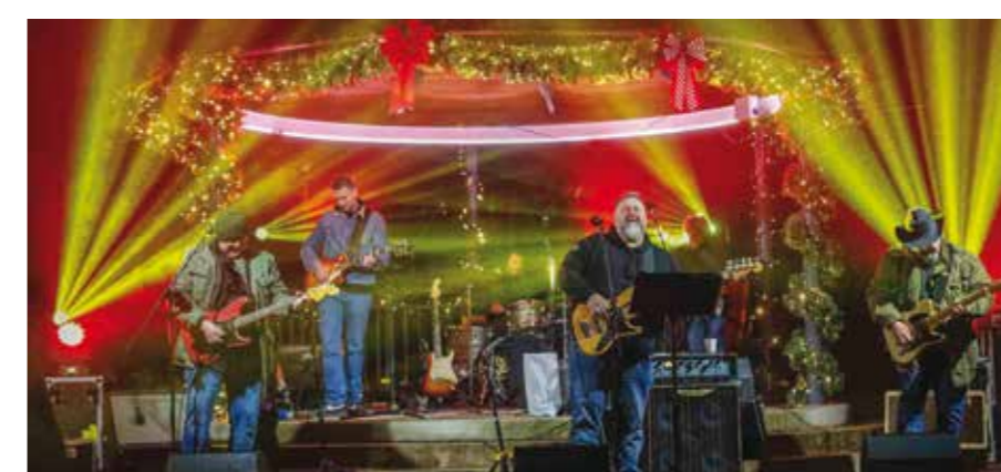
Mavrek i društvo iz Sothern Crowda. Dobra atmosfera je zajamčena!