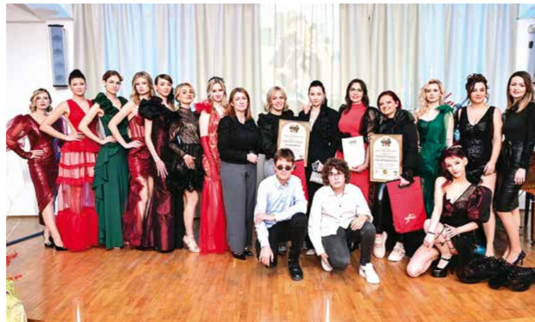
Stilisti Ivancu! Sve čestitke!

Frizurama dostojnih velikih modnih pisti, odjevnim predmetima, modnim naočalama, nakitom i drugim dodacima obrtnici su oduševili Ivanec, a prikazane su i „frizure“ za kućne ljubimce