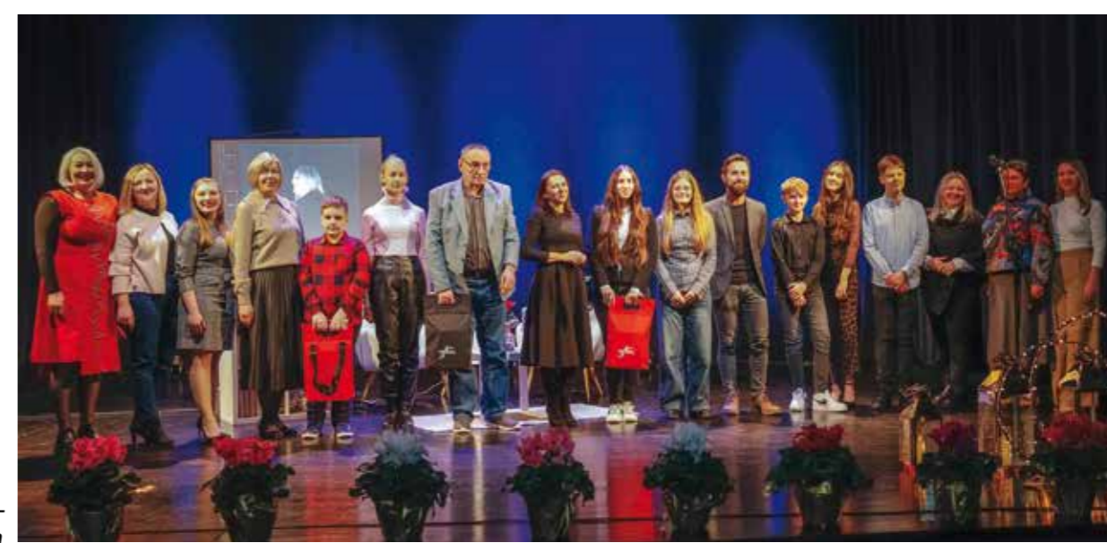
Najbolji pjesnici DDR 2025. s cijelim organizacijskim timom i prosudbenim povjerenstvom

Na svečanosti su pročitane pobjedničke pjesme sa svih 45 dosadašnjih natječaja