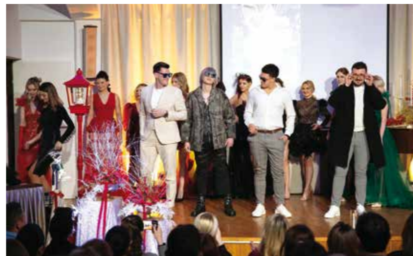
Kvalitetne naočale – neizostavan dio svakog stylinga