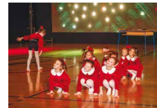
Nastupile su sve skupine Plesnog kluba Ivančica

KUD RUDOLF RAJTER Božićni koncert u gradskom parku