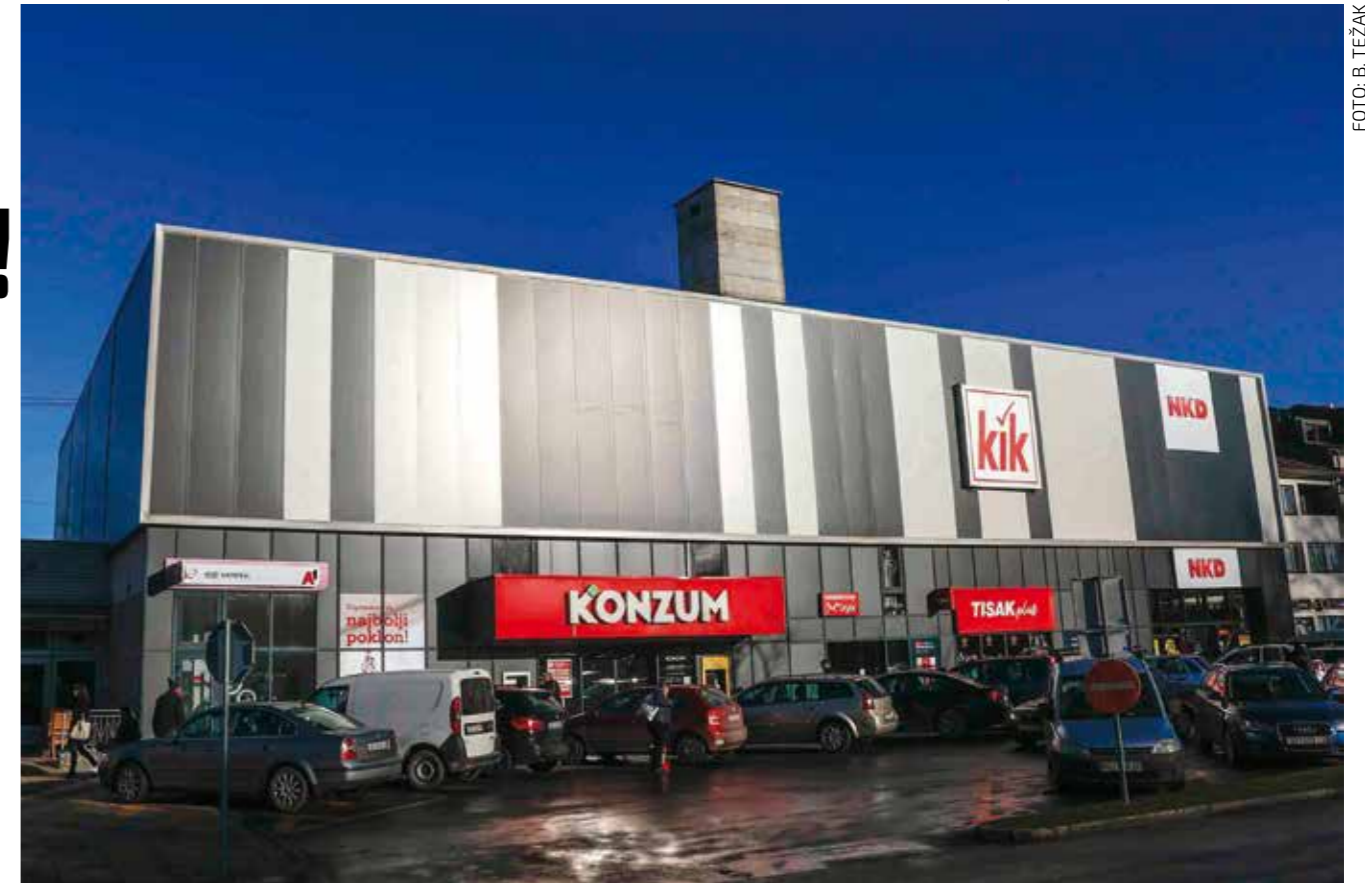
Gradsko knjižnica do kraja godine u novim prostorima na katu robne kuće u centru grada

Na sjednici su gradski vijećnici donijeli i Odluku o izvršavanju proračuna Grada Ivanca za 2026. godinu, Program dodjele bespovratnih potpora Grada Ivanca u turizmu, Odluku o raspodjeli sredstava za financiranje redovitih političkih aktivnosti, usvojili su Analizu stanja sustava civilne zaštite na području grada Ivanca za 2025. i donijeli Plan razvoja sustava CZ za 2026. godinu te nekoliko drugih radnih odluka.(ljr)