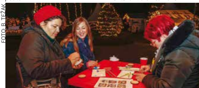
Uz stručnu poduku i malo boje i kista...