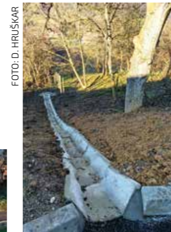
Uređena oborinska odvodnja

Sanacijski radovi stajali su ukupno 339.200 €, od čega je Grad Ivanec financirao 262.700 €, a Hrvatske vode 76.500 €