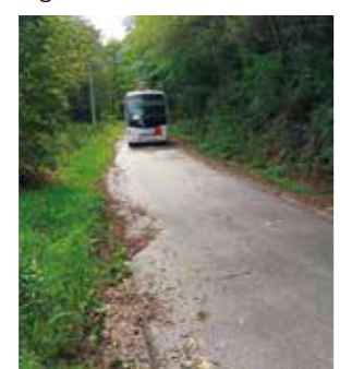
Cesta prije tri godine

vo za školski autobus. Stoga je Grad Ivanec inicirao rekonstrukciju i izrazio spremnost da se novčano uključi u ovaj projekt. Nakon odugovlačenja od strane ŽUC-a, konačno je bilo dogovoreno da će Grad Ivanec