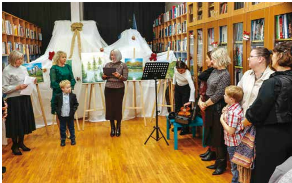
Nakon 9 godina, ponovni povratak umjetnice novim horizontima i svjetovima