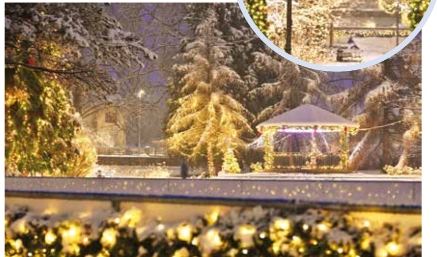
Panorama klizališta i paviljona