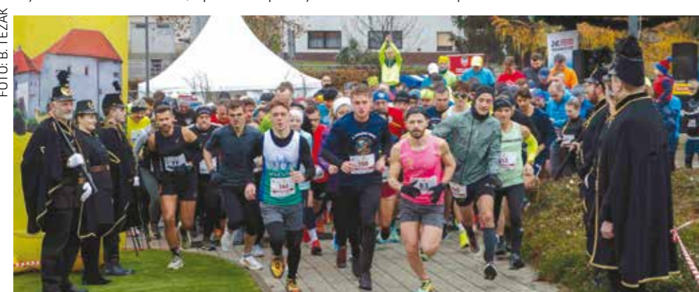
Iz parka je startalo dosad rekordnih 240 trkača

Završnu svečanost s dojelom priznanja uljepšali su članovi Ivanečke rudarske čete. (ljr)