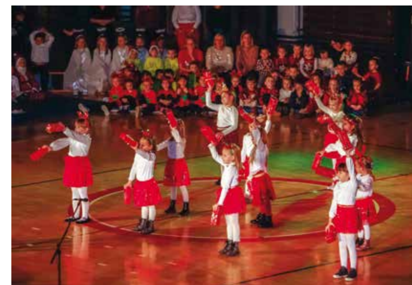
Uvijek izmame suzu na oko...