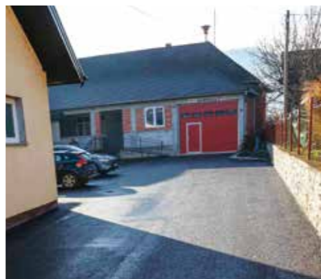
Asfaltiran prilaz vatrogasnom domu

U sklopu radova asfaltirani su prilaz i dvorište DVD-a Margečan