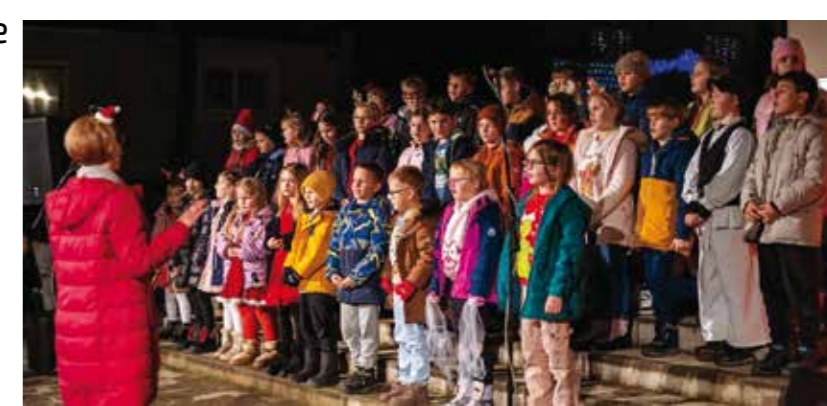
Dječje veselje uz pjesmu i stihove

Nezaboravni adventski ugođaj u Margečanu priredila su djeca sa svojim roditeljima i mnoštvom građana koji su se odazvali pozivu Udruge građana Margareta i došli na blagdansko okupljanje na središnji Trg sv. Margarete. Stigao je i sv. Nikola, kojeg su razdragana djeca dočekala pjesmom i stihovima. Djeci je podi-