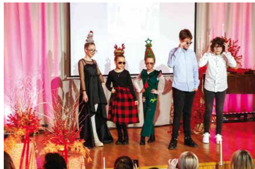
Maštovite frizure i styling za posebne prilike