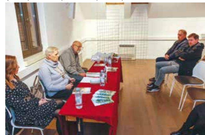
Sa svečanosti predstavljanja pjesničkih zbirki