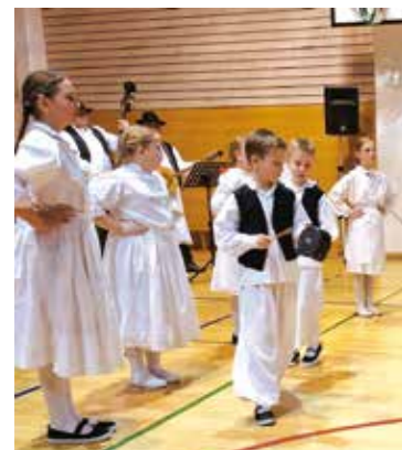
U koreografiji i elementi pučke dječje igre

nosi naslov sedmerostrukog županijskog prvaka u izvornim folkloru, koji je isto toliko puta zastupao boje našega Grada i Županije na državnim smotrama! Folklor su i ovoga puta pratili tamburaši pod vodstvom Jurice Žibeka i predsjednika KUD-a Vje-