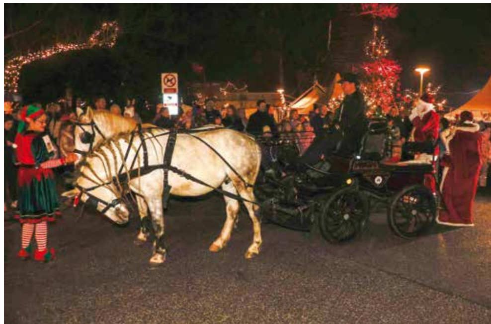
Ravno iz Laponije kočijama do gradskog parka „doletjeli“ su Djed i Baka Mraz