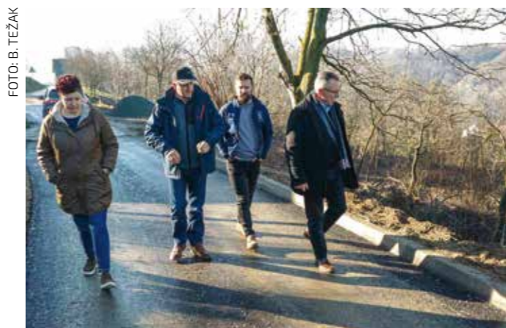
Gradski čelnici u obilasku klizišta s predstavnicima Vijeća MO-a Škriljevec

Sanacijski radovi stajali su ukupno 339.200 €, od čega je Grad Ivanec financirao 262.700 €, a Hrvatske vode 76.500 €