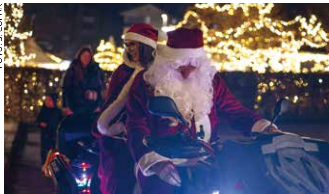
Doviđenja do adventa 2026.!