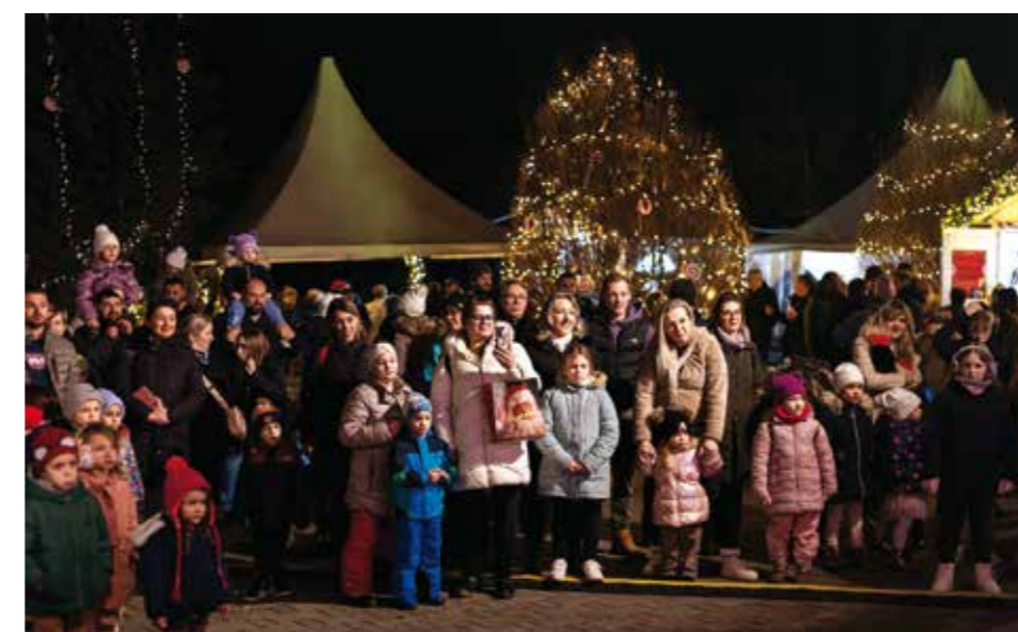
Mnoštvo posjetitelja uživalo na Adventu u Ivancu