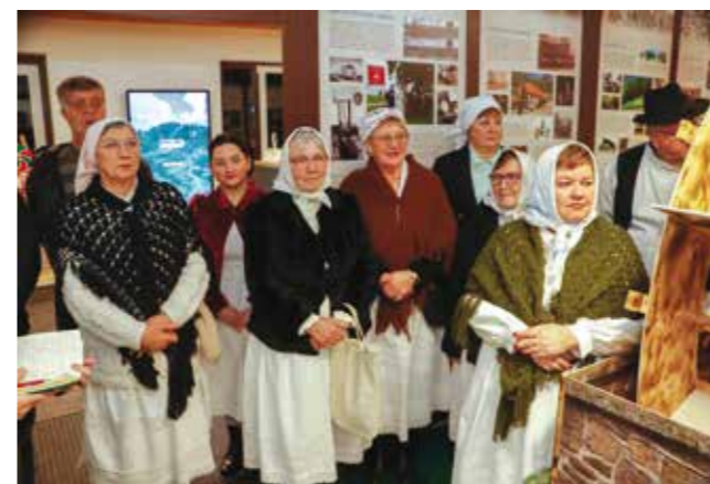
Članice Maske u narodnim nošnjama