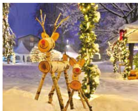
Sobovi – detalj koji grije srce

Ljepotu bijelog Božića u Ivancu, prvi put nakon mnogo godina, dočaravamo vam fotografijama Zorana Stanka, uz napomenu da one prikazuju tek djelić čarobne blagdanske atmosfere u Ivancu 2025. (ljr)