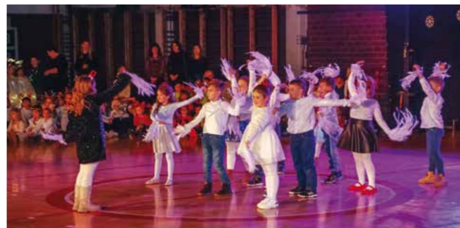
Naše predivne princeze i prinčevi

NAŠI MALIŠANI Božićni program dječjih vrtića oduševio publiku