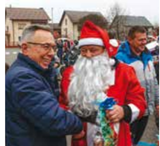
Dobro došli u Ivanec!

Bjelobradi djedovi za ovu su priliku posebno okitili svoje „jurilice“ girlandama, mašnjama, lampicama pa čak i jednim borom (!), što se pokazalo kao odlična kulisa za nezaboravne fotke! Zabava je nastavljena na klizalištu u gradskom parku, gdje su se klincima pridružili i pojedini djedice.(tk)