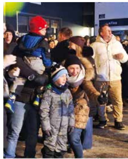
Selfie za sjećanje na doček Nove 2026.