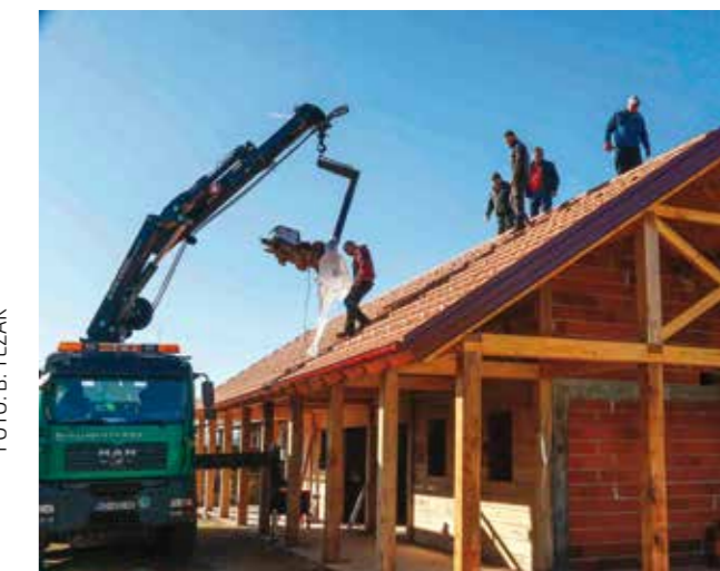
Etno kuća dobiva „kapu“!

te uređenje vanjskog prostora. Opremanje unutrašnjosti izloženim vitrinama i opremom za održavanje lončarskih radionica