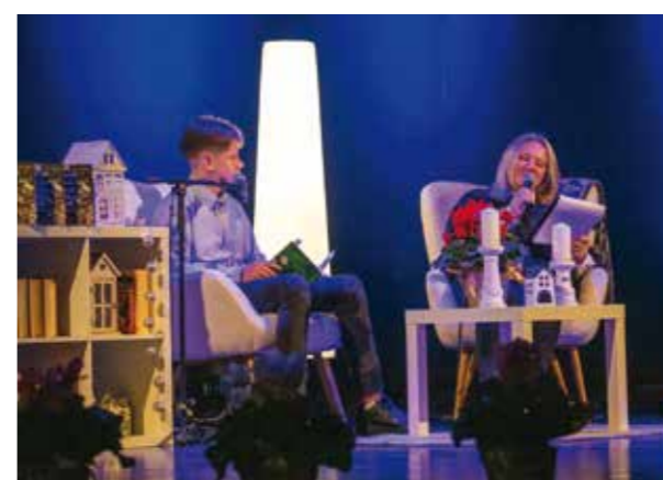
Retrospektiva uz najbolje pjesme s proteklih 45 natječaja