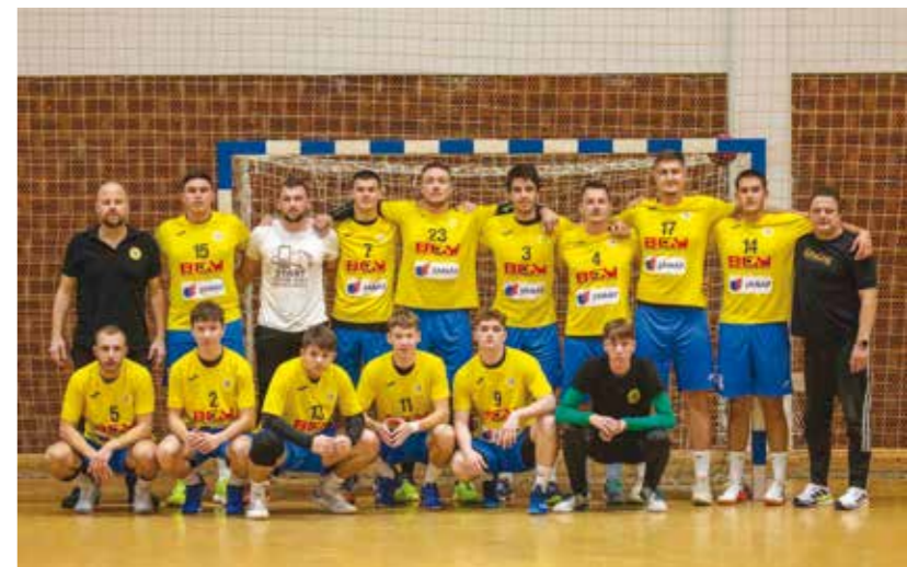
Rukometna momčad Ivančice na kraju jesenskog dijela prvenstva u 2. HRL Sjever