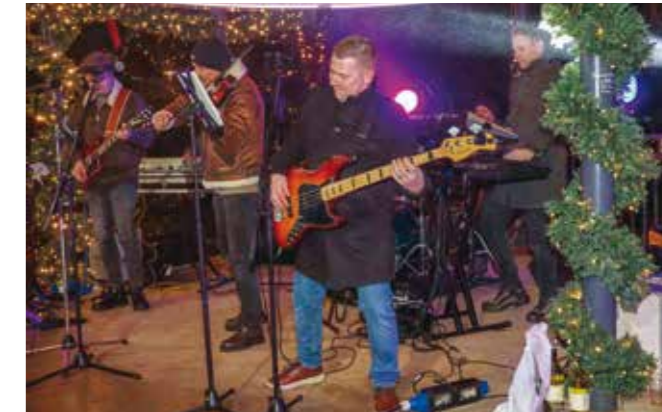
U sjajnom društvu s popularnim Kavalirima