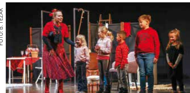
S kazališne predstave „Božić s gospodinom Grinčajgom“

Kako bi čitanje povezali s kazališnim izrazom, POU je u