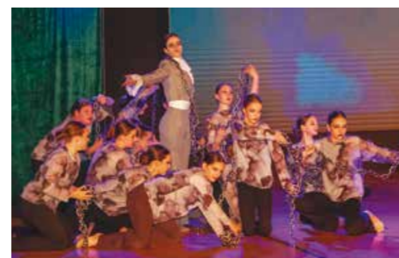
Sklad plesnog pokreta kao vjerna pratnja fabule