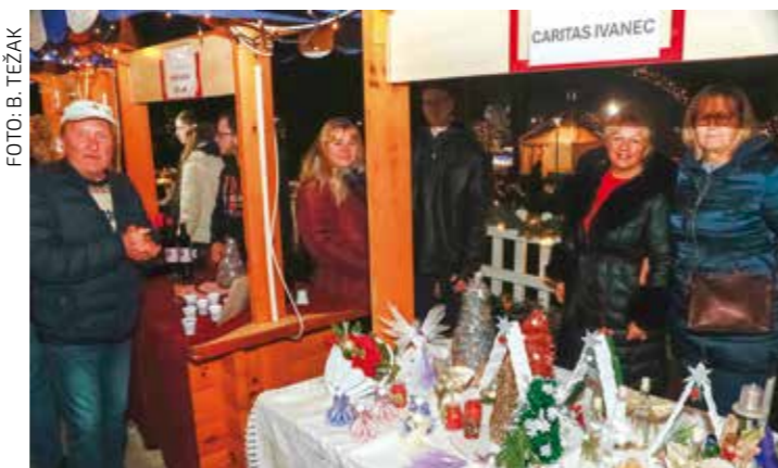
Osmijeh i dobrodošlica! Može li ljepše za Božić?

ga, umjetničkih rukotvorina itd. No, najvažnije od svega ipak je bilo dobro raspoloženje uz štandove, koji su postali mjesto susreta i druženja u onoj posebnoj predbožićnoj atmosferi, a gdje se i kušalo sve i svašta. A svim tim je Sajam pod zvijezdama prerastao u još jednu od lijepih manifestacija kojima je ove sezone obilovao Advent u Ivancu.