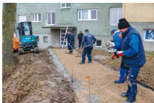
Radovi na stazama, priprema se podloga za tlakavce

Tijekom proteklih mjesec dana izvedeni su svi zemljani radovi, iskopane su staze, navezen je šljunak i priprema se podloga za postavljanje tlakavaca. Počelo je i postavljanje rubnjaka i betonskih ploča pa iako je park još uvijek veliko i raskopano radilište, već se ipak