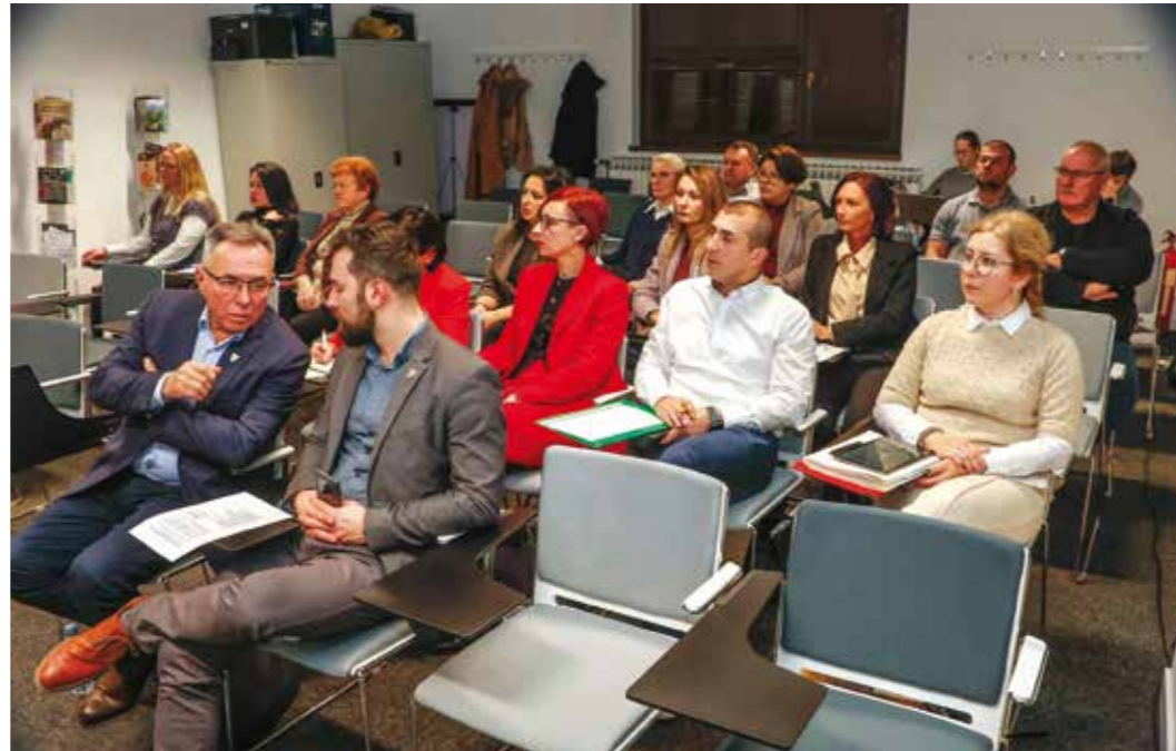
Proračun je donesen većinom glasova vijećnika NPS-a i SDP-a, HDZ i partneri bili su suzdržani

Naglasio je da je, i unatoč tome što Grad Ivanec od 2022./2023. bilježi rast poreznih prihoda od oko 30%, taj rast obezvrjeđen, jer se za isti iznos novca dobiva manje kilometara