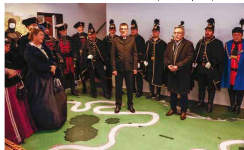
Pozdravne riječi domaćina povijesnim postrojbama

IVANEČKI RUDARSKI DANI Obilježena povijesna ivanečka rudarska tradicija