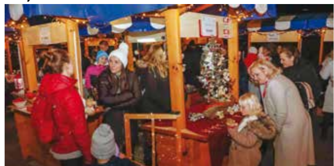
I štand vrtića Bambi u blagdanskom sjaju!

ŠKRILJEVEC Završeni radovi na sanaciji klizišta iz programa Grada Ivanca za 2025.