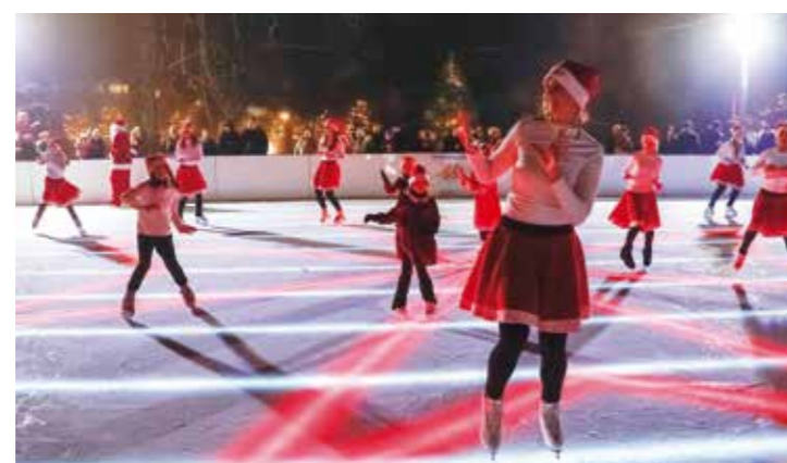
Ledena atrakcija: Ljupke mrzazice na ivanečkom klizalištu