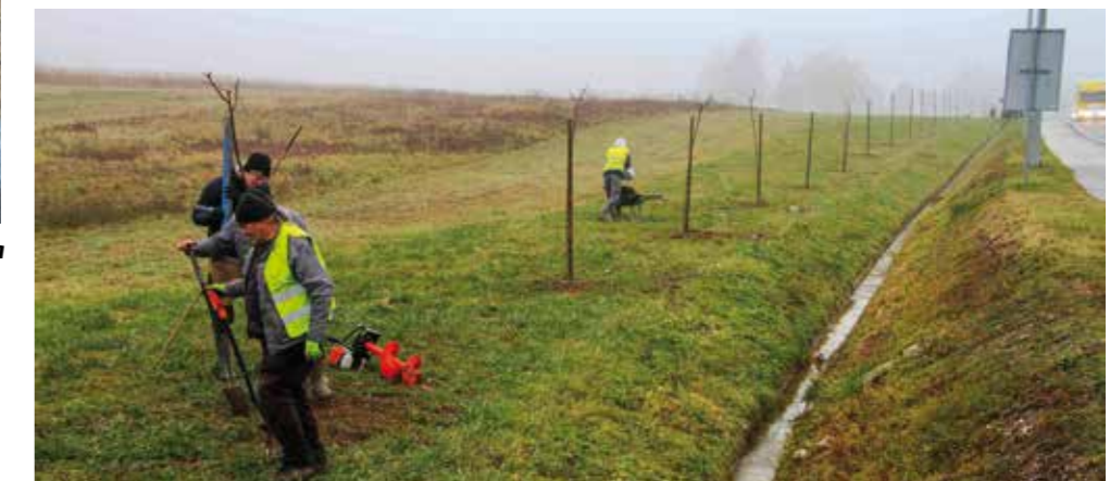
Nastavak opsežnih radova slijedi ove godine, kada je na redu rekonstrukcija drugih parkovnih površina i drvodreda te sadnja novih.

nerazvrstane ceste u Malezovoj ul., kod ugostiteljskog objekta Lipi. Uređeno je i asfaltirano oko 400 m 2 prostora. Radove na javnim površinama financirao je Grad, dok je troškove na dijelu u privatnom vlasništvu pokrio vlasnik sam.