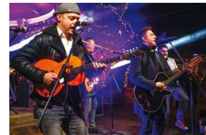
Mejaši su oduševili brojnu publiku