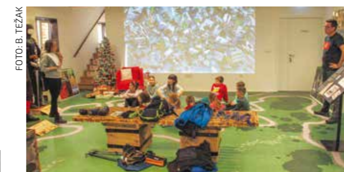
Djeca na adventskoj planinarskoj radionici