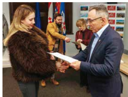
Čestitka i puno uspjeha na faksu!

-Želio bih se sastati s vama i od vas čuti ocjene i mišljenja o tome ide li razvitak Ivanca u pravome smjeru. Volio bih doznati i vaša vlastita razmišljanja i sugestije o tome što bi još