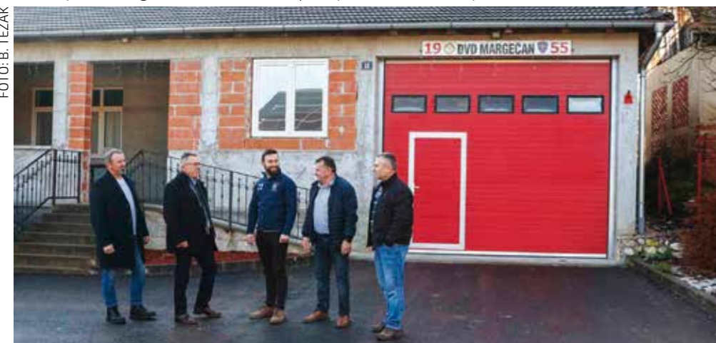
Novoasfaltirano dvorište DVD-a Margečan

Konkretnu potporu pružili su i sami vatrogasci, koji su izveli pripremu za asfaltiranje (navoz kamenog materijala). Kad se zbroje svi radovi u 2025. bilanca pokazuje da je u modernizaciju cesta iz gradskog proračuna lani uloženo visokih 800.000 € (lir)