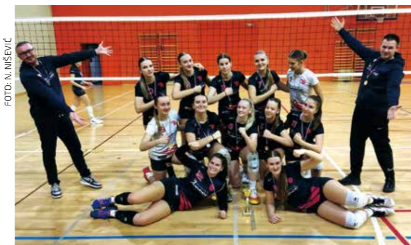
Slavlje ivanečkih odbojkaških juniorki

U utakmici 10. kola ŽOK-ice su u dvorani OŠ Ivanec pobijedile Kelteks 2 s 3:0 u setovima. U prethodno odigranoj utakmici u Zagrebu, ivanečke odbojkašice poražene su od HAOK Mladost 3 s 0:3. Nastavak prvenstva slijedi 24. siječnja, kada je ŽOK Ivanec domaćin ekipi HAOK Zagreb.(nn)