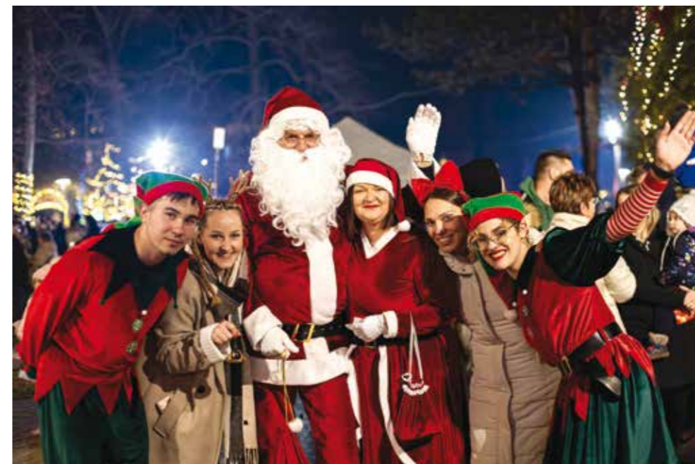
Stigli su Djed i Baka Mraz s vilenjacima!