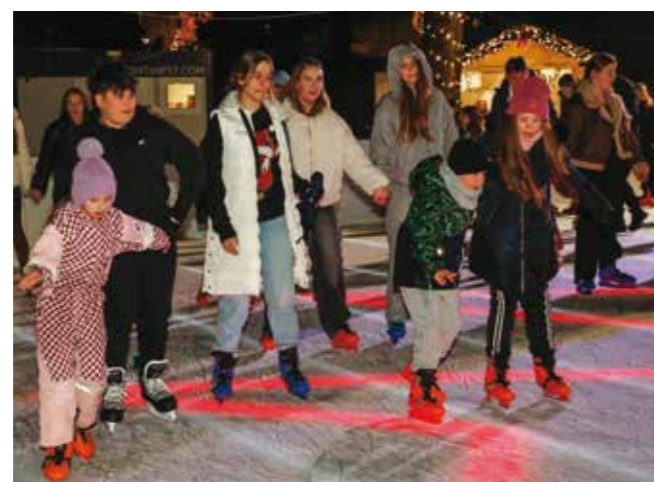
Nova sezona klizanja je otvorena!

A za raznolik program i ovoga su se puta pobrinuli Grad Ivaneč i Turistička zajednica te zajedno s udrugama, ustanovama i gostima svojim građanima pružili nezaboravnu blagdansku čaroliju adventskih i božićnih dana.