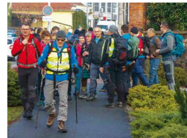
Polazak na planinarski pohod

obilaska, uz planinarski grah, ujedno svim sudionicima uručeno je u Prigorcu, gdje su su spomen priznanja.(nn)