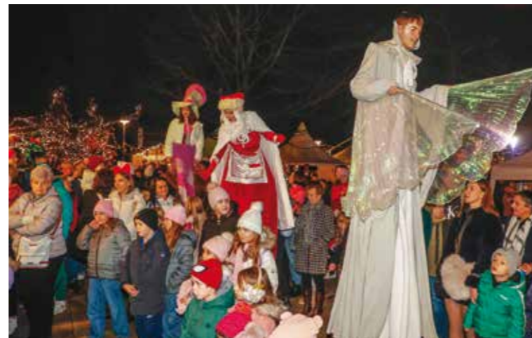
Veselo s maskotama Kazališta Tvornica lutaka iz Zagreba