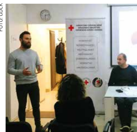
M. Friščić: Grad je pronašao potencijalnu lokaciju za skladišne prostore