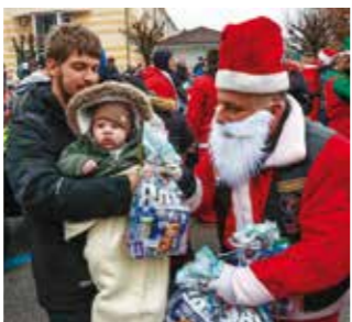
Djedovi darivali klince s 350 poklon paketa