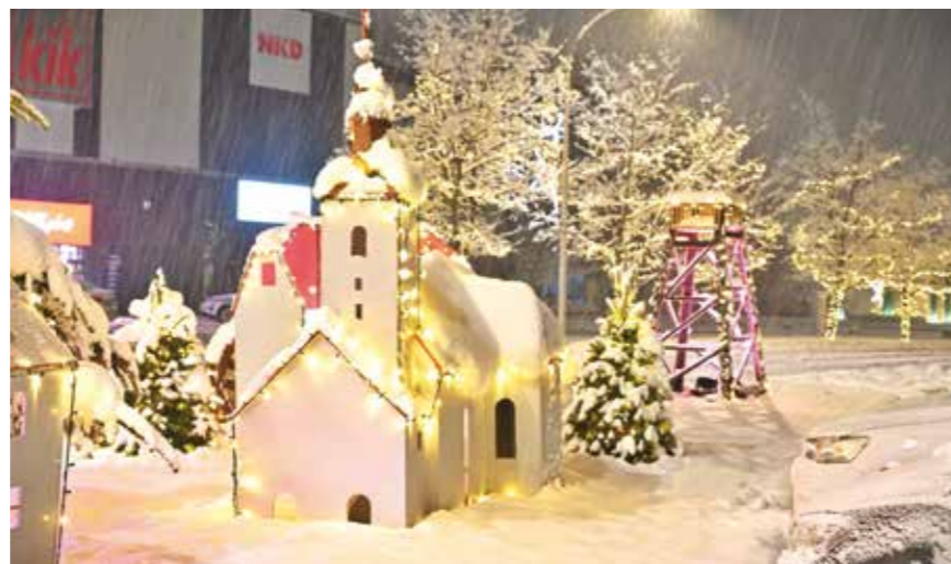
Ivanec u malom na gradskoj špici