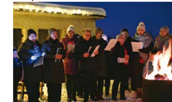
Program je pjesmom uljepšao mjesni crkveni zbor