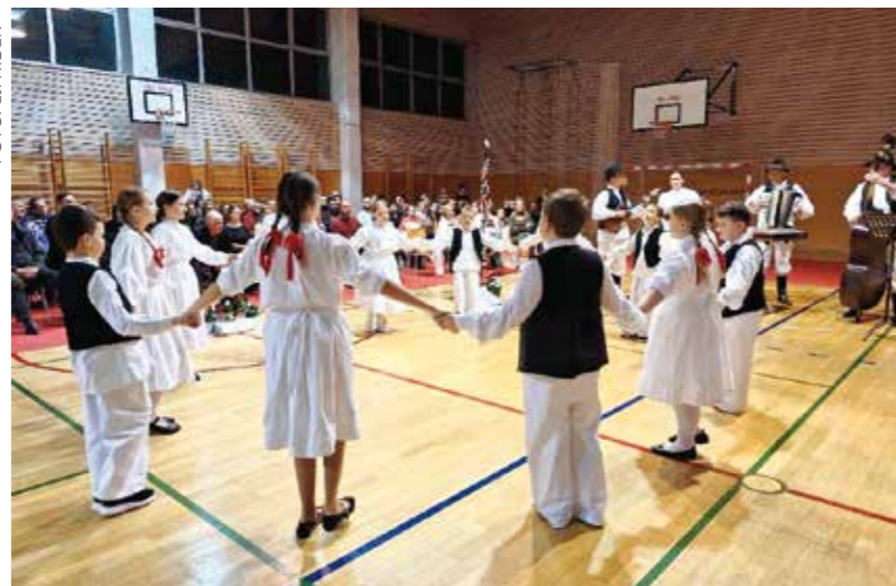
Zalog za budućnost – dječji folklorni sastav KUD-a Salinovec

Batinić: Veseli me što vidim da KUD okuplja i djecu i mlade