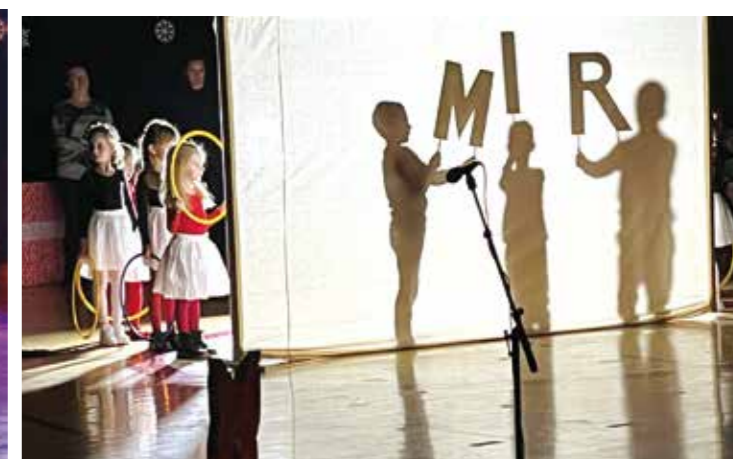
Zanimljiva igra sjena vrtićkih mališana iz Radovana