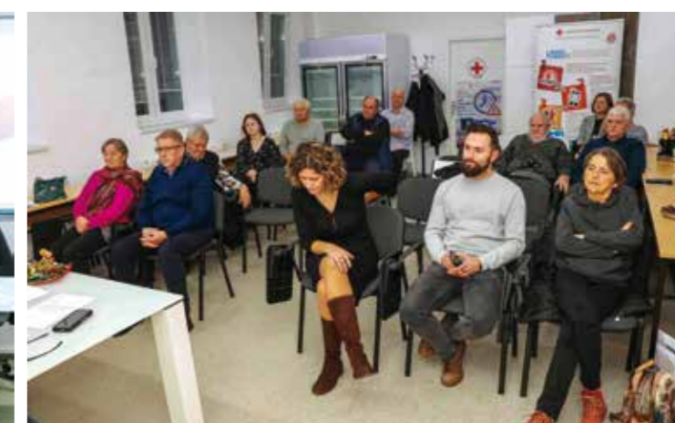
Na skupštini prihvaćen program rada za 2026. vrijedan gotovo 347.000 €

Potencijalna lokacija za skladište pronađena je u Hrgovoj i Kolodvorskoj ulici