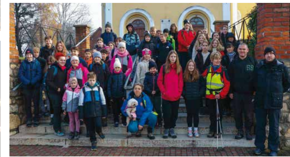
Obilasku su se pridružili i mladi planinari iz Osnovne škole Ivanec

obilaska, uz planinarski grah, ujedno svim sudionicima uručeno je u Prigorcu, gdje su su spomen priznanja.(nn)