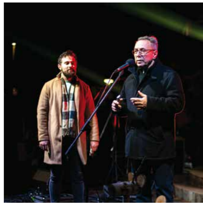
Rasvjetu u cijelome parku i na klizalištu uključili su gradski čelnici