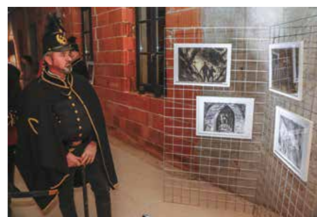
U razgledavanju slika i rudarskih eksponata