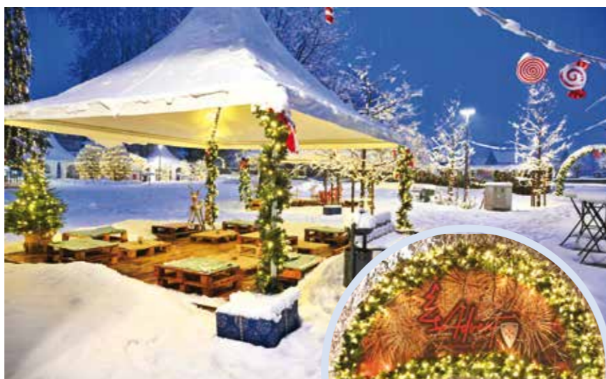
Zimska razglednica Adventa u Ivancu