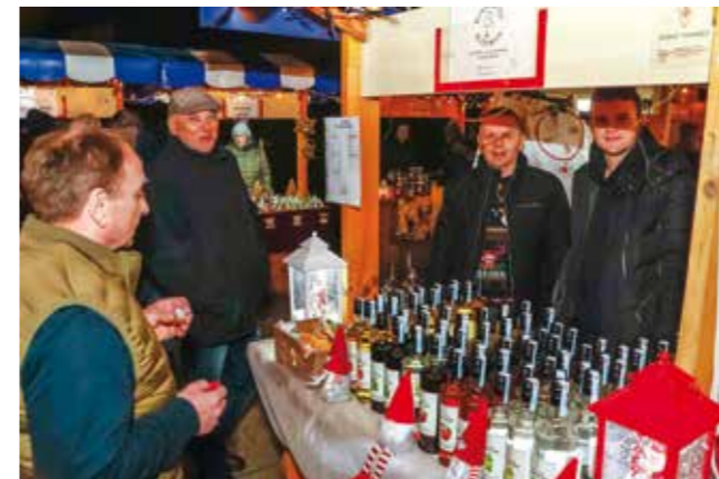
Pravo bogatstvo „žestica“ na štandu Destilerije Kelemen iz Salinovca

Najvažnije od svega ipak je bilo dobro raspoloženje uz štandove, koji su postali mjesto susreta i druženja u onoj posebnoj predbožićnoj atmosferi, a gdje se i kušalo sve i svašta