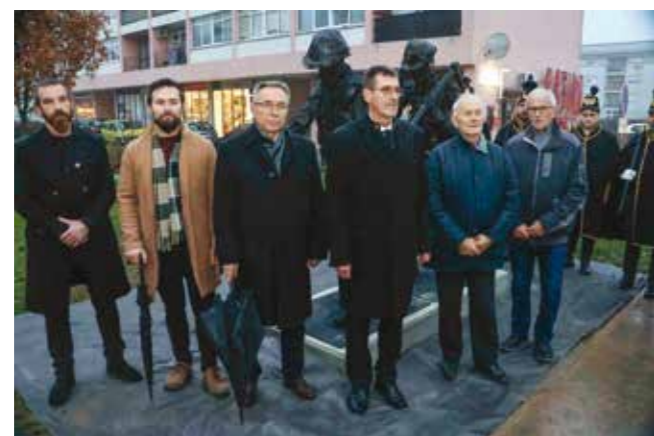
Batinić: Na Rudniku je izrasla kompletna ivanečka prerađivačka industrija

je da je „šofta“ (Rudnik) nekad bio nositelj gospodarskog razvitka Ivanca i cijele županije. Kao takav, generirao je i razvitak kulturnog amaterizma, umjetnosti, fotografije, sporta itd.