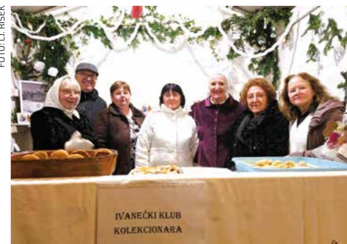
Članovi IKK na otvaranju Adventa u Ivancu

Izloženi su prekrasni primjerci starinskih ukrasa iz privatnih kolekcionarskih zbirki - štalice, nekadašnje kuglice za bor, biblijski likovi izrađenih od komušina, plodova jeseni i drugih prirodnih materijala, štalice, tradicijski božićni nakit (licitarska srca, cvijeće od krep papira) i razni drugi ukrasi iz starinskih kutija naših baka, koji su pobudili nostalgiju sjećanje na nekadašnje tople obiteljske Božiče.(ljr)