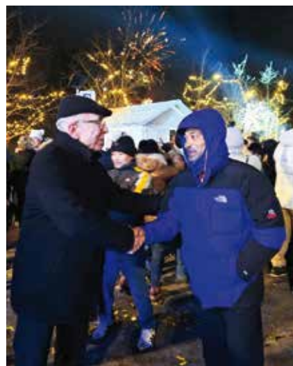
Lijepo: Čestitka stranog radnika