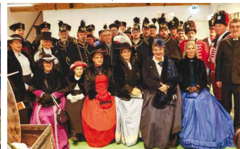
U društvu sa članovima postrojbi iz triju županija