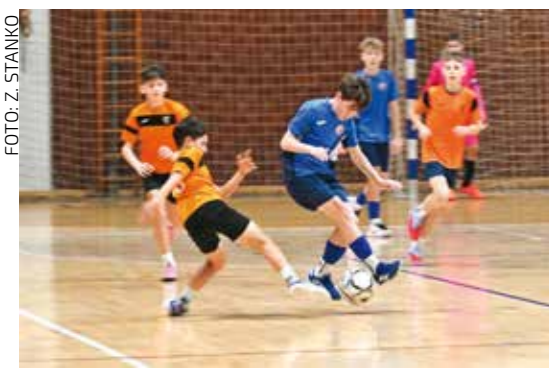
U žaru igre