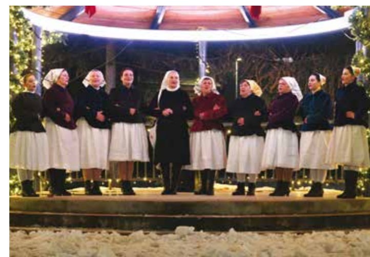
Pjesmom dočarale toplinu nekadašnjih pučkih Božića

u park su donijele dio bogate božićne glazbene baštine i tradicije ivanečkoga kraja i bednjanske doline. Okupljena publika svaku je izvedbu nagradila pljeskom, a nastupom KUD-a Salinovec ujedno je na najljepši način kraju priveden