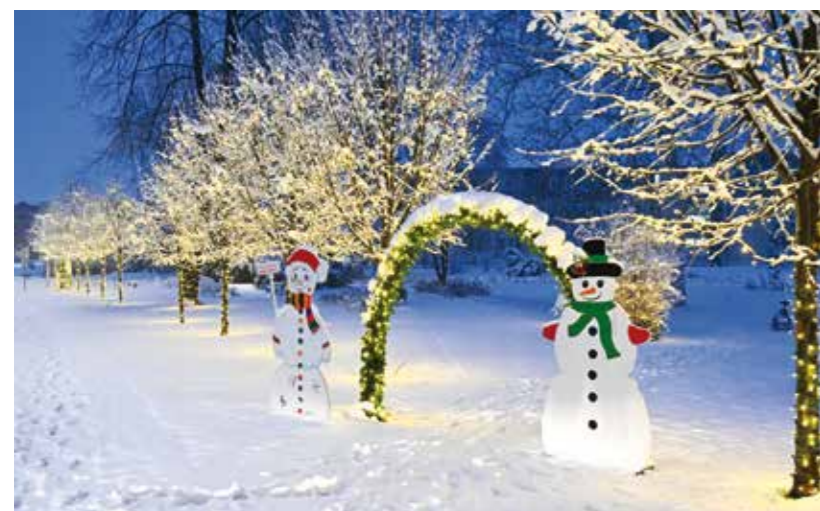
Motiv iz gradskog parka

U DOBA DOŠAŠĆA Adventski vijenac ispred župne crkve Ivanec