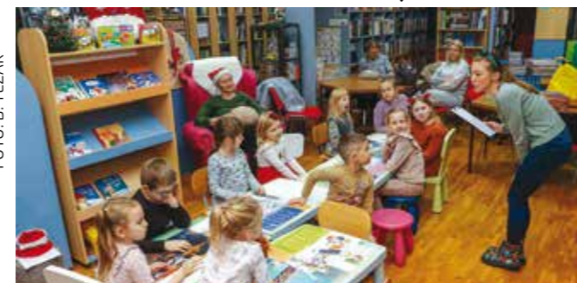
Pričaonica za mališane u Gradskoj knjižnici Ivanec

ZA MALIŠANE Gradska knjižnica i Pučko otvoreno učilište „Đuro Arnold“