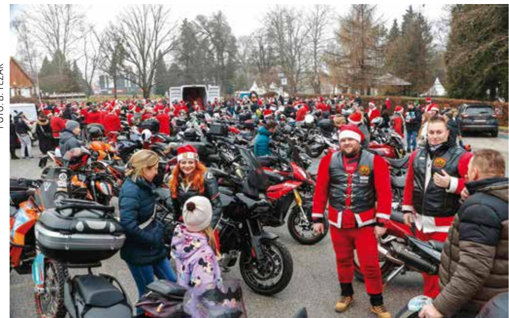
Nikad više mrazova i mrazica u Ivancu!