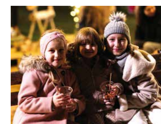
Baš je cool!