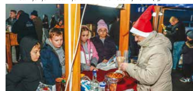
Fritule su i ovoga puta bile hit salinovečkog Adventa

otvorenom, gdje su članice KUD-a Salinovec pripremile slatke božićne delicije, a najbrže su „planule“ fritule i palačinke. Skrajski pajdaši skuhalo su vino, a u podnođu je bio i džin. Članovi DSR-a i DVD-a Salinovec osigurali su hrenovke i kobasice pa je blagdansko raspoloženje potrajalo do večernjih sati. (aj)