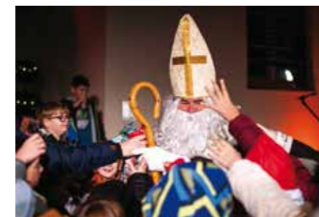
Stigao je sv. Nikola!