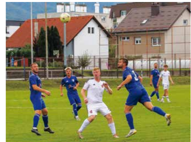
Zadovoljavajući plasman na kraju jesenskog dijela prvenstva