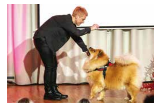
Chau-chau- na pistu ravno iz beauty salona za kućne ljubimce