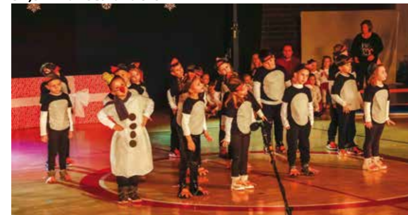
Došli su i „pingvini“!