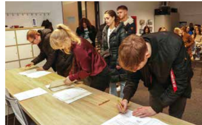
Potpisivanju ugovora odazvala se većina stipendista

U kratkim crtama informirao ih je i o nekim zanimljivim projektima koji će se realizirati u 2026. te zbog visokih cijena i inflacije posebno naglasio da gradsko vodstvo razmatra op-