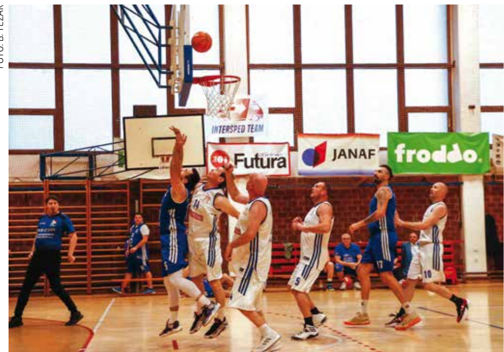
Košarkaški veterani ponovno na okupu

KOŠARKAŠKI KLUB IVANČICA Memorijalnim turnirom veterana obilježili kraj godine