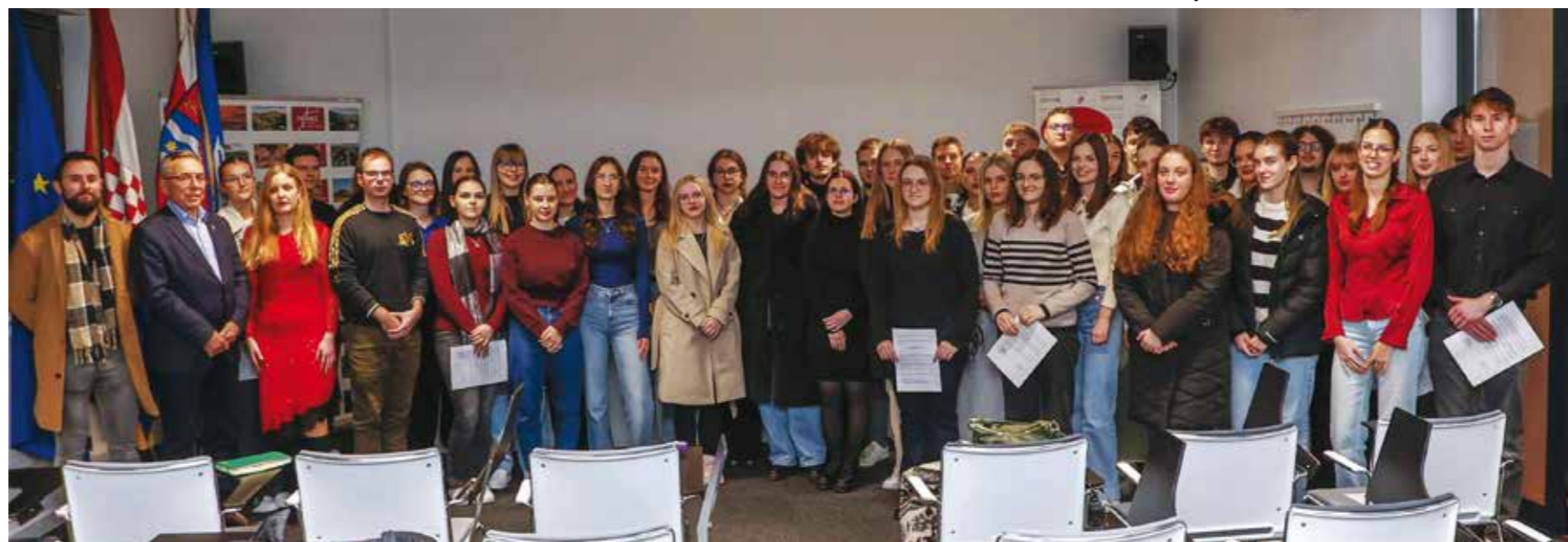
Gradski stipendisti u ak. godini 2025./2026.

Studentima se obratio i gradonačelnik Milorad Batinić. Izrazio je želju organiziranog povezivanja Grada sa studentskom populacijom.