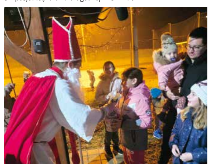
Dar iz ruku sv. Nikole za svako je dijete poseban

Poseban doprinos blagdanskom ugođaju dale su vrijedne mještanke koje su pripremile razne domaće slastice pa su se svi posjetitelji družili u ugodnoj atmosferi, uz kuhano domaće vino i čaj.