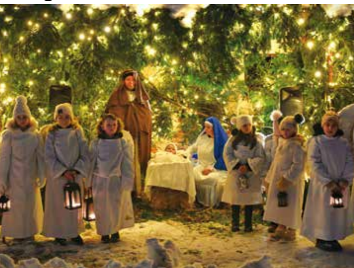
Sveta obitelj i zbor anđela

♦♦ MO i Udruga građana Prigorec brojnim su mještanima i posjetiteljima najljepšu biblijsku priču o rođenju Mladoga kralja jubilarni deseti put ispričali 28. prosinca