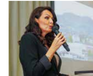
Ravnateljica škole L. Kozina