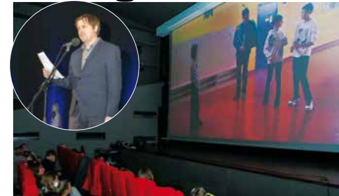
Projekcija filma „Povratak Sakcinskog“ u povodu jubileja škole