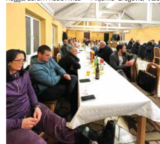
Glavna zadaća u 2025. - stabilizacija rada udruge

Polazak na pohod s prve točke u centru Ivanca