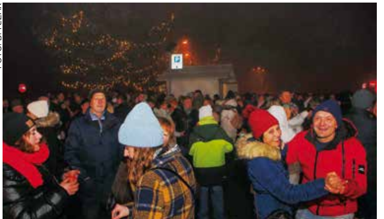
Svima zdravlja, uspjeha i sreće!

Odlična atmosfera na zajedničkom dočeku Nove godine na gradskoj špici Ivanec!