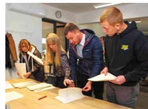
Grad stipendira 60 studenata

Zaostaci stipendija za razdoblje listopad-prosinac studentima su isplaćeni krajem 2024. godine, što ih je posebno razveselilo i „podebljalo“ im novogodišnji budžet. (lir)