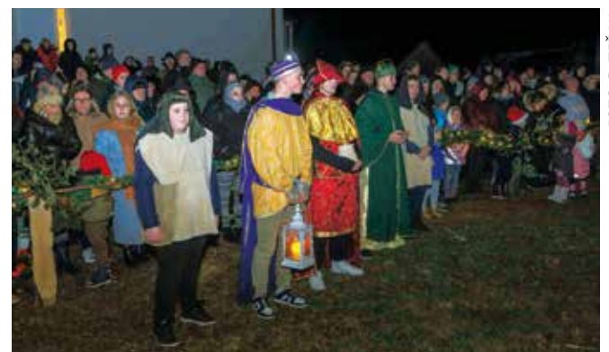
Tri mudraca s istoka u pohodu novorođenome Kralju

Prikaz živih jaslica održan je uz već tradicionalnu novčanu potporu Grada Ivanca.(tk) „Još mali, u štali, kog stvorenje svako slavi...“