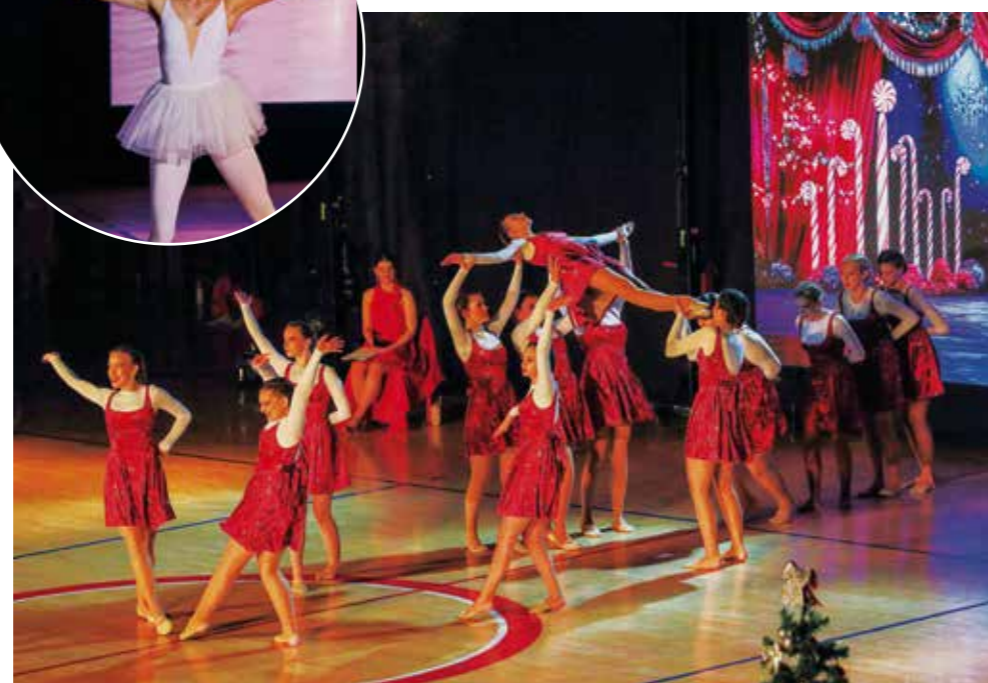
Svaka izvedba bila je mali plesni spektakl