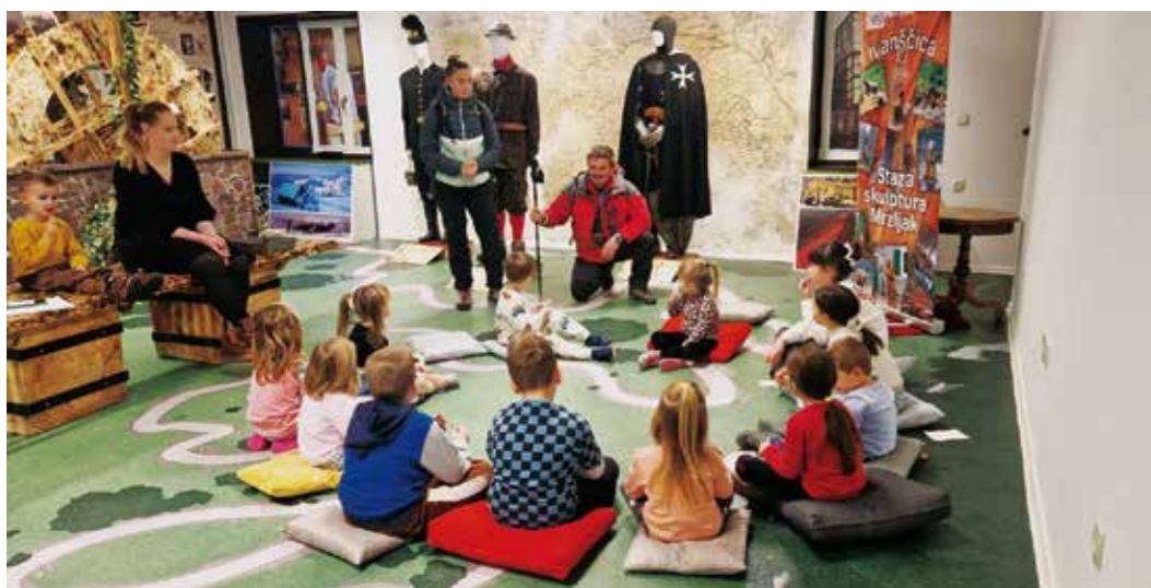
Adventska radionica za male planinare u Centru Kukuljević