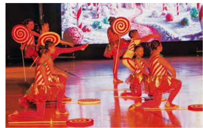
Zimska bajka ivanečkih plesačica

DRAGA DOMAČA RIEČ Završna priredba 44. kajkavskog književnog natječaja