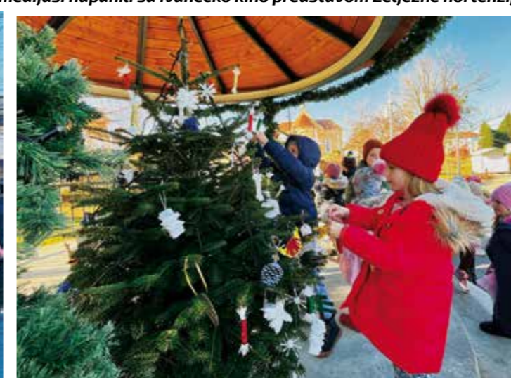
Vrtički klinci u parku su okitili borove