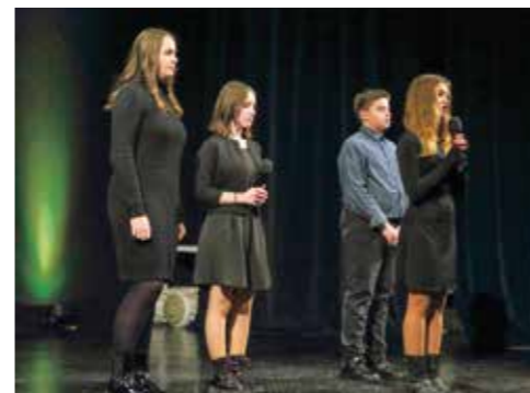
Učenički program u povodu Dana škole