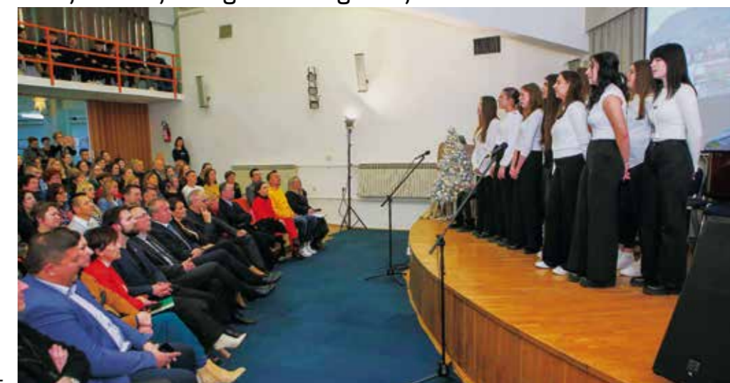
Na svečanosti u povodu Dana Srednje škole Ivanec