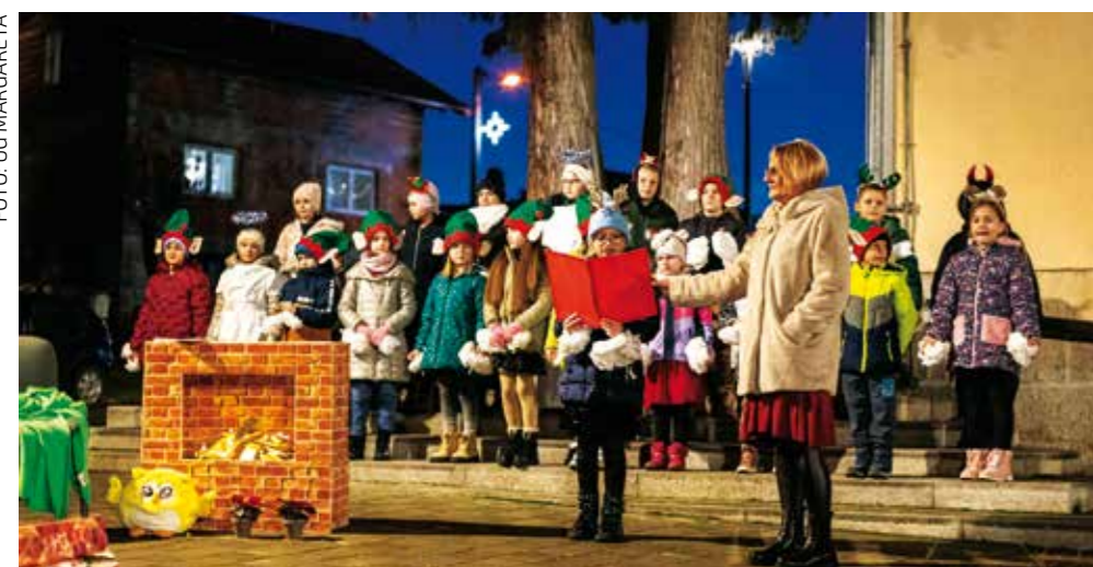
Djeca su najdražeg sveca dočekala pjesmom

Za tu su priliku članovi UG Margareta prekrasno okitili svoj središnji trg, koji se pokazao sjajnim za nezaboravno adventsko druženje. Članice Margarete sve su posjetitelje ponudile raznim slasticama pa su se tako građani svih generacija ugodno družili uz čaj i kuhano vino te timena najljepši način krenuli u susret Božiću. (aj)