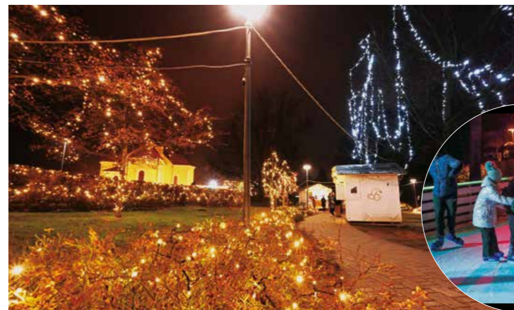
Ovako nam ove godine sja naš prekrasni gradski park

pohvale svih posjetitelja, a s kojeg su u svijet i na društvene mreže otišle tisuće fotografija i selfija.