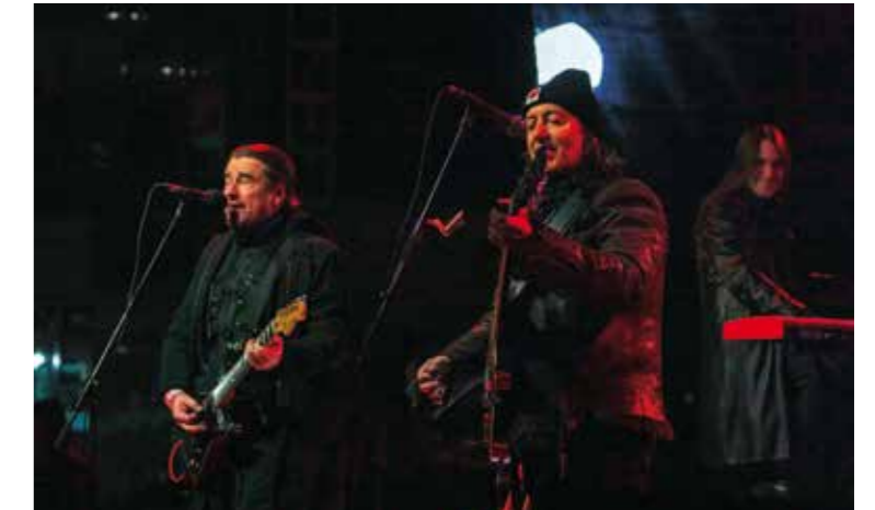
Kulturne Divlje jagode na gradskoj špići!