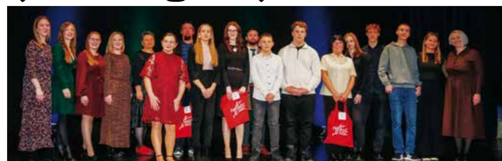
Pobjednici natječaja Draga domača rieč