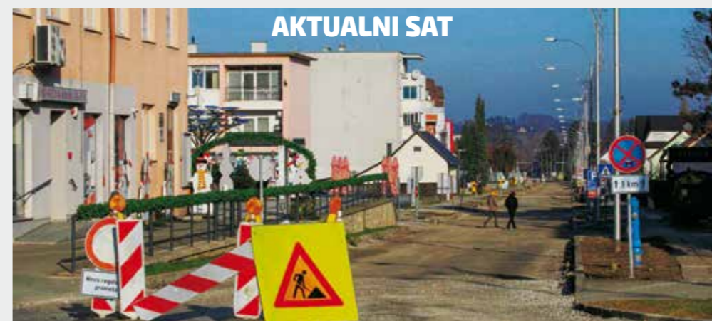
Grad spreman podmiriti troškove asfaltiranja Nazorovu i Jezerskog puta

Osvrćući se i na točke vezane uz sustav civilne zaštite, Friščić je, kao aktualni načelnik Stožera CZ Grada Ivanca, uputio zahvale svim vatrogascima, Crvenom križu, HGSS-u, HMP-u, volonterima i drugima u sustavu CZ te im zahvalio na velikom trudu koji ulažu u prevenciju te u rad na zaštiti i spašavanju ljudi i materijalnih dobara u raznim ugrozama i nedaćama. (ljr)