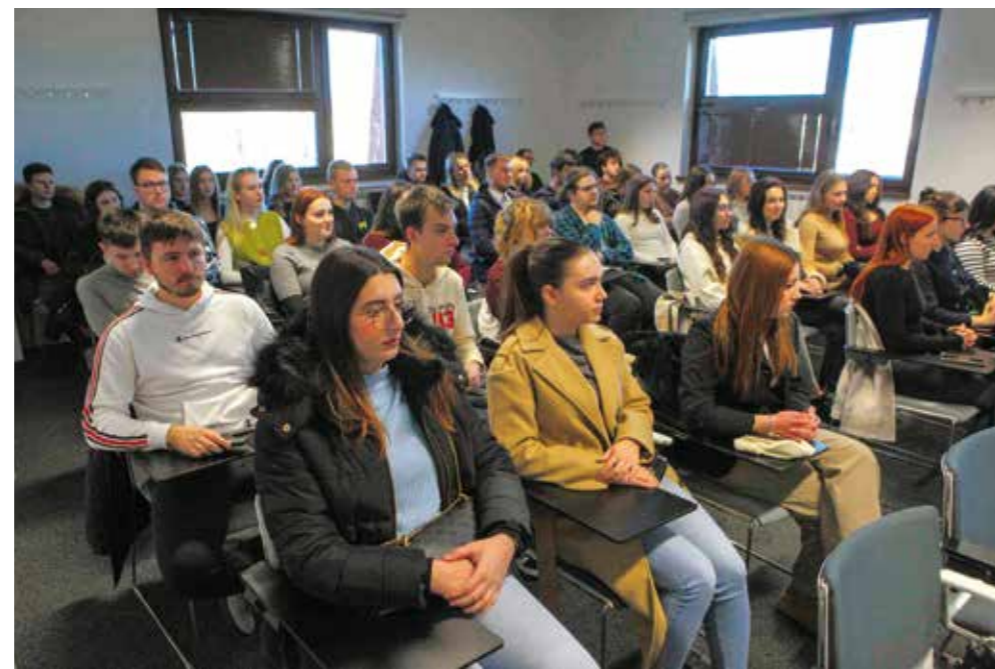
Stipendisti Grada Ivanca u ak. godini 2024./23025.