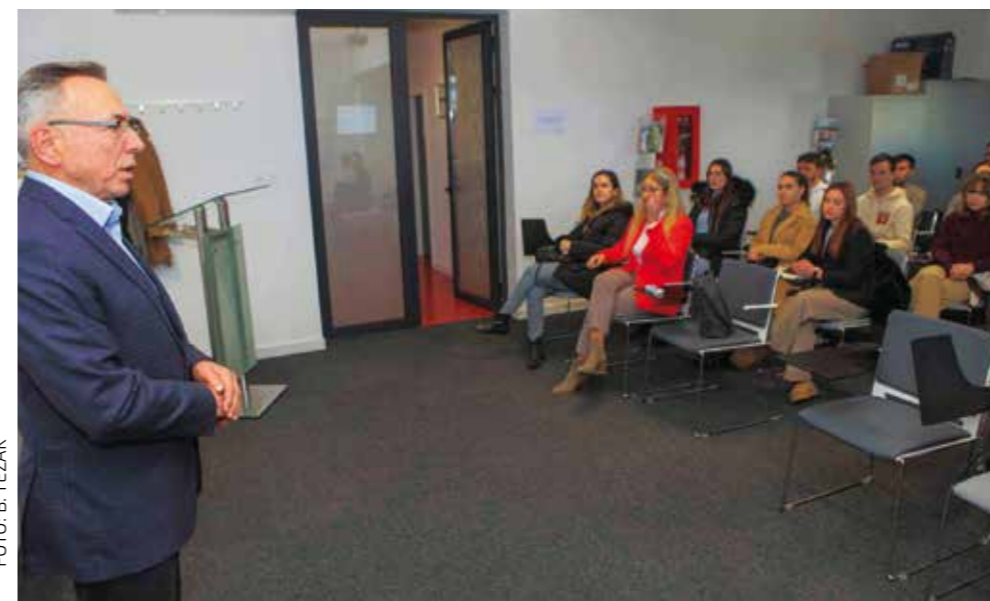
„Troškovi života su veliki, razmišljamo o povećanju broja i iznosa stipendija“