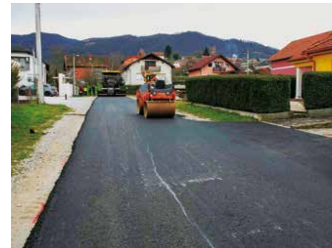
Asfaltirana je Ulica Josipa Kraša

nečkoj Željeznici te izvedena priprema za asfaltiranje u Osečkoj. Ovisno o vremenu, slijede i radovi u Mjesnim odborima Prigorec, Gečkovec, Lovrečan i Ribić Breg kao i na strmim dionicama u Bedencu i Vitešincu, kao i asfaltiranje Fallerove ulice, koja se usklađuje s radovima na Aglomeraciji.