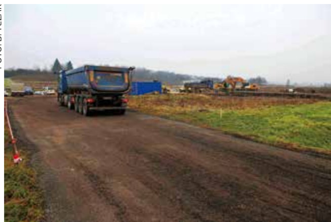
Radovi teku brzo, otvaranje u planu već sredinom ove godine

Na istočnom ulazu u Ivanec započela je gradnja velikog maloprodajnog parka STOP SHOP Ivanec, koji će se prostirati na gotovo 8.000 m 2 prodajne površine. Investitor ovog ulaganja, vrijednog više od 6 mil. €, je STOP SHOP Development d.o.o. Ovo društvo dio je međunarodne grupacije CPI Property Group, koja je preko svojih povezanih društava već prisutna kao investitor u Hrvatskoj, gdje je započela s investicijama na više lokacija.