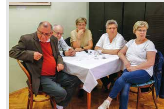
Često pitanje: Mogu li domaćice koje nemaju primanja ili su im primanja manja od 540 € ostvariti ovu potporu? Odgovor je - da

Ukupna vrijednost radova iznosi 213.500 eura, a izvodi ih Niskogradnja Hudek iz Majeraja. Naglašavamo da su izvedeni radovi dio Programa modernizacije nerazvrstanih cesta na području grada Ivanca za razdoblje 2023.-2027. godine, odnosno, da nisu dio projekta Aglomeracije.