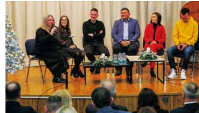
Panel s bivšim učenicima, danas priznatim stručnjacima

OBLJETNICA U povodu 185. obljetnice osnovnog školstva u Ivancu