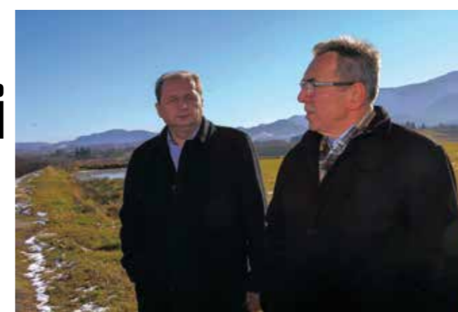
Grad i Ivkom d.d.: Uspješno se oduprli pritiscima i sudski dokazali da varaždinsko smeće ne može u Jerovec

Rezultat takvih pritisaka bili su i posjeti državnog inspektora – PU Varaždin, koji je Ivkomu i njegovu direktoru zbog odbijanja varaždinskog smeća „odrezao“ drakonsku kaznu od 125.000 kuna te nagovijestio da