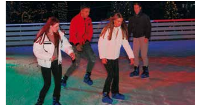
Sjajna rekreacija i zimski izlazak za mlade