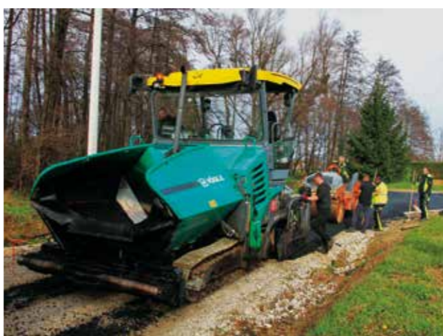
Polaganje asfalta u Kalničkoj ulici

Grad Ivanec nastavlja s asfaltiranjem nerazvrstanih cesta iz Programa modernizacije za 2024., koje je počelo krajem studenog. Dosad su asfaltirane Kalnička i Kraševa ulica, asfalt je položen i na oko 500 metara ceste u Lančiću te na dionicu u Salinovcu, na predjelu Šatornjaka. Asfaltirana je i strma dionica u Iva-