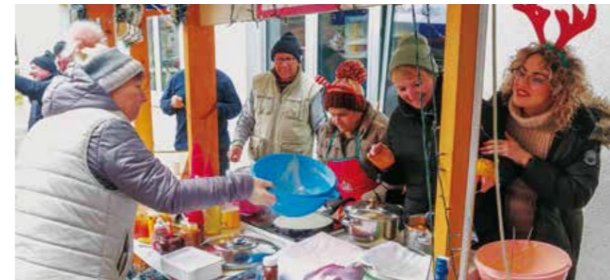
Prvi advent u Salinovcu sjajno je uspio!

Potrudili su se i ugostitelji te posjetiteljima Advent uljepšali blagdanskom ponudom. Ne želeći da posjetitelji zebu, Grad je pokraj klizališta postavio veliku pagodu s plinskim grijačima i koktel stolovima, koja se pokazala sjajnom za adventska druženja u ugodnoj atmosferi! (Ijr)