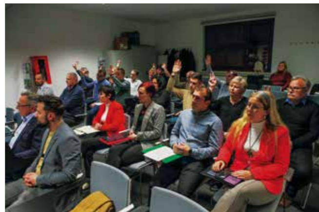
Većina vijećnika – protiv pripajanja Ivkom voda i ivanečkih vodovoda Varkomu

Također, budući da je odluka Gradskog vijeća obvezatna za gradonačelnika, aktualni gradonačelnik Milorad Batinić (koji u Skupštini Ivkom voda zastupa Grad Ivanec kao njihova većinskog vlasnika i čiji je glas odlučujući s 58,57% vlasničkogvlasničkog udjela), na sjednici Skupštine