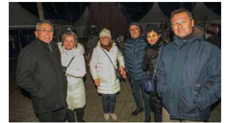
U dobrom raspoloženju s posjetiteljima Adventa u Ivancu