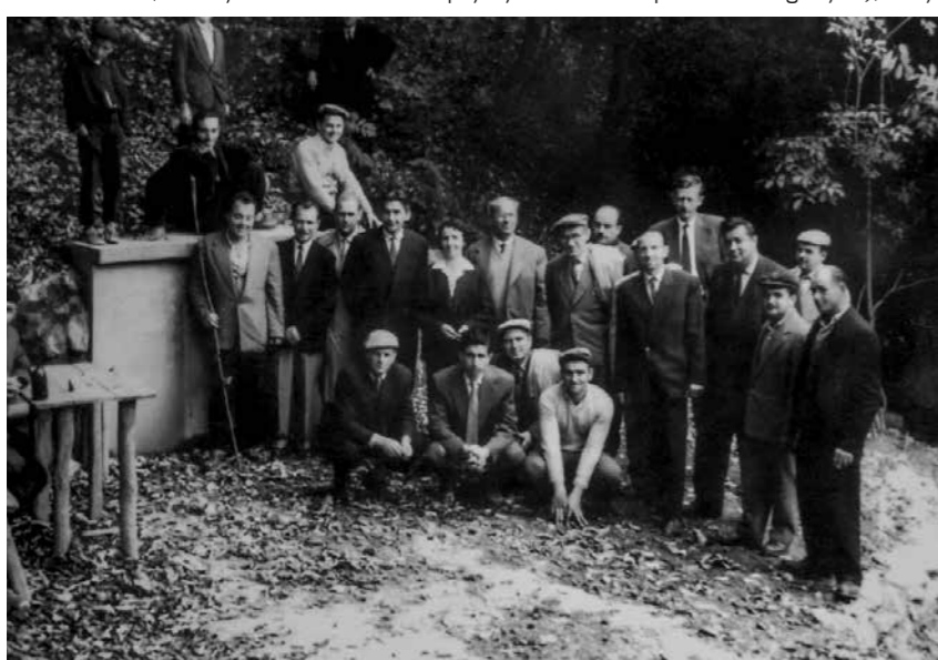
Ne damo naše vodovode, sami smo ih gradili! Otvaranje vodovoda Vuglovec-Gečkovec-Kaniža 1958.-1959. godine

Ivanec i njegovi građani sada čekaju hoće li im s prvim danima novoga ljeta uslijediti još jedna gorka novogodišnja čestitka Vlade RH.(Ijr)