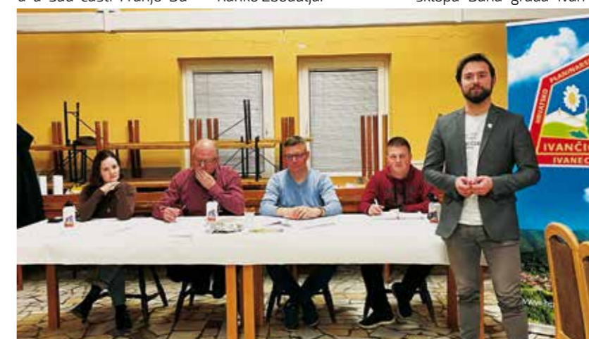
Čestitke M. Friščića na 126 godina neprekidnog rada HPD-a Ivančica

PLANINARSKI KLUB IVANEC 12. pohod Tragom Ivanečke planinarske obilaznice