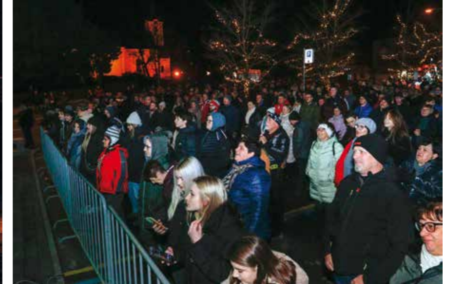
Energija i emocija na odlično posjećenom koncertu Divljih jagoda

ADVENT Grad Ivanec u suradnji s ustanovama i udrugama priredio bogate programe u kojima su tijekom cijelog prosinca uživale sve generacije