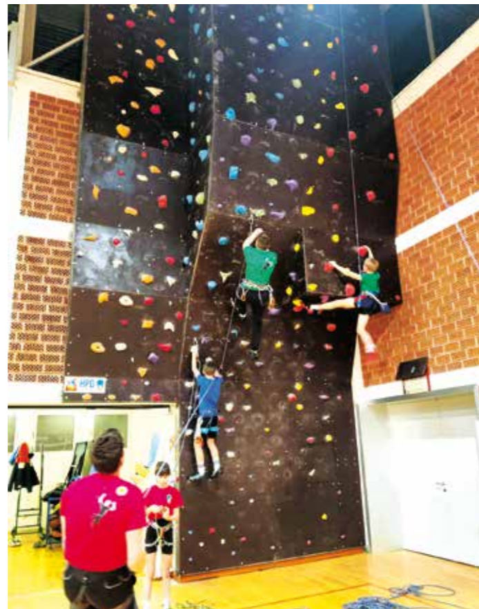
Maraton HPD-a Ivančica na penjačkoj stijeni u OŠ Ivanec

U parku je rock večer priredio band Southern Crowd (Damir