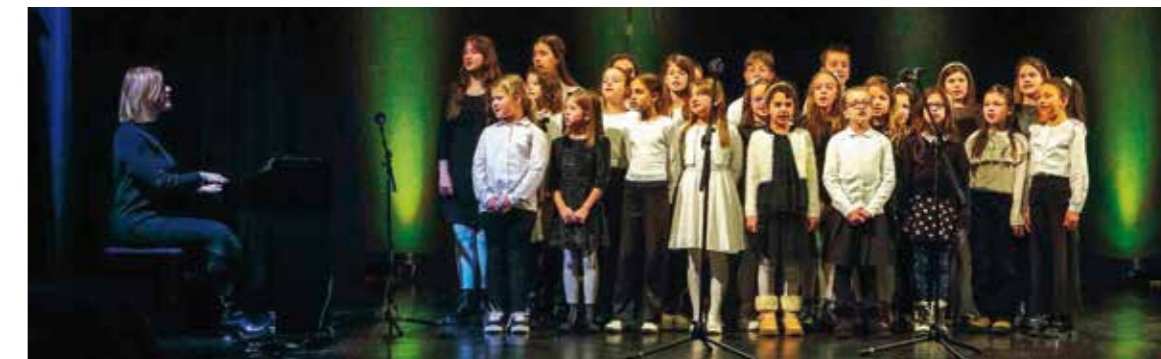
Program je pjesmom uljepšao školski pjevački zbor