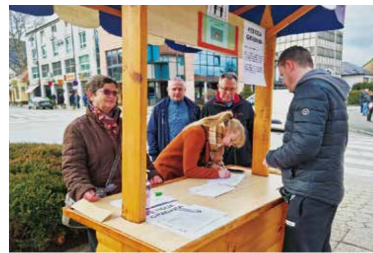
Grad je pokrenuo i peticiju protiv dovoza tuđeg smeća u Jerovec

Podsjećamo, nakon podnesene ustavne tužbe, Ustavni sud je 2023. donio rješenje kojim je ukinuo sporni članak 3. Odluke o redosljedju i dinamici zatvaranja odlagališta u RH, zaključivši da je protustavan.