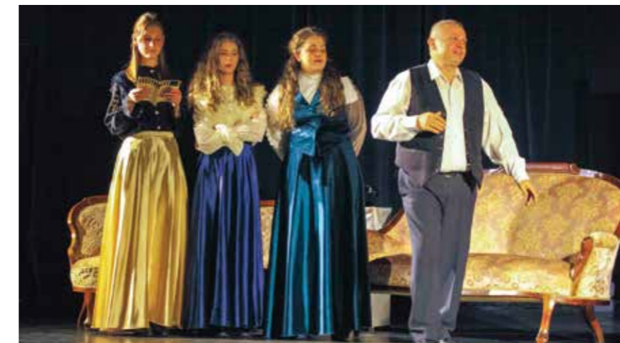
Stožnjevečki Komedijaši napunili su ivanečko kino predstavom Željezne hortenzije