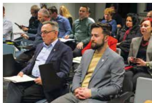
Gradsko vodstvo: Glas „za“ pripajanje Varkomu nikad i ni u kojoj opciji

Donošenjem ovakve odluke Gradsko vijeće Ivanec uskratilo je izdati suglasnost koja je nužna kako bi se, temeljem Uredbe