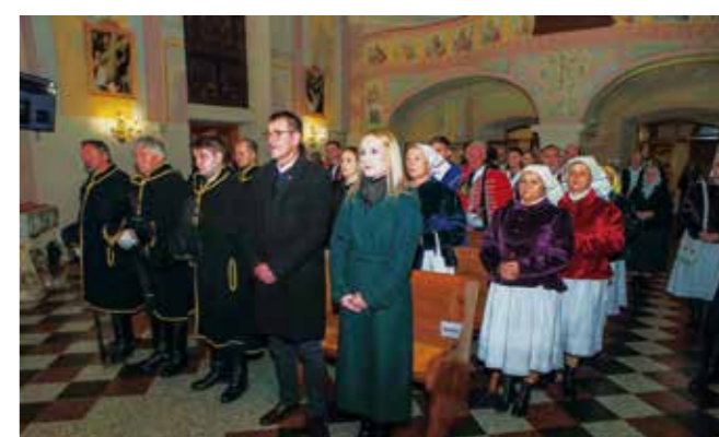
Na rudarskoj misi

KUD RUDOLF RAJTER Božićni koncert u gradskom parku