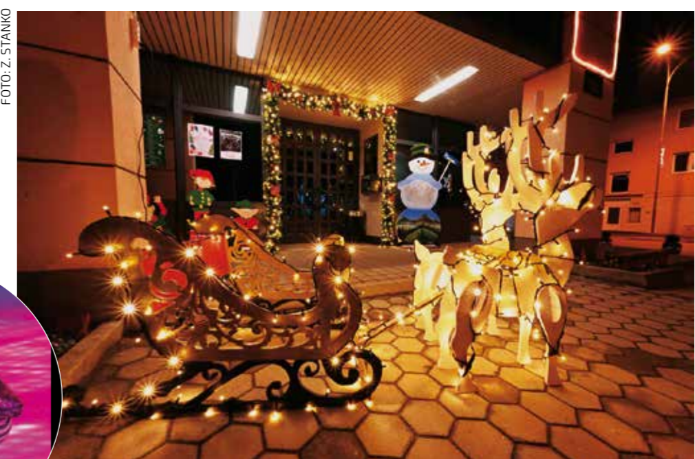
Stigao je i Bubimir!