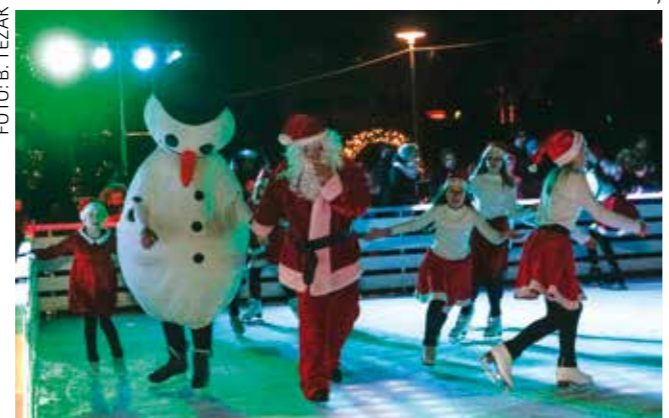
„Čudesna bajka“ na ledu KK Medo iz Zagreba

Posebne simpatije mamilo je i društvo 16 šarenih snjegovića u „šetnji“ gradskim centrom, saonice sa sobovima te maskote Domaćih, bajkovitih plamenih čovječuljaka iz priča I. Brlić Mažuranić. Njih je Grad i ove sezone odabrao kao svoj