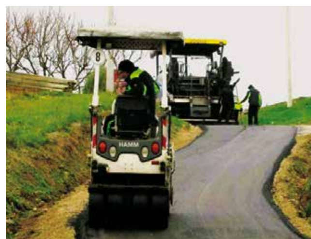
Asfaltirana je dionica na predjelu Šatornjaka u MO Salinovec

NERAZVRSTANE CESTE Iz gradskog Programa asfaltiranja za 2024.