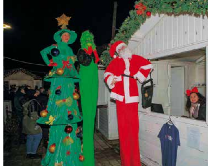
Djecu razveselili hodači na štulama: mrzovoljni Grinch i društvo