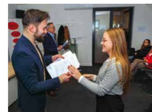
Friščić: Čestitka na stipendiji

nešto povećani, razmišljamo o tome da, zbog visokih cijena i inflatornih kretanja, u ak. 2025./2026. povećamo i broj i visinu stipendija – nagovijestio je gradonačelnik.