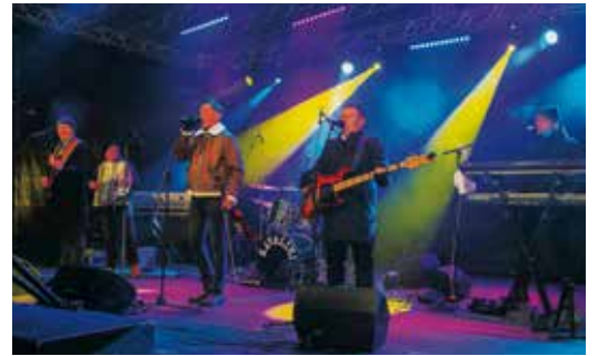
Kavaliri: Najveselije uz Šuoštora, Cvetlinčanku, Zagorski cug...