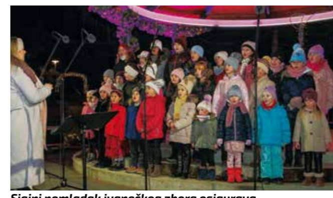
Sjajni pomladak ivanečkog zbora osigurava budućnost duge tradicije zbornog pjevanja u Ivancu

◆◆ Vodstvu zbora čestitke na koncertu i cijeloj uspješnoj 2024. godini uputilo je kompletno gradsko vodstvo na čelu s gradonačelnikom Batinićem