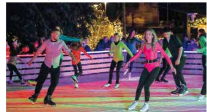
Plesna revija na ledu