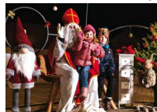
U društvu sv. Nikole

Članovi UG Margareta sjajno okitili svoj središnji trg