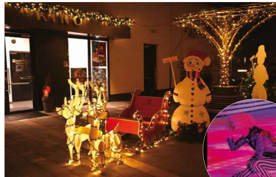
Bajkovita atmosfera na Kinotrgu Ivanec

zimski planinarski brand te tako nastavio njegovati književnu poveznicu koju je B. Mažuranić postavila u svojim bajkama, u kojima spominje vještice s Kleka