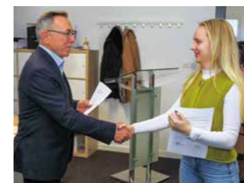
Batinić: Imajte vjere u svoje znanje!