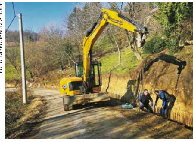
Cijela dionica od 4 km ceste sa sadašnjih 2,50-2,80 m proširuje se na 4,5 m

rekonstruirati i urediti vlastitim sredstvima – poručio je mještanima gradonačelnik Batinić. Cesta na puni profil od 4,5 m + bankine