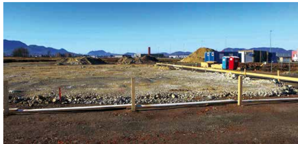
Gradilište novog maloprodajnog parka na istočnom ulazu u Ivanec

IVANEC DOBIVA NOVU SHOPPING DESTINACIJU Na istočnom ulazu u grad