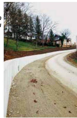
Izvedeni radovi na škarpi kod Osečke

ŽUC, ali i župan Andelko Stričak, koji je bio u obilasku te prometnice, upozoreni su da je kolnik u katastrofalnom stanju; da je proširenje nužno jer cesta širine 2,50 do 2,80 m onemogućuje mimoilaženje vozila i ozbiljno ugrožava sigurnost školskog