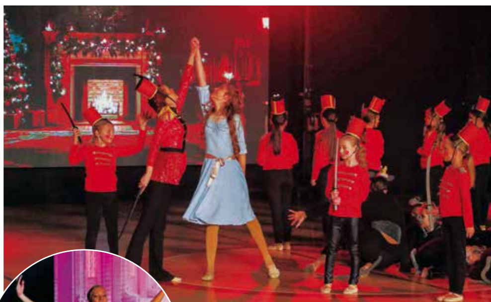
Scena iz „Orašara“ u izvedbi ivanečkih plesačica

Vodstvo Plesnog kluba Ivančice zahvalilo je svima koji su ih tijekom godine podržavali, a posebne zahvale na pomoći i podršku upućene su Gradu Ivancu. Priredbu je pratio i zamjenik gradonačelnika Marko Friščić. (aj)