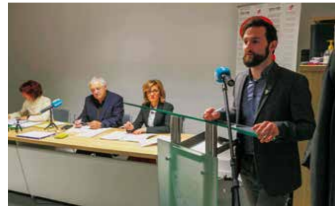
M. Friščić: Sustavni rast i razvoj Ivanca po pitanju realizacije kapitalnih projekata

Rasprava o proračunu, uobičajena kad se donosi najvažniji gradski financijski dokument, na sjednici je gotovo potpuno izostala, a sve točke izglasane su jednoglasno