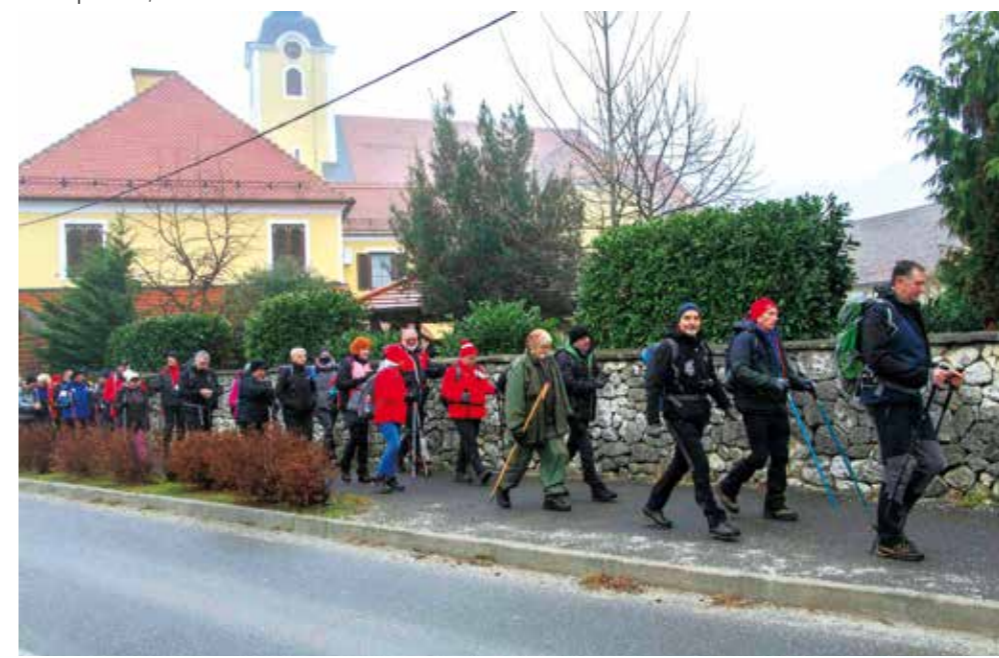
Polazak na pohod s prve točke u centru Ivanca