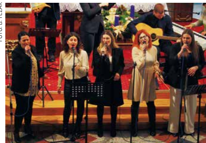
Koncert su organizirale članice ŽVS Kaliope

ŽENSKI VOKALNI SASTAV KALIOPE 9. festival duhovne glazbe „O ljubavi ja pjevam“