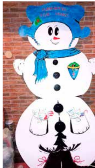
Snješko Planinarskog kluba Ivanec