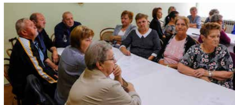
Iduće godine potpore za sve građane s ukupnim primanjima manjim od 540 €

PRIJEDLOG ZA 2025. Radi ublažavanja loše situacije građana s niskim primanjima