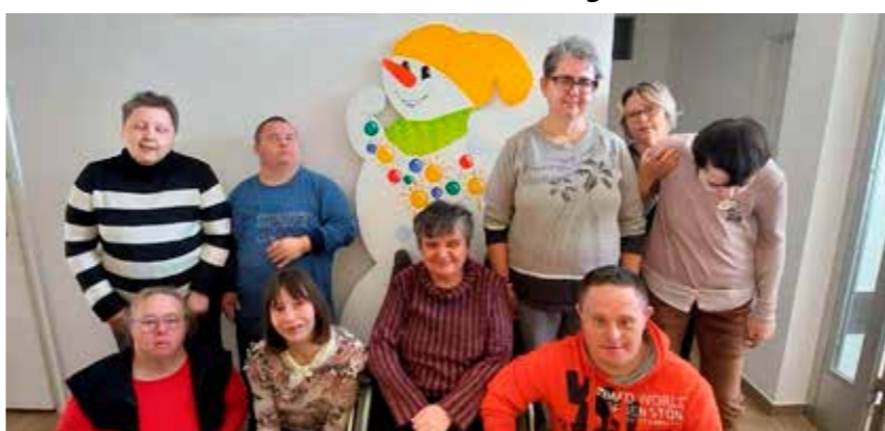
I Ivanečko sunce dobilo je svoga snjegška