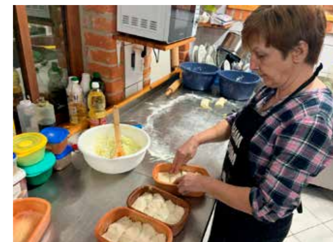
Kak se pripremaju pravi domaći ivonjski štruklji