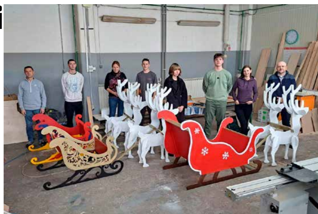
Ovako je bilo u radionici stolara Srednje škole Ivanec

Izradu i postavljanje simpatičnih zimskih gostiju Grad Ivanec realizirao je u suradnji sa stolarima Srednje škole