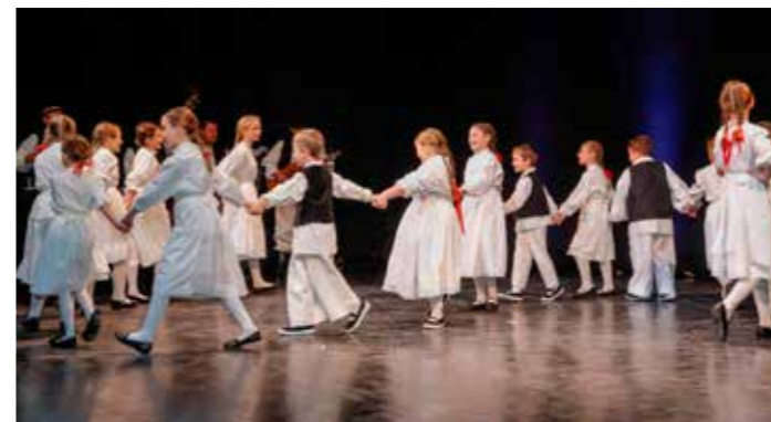
Sjajna dječja sekcija KUD-a Salinovec