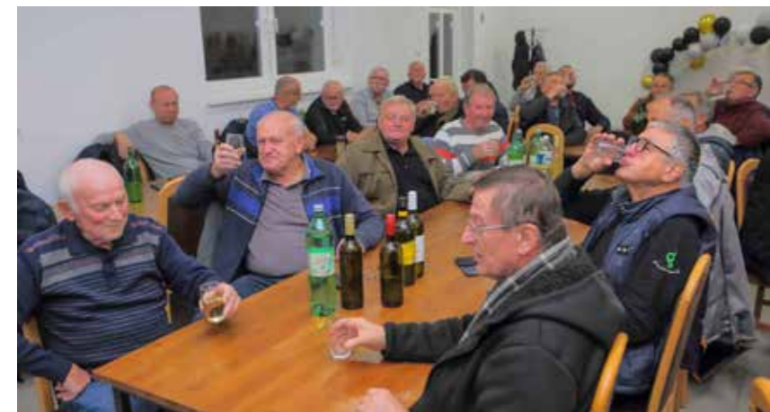
Živjeti svi skupa!

SKRAJSKI PAJDAŠI Veselo Martinje u Salinovcu