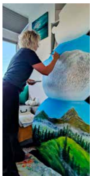
Snegovići HPD-a Ivančica