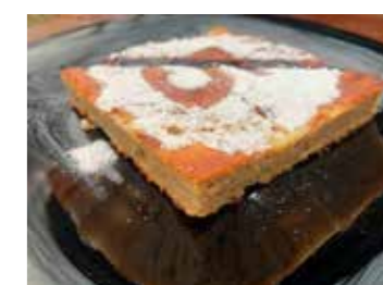
Morete si naručiti i finu zljevku

Po tom pitanju Grad Ivanec je ugostiteljima ponudio partnerski odnos u vidu raznih oblika i podloga Gradu Ivanca za aktivnosti vezane uz zaštitu izvornih ivanečkih specijaliteta. (lj)