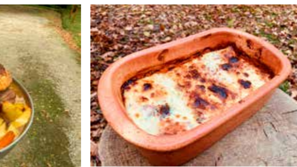
Od sada u redovnoj ponudi pravi domaći uručij tikvenjak!

ste tradicijska jela, iznesena je na sastanku koji su početkom listopada s ugostiteljima održali predstavnici Grada Ivanca, TZ i Poslovne zone, a s obzirom na sve veći broj smještajnih kapaciteta i povećan broj upita gostiju o mogućnosti