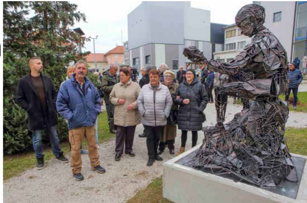
Otkrivanju spomenika odazvala se i rodbina pokojnog akademika