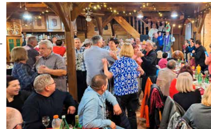
Veselo Planinarsko Martinje u Izletištu Jelenice

od 32 sudionika obišla je Ivanec uz posjet Muzeju planinarstva, Centru Kuljević, Memorijalnom centru Domovinskog rata, klupskim prostorijama PK te pješačila dijelom trase IPO.