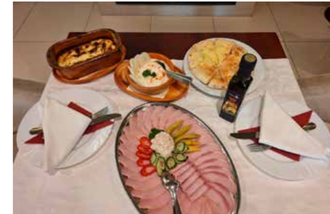
Domaći specijaliteti iz kuhinje hotela Orion