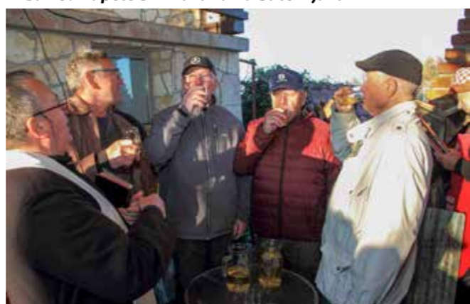
Prva zdravica mladim vinom

goslova mladog vina, vlč Piskač zahvalio je Bogu na urodu, pohvalio je vinogradare, njihovu slogu i trud te im zaželio obilje grožđa u vinogradima u nadolazećoj godini.