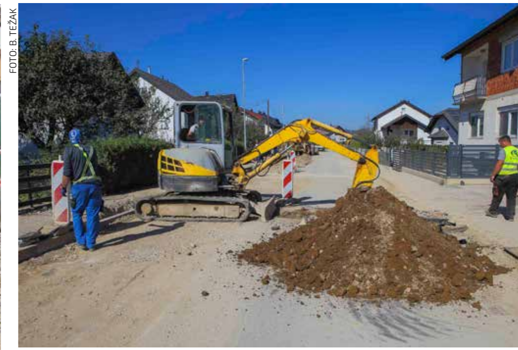
Jedan od razloga kašnjenja: Od Ministarstva gospodarstva odgovor za vodovode čekao se 14 mjeseci, a građevinska dozvola od Županijskog ureda još 5 mjeseci

Vijećnicima se obratio i gradonačelnik Milorad Batinić. Osvrćući se na stranačku instrumentalizaciju projekta Aglomeracije