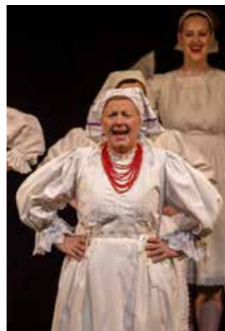
Kad zapjevaju Salinovčanke...