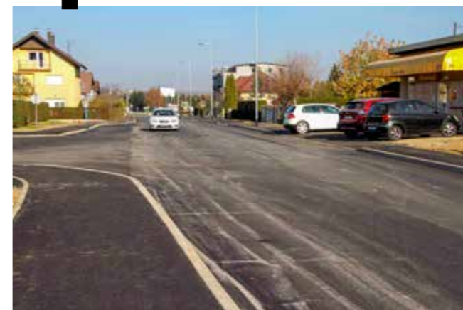
Nakon rekonstrukcije novi kolnik, nogostupi i nova javna rasvjeta

Modernizirana je cijela ulica na čitavom potezom od 450 metara. Projekt se odvijao u dvije faze: na sjevernom dijelu ulice (od novog rotora u pravcu Vite) izgrađen je novi kolnik i nogostupi, dok je na južnom dijelu (od rotora do Varaždinske ulice) uklonjen dosadašnji stari i dotrajali kolnik i zamijenjen novim, a postavljeni su novi rubnjaci i nogostup.