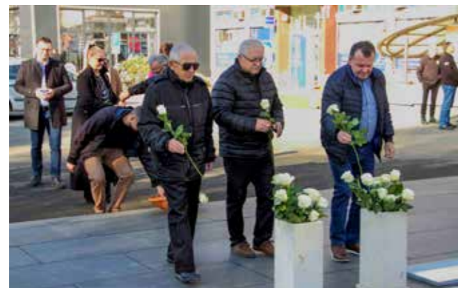
Bijele ruže za sjećanje na žrtve Domovinskog rata