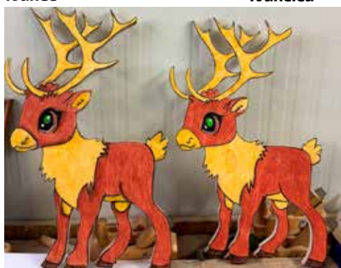
Sigurni smo da će ovi prekrasni sobovi razveseliti sve mališane