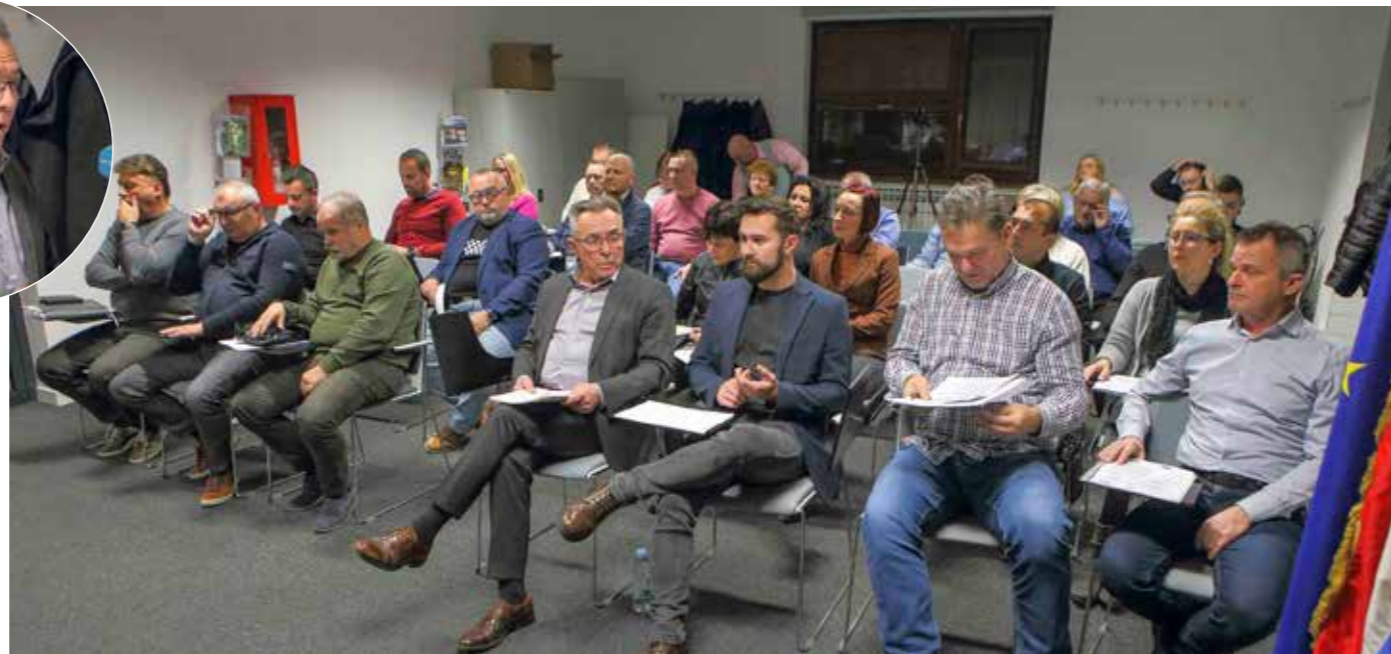
S 39. sjednice Gradskog vijeća na temu Aglomeracije Ivanec

Naglasio je da je cijela jedna godina izgubljena zbog sporosti birokracije i upravo taj izgubljeni period – uz druge objektivne teškoće, ali i subjektivne propuste izvođača – danas se na naj-