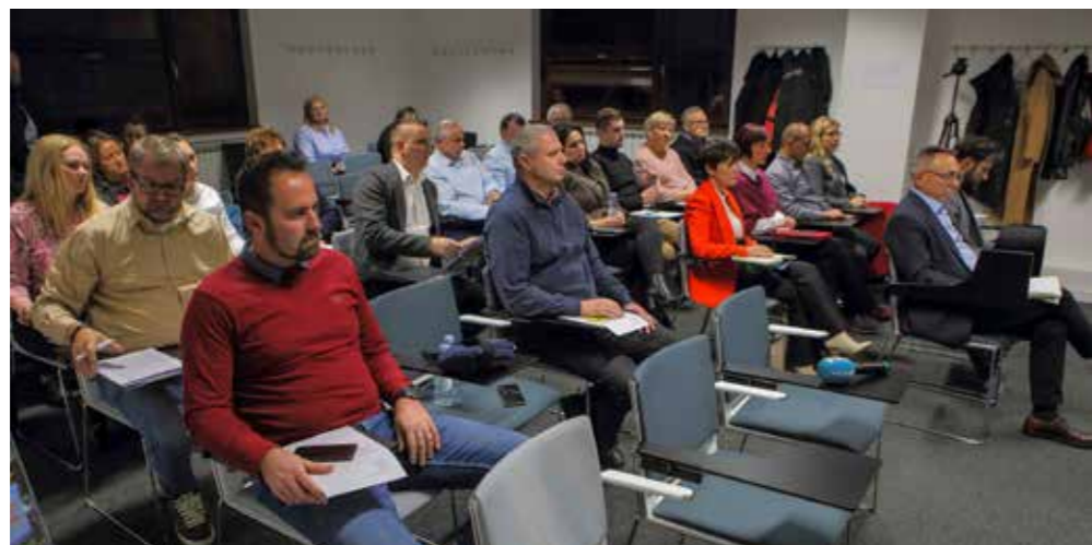
Na 40. sjednici Gradskog vijeća Ivanec

Ne ulazeći u motive tajminoga objave, činjenica je da je samo pola sata prije početka sjednice Gradskog vijeća na pojedinim portalima osvanulo priopćenje HDZ-a Varaždinske županije s navodima o „naredbi“ gradonačelnika Batinića o smjeni Đurasa te s izjavama Zdenka Đurasa kojima sebe prikazuje kao žrtvu „osvete“ Batinića i SDP-a, a samo zato što je pokrenuo rješavanje problema Aglomeracije.