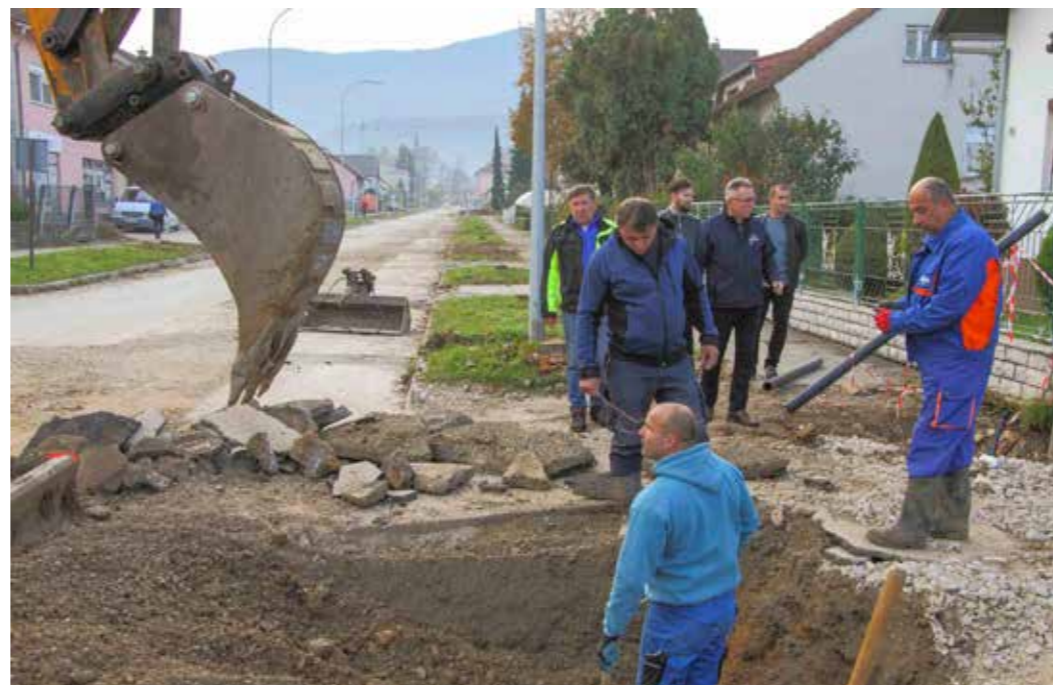
Nova većina u Vijeću sad već bivšem predsjedniku imputira da u 3 godine trajanja aglomeracije nijednom nije bio na terenu niti pokazao ikakav interes za tu temu

–Da u javnosti niste dizali tenzije, teatralno nastupali i izvrtali činjenice, do ove sjednice ne bi ni došlo. Donekle mogu razumjeti vaš predizborni spin. Glumite žrtvu u medijskom prostoru i pravite se nevini. Nakon svega što smo čuli, samo što nam suza nije krenula! A istovremeno, uz svoje ljude na raznim pozicijama, sve što radite u svrhu je vaše vlastite stranačke promidžbe – ocijenio je Spasojević.