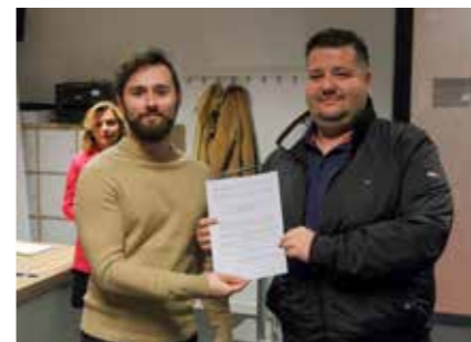
Dobrodošlica novim stanovnicima našega grada

Riječ je isključivo o mladim obiteljima koje svoje stambeno pitanje rješavaju (do)gradnjom, rekonstrukcijom ili kupnjom nekretnine na administrativnom području Grada Ivanca.