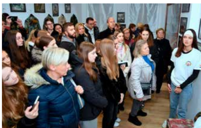
Program u Memorijalnom centru Domovinskog rata Ivanec

Nakon mise, svi okupljeni su u Koloni sjećanja krenuli pre-