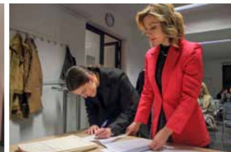
Gradski stambeni poticaji za još 15 mladih obitelji