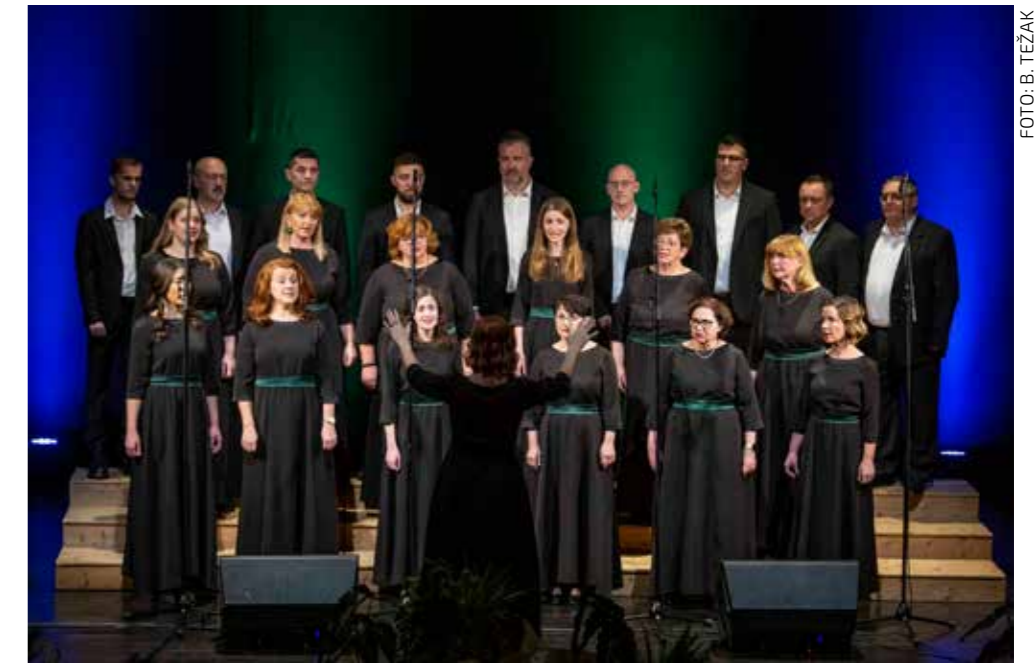
Najbolji u Hrvatskoj – Mješoviti pjevački zbor KUD-a Rudolf Rajter

ZBORSKA GLAZBA Godišnji koncert KUD-a R. Rajter Ivanec