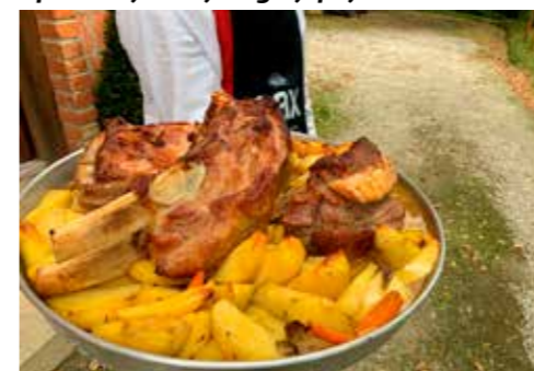
Specijalitet kuće – teletina ispod peke

Inicijativu Grada o uvrštavanju starih jela u svoj jelovnik prihvatio je i hotel Orion. Uz meso iz banjice vlastite proizvodnje, kod njih možete dobiti i zagorski pinklec, juhu od buče i zagorsku