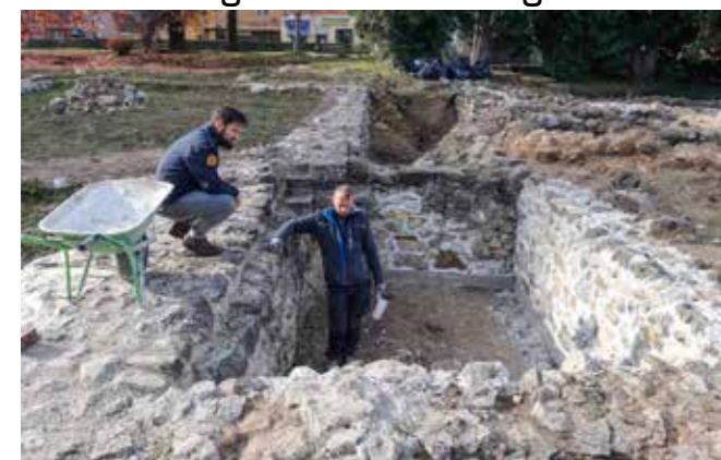
U konzultaciji s izvođačima radova

U CENTRU GRADA Intenzivirana sanacija arheološkog lokaliteta Stari grad Ivanec