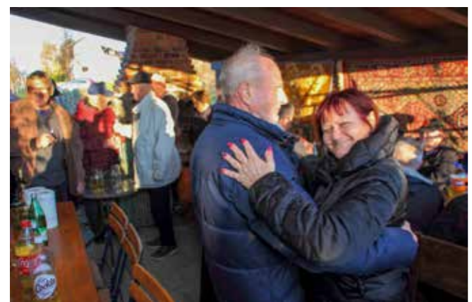
Veselo na martinjskoj proslavi uz ples okupljenih i glazbu Starih zajcof