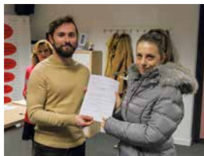
Za budućnost grada svaka mlada obitelj je dragocjena

–Među brojnim programima poticaja koje korisnicima Grad dodjeljuje za različite svrhe, ovaj nam je najdraži i najviše ga pratimo. S obzirom na to da ga koriste čak 152 mlade obitelji, to znači da smo u Ivanec uspješno držali vrlo velik broj mladih ljudi. A to je jako važno u svjetlu svega što se u našoj zemlji događa po pitanju iseljavanja mladih u druge zemlje i druge sredine – istaknuo je M. Friščić.