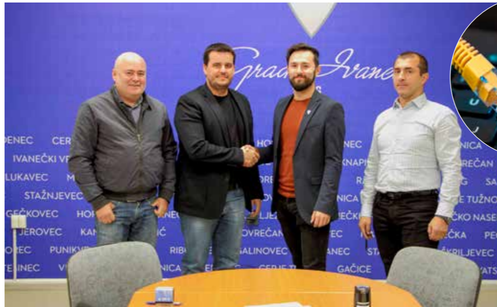
S potpisivanja sporazuma o širokopoljasnom internetu u Gradskoj vijećnici Ivanec

tvrtkama i obrtnicima) osiguravati sredstva za sufinanciranje troškova priključenja na mrežu i