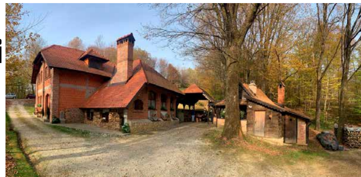
Restoran Pethrasti iznad Salinovca u bajkovitom šumskom okruženju

♦♦ Inicijativa za uvrštavanje starih lokalnih jela na menije lokalnih ugostitelja krenula je od Grada Ivanca, u cilju očuvanja i zaštite izvornih delicija Ivanca i ivanečkoga kraja