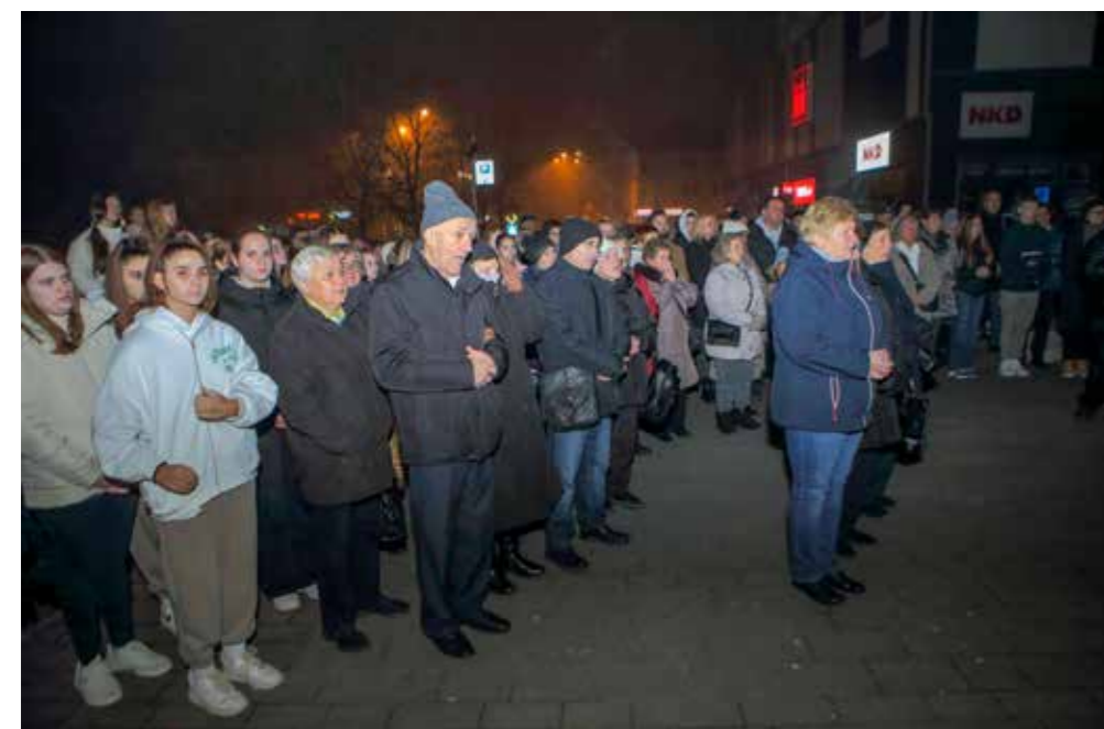
Sjećanje na Vukovar i Škabrnju

Kod spomenika su učenici OŠ Ivanec pročitali dojmive poruke iz „Priče o gradu“ ubijenog vukovarskog novinara S. Glavaševića