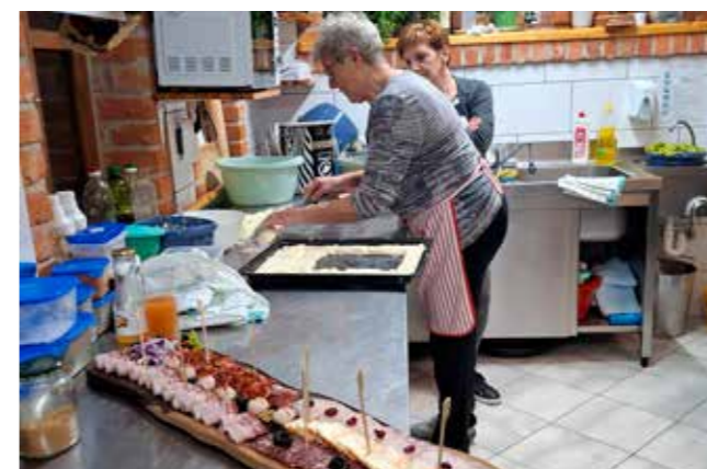
Predsjednica Maske V. Friščić prenijela je umijeće spremanji ivonjskog rijepnjaka