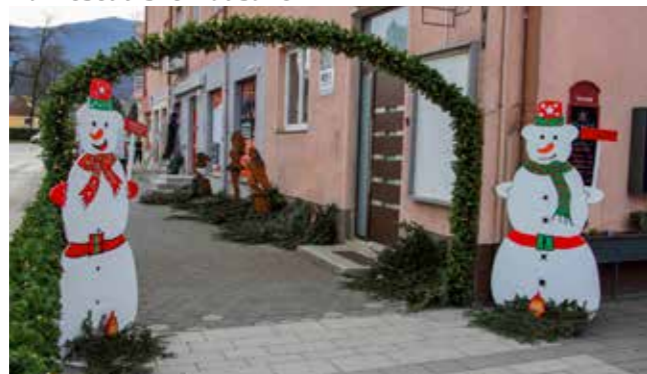
„Lanjskim“ snjegovićima sad u posjet stiže još šest novih!

Ivanec. Pod mentorstvom Tomice Sankovića, učenici su u sklopu prakse u svojoj školskoj radionici osmislili snjegoviće, Domaće, sobove i saonice te ih ispilili u posebnom vodootpornom materijalu. Hvala na suradnji ravnateljici Lidiji Kozina!