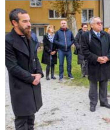
Autor djela Leo Friščić, mag. primijenjenih umjetnosti

znamenitim sugrađanima, kako bi im se Grad i na takav način odužio za doprinos različitim segmentima znanosti i stvaralaštva. -Spomenik Malezu izrađen je u metalu, materijalu koji simbolizira dio ivanečke rudarske