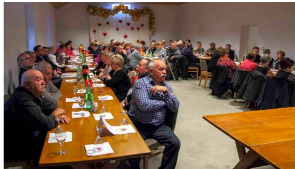
Božićnice kao poklon Grada za olakšanje teškog položaja umirovljenika

Namjera je da se božićnice umirovljenicima do Božića dostave na kućne adrese, putem