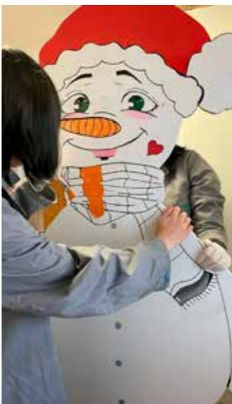
Oslikavanje snjegovića Udruge Nada