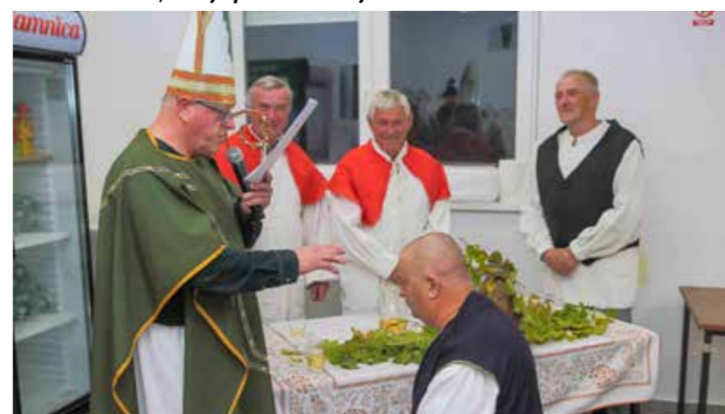
Zanavek se odričem veze s vodom i cukorom!