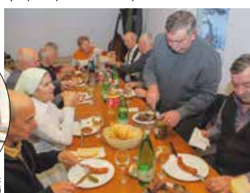
U dobrom društvu na Vincekovo

Pošto se na siječanjskim temperaturama nije dalo dugo izdržati na otvorenom, okupljeni su Vincekovo nastavili slaviti uz roštilj, kobasice i kolače u toplom društvenom domu u I. Željeznici, gdje se okupilo 40-ak vinogradara i članova KUD-a Salinovec. (ljr)