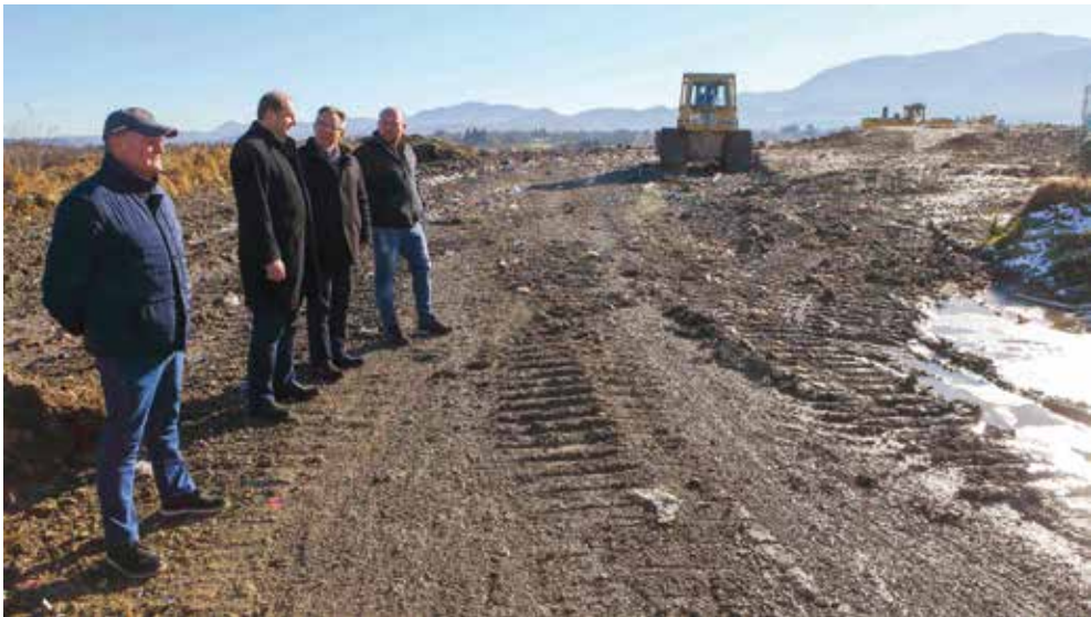
Građani Jerovca sami će odlučiti o nastavku odlaganja otpada ili zatvaranju deponija

-Bude li stav mještana da deponij treba zatvoriti, ja ću ga poštivati, to više što smatram da predugo čekaju da im se otpad makne iz dvorišta. Podsjećam, projekt Regionalnog centra razvlači se tijekom zadnjih 20 godi-