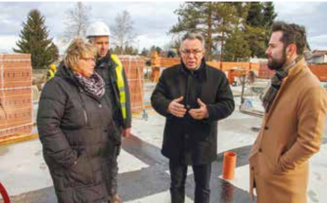
Gradski čelnici s ravnateljicom vrtića u obilasku gradilišta

Nasuprot sadašnje zgrade vrtića Ivanec gradi se novi kompleks koji se sastoji od četiri međusobna povezana objekta, namijenjen za smještaj 48-ero djece jasličke dobi