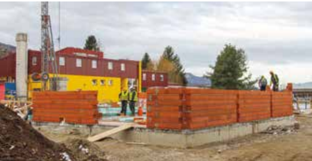
Gradi se 700 novih vrtićkih „kvadrata“ za smještaj mališana jasličke dobi