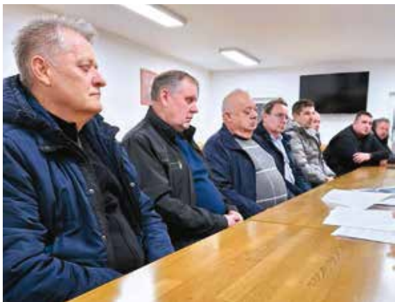
Na sastanku vijeća MO-a Jerovec Gornji i Donji