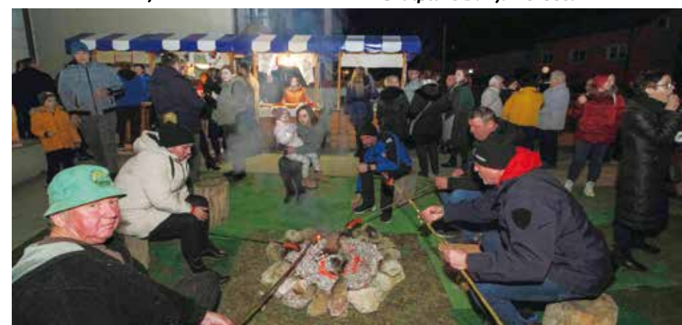
Uz planinarsku logorsku vatru