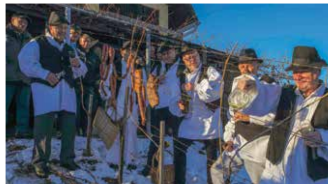
Ivanečki vinogradari drže do tradicije

Ovogodišnje Vincekovo obilježio je prohladan, ali sunčan i prelijepe zimski dan. Nakon ceremonije