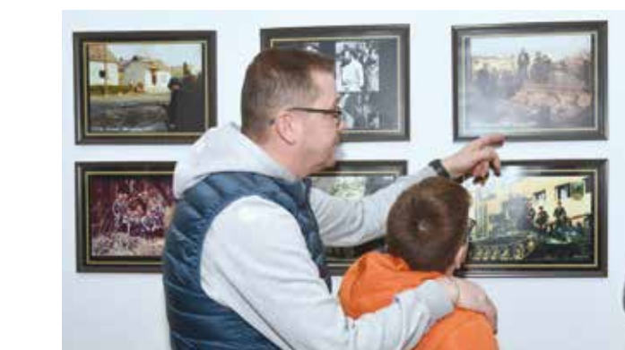
To je istina o Domovinskom ratu!

Uz razgledavanje stalnog postava (fotografije iz Domovinskog rata, odore, vojne i po-