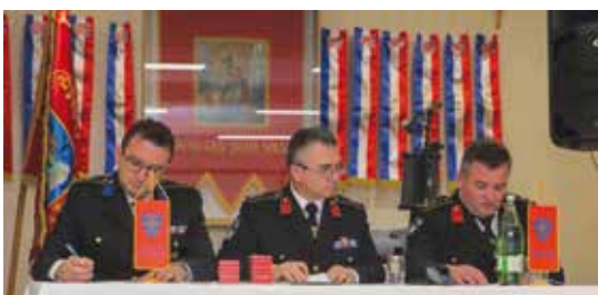
Sa 96. izvještajne skupštine DVD-a Margečan