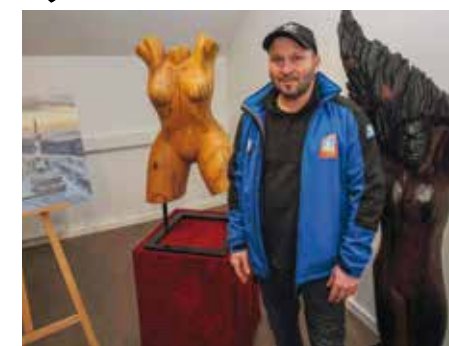
Skulpture Darija Horbeca