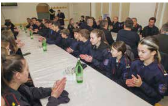
DVD Margečan ponosi se brojom mladeži