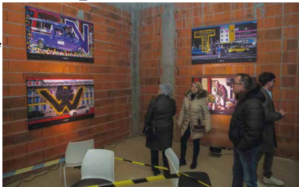
Nesvakidašnji interijer kao sjajna podloga za suvremene izložbe

Postavljanjem ove izložbe u novom dijelu muzeja, željeli smo svima vama pokazati kakvim će kapacitetima Ivanec raspolagati