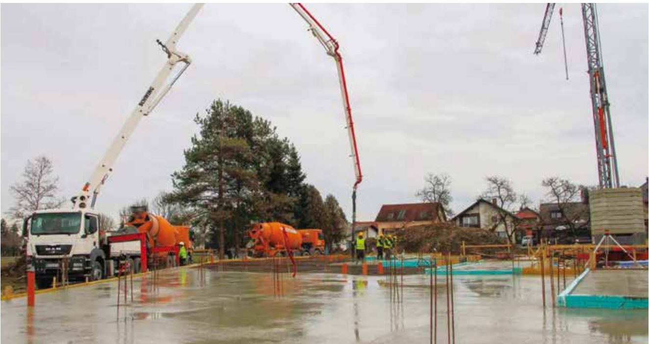
Sredinom siječnja sagrađena je temeljna armiranobetonska ploča

jasličke dobi, za čiji smještaj sada i postoji najveća potreba. Drago mi je što, prema izvješću izvođača, radovi teku prema dinamičkom planu. Nadam se da će i dalje sve teći planiranim tempom, kako bi novi vrtić bio završen do ove jeseni, odnosno, do početka nove pedagoške godine – izjavio je gradonačelnik Batinić.