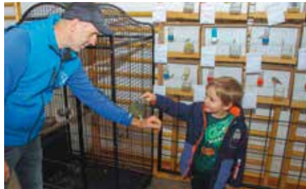
Zanimljivo za velike i male posjetitelje