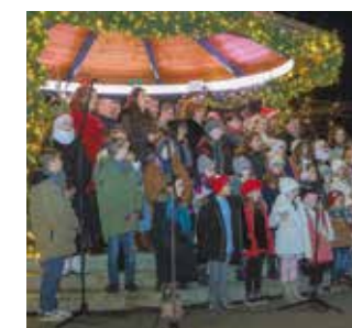
Rad udruga u kulturi Grad će poduprijeti s 34.000 €

KULTURA Program javnih potreba u kulturi Grada Ivanca u 2024. godini