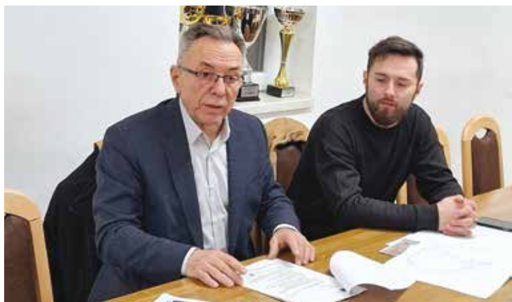
Batinić: Sutra bih raspisao natječaj za zatvaranje i sanaciju Jerovca

-Istina je da sada mještani Jerovca ne plaćaju odvoz otpada. Nakon zatvaranja deponija i početkom odvoza na novu lokaciju, i mi ćemo plaćati odvoz po višim cijenama. Ali zato više nećemo imati deponij – izjavio je Zdenko Đula. (ljr)