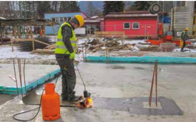
Radovi su u punom jeku