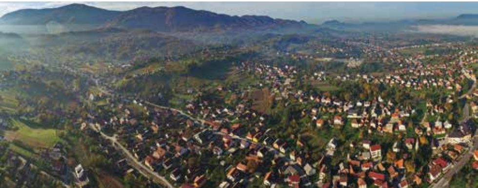
Baza podataka slobodnog građevinskog zemljišta bit će na korist vlasnicima koji ih žele prodati, odnosno, kupiti

Stoga Grad Ivanec poziva sve privatne vlasnike koji posjeduju građevinske čestice na administrativnom području Ivanca na dostavu podataka za izradu baze građevinskog zemljišta, i to bez obzira na njegovu namjenu (stambena, poslovna, turistička i sl.). Poziv se ne odnosi na zemljišta u obuhvatu Industrijske i Poslovne zone jer su ona predmet zasebnih evidencija i njihov pregled već je dostupan u kartografskom obliku na web stranici