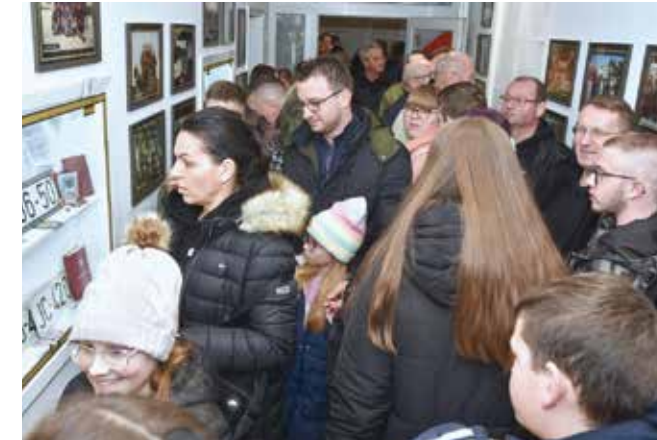
Velik broj posjetitelja na Noći muzeja u Memorijalnom centru

Organizatori, UDVDR i HVIDR-a Ivanec, istaknuli su zadovoljstvo velikim posjetom Memorijalnom centru u kome se može vidjeti dio značajan dio povijesti ivanečkoga kraja iz razdoblja stvaranja Hrvatske. U tom kontekstu, ističu, Memorijalni centar u potpunosti ispunjava svoju ključnu, edukativnu ulogu.