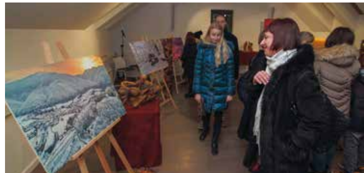
Fotografije Z. Stanka i skulpture u starom dijelu muzeja

ma u kojima je bila postavljena. –Ovo je vjerojatno prva izložba fotografija na svijetu snimljenih mobitelom. Svaku od njih sam, meni dostupnim tehnologijama povećao te ih ručnom obradom i doradom s fotograf-