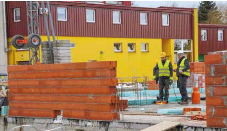
Gradi se novi objekt Dječjeg vrtića Ivančice u Ivancu, slijedi i gradnja novog vrtića u Radovanu