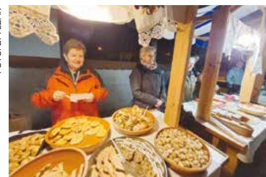
Niz domaćih delicija članica Društva Maska

skim medijem sintetizirao u cjelinu. Jedan od ciljeva ove izložbe bio je dovesti publiku i pokazati posjetiteljima kakav prostor u novome muzeju ima Grad Ivanec! Nema ga ni Varaždin, pa čak niti Zagreb! – izjavio je autor