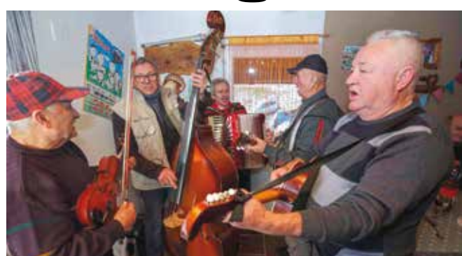
Glazbeni štimung domaćih muzikaša

pa se uživalo u vrućim domaćim kobasicama, a neizostavno su se morala kušati najbolja vina lanske berbe, kojima su se pohvalili okupljeni vinogradari. (ljr)