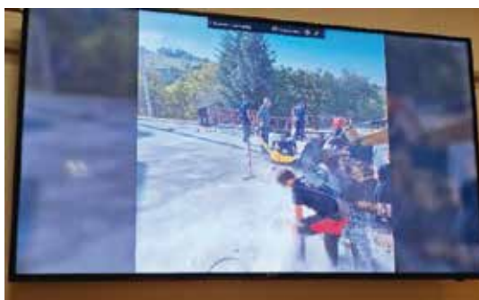
Video: Kako se gradila nova garaža?

SOCIJALNA SKRB Program javnih potreba u socijalnoj skrbi za 2024. godinu