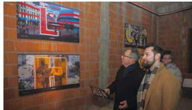
U obilasku izložbe