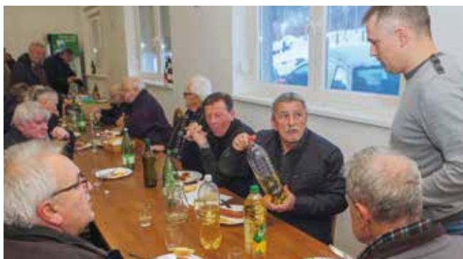
Hladan zrak otvorio je apetit...

sove, pa ih onda još i dobro zalili starim vinom i tako se „primitivni“ goricama, berba u Ivancu i ove bi jeseni morala biti dobra.