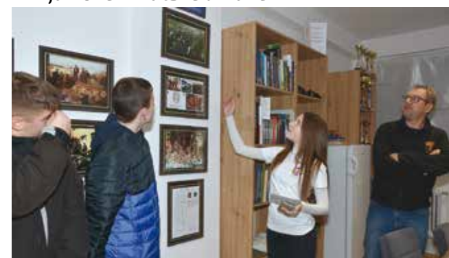
Memorijalni postav prezentirale su učenice OŠ Ivanec

U centru se može vidjeti velik dio povijesti ivanečkoga kraja iz razdoblja stvaranja nove hrvatske države