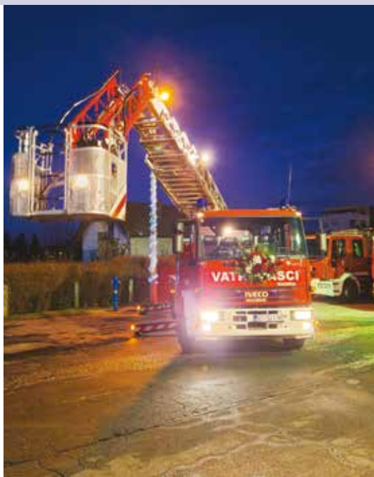
Grad osigurava sredstva za pojačano opremanje DVD-ova i civilne zaštite

PLAN RAZVOJNIH PROGRAMA sastavlja se za trogodišnje razdoblje, sadrži ciljeve i prioritete razvoja grada povezane s programskom i organizacijskom klasifikacijom proračuna.