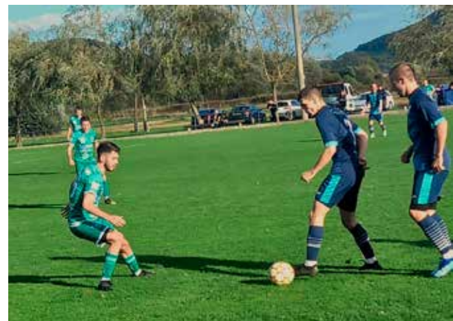
Mladost sedma na prvenstvenoj tablici

društvo prvih šest momčad na prvenstvenoj tablici, koje zatim igraju Ligu za prvaka Elitne ŽNL,