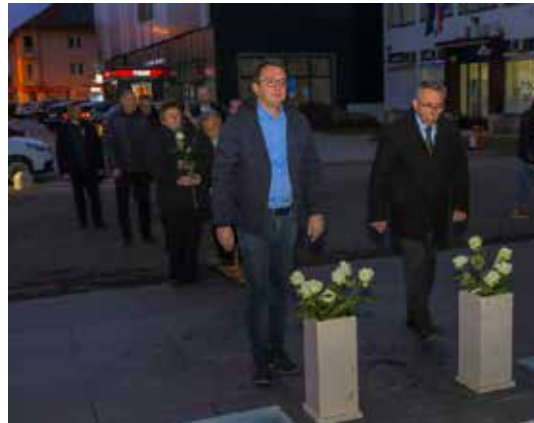
Bijela ruža i poklon svim žrtvama