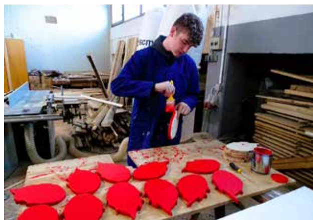
Bojanje Domaćih: Ako su „izletjeli“ iz žeravice, pa onda moraju biti ognjeni!

– U svijetu njene priče Šuma Striborova, koja govori i o tome kako su iz žeravice od zapaljena triješća, skupljena u začaranoj šumi, izletjeli Domaći na čelu s Malikom Tintilinićem, odlučili smo da upravo oni budu zaštitni znak ivanečkog adventa. Time ne samo da se vraćamo našim dalekim staroslavenskim korijenima i legendama, već ujedno nastojimo na jedan drukčiji način reafirmirati našu nacionalnu književnost – kazala je na sjednici Vijeća za