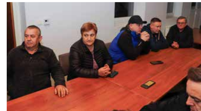
Mještani: Neka si Budinščina prevozi kamen kroz svoja naselja!

–Kako se uopće usudujete optuživati me da bih na bilo koji