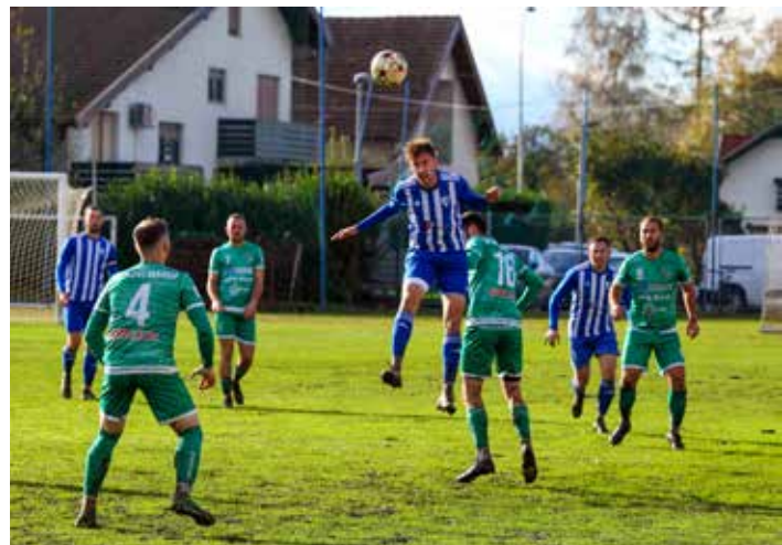
U utakmici s N. Marofom poraz ivanečke momčadi od 2:4

Ivanečka momčad je u posljednjoj utakmici jesenskog dijela s Poletom odigrala neriješeno, 3:3. U 13. kolu Ivančica je