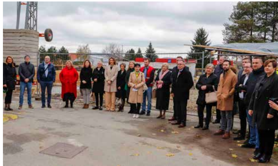
Gradski vijećnici i predstavnici izvođača radova na polaganju kamena temeljca