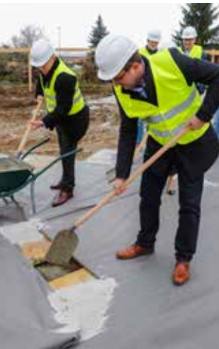
Kapsula je uzidana u temelje objekta!

–Radujem se, jer dogradnja vrtića je nešto najljepše što nam