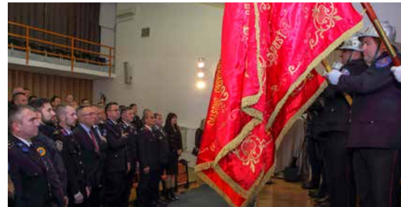
Sa svečanosti obilježavanja 30 godina Vatrogasne zajednice Grada Ivanca

kako bi ih zadržali u vatrogastvu. –Što se opremljenosti tiče, u zadnjih pet godina ulažu se značajna financijska sredstva u vatrogastvo pa je teško reći koju opremu nemaju naši DVD-ovi – naglasio je Putarek.