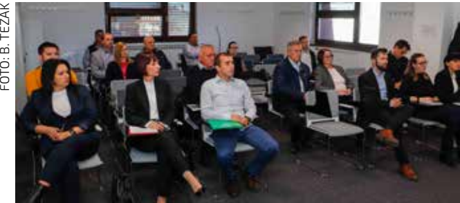
Sa sastanka s ivanečkim poduzetnicima

U raspravu su se pitanjima, primjedbama i prijedlozi-