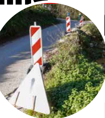
Problematična županijska cesta; kako da se ovdje mimođu dva kamiona?

M. Batinić založio se za sustavno rješavanje cijelog toka potoka Željeznice, od izvora do ušća. To podrazumijeva izradu geodetskog snimka cijeloga toka potoka, izradu rješenja od strane Hrvatskih voda kao temelja za izradu projekta te radove kojima bi se na duži rok riješio cijeli tok Željeznice. Predložio je obilazak