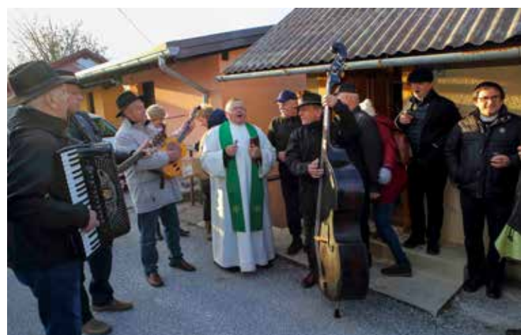
Kumek moj dragi, daj se napij...