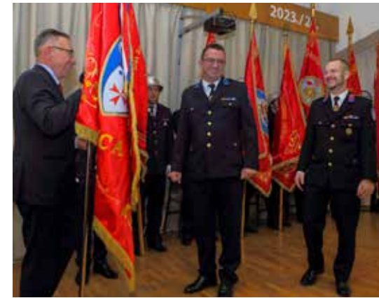
Primopredaja nove zastave Vatrogasne zajednice

–Kod poplava u svibnju ove godine u roku pola sata na teren je izašlo više od 1.000 vatrogasaca sa 264 vozila. I koliko god je ta nepogoda bila strašna, pomoć koju su vatrogasci pružili našim građanima bila je nena-doknadiva. Upravo zbog promijenjenih okolnosti pokrenuli smo aktivnosti za gradnju Regionalnog centra CZ koji će objediniti tehnička sredstva, opremu i ljudske resurse CZ na regionalnoj razini – poručio je župan.(ljr)