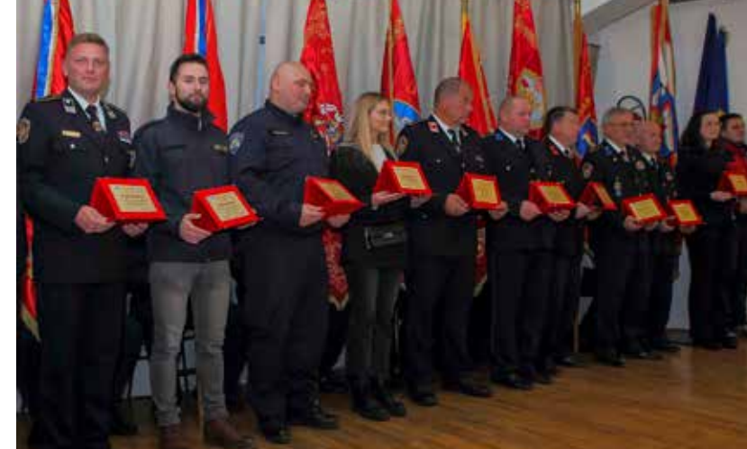
Priznanja zaslužnim vatrogascima i podupirateljima

da VZ broji 560 članova, od čega je operativaca između 105 i 115. U sklopu VZ djeluje i 185 pripadnika mladeži i pomlatka, a DVD-ovi ulažu puno truda