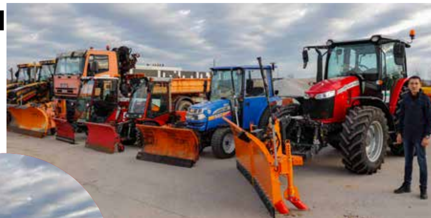
Za zimsku službu je nabavljen novi traktor (gore) i sol za posipavanje cesta (lijevo), a ovih dana stiže i novi kamion

Za posipavanje prometnica i prometnih površina spremno je i 300 tona rizle te 50 tona soli. Sva navedena mehanizacija i materijal namijenjeni su čišćenju oko 180 km nerazvrstanih cesta na cijelom gradskom području, a gradska će tvrtka čistiti i nogostupe te