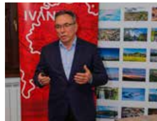
Batinić: Kako premostiti manjak poreznih prihoda u proračunu za 2024.?

U Poduzetničkom inkubatoru Ivanec u srijedu je, 15. studenog, održan tematski sastanak Poslovnog kluba Ivanec. U skladu s višegodišnjom dobrom praksom, na sastanku je predstavnicima lokalne poslovne zajednice predstavljen prijedlog proračuna Grada Ivanca za 2024. godinu, s posebnim naglaskom na programe i potporne mjere za poduzetnike.