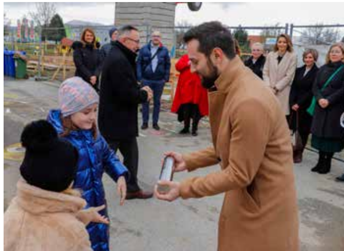
U kapsulu su djeca pohranila svoje poruke i crteže za neke buduće generacije

U povodu velikog trenutka, kratak program ispunjen pjesmom i stihovima izveli su mališani Dječjeg vrtića sa svojim odgojiteljicama. Sve okupljene domaćine i goste pozdravio je predsjednik Gradskog vijeća