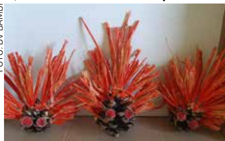
Domaći iz radionice Dječjeg vrtića Bambi