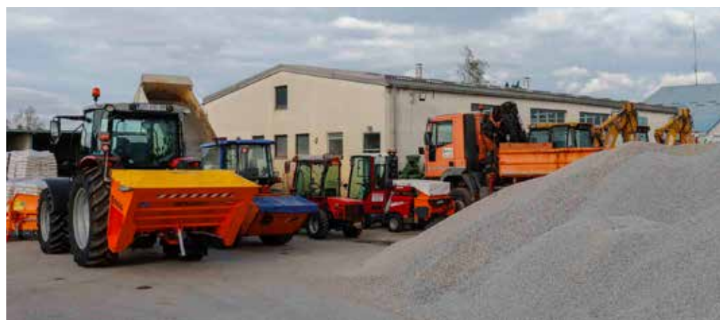
Na raspolaganju 300 tona rizle za posipavanje prometnica