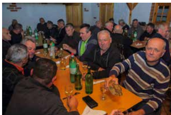
Živjeli uz najbolja mlada vina ivanečkoga vinogorja!

MARTINJE Krštenje mošta u organizaciji Udruge vinogradara Skrajski pajdaši