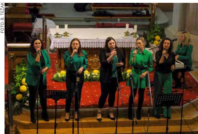
Kaliope su i ovoga puta izvedbama oduševile ljubitelje duhovne glazbe

♦♦ Festival duhovne glazbe 8. put u organizaciji ŽVS Kaliope