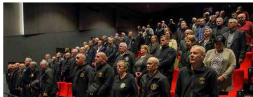
Sa svečanosti u Kinu u povodu 25 rada UDVD-a Ivanec

TUŽNA OBLJETNICA U povodu pogibije prije 32 godine u Borovu Naselju