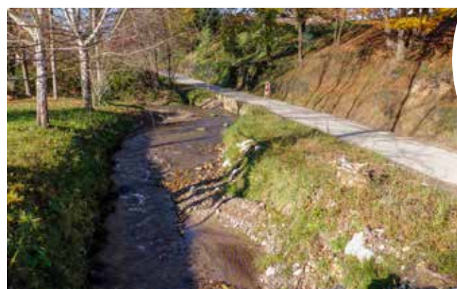
Potok Željeznica – jedan od najgoropadnijih na slivu Plitvica-Bednja

Budući da su teme razgovora bili i problemi koje pričinjava potok bujičar Željeznice te prometovanje županijskom cestom koja nije dimenzionirana za povećan promet, na skup su bili pozvani predstavnici Hrvatskih voda (odazvao se Branko Perec, voditelj VGO ispostave za mali sliv Plitvica-Bednja u Varaždinu) i ŽUC-a (nije se odazvao nitko).