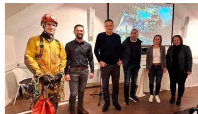
Struka jedinstvena: Kamenolom će ubiti prirodu!