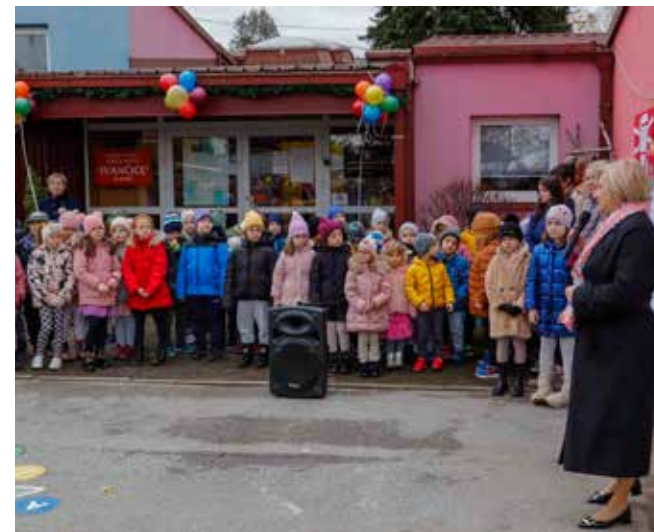
Izaslanica ministra V. Šerepac: U Ivanu se grade respektabilni vrtićki kapaciteti

IVKOM Sve je spremno za zimsku službu u sezoni 2023./2024.