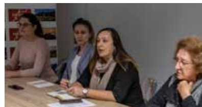
Kulturno vijeće Grada Ivanca

Čekat će vas već uoči Adventa u centru Ivanca i nadamo se da ćete uživati u njihovoj šarenom imidžu!