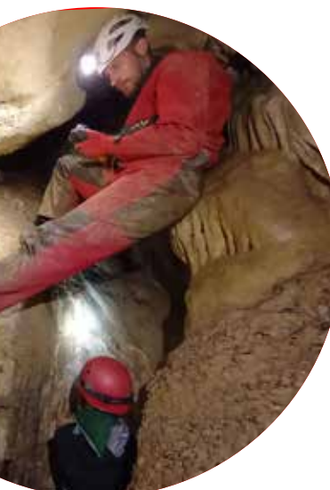
Ljepota podzemlja: Zainteresirani se mogu pridružiti speleološkoj školi SU K. zviri u proljeće