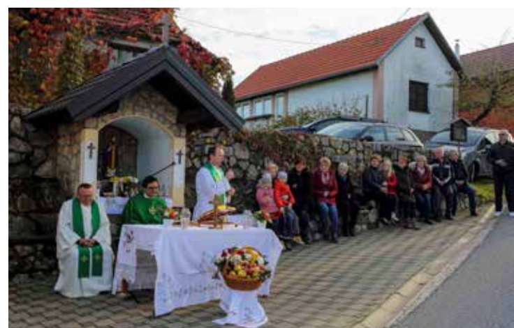
Misa kod kapelice sv. Martina na Šatornjaku

– Došel bu, došel sv. Martin, on ga bu krstil, ja ga bum pil! – orilo se u nedjelju, 12. studenog, s vrha Šatornjaka, gdje je salinovečka Udruga vinogradara Skrajski pajdaši priredila tradicionalno martinjsko krštenje mošta.