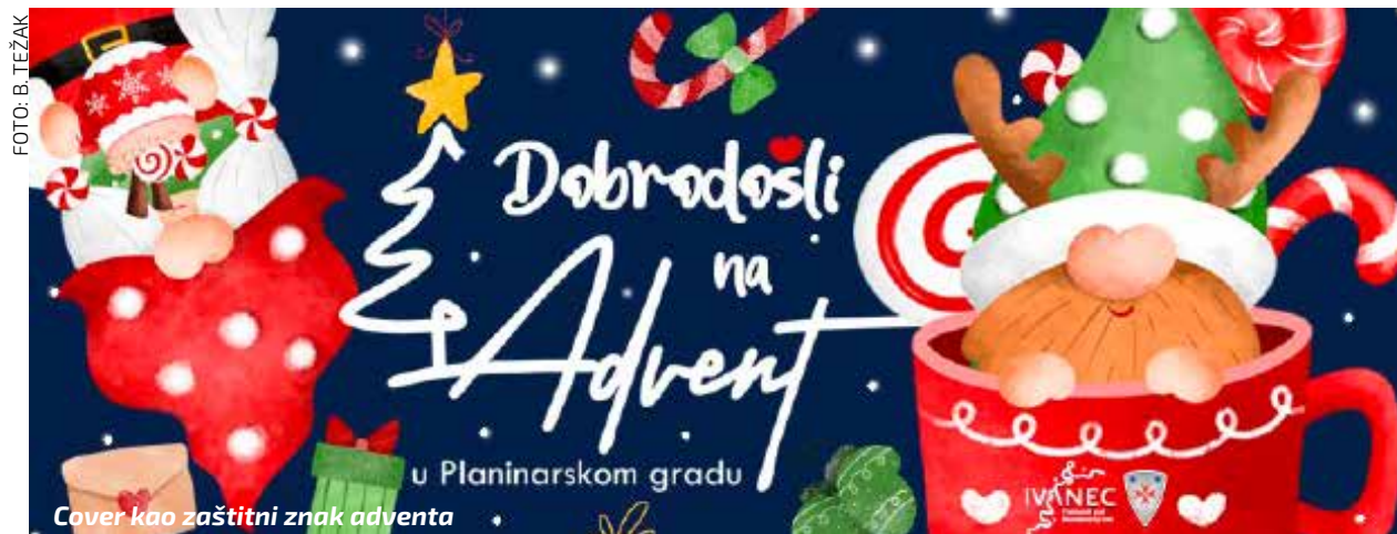
Cover kao zaštitni znak adventa

ADVENT U IVANCU Kulturno vijeće pozdravilo novu ideju adventskog brendiranja Ivanca