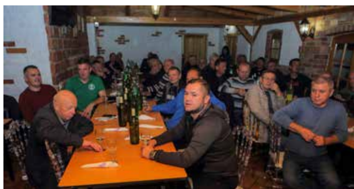
Ivanečki vinari u dobrom martinjskom raspoloženju

Pa stoga i ne čudi da su iz Šumske vile do zore odjekivali tonovi domaćih vinskih pjesama Došel je, došel sveti Martin, Išel budem v kleticu, Oj, draga kapljica...(ljr)