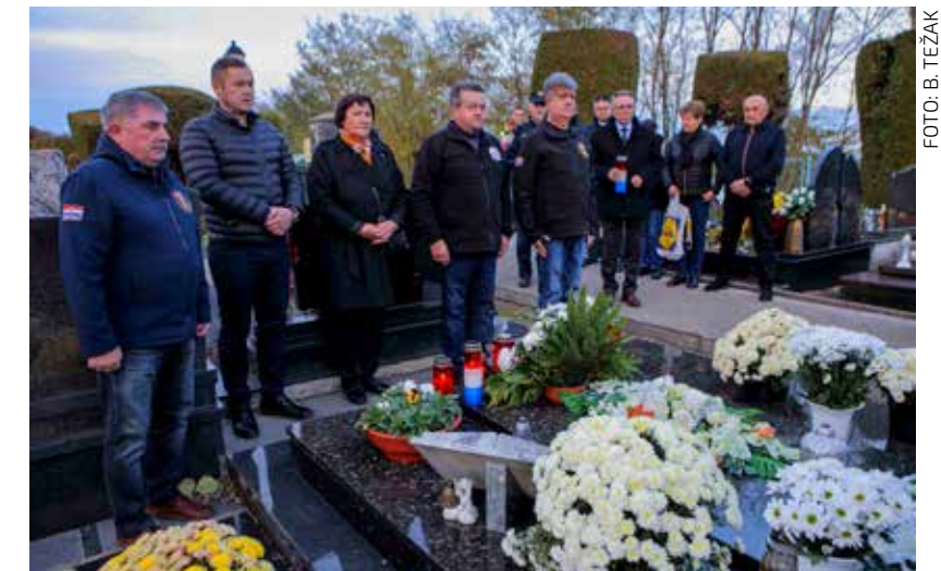
Poklon vukovarskom branitelju

TUŽNA OBLJETNICA U povodu pogibije prije 32 godine u Borovu Naselju