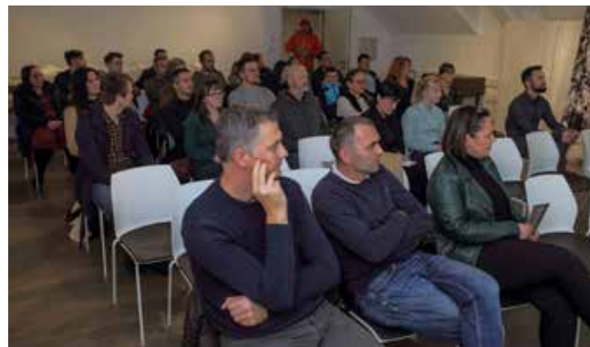
Građani su s interesom pratili zanimljivo predavanje

O nastanku podzemnih objekata, njihovoj podjeli, istraživanjima, zaštiti te o problematiki onečišćenosti špilja i jama na skupu je govorila predsjednica