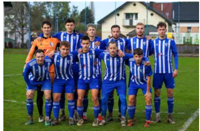
U prvom dijelu sezone plasman momčadi Ivančice na 6. mjestu prvenstvene tablice

Nogometna momčad Ivančice u posljednja je četiri kola u elitnoj ligi ŽNL Varaždin od mogućih 12 bodova uknjižila