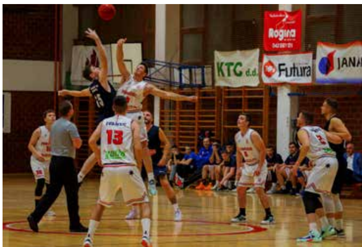
Visoka pobjeda Ivančice nad Koprivnicom