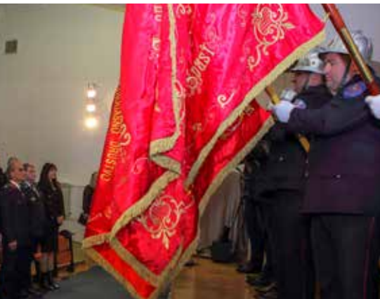
Primopredaja nove zastave Vatrogasne zajednice