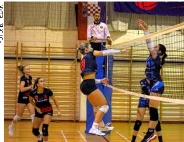
ŽOK Ivanec – ŽOK Kaštel Pribislavec 3:0

Obišli su i niz drugih znamenitosti i atraktivnih lokacija - palaču Bahia, botanički vrt Majorelle, džamiju Koutoubia, tržnicu Marakeš, imali prilike noćiti u beduinskom šatoru u pustinji i uživati u nevjerojatnim prizorima zvjezdanog neba, daleko od civilizacije. Posjetili su i grad Esauiru, spavali u tradicionalnom