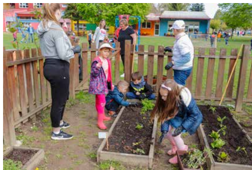
Zasađeni su i prvi „flanci“ u eko vrtu