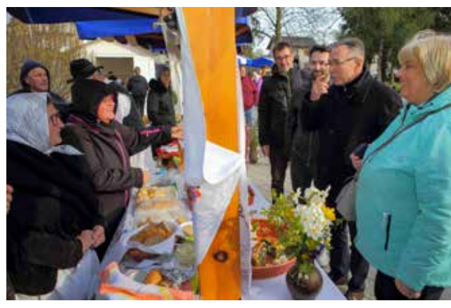
Na štandu Društva Maska Ivanec

KOMEDIJA Ivanec domaćin županijske smotre dramskih amatera