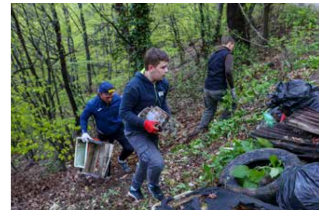
Otpad se skupljao po teškom, strmom terenu; je li nekoga sram zbog ovakvih prizora?

No, što se tiče problematičnog predjela ispod Sv. Duha, činjenica je da bi za uklanjanje velikih količina otpada, među kojim je i puno stakla i teškog građevinskog otpada, ovdje trebalo an-