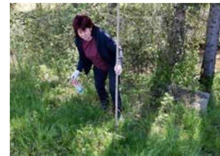
U uklanjanju tuđeg otpada iz prirode