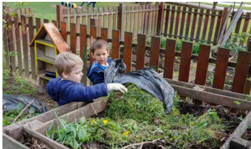
Ivanečki mališani znaju kamo s biljnim ostacima