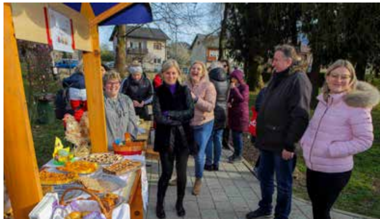
Izlagači u dobrom raspoloženju

sa 600 porcija papalina, a pojele se sve! Hvala svim udrugama, izlagačima i ostalim sudionicima (ukupno 19) koji su svojim sudjelovanjem uljepšali ovogodišnju uskrsnu atmosferu u našem gradu!(ljr)