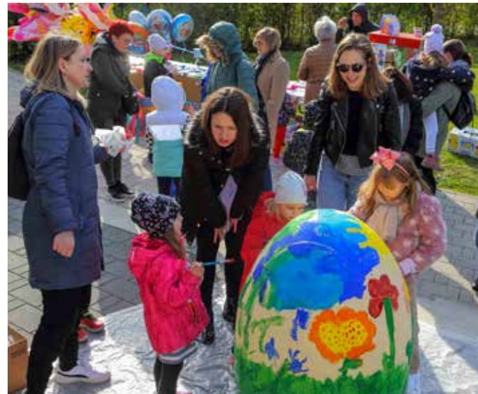
Dječje uskrsno veselje

Hrvatske vode u međuvremenu su krenule s radovima, međutim, pritom su izgradile betonske nosače mimo projekta. Na žalost, projekt na EU fondovima nije prošao jer se nije mogla dokazati opravdanost gradnje zbog neobrađenih poljoprivrednih površina. U novoj prijavi projekt gradnje mosta smo pokušali ojačati kroz interes povezivanja dva naselja, Stažnjecva i Salinovca, kao i kroz doprinos turističkom razvoju (bici-klističke rute i sl.), međutim, bez uspjeha, uz kontra-argumentaciju o tome da investicija nije opravdana kad se na drugu stranu može doći ili državnom ili županijskom cestom. Grad je u međuvremenu tražio i druge modele za gradnju mosta, međutim, s protekom vremena, a s obzirom na neobrađeno zemljište i upitnu svrishodnost, više se ne iskazuje interes na potreba za gradnjom mosta – odgovor je gradonačelnika M. Batinica.