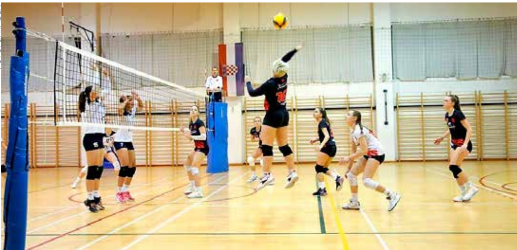
Dosad najbolji plasman 1. seniorske ekipe u 2. HOL Sjever