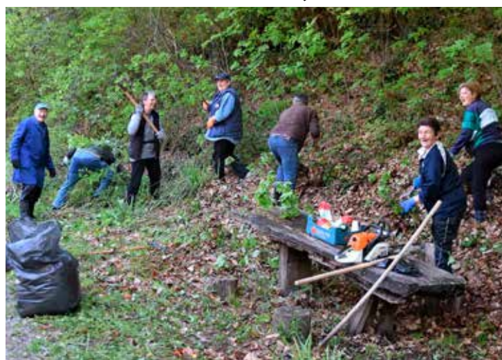
Hoće li pojedinci i dalje trebati skupljati otpad koji odbacuju njihovi susjedi?

–Redovito upozoravamo, apeliramo, razgovaramo s ljudima. Često dodem i sama poči-