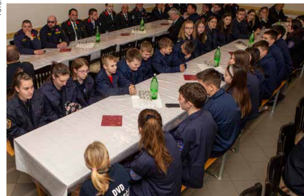
Najveći kapital DVD-a Margečan – više od 50 mladih i djece!

izvješća o radu u 2022. koje je na skupštini DVD-a iznio zapo-