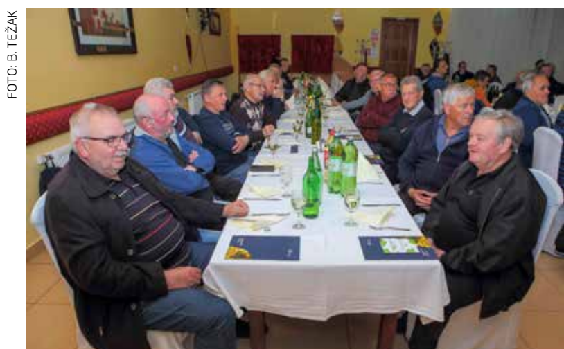
Udruga Peharček broji 170 vinogradara i podrumara

DVD MARGEČAN Održana Skupština DVD-a Margečan