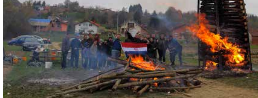
Vuzemnica kod Bijelog cvijeta zapaljena je na Uskrsu ujutro

Mještani Bedenca, Jerovca i okolice i ove su godine Uskrs obilježili tradicionalnim paljenjem vuzemnica. Slijedom običaja koji se od starina prenosi s koljena na koljeno, i ovoga su ih puta lokalni majstori i mladež sagradili od kalane vrbovine ili od suhe smrekovine te ih napunili šibljem iz vinograda i granjem crnogorice.