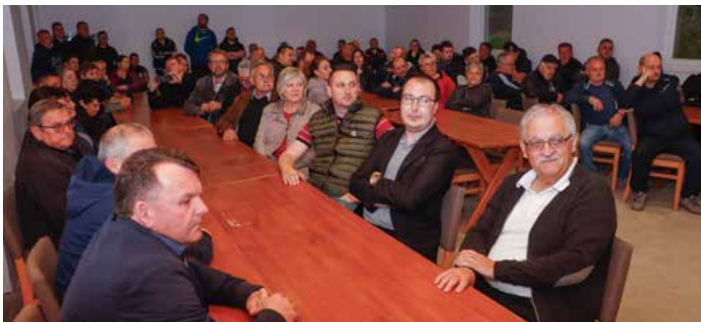
Cijelo Gradsko vijeće od samog je početka istaknulo jasno protivljenje kamenolomu