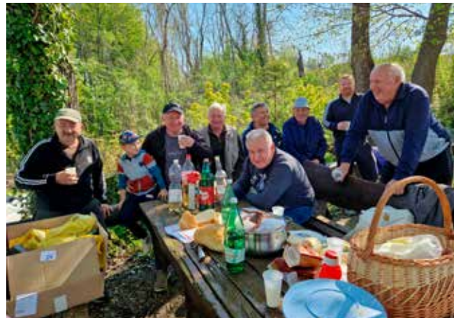
O, pa ovo uopće nije loše!

stare preše na Šatornjaku. Zima i atmosferske prilike ostavile su trag pa su vinogradari prelakirali klupu, putokaz i drvene dijelove.