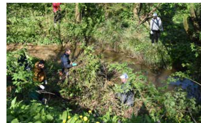
Volonteri iz MO Ivanec IV obavili su najteži dio posla uz potok Ivanuševec

GLJIVARSKO DRUŠTVO IVANEC Veterani čistke na svojoj ruti