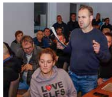
Vodstvo Eko udruge grubo je prozvalo kompletnu gradsku vlast, iako je upravo ona jedina 100% uz građane i daje sve od sebe da spriječi otvaranje kamenoloma