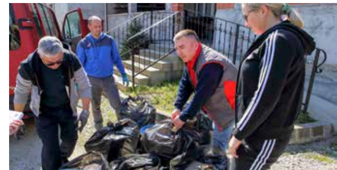
Pred utovar skupljenog otpada u Margečanu

♦♦ Akcija je bila dio projekta „Od izvora do mora“ koju u Hrvatskoj provode Coca-Cola, Udruga gradova, Konzum i Jutarnji list