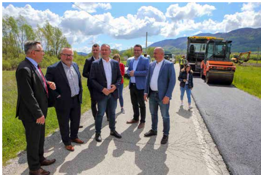
U obilasku ceste Kaniža-Jerovec na koju se upravo polagao novi asfaltni sloj

Uz projicirani postotak izdvajanja od 3% iz proračuna te sudjelovanje ŽUC-a i države,