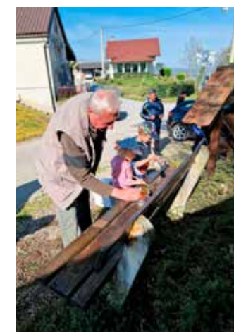
Zajedno se bolje radi

Posjekli su i uklonili suho raslinje, potkresali grane, pograbbjali teren i uklonili travu i lišće pa je ovaj prvorazredni vidikovac i prekra-