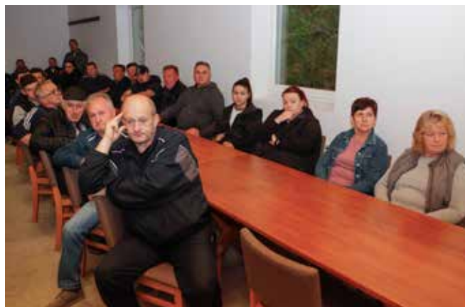
Građani: Krene li se s bilo kakvim konkretnim radovima, naš će odgovor biti žestok!