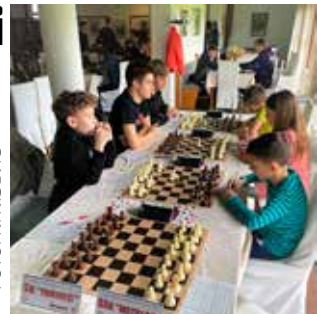
Ivanečki šahisti odlični na svim natjecanjima

Druga kadetska ekipa osvojila je 8. mjesto, dok su kadetkinje osme. Najbolja kadetkinja ŠK