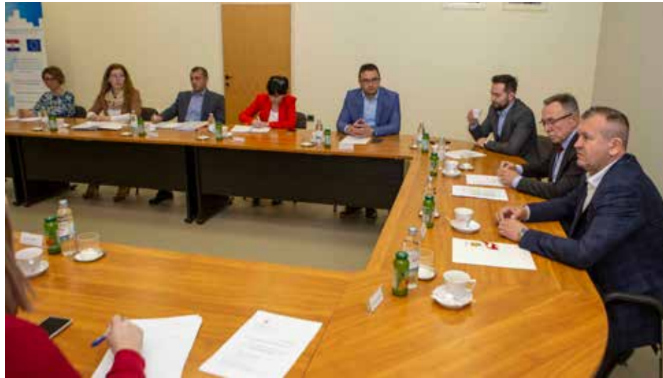
Na radnom sastanku u Gradskoj vijećnici operativno se razgovaralo o nizu tema