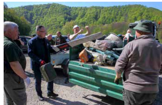
U pretovaru otpada s auto-prikolice na traktor