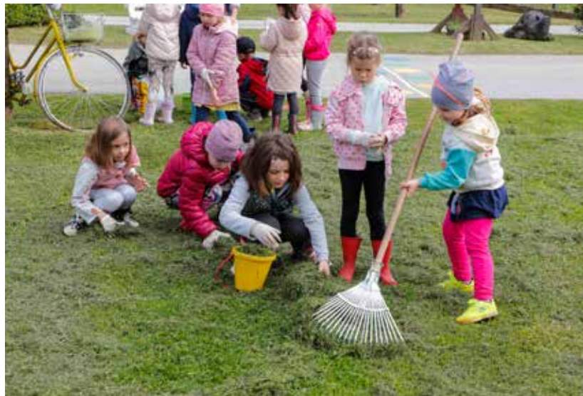
Proljetno pospremanje u vrtićkom krugu

Bravo za djecu i njihove odgojitelje koji naše malene od najmanjih nogu odgajaju kao ekološki svjesne male građane 21. stoljeća! (lir)