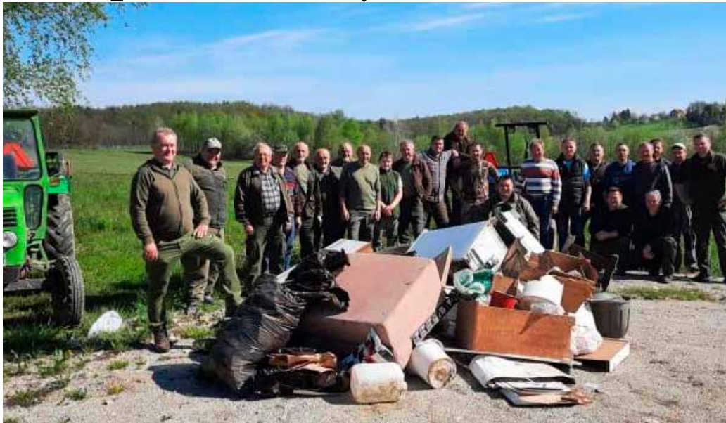
Članovi LD-a Jelen ponovno izvlačili otpad iz šuma oko lovačkog doma

HPD IVANČICA Dvodnevna eko akcija na Ivančici, planinari poručuju