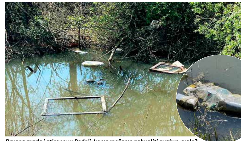
Drvena građa i stiropor u Bednji; kome možemo zahvaliti ovakvo ruglo?

–U Margečanu postoji dobra suradnja i koordinacija svih udruga po pitanju zbrinjavanja otpada. Imamo puno manje smeća i drago mi je da su ovdje ljudi shvatili važnost očuvanja