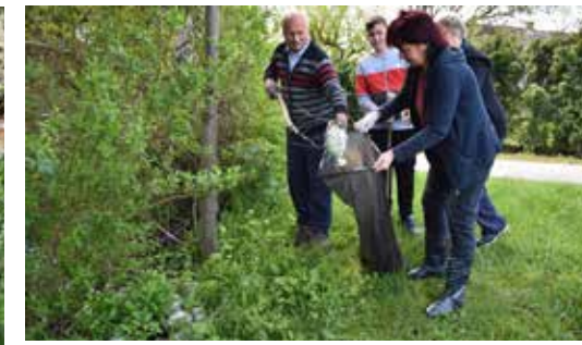
Hvala na svakom odvojenom satu za čistu prirodu!