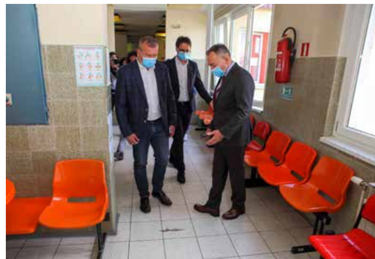
Grad Ivanec spreman godišnje izdvajati po 33.200 eura za obnovu Doma zdravlja