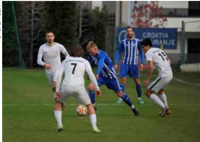
Odlična igra Ivančice u drugom dijelu prvenstvene sezone