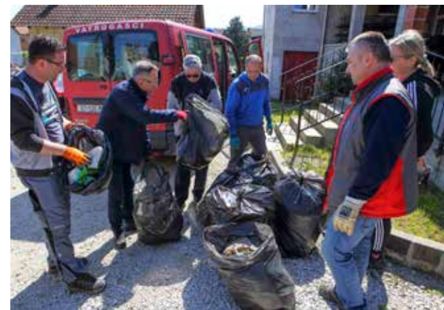
Gomile smeća izvučene iz graba pokraj ceste i uz rijeku Bednju

tiva za otvaranje kamenoloma, vidljivo je neraspodobljenje i zabrinutost građana ovoga kraja, kojima je otpad odbačen u prirodu tek sporedna stvar u odnosu na potencijalnu katastrofu koja im prijeti.(lir)