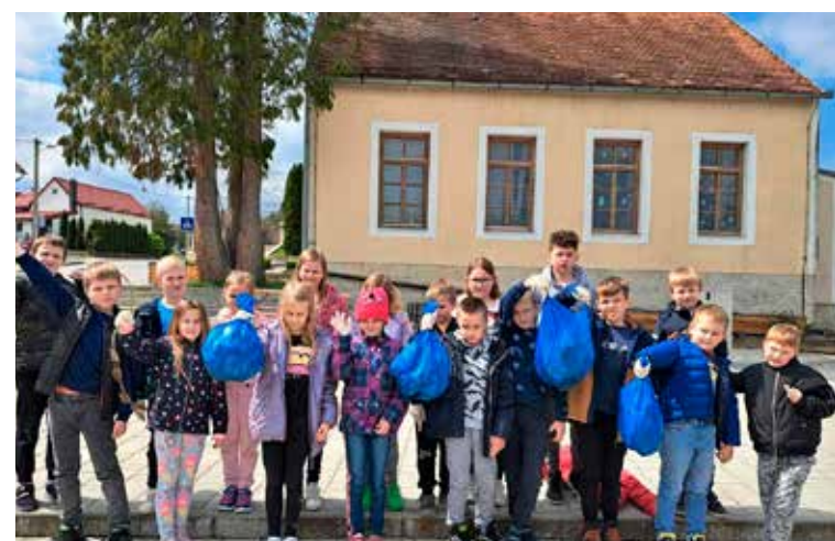
I učenici Područne škole Margečanu u Zelenoj čistki

Zemlje, 22. travnja, ubuduće podsjećati i zasađena magnolija. Baš