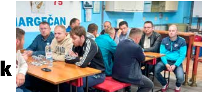
Sa izvanredne skupštine NK Mladost Margečan

Takva je odluka donesena na izvanrednoj skupštini kluba u petak, 21. travnja. Izboru novog vodstva prethodilo je izvješće