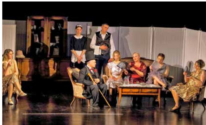
Komedijski u novoj predstavi Ljubavi pod krinkom

Umijeće slaganja vuzemnice prenosi se s generacije na generaciju