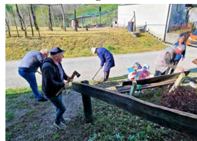
U akciji uređenja okoliša stare preše

Posjekli su i uklonili suho raslinje, potkresali grane, pograbbjali teren i uklonili travu i lišće pa je ovaj prvorazredni vidikovac i prekra-