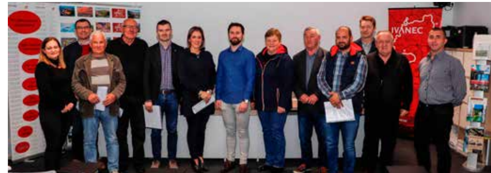
Korisnici prvih bespovratnih potpora Grada za energetske učinkovitost obiteljskih kuća

BESPOVRATNE POTPORE Prvi ugovori o bespovratnim potporama Grada za povećanje energetske učinkovitosti kuća