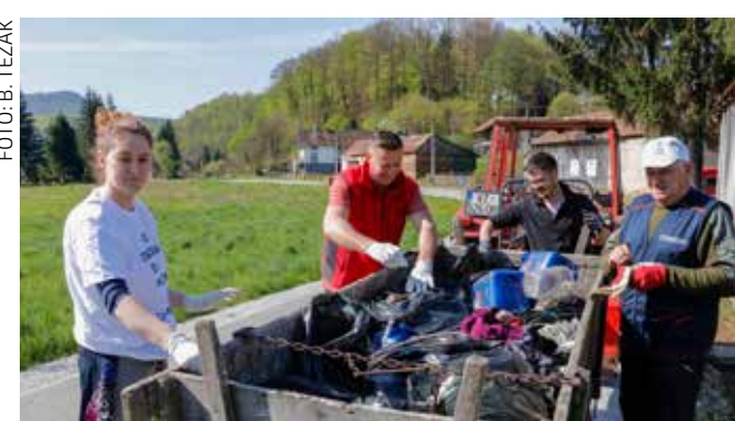
Ne odlažite otpad uz cestu Željeznica-Prigorec!

–Na žalost, kod nekih ljudi ekološka svijest nije proradila! Iako svi imaju sve dostupno po pitanju zbrinjavanja otpada,