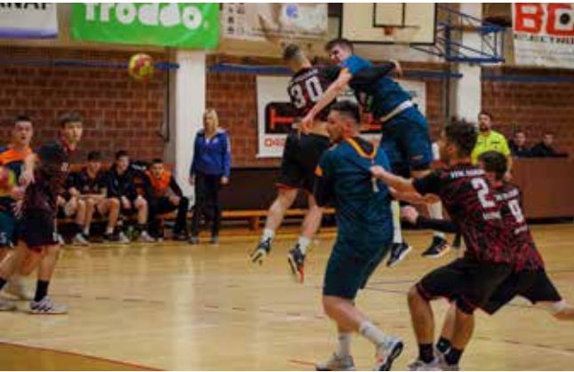
Niz pobjeda ivanečkih rukometaša