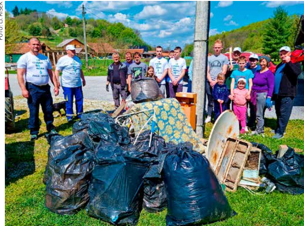
Nakon završetka akcije u Lukavcu

ZELENA ČISTKA IVANEC 2023. U akciji oko 600 volontera te 660 učenika i mališana