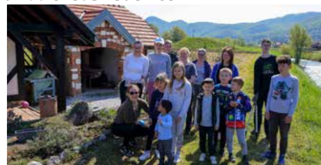
Veliki i mali uređivali okoliš vodenice u Margečanu

UDRUGA MARGARETA Veliki i mali uređivali okoliš vodenice