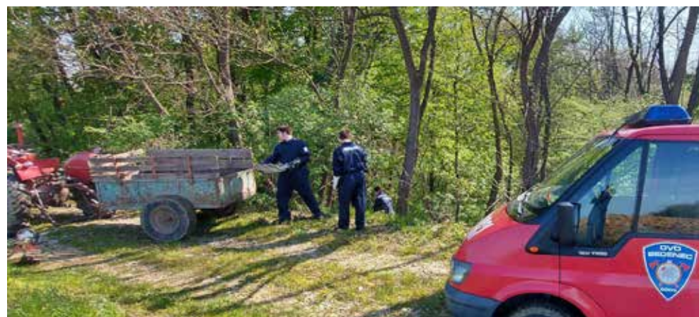
Članovi DVD-a potkresali su granje i uredili okoliš šumskih putova

Gradani i članovi UKS-a pokosili su igralište i uredili prostor oko Etno kuće. U akciji čišćenja šumskih predjela i zaseoka Petaki i Vuglači volonteri su pronašli odbačene salonitne ploče, ali i staklo, plastiku, metal, čak i WC školjku, pa se postavlja pita-