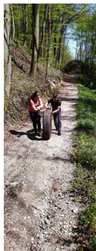
PK Ivanec obavio sjajan posao!

Akcija je trajala tri sata, nakon čega su se svi sudionici zajedno vratili na Žgano vino, gdje ih je već čekala okrepa, nakon čega je druženje nastavljeno u neformalnom tonu. (nn)