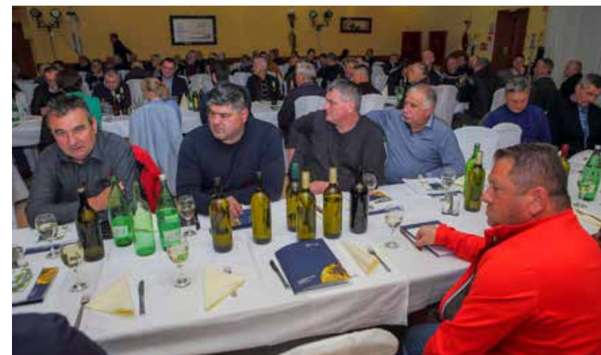
Skupština je dobra prilika da se vinogradari pohvale svojim vinima

vanje o zaštiti vinove loze, nakon čega je druženje nastavljeno u neformalnom tonu.(aj)