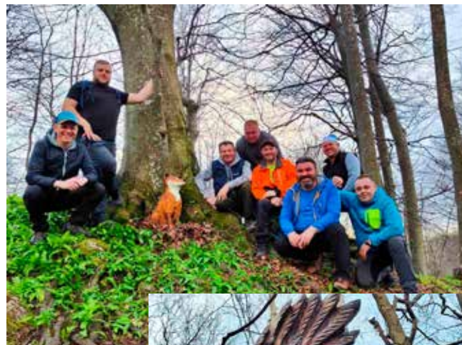
Iznad Črnih mlaka čeka vas lisica