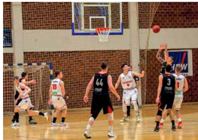
Dobar plasman KK Ivančice u 2. HKL Sjever