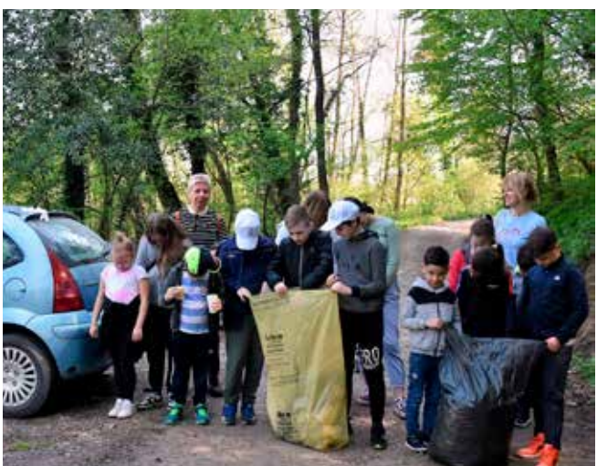
Udruga udomitelja Nada redoviti je i vrijedan sudionik svake Zelene čistke

–Čistimo od jutra! No, uz gustu šikaru, problem je i to što je