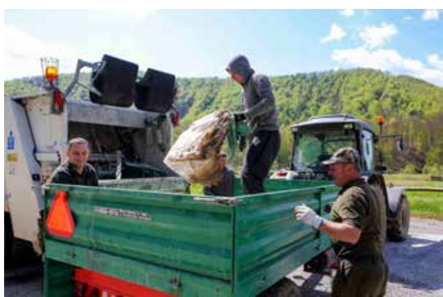
Sav otpad – u Ivkomov „smečar“

♦♦ Oraspoložen lijepom akcijom lovaca, jedan vozač stao je i poklonio im 40 eura – da se počaste pićem!