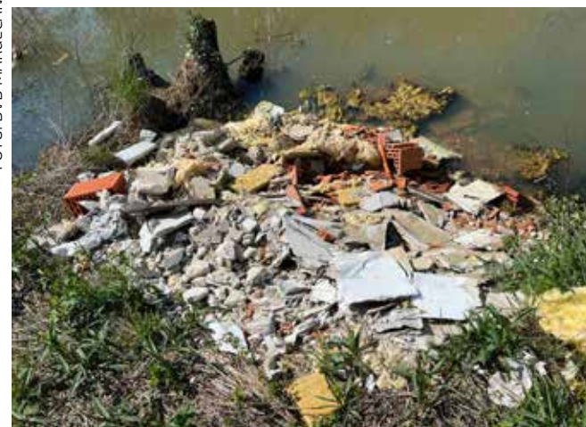
Novootkriveni deponij građevinskog otpada kraj Bednje u Margečanu – nedopustivo!

Gradski komunalni redar može intervenirati i temeljem Zakona o građevinskoj inspekciji te vam narediti sljedeće: uklanjanje ruševine zgrade ili cijele građevine, otklanjanje oštećenja pročelja i pokrova postojeće zgrade koji nisu nosiva konstrukcija te usklađivanje provedbe i uklanjanje zahvata u prostoru koji nije građenje. Također, može vam narediti i privremenu obustavu izvođenja radova, dovršetak vanjskog izgleda zgrade te izlaganje energetskog certifikata.