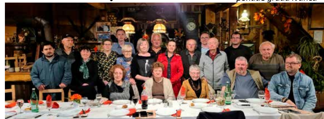
Kolekcionari na skupštini u Grešnoj pilnici

osvrnuo na postave članova udruge u izlogu Chibo centra u Ivanu, u Muzeju planinarstva, Grešnoj pilnici, u Kamenj Gorici te na tiskanje poštanskog žiga i omotnice u povodu 160. obljetnice rođenja Nikole Fallera. Glavni projekt bio je izdavanje 14. broja