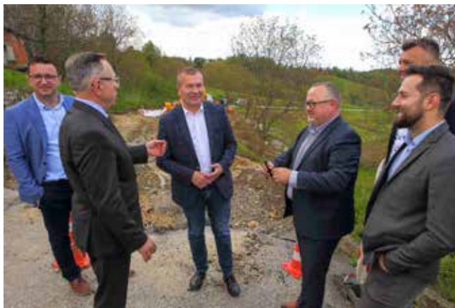
Obilazak sanacijskih radova na velikom klizištu u Gačicama

oformio bi se tzv. fond lokalne samouprave putem kojeg bi se u ŽUC-u mogla skupiti sredstva u iznosu od oko 4 milijuna eura (cca 30 milijuna kuna). To je već