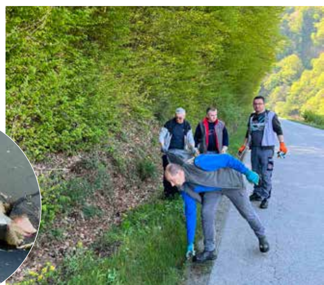
Volonteri su očistili smeće koje vozači odbacuju u grabe

donačelnik M. Batinić pa je sav prikupljen otpad po kratkom postupku završio u komunalnom vozilu Ivkoma.(lir)