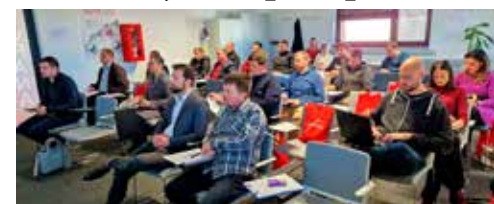
Na Danu otvorenih vrata za mlade poduzetnike

Nakon uvodnih riječi zamjenika gradonačelnika Marka Friščića, koji je istaknuo kako je i ovo događanje nastavak podrške Grada razvitku poduzetništva, u nastavku su okupljenima predstavljene potpore Grada namijenjene toj skupini poduzetnika, a koje uključuju čak 14 mjera.