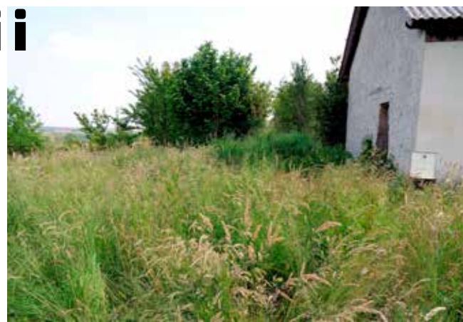
Obveza svakog vlasnika/korisnika jest redovito održavanje okućnice i košnja trave i raslinja

Stoga apeliramo na sve vlasnike njiva, voćnjaka, livada i vinograda na cijelom području grada Ivanca: Ne zapuštajte svoje površine! Ako su zarasle korovom, trnjem i grmljem, očistite ih što prije!