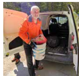
Prepoznajte li netko svoj otpad? Pronađen je na Ivančici!

pronađena i velika traktorska guma, auto guma i plastična ambalaža te stari željezni „pleh“ za kotlovinu. Na potezu prema vrhu, planinari su se mjestimično spuštali i 50 metara niz padinu te iz prekrasnih šuma na cestu izvlačili najrazličitiji odbačeni otpad – pivske limenke, rat kape, akumulator,