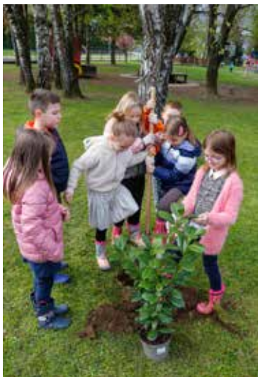
Lovor višnja uspješno zasađena!

Maleni su očistili dvorište od suhog granja i lišća, uredili cvjetne gredice te u svom eko-vrtu zasadili presadnice rajčice, paprike i drugog povrća koje su sami uzgojili u sklopu edukativnih aktivnosti o sjetvi. Uredili su i nasad kupina, zasadili