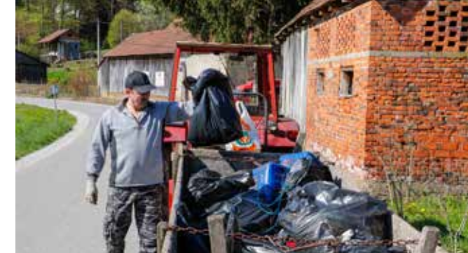
U Ivanečkoj željeznici