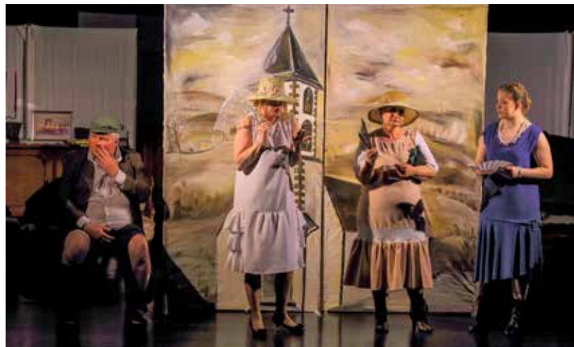
Velik trud uložen u scenu i kostimografiju

KOMEDIJA Ivanec domaćin županijske smotre dramskih amatera