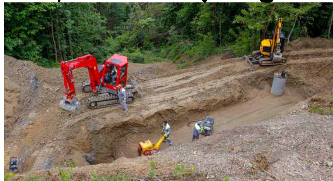
Od 2018. do 2022. na području grada sanirano je čak 9 klizišta u vrijednosti od 4,67 mil. kn

Podsjećamo, visok udio financiranja od strane Hr-