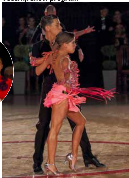
U vrućim latino-američkim ritmovima

plesno umijeće pokazalo je oko 250 natjecatelja iz 16 klubova, a večernja finalna natjecanja je u ime pokrovitelja, Grada Ivanca, otvorio zamjenik gradonačelnika