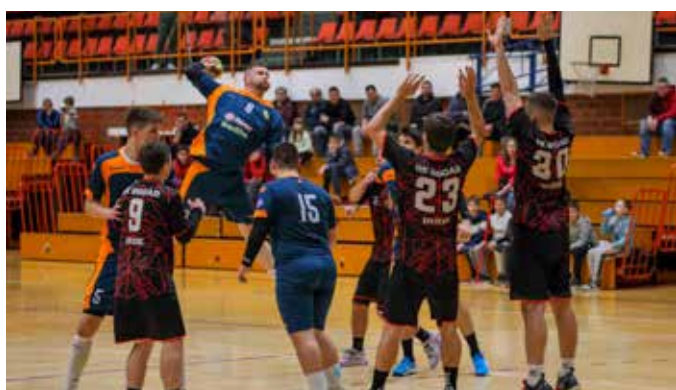
Ivančica sjajna u nastavku prvenstva