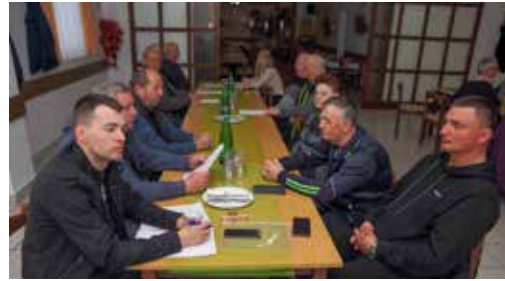
Udruga invalida ILO okuplja članove iz jedne od najsenzitivnijih grupacija

gati članovima, posebno u svjetlu ovogodišnje proslave 45 godina rada udruge. Želim posebno