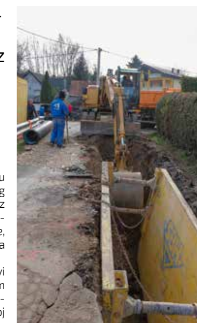
Grad Ivanec: Svugdje gdje je moguće proširenje do 3 metra

Kao što je poznato, tipa na ulazu u gradski park dugovječni je simbol Ivanca. Stari zapisi navode da je vjerojatno zasadena početkom 14. stoljeća, što znači da je stara više od 600 godina. Budući da su starost i zub vremena ozbiljno načeli lipu, Grad Ivanec odlučio ju je sačuvati tako da je klonira. S tim je projektom Grad je zapo-