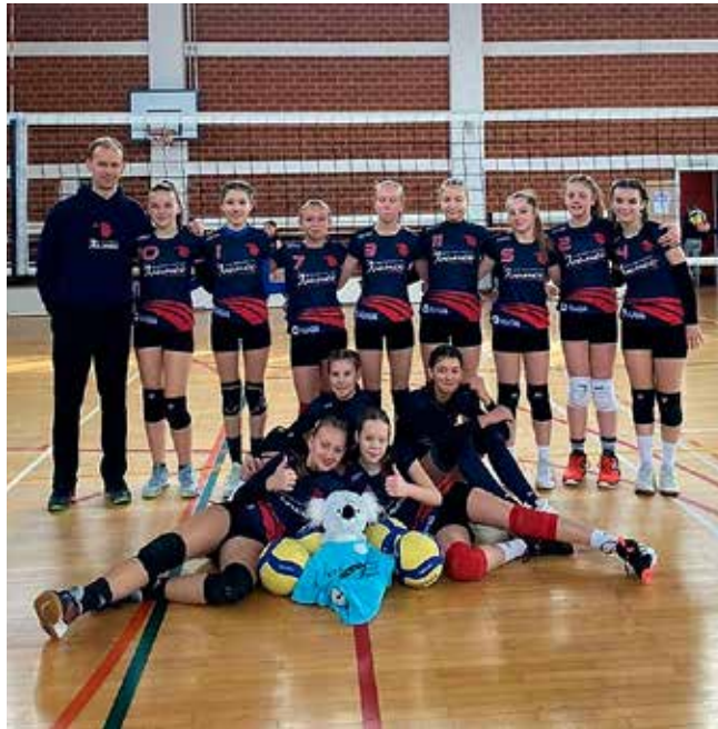
Zlatna ekipa U-13

Odbojkašice prve seniorske ekipe ŽOK Ivanec u nastavku prvenstva zabilježile su pobjede nad Nedelišće Eltingom i ŽOK Vrbovec s 3:0, dok je u utakmici 19. kola ekipa Ivanca poražena od Velike Gorice s 0:3.(nn)