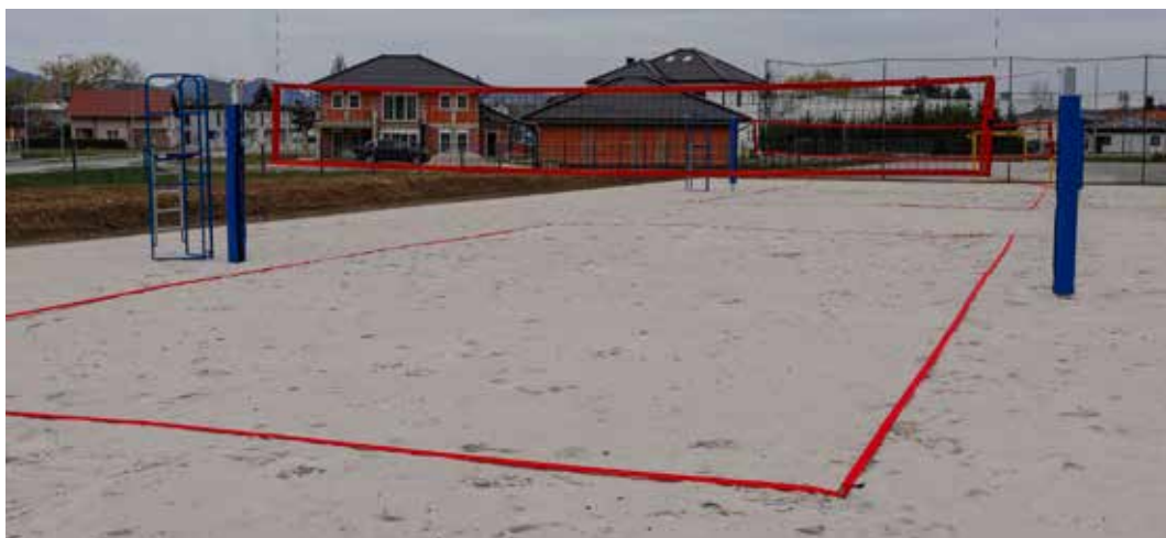
Uz dva novosagrađena igrališta uskoro i tribine sa 100-ak mjesta s istočne strane

♦♦ Investiciju od 76.680 eura (577.400 kn) u omjeru 50:50 financirali su Grad Ivanec i Varaždinska županiju; u drugoj fazi stižu tribine sa 100-ak sjedaćih mjesta