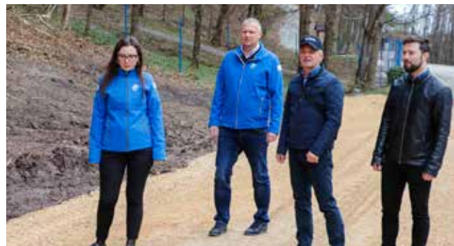
Na novouređenom parkiralištu za 20-ak vozila kod Žganog vina

SVJETSKI DAN VODA Uređen okoliš Žganog vina i parkiralište za 20-ak vozila