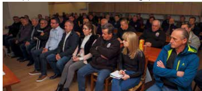
S redovitog Sabora UDVDR-a - Ogranak Ivanec

Poseban naglasak stavljen je na planirano otvaranje Memorijalnog centra Domovinskog rata u rujnu ove godine, a radovi na ob-