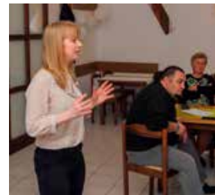
Jagetić: Udruga ILO u fokusu Grada Ivanca

-I dalje ćemo nastaviti biti što aktivniji i poma-