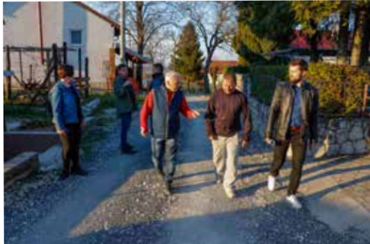
Sa stanarima u obilasku Vinogradske ulice

Naime, na cijelom tom području (Vinogradska, cijeli potez od Kukuljevićeve do O. i P. Hrazdira) prometnice su zbog zatečenog stanja (prostor koji je iz nekadašnjih vikend zona prerastao u zone trajnog stanovanja) zahtjevne za proširenje jer za to fizički nema dovoljno mjesta. Stoga je Grad Ivanec još prije nekoliko godina tražio adekvatna rješenja za uređenje prometa u ovim ulicama.