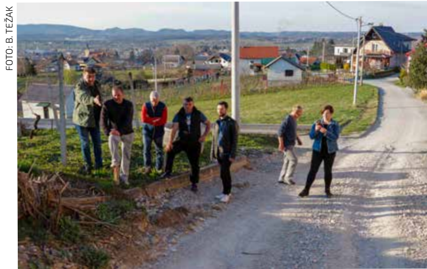
Za proširenje pojedinih dionica fizički nema dovoljno mjesta

U traženju optimalnih rješenja za promet, Grad razmišlja o drukčijim, konkretnim izvedbenim mogućnostima (primjerice, uređenje mimoilaznica) kojima bi se u kratkom roku mogao olakšati promet. No, to će svakako biti tema o kojoj će još razgovarati sa stanarima Vinogradske, a sagledat će se i mogućnosti da se na sličan način pokuša riješiti i cijeli potez od Kukuljevićeve do O. i P. Hrazdira.