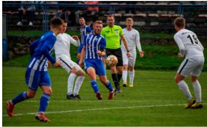
Ivančica je u nastavku prvenstva nanizala nekoliko uzastopnih pobjeda