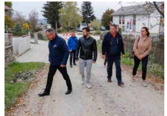
Iako je riječ o županijskoj cesti, Grad Ivanec spreman je novčano podržati uređenje cijele dionice kroz Punikve

Projektna dokumentacija je izrađena krajem 2021. godine, da bi se onda na mišljenje Ministarstva gospodarstva i održivog razvoja o prihvatljivosti toga zahvata na okoliš čekalo gotovo godinu dana.