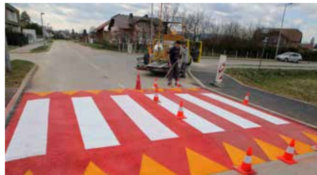
„Hupser“ kod raskrižja Gajevo-Preradovićevo

dan u Šabanovoj ulici, nadomak Osnovne škole, jedan ispred raskrižja Gajevo-Šabanova i jedan u Gajevoj ulici, prije raskrižja s Ulicom P. Preradovića. Uspornici na kolniku su na odgovarajući