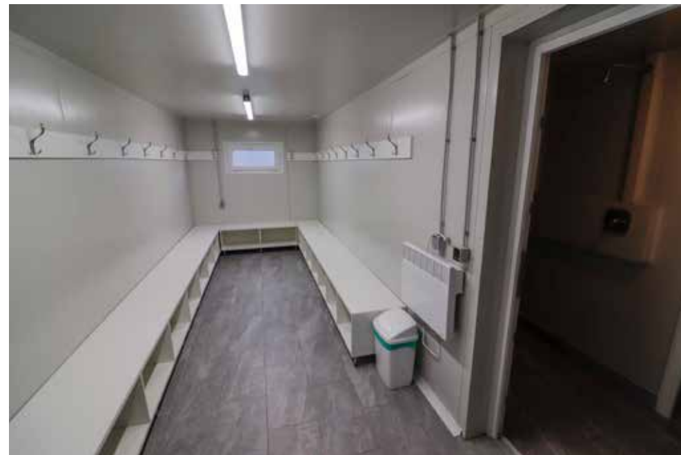
Objekt je moderno opremljen i potpuno uređen od poda do krova

–Ovo ulaganje jest, prije svega, ulaganje u zdravlje, djecu i mladost! Upravo to i jesu ciljne skupine na koje je Grad usmjeren i to je nešto što Ivanec i NK zaslužuju. Ovdje neće-