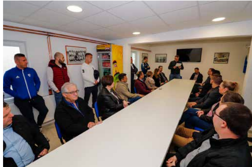
Grdak: Nadam se da s ovim nećemo stati, Ivanec treba kvalitetan sportski centar

izrada idejnog rješenja objekta na igralištu NK Margečan, a uređeno je i pomoćno igralište u Salinovcu i opremljeno modularnim objektima.