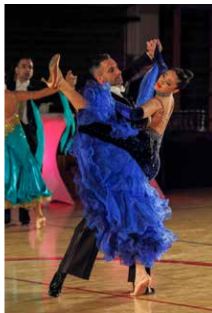
Klasična ljepota standardnih plesova

plesno umijeće pokazalo je oko 250 natjecatelja iz 16 klubova, a večernja finalna natjecanja je u ime pokrovitelja, Grada Ivanca, otvorio zamjenik gradonačelnika