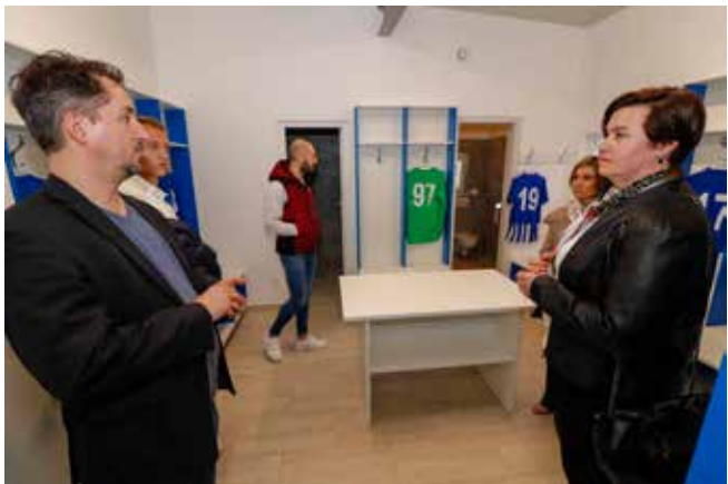
U obilasku novouređenih prostora

–Živimo u dobrim i privilegiranim vremenima za nogomet! Na vama, kao domaćinima, jest da