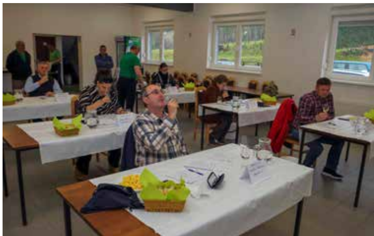
Sedmeročlana komisija kušala je i ocijenila vina berbe 2022.

Enolozi su 26 vina ocijenili zlatnima, 59 srebrnima, a 22 brončanima, dok je 14 vina nagrađeno priznanjima. Nagrade vinogradarima bit će dodijeljene na završnoj izložbi u lipnju, u povodu Dana grada. Ocjenjivanje i ove godine novčano podupire Grad Ivanec. (lir)