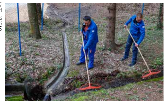
Čišćenje okoliša Žganog vina

Bila je to prilika za ponovno podsjećanje na najveće prirodno blago koje Ivanec posjeduje,