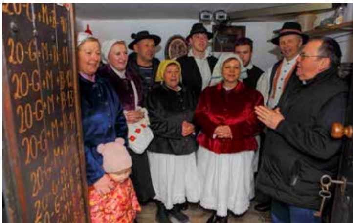
Na blagoslovu klijeti