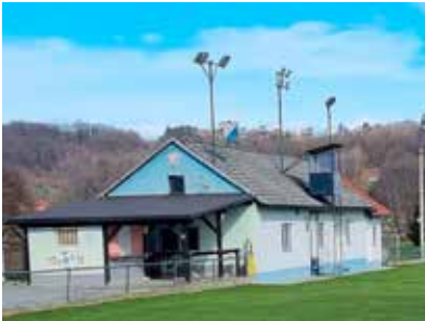
Osigurana sredstva za rekonstrukciju objekta NK Mladost

- naknada za troškove stanovanja korisnicima zajamčene minimalne naknade, pomoć po pojedinačnim za-hrvajima u novcu i u naravi, pomoć za rođenje djeteta, donacije udruga-ma umirovljenika, drugoga osoba s teškoćama u razvoju i invaliditetom, pomoć najstarijim građanima za blag-dane, pomoć u kući starijim osobama, donacije Zakladi Grada Ivanca, pomoć za podmirjenje odvoza otpada samač-kim domaćinstvima, novčana pomoć građanima s niskim primanjima, nov-čana pomoć za umirovljenike