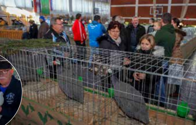
I biserke na izložbi malih životinja