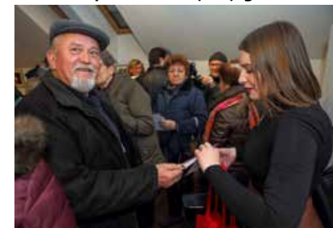
Turistička zajednica: Razglednice svima, najsretnijima promo paketi!