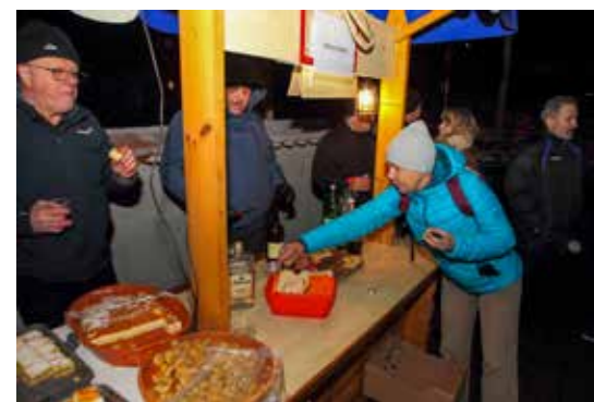
Pune ruke posla s rezanjem jegera!