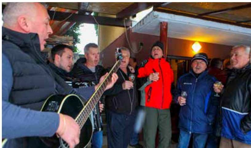
„Popevali bumo sunce dok ne zajde...”