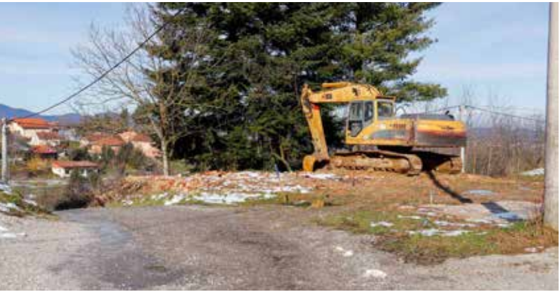
Pripremni radovi na uređenju prometnice Cesarčeva-Vukovićeve

UNAPREĐENJE STANOVANJA I ZAJEDNICE (41.000 eura) Zbrinjavanje napuštenih životinja, dezinfekcija, deratizacija