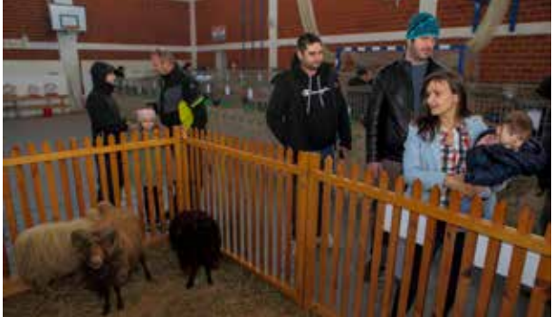
I ovčice pasmine quessan vole pažnju posjetitelja

belgijskih orijaša bavi već 40 godina, a u udruzi je aktivan i sa svoje 83 godine. A članovi Faune i ovog puta pozivaju sve zainteresirane za uzgoj malih životinja, da im se jave. S novim članovima spremni su podijeliti svoja iskustva u uzgoju i selekciji, uz naglasak da bavljenje ljubimcima uzgajivaču donosi puno zadovoljstva i psihičke relaksacije. I ove godine izložbu je novočano podržao Grad Ivanec, a izlagače je obišao i zamjenik gradonačelnika Marko Friščić. (aj,ljr)