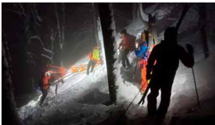
Na žalost, neodgovornost često rezultira po život teškim ozljedama

U zimsko vrijeme ovih se pravila pametno pridržavati: provjerite vremensku prognozu, razmislite o vlastitoj kondiciji, obavijestite bližnje o planiranoj rutu, ponesite topli čaj, čokoladu ili sl. Ponesite mobitel s punom baterijom, naglavnu svjetiljku i komplet prve pomoći koji sadrži astro foliju. Naučite kako s mobitela poslati podatak o vlastitoj lokaciji. Nosite rezervnu toplu odjeću!