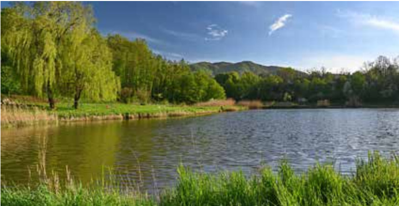
Kreće izrada projekata za Gradsku park šumu Iwanečka jezera

kapitalne donacije župama za zaštitu i čuvanje sakralnih objekata i povijesnog inven-tara u njima