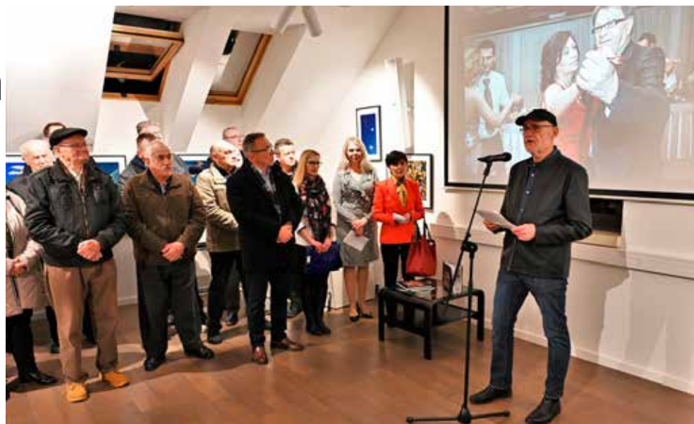
Publici se obratio i autor

od 1978., sudjelovao je na oko 300 izložbi, od kojih 100 u inozemstvu, nagrađivan je 80-ak puta, među ostalim i u SAD-u, Argentini, Koreji, Poljskoj, Engleskoj itd. Radio je i kao reporter za Večernji list, Cro-pix i Pixsell, a već niz godina službeni je fotograf Grada Ivanca i Ivanečkih novina. S nevjerojatnih milijun fotografija, većinom sačuvanih na diskovima, slobodno se može reći da posjeduje najimpresivniju fotografsku zbirku u povijesti Ivanca.