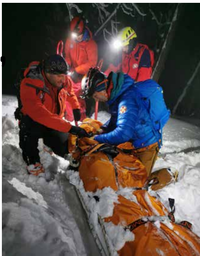
Sve je veći broj nesreća na Ivančici koje iziskuju angažman HGSS-a

Uz iskusne planinare (to nisu oni sa 100 uspona godišnje preko Konja!), Ivančicu posjećuju i izletnici koje bismo mogli svrstati u „outdoor neznalce“ i početnike, i to u svim vremenskim uvjetima. Važno je ne podcijeniti uvjete koji nas gore čekaju. Zaboravite na priču: „Meni se ništa ne može dogoditi!“