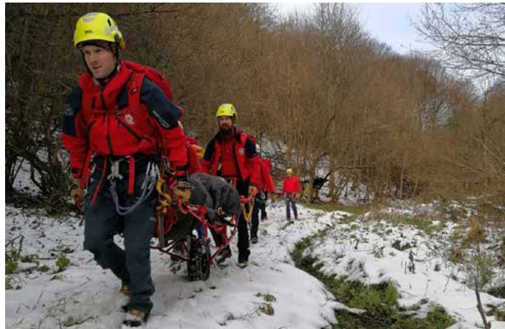
HGSS: Mukotrpní transport na nosilima