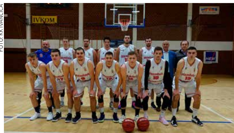
Košarkaški klub Ivančica ekipno najbolji u 2022.

NK IVANČICA Masovan odaziv dječjem malonogometnom turniru