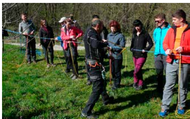
Cilj škole jest stjecanje znanja i vještina potrebnih za sigurno kretanje i boravak u planinama

Uz zbrinjavanje i transport unesrećenih osoba, volonteri HGSS-a u intervencijama se susreću i s brojnim nepotrebnim teškoćama kao što su: nepoštivanje prednosti vozila pod rotirkama i sirenom; šumski putevi koji su blokirani namjerno oborenim stablima ili zatvoreni rampama pa su motorna pila i akumulatorska kutna brusilica postali dio opreme.