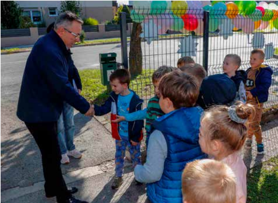
Ove godine slijede dva najsčekivanija projekta: dogradnja Dječjeg vrtića u Ivancu i gradnja novog u Radovanu

malnih odluka vezanih uz život i urednost naših naselja. Vaša mišljenja osobito su nam važna i u vremenima poput ovih, kada je naš Grad za zaštitu svojih interesa prisiljen pravdu tražiti peticijama i tužbama protiv države.