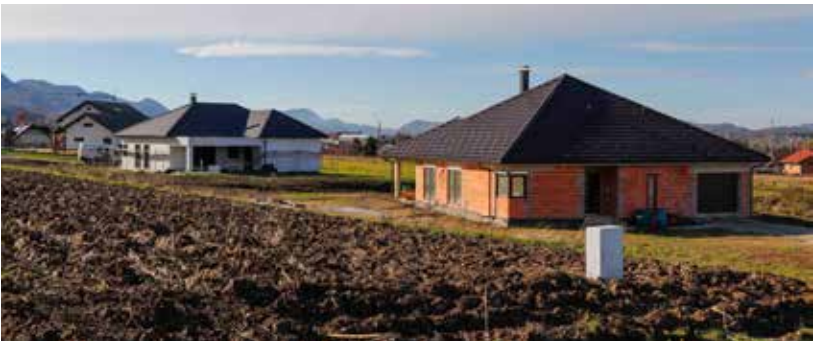
Ove godine probijanje novih prometnica u građevinskoj zoni Gmajna

3. Rad političkih stranaka (donacije političkim strankama te-meljem zastupljenosti članova u Gradskom vijeću) 15.661,29