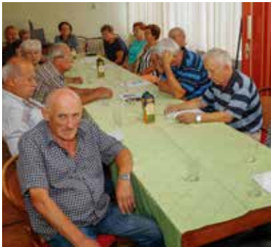
I ove godine Grad pomaže rad udruge umirovljenika na gradskom području

–Povećana ulaganja za kulturu i udruge, bogatiji Dani grada i Advent u Ivancu, nastavak povećanih ulaganja u vatrogarstvo (nabava novih vatrogasnih ljestava za DVD Ivanec), opremanje društvenih domova širom grada, dovršetak energetske obnove stare škole u Salinovu. No, sve izneseno tek je dio svega onoga što Ivanec očekuje u 2023. godini.