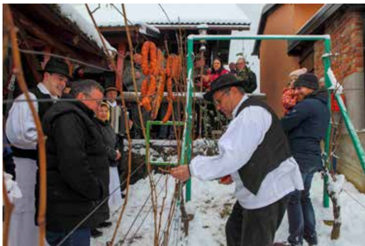
Prve šibe su orezane

Nakon blagoslova gorica, uslijedilo je druženje uz glazbu i ples KUD-a Salinovec, a uživalo se uz domaće specijalitete i kolače koje su ispekle salinovečke gazdarice. Vlč. Piskač potom je obišao i nekoliko klijeti na Šatornjaku te ih blagoslovio, uz neizostavno kušanje najboljih vina ovdašnjih podrumara.(ljr)