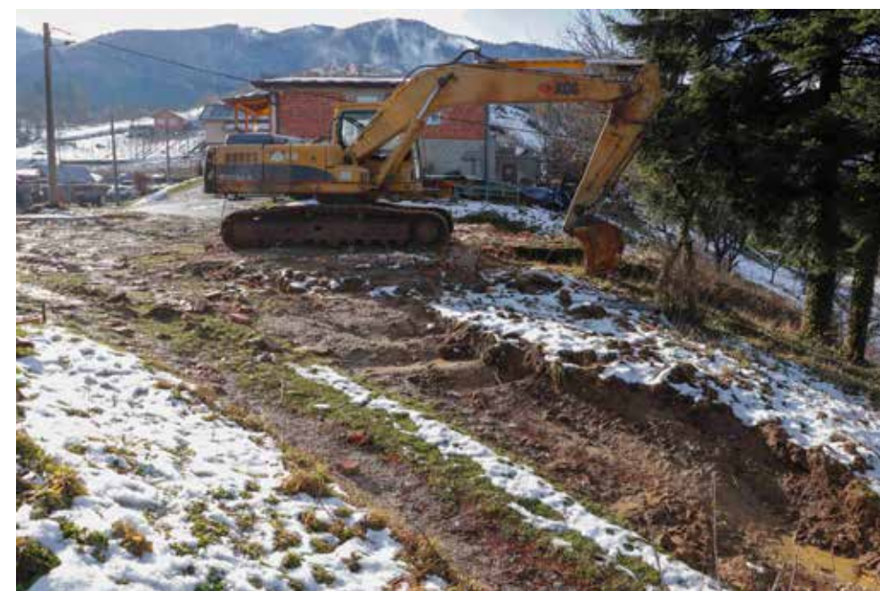
Pripremni radovi su počeli, na dijelu trase buduće nove ceste srušen je stari objekt

Čišćenjem dijela trase i rušenjem objekta u dvorištu kojim će ići nova trasa prometnice počeli su pripremni radovi na velikom prometnom projektu – predstojećem proširenju Ulice Augusta Cesarca u Ivancu. Radovi su trebali početi još prije godinu dana, međutim, cijelo to vrijeme projekt je sta-