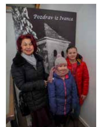
Pozdrav iz Ivanca!