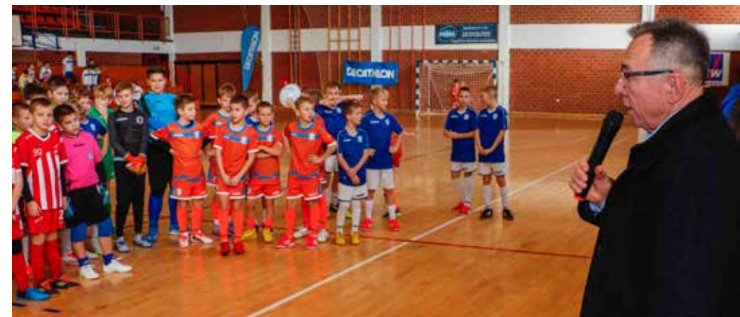
Batinić: Čestitke NK Ivančici, volonterima i roditeljima na uspješnoj organizaciji Ivanec kupa

Među brojnim ekipnim sportovima u Ivanu, nogomet je najpopularniji kod djece i mladih. Drago mi je što sport djecu dovodi na terene i što Grad Ivanec može poduprijeti jednu ovakvu manifestaciju korisnu za djecu u svakom pogledu - poručio je gradonačelnik i zahvalio svima koji daju vjetar u leđa bavljenju