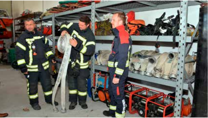
Osigurana sredstva DVD-u Ivanec za nove vatrogasne ljestve

Programi potpora poduzetništvu subvencije kamata, promidžba Grada i posjet poslovnim sajmovima, sufinanciranje sudjelo vanja poduzetnika na gospodarskim sajmovima, otplata kredita za Poslovnu zonu d.o.o., Projektni ured) Programi razvoja turizma djelatnost TZ Grada Ivanca, definiranje pojavnosti Grada Ivanca i ivanečkoga kraja, subvencije u turizmu