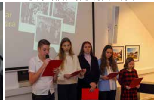
Posveta znamenitim fotografima u izvedbi učenika OŠ Ivanec