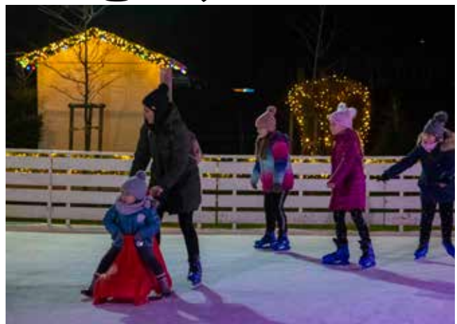
Osigurana su i sredstva za klizalište i Advent u Ivanecu u sezoni 2023./2024.

-Uz puno zdravlja i čestitki na obljetnicama koje obilježavaš upravo ove godine, želim ti da i dalje neumorno trčiš od događanja do događanja te ih tako pretvaraš u jedinstvenu ivanečku foto-kroniku – poželio je Batinić Težaku te izložbu proglasio otvorenom.