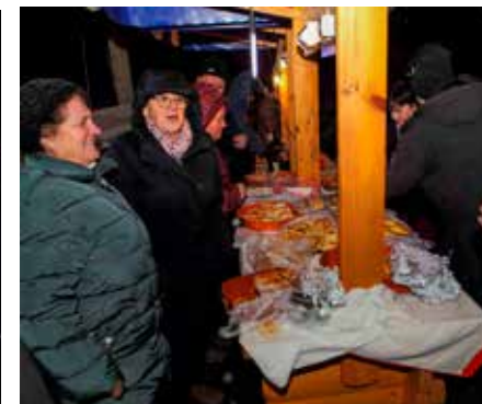
Brdo kolača kod Društva Maska