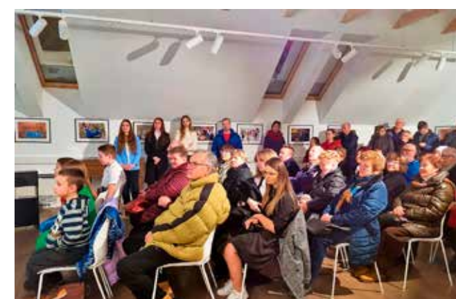
Zanimljivo u Muzeju planinarstva