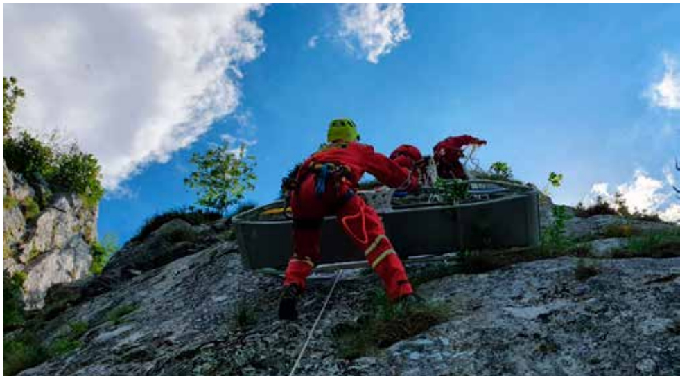
Spašavanje s visina