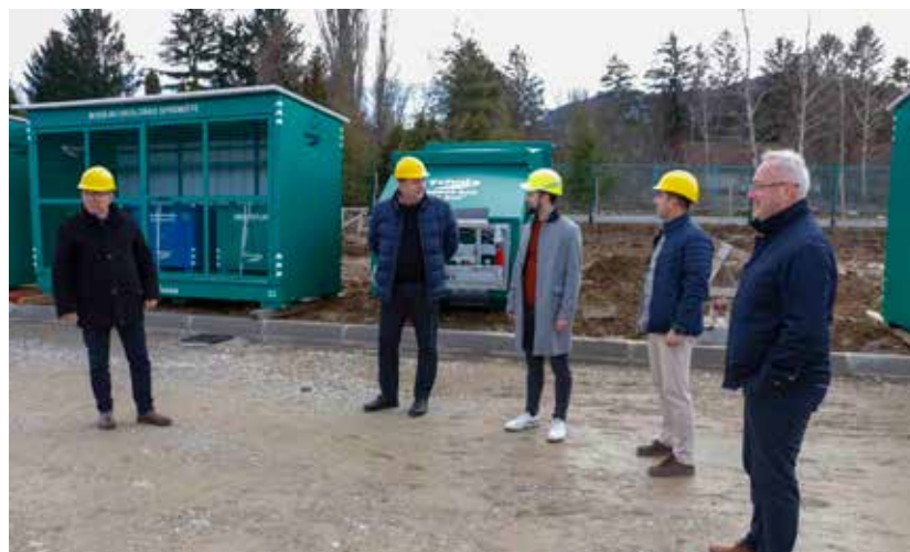
Gradski čelnici sa suradnicima iz Ivkoma i Hidroinga u obilasku gradilišta

prometnica i podloge na koju će se postaviti kontejneri. Podloga je vodonepropusna, s uređenom oborinskom odvodnjom i separatorom, te osigurava najviše ekološke standarde u prihvatu i privremenom odlaganju svih vrsta otpada. Također, uređuju se i površine koje će se u proljeće ozeleniti. -U dvorištu će biti postavljeno 50-ak otvorenih i specijalnih zatvorenih kontejnera. U njih će građani bez naknade moći odložiti sav neopasni i posebne vrste otpada. Prostor je ograđen, do njega vodi novosagrađena