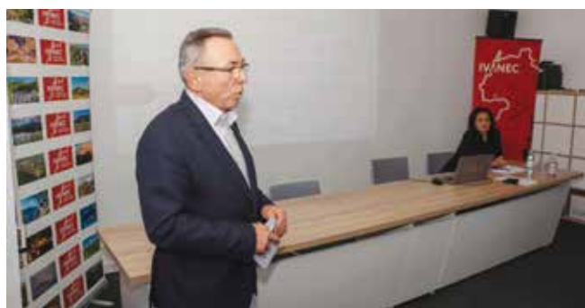
Batinić: Grad će definirati nove zone za poduzetnička ulaganja

izmjenama županijskog prostornog plana Gradu Ivancu blokirano 15 ha površina namijenjenih gradnji novih pogona u Industrijskoj zoni. To se dogodilo zato što je Županija u prostorni plan ugradila odredbe Nature 2000 te zbog zaštite određenih biljnih i životinjskih vrsta zabranila gradnju na ovom prostoru. Ovo je čudno. Naime, Natura je