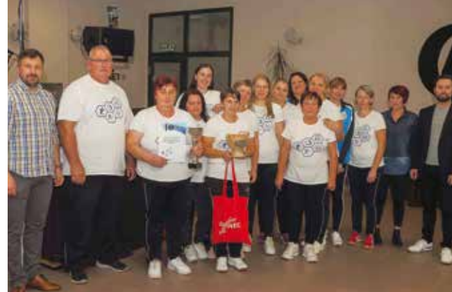
Sjajna salinovečka ekipa druga na 16. državnom festivalu!

Zahvalnice i nagrade svim ekipama podijeljene su na neformalnom druženju u KTC-u. Uz promo planinarske torbe Grada Ivanca za svih 30 ekipa, pobjedničke pehare najboljima uručio je zamjenik gradonačelnika Marko Friščić.