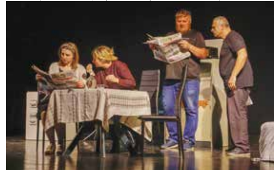
Stažnjevečki Komedijaši u (O)glasu savjesti

U subotu, 26. studenog, raspoložena publika koja je u Noći kazališta do posljednjeg mjesta ispunila Kino Ivanec, sjajno se bavljala uz dvije pučke komedije. Prvu je, Štefek soldat, izvelo amatersko kazalište ZAMka iz Zelene, dok su drugom predstavom, (O)glas savjesti, publiku nasmijali članovi