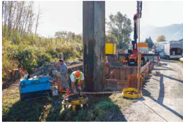
Ivanec i okolica veliko su gradilište

proračunu osigurao i za iduću godinu. Nadam se da će se ugovoreni rokovi poštivati, kako bi građani napokon mogli konzumirati rezultate projekta koji se pripremao 10 godina. Što se tiče promjena u izvoru financiranja, smatram da je to preveliki projekt a da bi ga država mogla dovesti u pitanje, a što i dokazuje