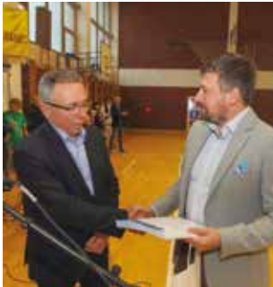
Zahvalnica generalnom pokrovitelju, Gradu Ivancu

Kraći glazbeni program na otvorenju su izvele članice ŽVS Katiope i folkloriši KUD-a Salinovca. Nakon razgibavanja i zagrijavanja za natjecanja koja je uz glazbu vodio Kruno Poje, uslijedila su višesatna natjecanja na višećoj kuglani, u pikadu, vođenju nogometne lopte, bacanju lopte na koš, u gađanju mete rukometnom loptom i bacanju koluta.