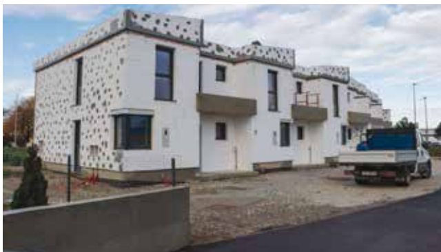
Za stanovima i kućama u Ivancu vlada velika potražnja

–Stanova nema dovoljno, a vlada i velika potražnja za kućama. Cijene stambenih kvadrata su visoke, približile su se prosječnim cijenama u Varaždinu. Zbog velike potražnje intenzivirane su poduzetničke inicijative, pa je tako u Ivancu i užoj okolici u tijeku ili je već završila gradnja više stambenih i stambeno-poslovnih objekata. Još nekoliko poduzetnika najavilo je gradnju novih objekata na više lokacija u Ivancu. Zbog velikog uvoza radne snage, i sami poslodavci su za potrebe smještaja stranih radnika otkupili kuće te u njima i u drugim prostorima uredili stambene prostore. Potražnja za stambenim prostorom i nekretninama i dalje raste.