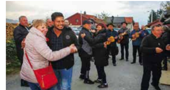
Veselo martinjsko druženje na Šatornjaku

Nakon prve zdravice s mladim vinom, uz želju da krijepi i bude za snagu i veselje, svi okupljeni dru-