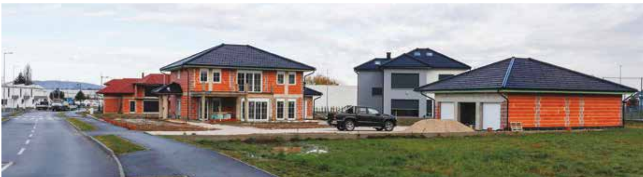
Grad Ivanec Gmajnu otvara po modelu tzv. urbane komasacije, po kakvom je aktivirana i Preradovićeve, gdje gradnja „bukti“

mjesta, a sve je to povezano i s našim gospodarskim brendom koji promičemo već niz godina, a to je Ivanec kao business frien-