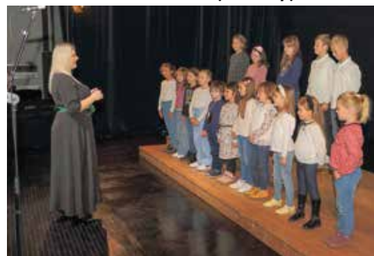
Budućnost velikog zbora – Dječji zbor KUD-a R. Rajter