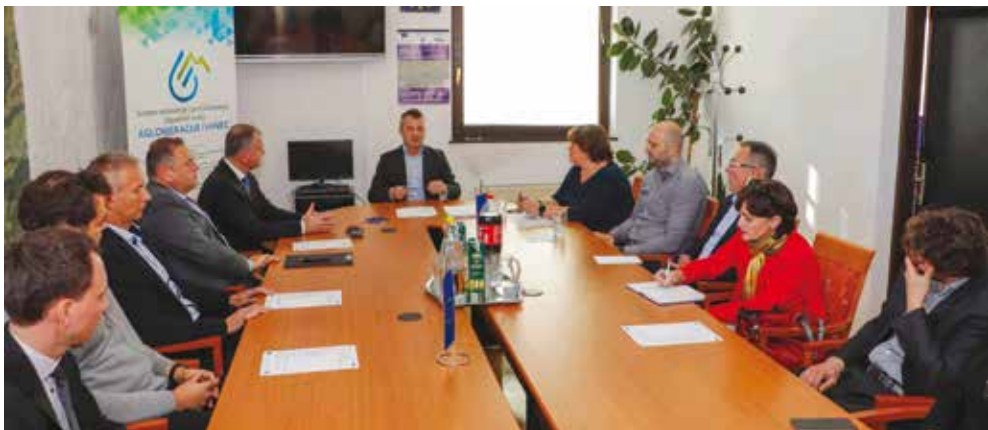
Potpisivanju ugovora odazvali su se predstavnici resornog ministarstva, Grada i izvođača radova