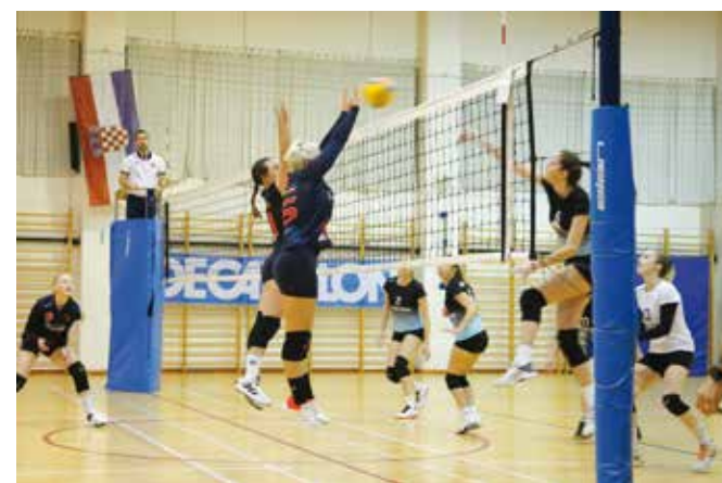
Prva ekipa niže pobjede