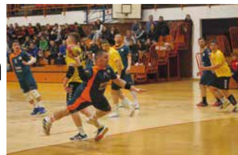
Ivančica sedma na prvenstvenoj tablici

U ranije odigranim utakmicama Ivančica je u Ivancu po-