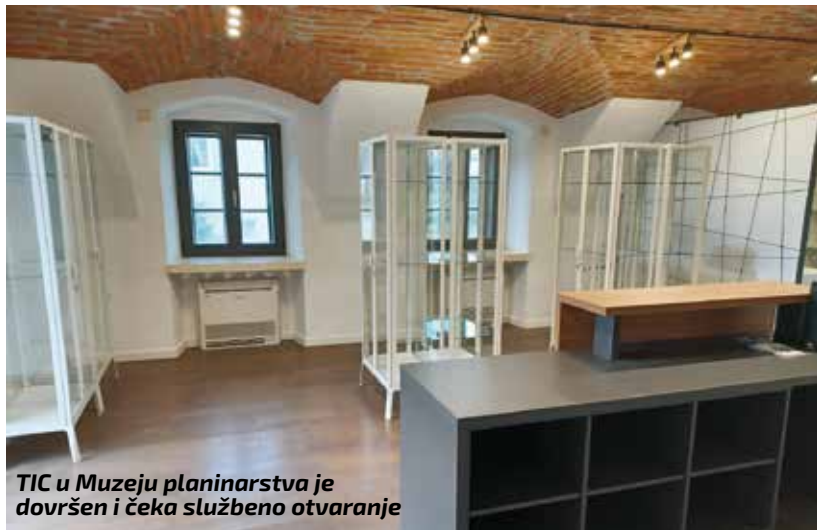
TIC u Muzeju planinarstva je dovršen i čeka službeno otvaranje

Izvijestio je da su na arheološkom lokalitetu istraživanja dovršena, a resornom ministarstvu kandidiran je projekt izvođenja konzervatorsko-restauratorskih radova, jer se objekt mora zatvoriti prema propisima. Također, Institut za arheologiju Gradu mora predati još završno izvješće o provedenim istraživanjima. Sva arheološka građa čuva se u Zagrebu i ništa što pripada Ivancu neće biti otuđeno.