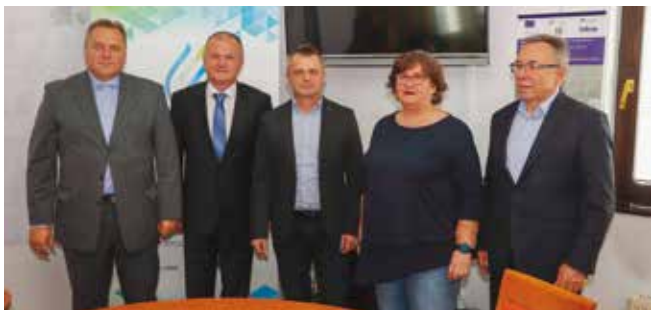
Potpisivanje ugovora za gradnju pročištača

– Grad Ivanec financijski participira u njemu i sredstva za nastavak radova u svom je