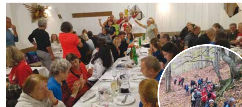
Turisti u dobrom raspoloženju slave Martinje u BVB-u

Plesalo se uz glazbu Starih zajcof, koji su i ovaj put nizom poznatih vinskih napjeva uljepšali ovo lijepo društveno okupljanje. Za svaki slučaj, svaki je vinogradar sa sobom ponio litricu-dvije vina na blagoslov, pa neka ga bude što više i neka bačva dugo trajel! (ljr)