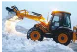
Uz 180 km gradskih cesta, Ivkom će čistiti i nogostupe i 12 javnih parkirališta