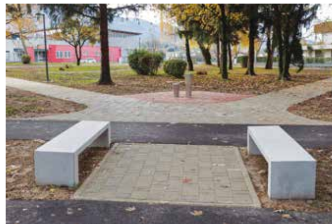
Nove klupe i fontane, radovi na stazama dovršeni

čene su tlakavcima. Montirane su skate i biciklističke rampe te sve sprave za teretanu na otvorenom. Ispod svih sprava je antistres podloga.