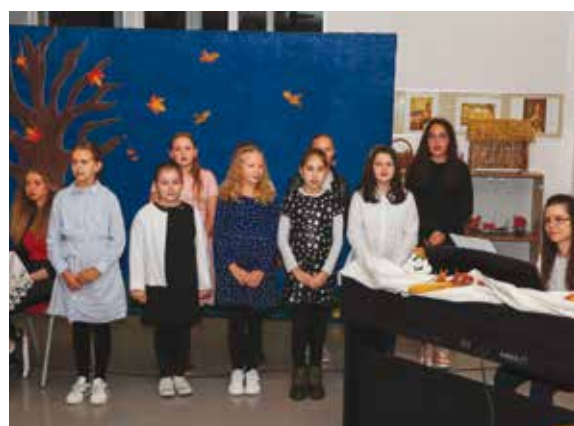
Program je pjesmom uljepšao školski zbor

A zanima li vas kako je dalje išla priča s vokom i lesicom, potražite je u Gradskoj knjižnici te saznajte tko je na kraju omaštio brk, a tko je izvukao – deblji kraj!(aj,ljr)