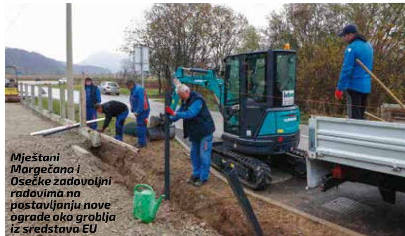
Mještani Margečana i Osečke zadovoljni radovima na postavljanju nove ograde oko groblja iz sredstava EU

Napomena: Svi detalji sjednice dostupni su na snimci na službenoj FB stranici Grada Ivanca.