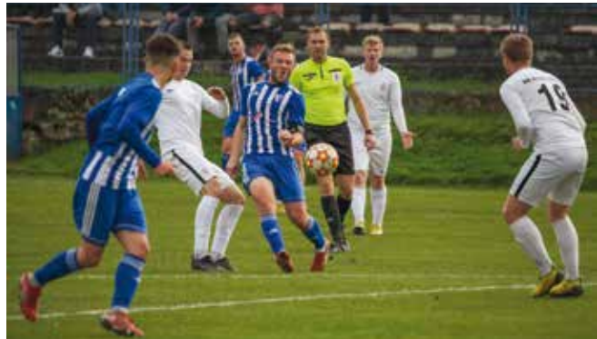
U prijelaznom razdoblju Uprava kluba nastojat će pronaći dva nova igrača koji će Ivančicu vratiti u borbu za naslov prvaka lige

U prethodno odigranim utakmicama Mladost je u Beletin-