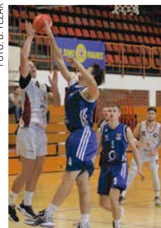
Nakon niza pobjeda – niz poraza

Nakon odličnog starta u novoj prvenstvenoj sezoni 2. HKL Sjever i tri uzastopne pobjede, košarka momčad Ivančice nanizala je četiri poraza za redom, dva na domaćem parketu i dva na gostovanju.