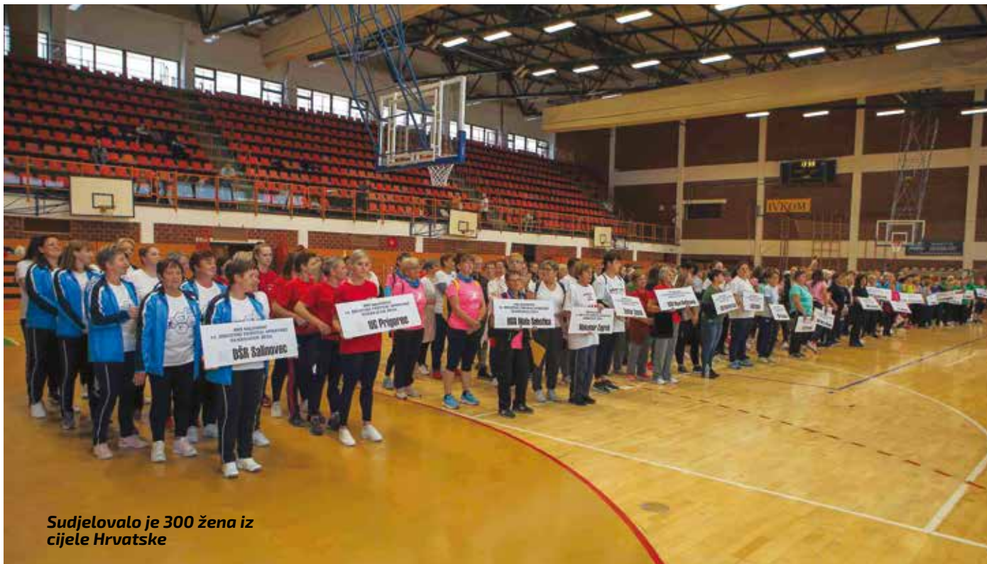
Sudjelovalo je 300 žena iz cijele Hrvatske

REKREACIJA Ivanec domaćin 16. hrvatskog festivala sportske rekreacije za žene