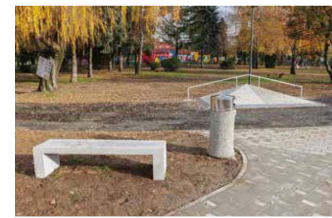
Park se dovršava i priprema za otvaranje

SKATE I BIKIKLISTIČKI PARK Grad Ivanec kraju privodi radeve na uređenju novog društvenog sadržaja