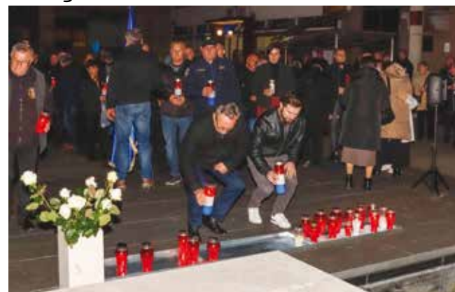
Ivanec se s pijetetom poklonio žrtvama Domovinskog rata

dar, nego muka. Stoga je sjećanje na pad Vukovara, ali i na njegovo oslobođenje, kao i cijele nam Domovine, stalan poziv svima nama na okretanje jednih drugima i na izlaženje iz rovovskih podjela – naglasio je vlč. Kosec. –Domovina, koja nam je darovana krvlju mnogih branitelja, dana nam je i zadana. Neka nam stoga zajedničarsko raspoloženje i dragi Bog omoguće sinergiju fizičkih i duhovnih snaga, da nam doista bude dobro i blagoslovljeno tu, gdje živimo, i da se za izboreno neprestano i dalje borimo oruđem znanja i vještina, poštenjem, vjerom i ostanom – zaključio je vlč. Kosec.