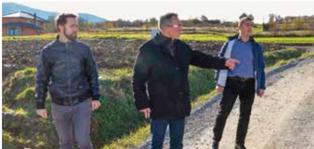
U obilasku nove građevinske zone Gmajna

–U novim poduzetničkim ulaganjima i otvaranju novih radnih