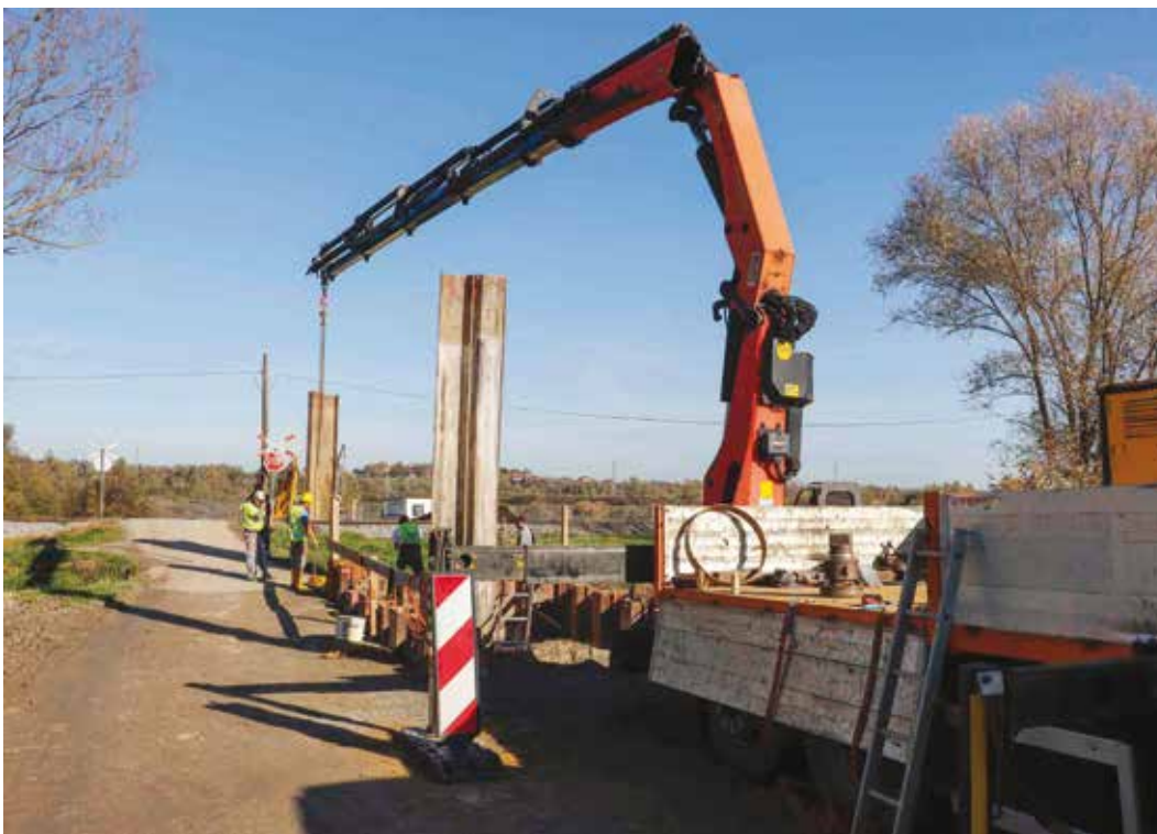
Izvedeno je 48% radova na polaganju kanalizacijskih kolektora

kuna). Još trebaju biti isporučena dva vozila i to specijalno kombinirano vozilo za čišćenje sustava odvodnje (3,5 milijuna kuna) te vozilo za pražnjenje septičkih i sabirnih jama (2,4 milijuna kuna). Rok isporuke ovih vozila je do kraja 2023. godine. (ljr)