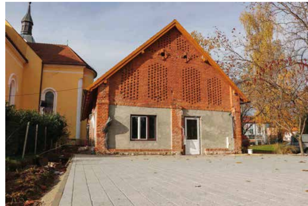
Nekadašnja trošna betonska podloga pretvorena je u prekrasnu vanjsku terasu

planira naručiti izradu izložbenog postava i projekt opremanja, za što su u prijedlogu proračuna za 2023. predviđena sredstva. Time bi Centar za posjetitelje u punom svjetlu trebao profunkcionirati prije iduće ljetne sezone, kada se očekuje povećani dolazak posjetitelja i mnoštvo manifestacija vezanih uz Dane grada i Ljeto u Ivancu – kaže zamjenik gradonačelnika Marko Frišić.