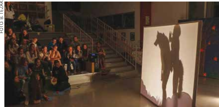
Učenici PŠ Salinovec na zanimljiv su način uprizorili narodnu priču

KLUB MLADIH IVANEC Na Izornoj skupštini izabrano novo vodstvo udruge mladih