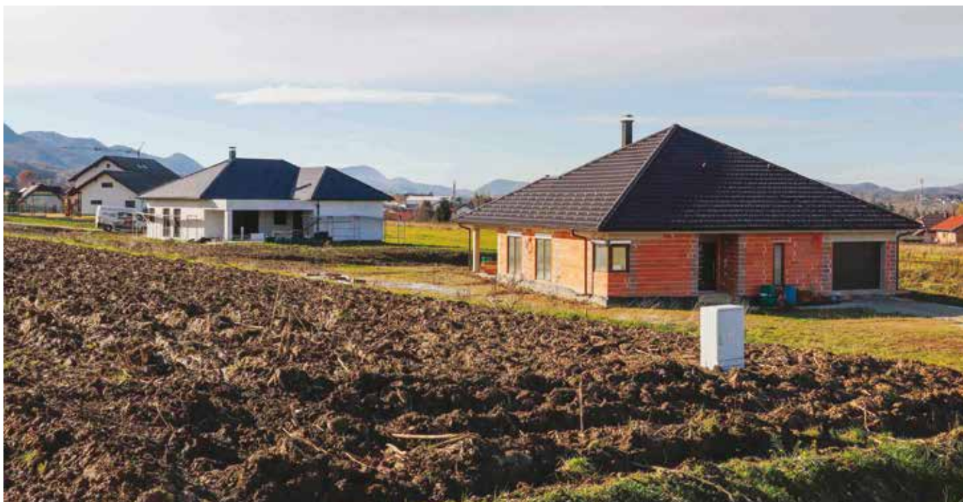
Nova zona Gmajna; u zapadnom dijelu Grad će otvoriti nove prometne koridore

Istaknuo je da je Ivanec postao atraktivno područje za stanovanje te da imamo veliki pritisak za otvaranje novih zona i gradnju kvalitetnih stanova, a Grad Ivanec radi sve kako bi to potaknuo i držao na što višoj razini. (ljr)