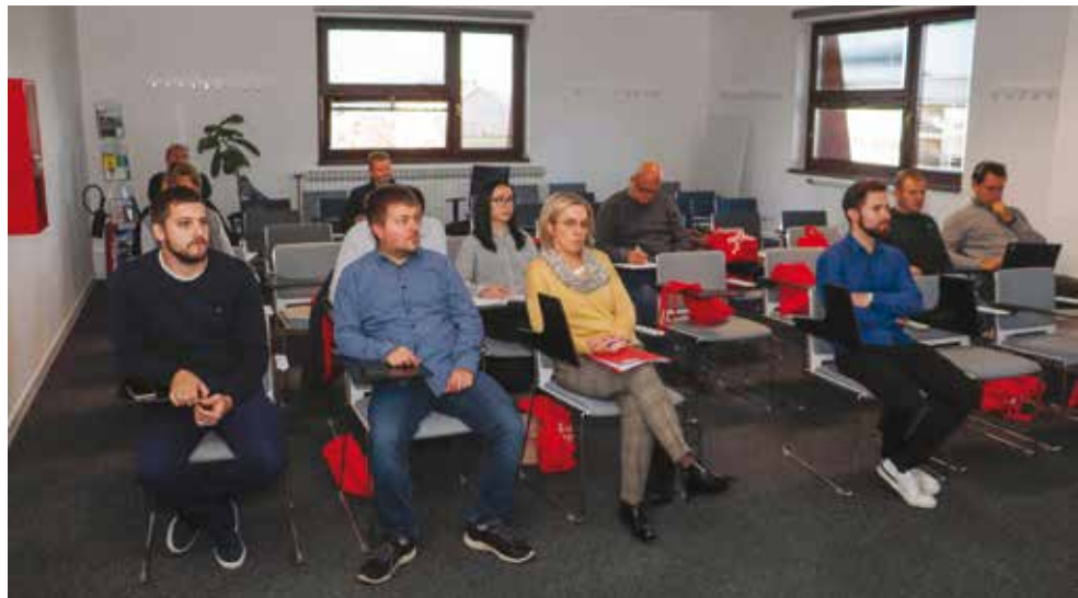
Sa sastanka Poslovnog kluba Ivanec

na snazi još od 2010. godine; nitko dosad nije postavljao nikakva ograničenja pa je na ovom prostoru aktivirana Industrijska zona u kojoj su sagrađeni veliki pogoni. Usto, ovim prostorom ide trasa i buduće brze ceste. I sad je Županija je odjednom odredila da tu više nema gradnje. Stoga ćemo našim gradskim planovima definirati nove zone