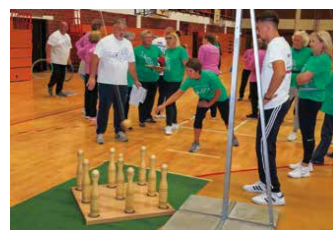
Na višećoj kuglani

16. državni festival DŠR Salinovca dobio je i od člana Izvršnog odbora HSSR Marijana Vugrinčića, koji je organizaciju i atmosferu ocijenio vrhunskom. A time je DŠR Salinovec još jednom potvrdio svoj status jednog od vodećih sportsko-rekreacijskih društava u Hrvatskoj.(ljr)