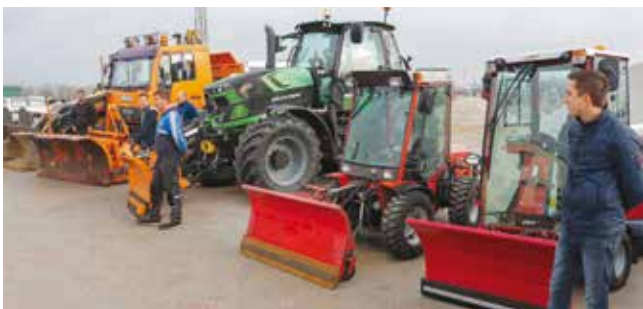
Dio voznog parka zimske službe Ivkoma d.d. i kooperanata

potrebne tehničke, kadrovske i materijalne pripreme u cilju što učinkovitijeg funkcioniranja. Kako je toga dana izvijestio vo-