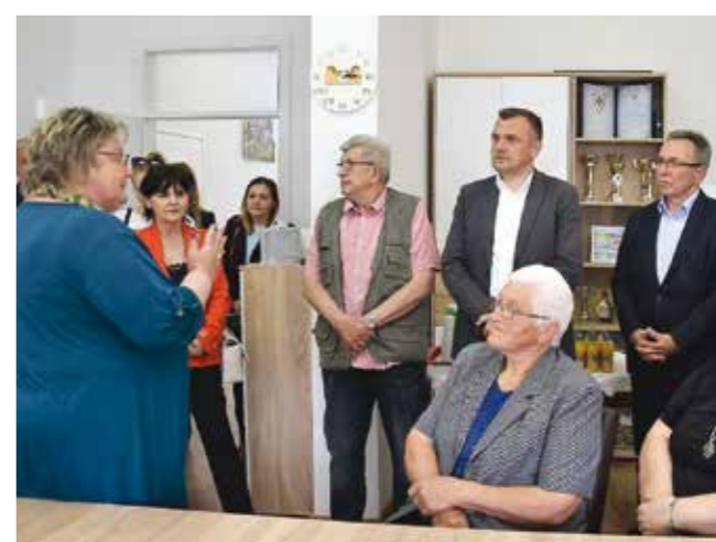
Na otvaranju obnovljenih prostora Ivanečkog sunca

Ukupna vrijednost izvedenih radova je 309.000 kuna. Grad Ivanec za njihovo je uređenje izdvojio 185.500 kuna, ministarstvo 91.000 kuna, a Grad Lepoglava 32.550 kuna. Ostale općine, iako suvlasnice ovog prostora, nisu sufinancirale njegovo uređenje.(ljr)