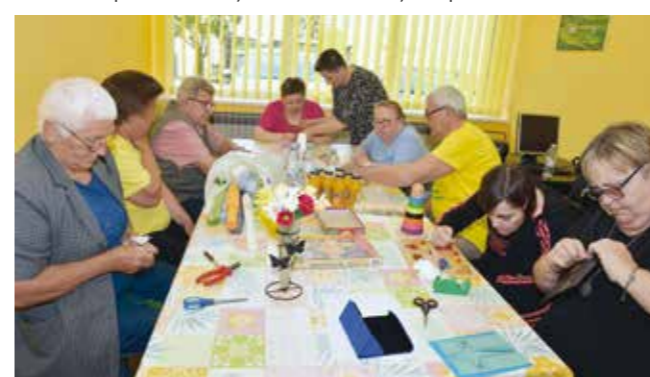
Članovi na raspolaganju funkcionalni prostori i uvjeti rada

–Uređeno je 110 m2 prostora u kome su izvedeni opsežni zidarski, obrtnički i instalaterski radovi. Članovima je na raspolaganju veća dvorana s kutkom za spravama za terapijske vježbe, radni prostor, dva ureda, čajna kuhinja, spremište i sanitarni