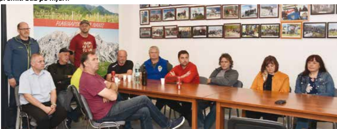
Ugodan prostor za planinarska druženja

– poručio je gradonačelnik. U nastavku je druženi okupljenih planinara nastavljeni u ležernoj atmosferi, čime će 5. svibnja 2022. u spomenici PK Ivanec ostati zabilježen kao dan službenog otvaranja njihovih klupskih prostora.(ljr)