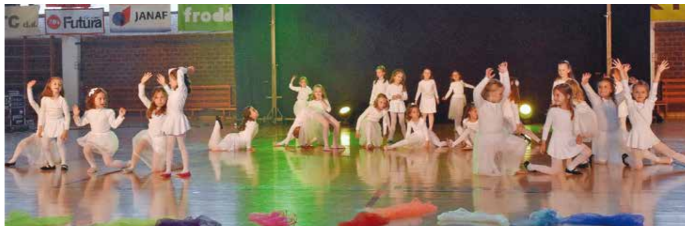
Velik pljesak za naše najmanje!

POMOĆ PČELARIMA Grad za potrebe pčelara nabavio četiri tzv. pametne vage