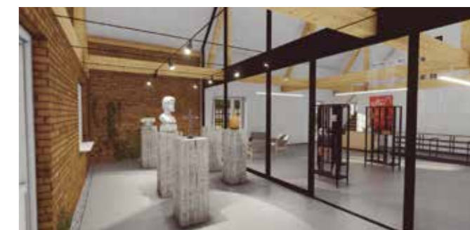
Vizualizacija budućeg centra za posjetitelje u preuređenom objektu budućeg TIC-a