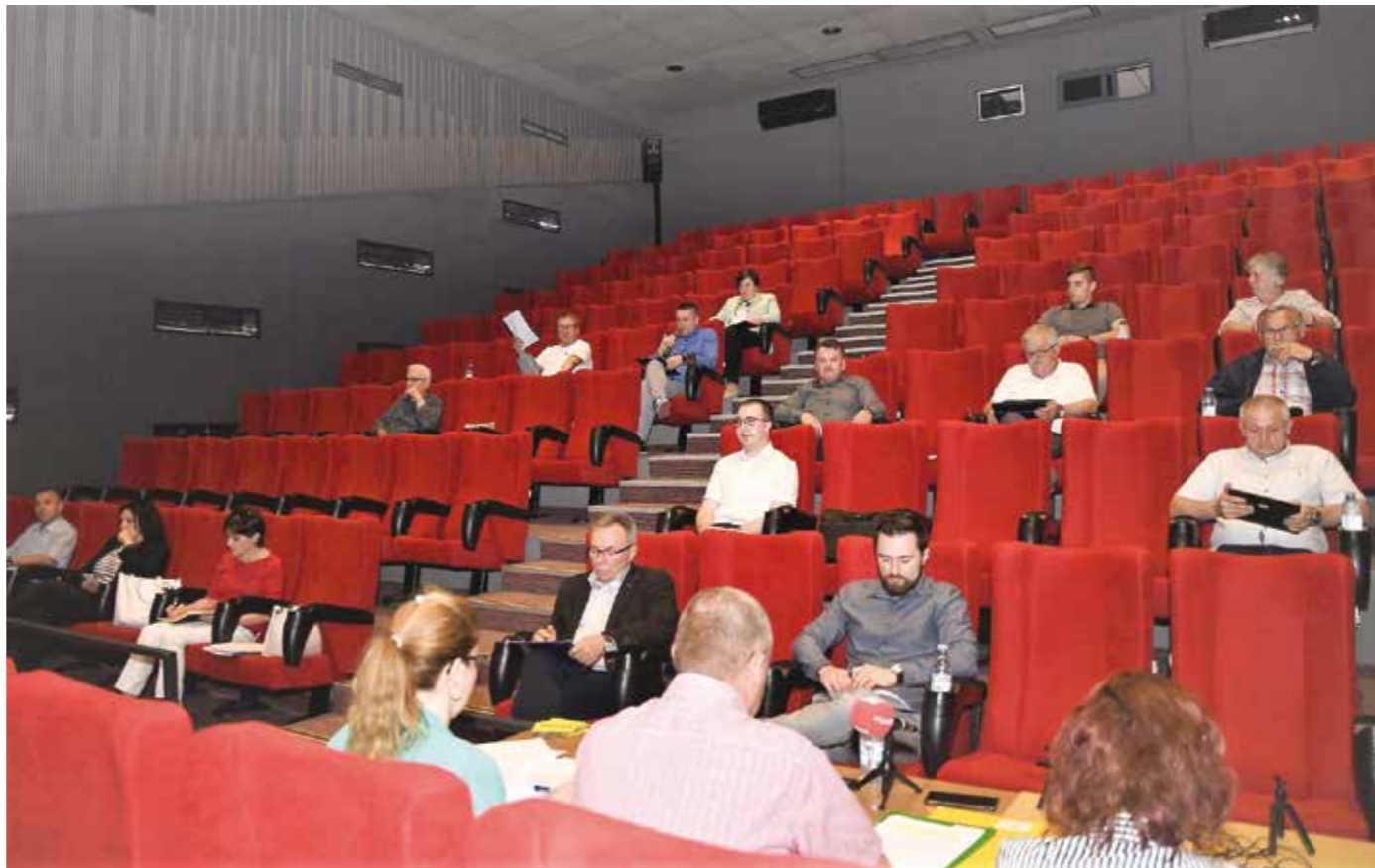
17. sjednica Gradskog vijeća Ivanca

„Vlada RH nedavno je najavila dizanje plaća za 4%. Odmah sam najavio da će u tolikom postotku plaće rasti i za Dječji vrtić i Knjižnicu i za gradsku upravu. Ako imate određenih pitanja ili dilema, tada se najprije javite u Grad i pitajte gradske službe. Kad se nisam odazvao razgovoru sa sindikatom? Uvijek se odazovem. Jedino što je bilo (kada smo prije 2 godine sklapali kolektivni ugovor) jest dogovor za isplatu razlike plaća u dva obro-