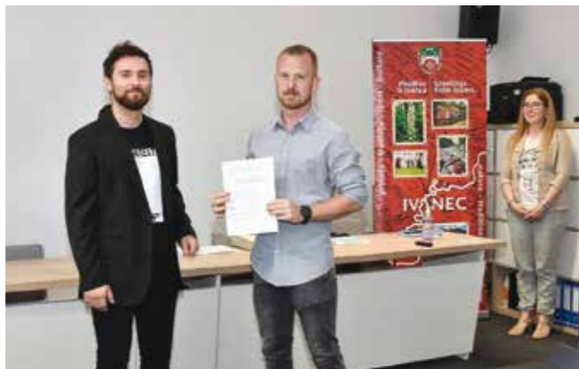
Kod rješavanja stambenog pitanja svaka je kuna potpore dobro došla

Ovaj program Grad je počeo provoditi u srpnju 2020. godine te dosad u ovaj program uključio čak 87 mladih obitelji.