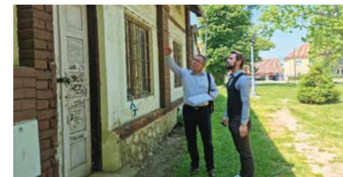
Stari objekt, jedini preostao od kompleksa Starog grada, kreće u energetska obnova

nog konzervatorskog odjela, trebala poprimiti svoj pretpostavljeni originalni izgled, dok će zidovi, podovi i krovna konstrukcija biti toplinski izolirani s unutarnje strane. Energetskom obnovom riješit će se najveći dio građevinskih i instalaterskih zahvata koji su potrebni kako bi se zgrada stavila u funkciju turističkog centra s lapidarijem (izložbenim prostorom) vezanim uz tematiku Starog grada