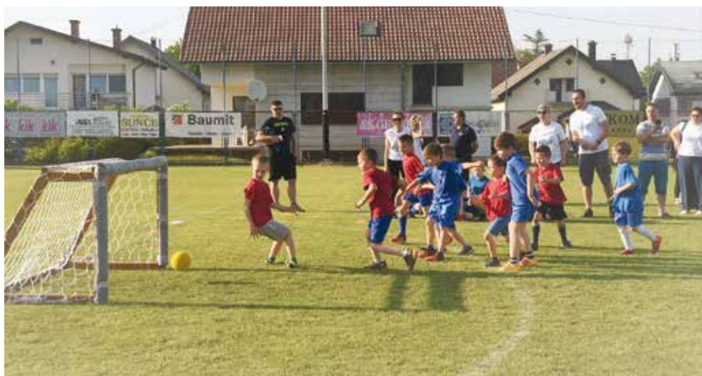
Nogomet je zakon!