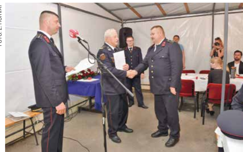
Čestitke suradnicima i vatrogasnim veteranima