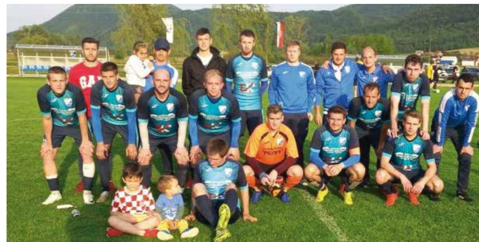
Mladost je u gornjem dijelu tablice, na četvrtoj poziciji