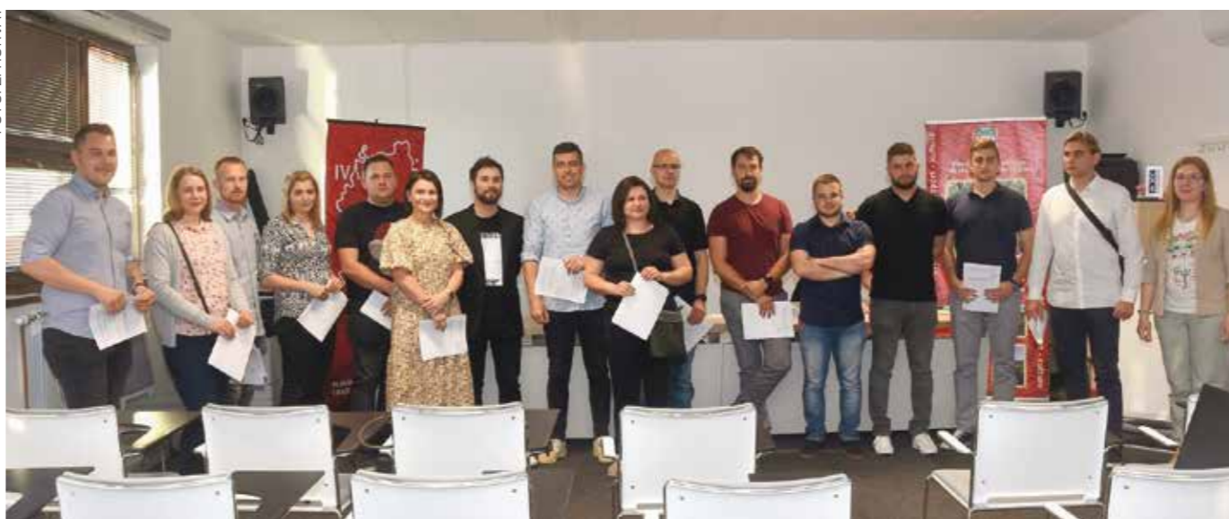
U novome, šestom krugu, dodijeljeno još 19 potpora mladim obiteljima

◆ ◆ Grad oslobađa od plaćanja komunalnog doprinosa i komunalne naknade prvih 5 godina te sufinancira stambeni kredit u visini 10% mjesečne rate