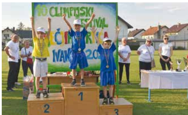
Najbolji skakači na tronu