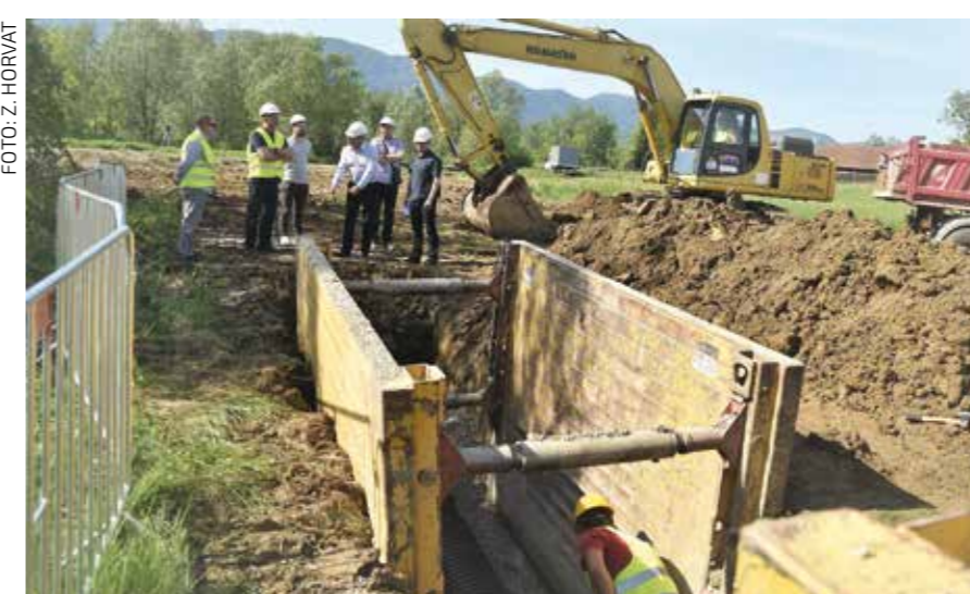
Radovi zasad dobro napreduju, problem je dobava repromaterijala