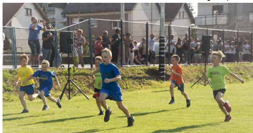
Ni vjetar ih ne bi dostigao...

IVANEC Lijepa akcija stanara zgrade u Nazorovoj 17