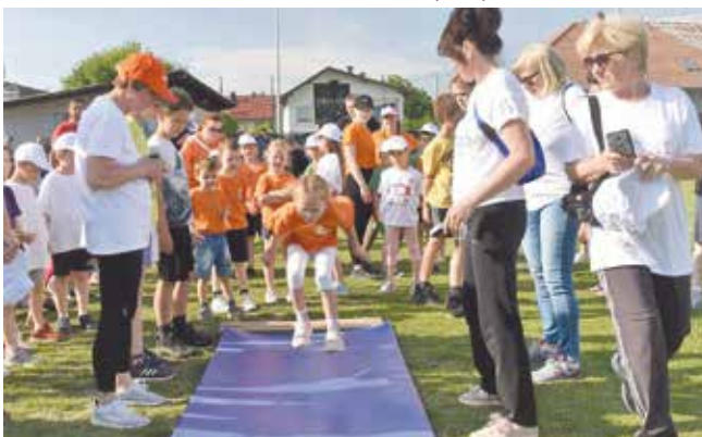
Tko će dalje?