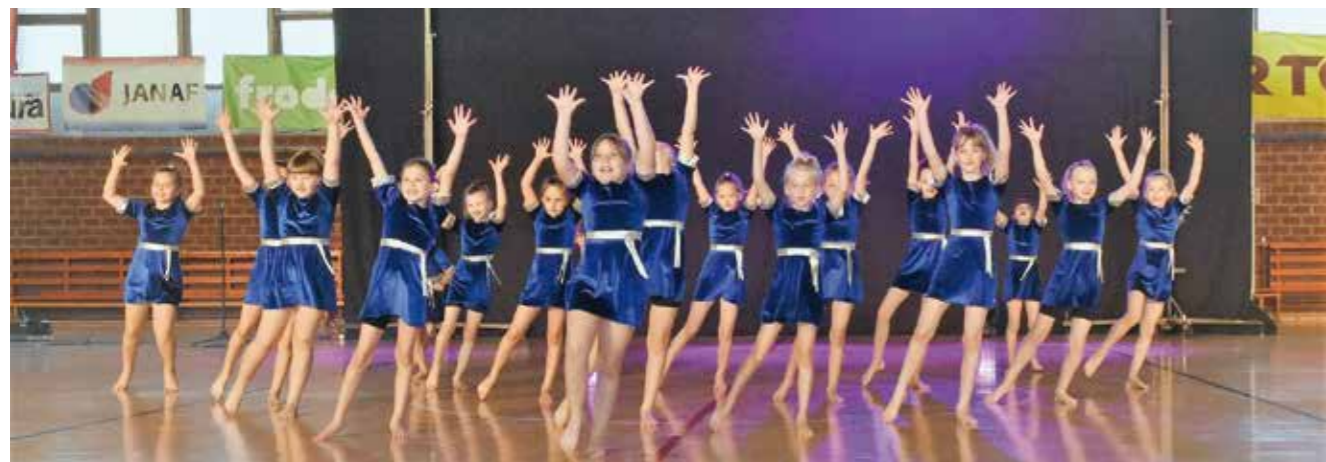
I publika ih je pratila pljeskom

♦♦ Plesni klub Ivančica okuplja velik broj djece i mladih, ispunjavajući njihovo slobodno vrijeme kreativnim aktivnostima, druženjem i dobrim emocijama