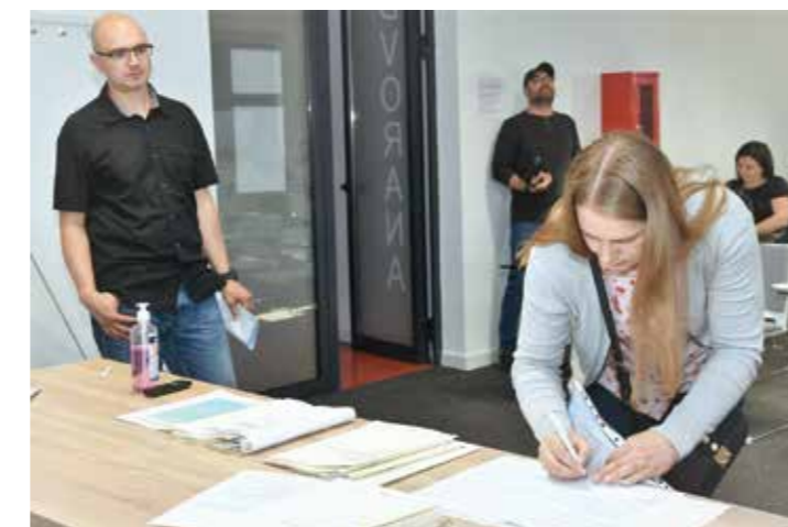
I u ovome krugu ugovore s Gradom potpisalo su redom, mlade obitelji

Trećom mjerom Grad obiteljima sufinancira stambeni kredit u visini 10% mjesečne rate, s time da maksimalan iznos kredita koji se subvencionira iznosi 100.000 eura na rok otplate od minimalno 15 godina. Za svako dijete u obitelji korištenje ove subvencije produljuje se za godinu dana, a za svako novorođeno dijete još 2 godine. (lir)