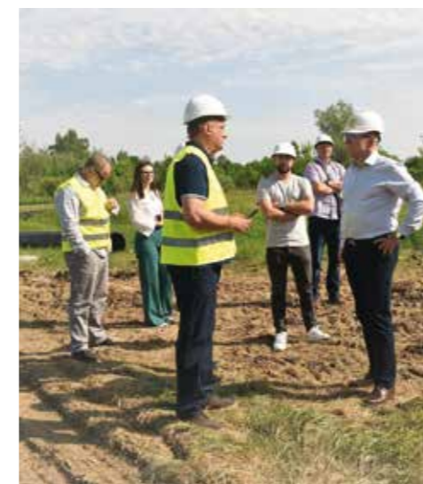
U obilasku aglomeracijskih radova u Jerovcu

–Radovi su vrijedni 216 milijuna kuna i osim pogodnosti za građane, ova je investicija iznimno vrijedna i za građevinski sektor. Ovdje rade i tvrtke s podrškom naše županije, što je važno