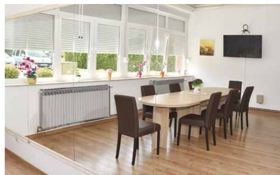
U uređenje prostora uloženo je više od 300.000 kuna

čvor prilagođen osobama s invaliditetom. Kombi vozilo, koje je Grad Ivanec prije 12 godina kupio za potrebe prijevoza članova udruge, dalo je svoje. Stoga za iduću godinu najavljujem nabavu novog kombi vozila – istaknuo je Batinić.