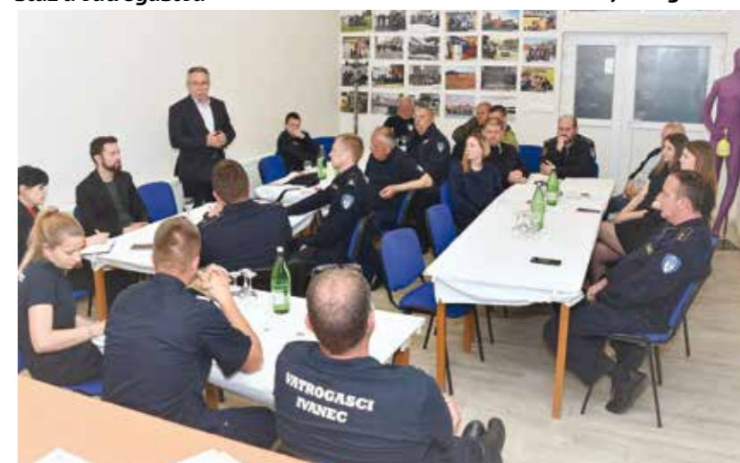
DVD Ivanec – povijest duga 134 godine, koja obvezuje