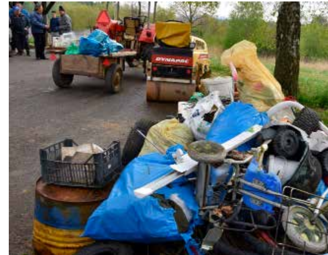
Gomila skupljenog otpada na području Šikada

Ovdašnji volonteri ni ove godine nisu iznevjerili dugogodišnju tradiciju pa su se nakon akcije okupili u novouređenom društvenom domu, na sjajnom grahu koji je pripremio Dado Justament.(ljr)