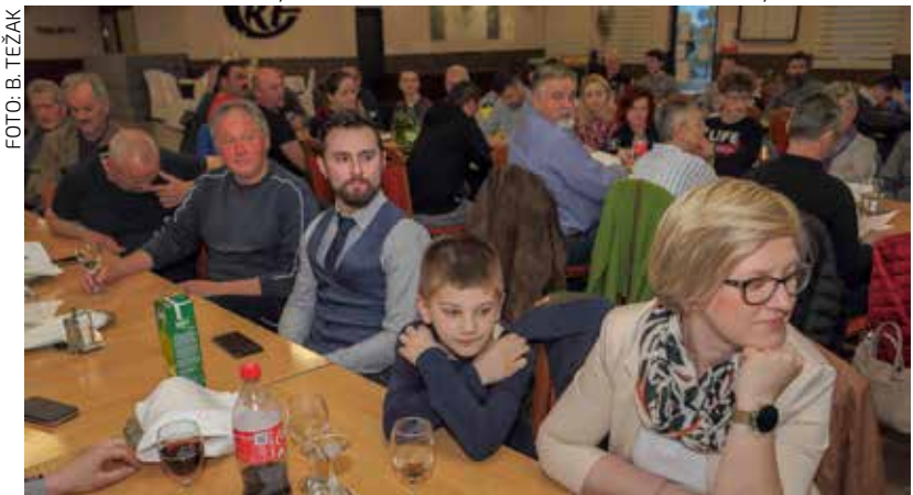
Ključna zadaća – uređenje vršnog dijela Ivančice, radi zaštite od devastacije i u cilju održivog razvoja