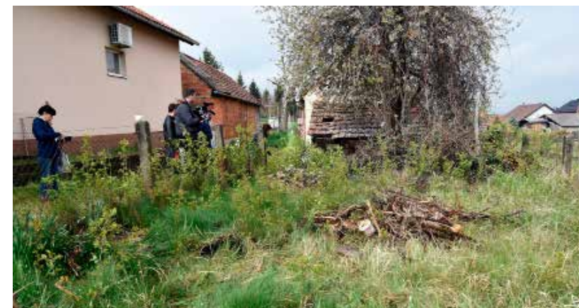
Ovu površinu hitno je potrebno očistiti, Grad će reagirati

Nekoliko mještana Ivanečkog Naselja, kojima je prekipjelo zbog nereda oko „ničije kuće“ u kojoj nitko ne živi niti pak održava okoliš već 12 godina, odlučilo je uzeti stvar u svoje ruke te očistiti okoliš iz kojeg im, kažu, u dvorišta ulazi sve i svašta.