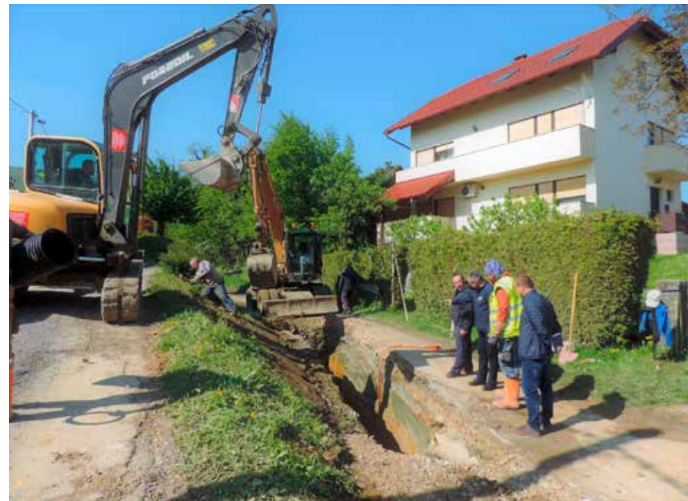
U razgovoru s izvođačima radova; veliki prekop ulica naprosto se ne mogu izbjeći

skogradnja Huđek iz Petrijanca. U međuvremenu su iscrtni i svi kolnici, a sada slijedi i završno uređenje zelenih površina. Postavljeni su i svi predviđeni kandelabri i šahovski za DTK, a nova javna rasvjeta stavljen je u funkciju. Ove radove obavio je Elektro Golub iz Horvatskog.(ljr)