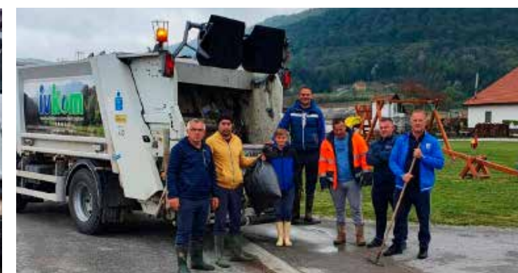
Zelena čistka u Seljancu