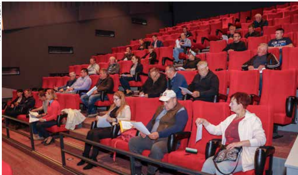
Pripremni sastanak s predstavnicima MO-a i udruga pokazao je da se može očekivati dobar odaziv Zelenoj čistki 2022.

okoliš na području cijelog našeg grada većim dijelom bio očišćen, obilazak terena pokazao je da su u zadnje dvije epidemiološke godine u prirodi ponovno završile znatne količine otpada. I to unatoč tomu što je kod nas