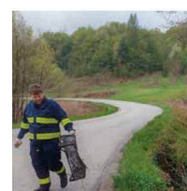
I radovanski vatrogasci u patroli