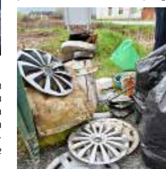
Tko je „felge“ bacio u prirodu?

Iako je to ruta koju građani očiste svake godine, neugodno iznenađuje činjenica da je ponovno skupljena poprilična gomila krupnog otpada – „felgi“, plastičnih stolaca, stakla i plastike. Gotovo „kubik“ krupnog