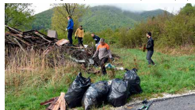
Nedopustivo! Hrpa otpada namijenjena vuzemljici počela se pretvarati u divlji deponij

–Ovaj prostor, nadomak sportskog igrališta, suviše je vrijedan a da bismo dopustili da nam ovdje nikne divlji depo-