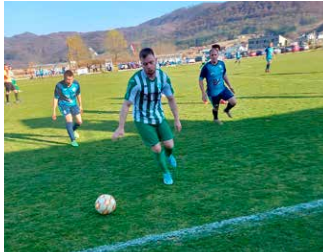
Mladost se lavovski bori za plasman na prvenstvenoj tablici

Ne želi li izgubiti plasman na 2. mjestu prvenstvene tablice, Mladost u preostalim kolima do kraja sezone više ne smije izgubiti, dakle, trebala bi izboriti sve pobjede do kraja prvenstva. Mladost je u utakmici 19. kola u Varaždinu s momčadi Mladosti nakon dva uzastopna poraza izborila uvjerljivu pobjedu od 4:0, uz hat trick kapetana momčadi