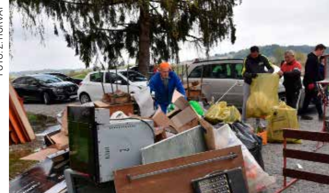
Proletno pospremanje oko stare škole u Salinovcu