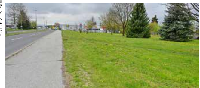
Zona budućeg parka za četveronožne kućne ljubimce

–U međuvremenu su nam iz HC-a poslali i projekt kružnog toka koji se tamo planira graditi kao zamjena za semaforско raskrižje, tako da smo sada u procesu usklađivanja našeg plana s njihovim projektom. Čim dobijemo suglasnost, krenut ćemo s pripremama za realizaciju ovoga projekta. To je oko 50.000 kuna investicije za ograđivanje prostora od nekih 1.000 m 2 . Naravno, opremit će se i koševima za otpatke i pseći izmet. Što se tiče kucica o koje vlasnici mogu objesiti povodce za pse kad ih ostavljaju ispred trgovina, Grad će poslati pismo s pozivom trgovačkim lancima da uvedu takvu praksu – zaključio je Friščić.