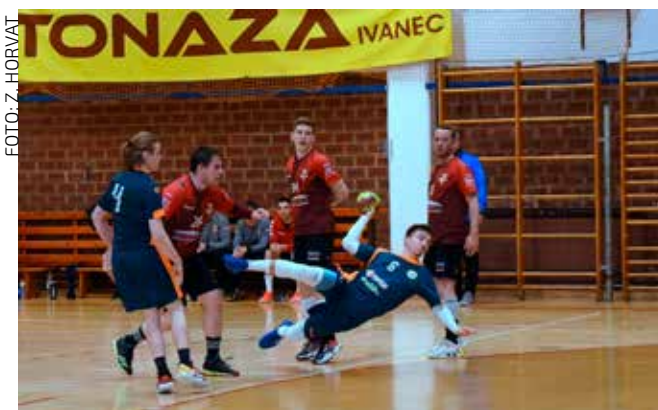
U utakmici 22. kola Ivančica je Rugvicu pobijedila s 34:33

Momčad U-15 zauzela je treće mjesto na prvenstvenoj tablici s 22 boda. Sve tri momčadi Ivančice plasirale su se na državno prvenstvo koje će se polovicom svibnja održati u Poreču. Čestitamo! (nn)