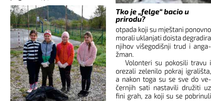
Ove vrijedne djevojčice pokupile su sav otpad odbačen u travu pokraj igrališta

skog) i vi sami možete traktorom ili motokultivatorom dovesti u krug Ivkoma u Ivanu i tamo ga besplatno odložiti. Zato, neka napokon prestane praksa odvoza otpada u prelijepe šume prigorske!(ljr)