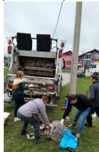
Od otpada su očišćeni lokaliteti Krč i Jama

–Očistili smo dva lokaliteta, mi ih zovemo Krč i Jama. Našlo se tu starog željeza, boca, čak i sudopera i hladnjaka i drugog glomaznog otpada. Pokupili smo i sitni otpad te sve to doveli do društvenog doma; ubrzo je došlo i Ivkomovo vozilo tako da smo se prikupljeno i zbrinuli