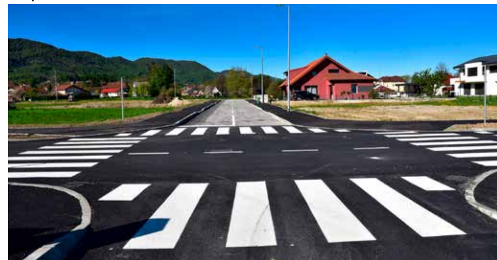
Konačan rezultat višemjesečnih radova: Moderne prometnice za moderan gradski kvart

Gradane zanima i kada će prekopane ceste biti sanirane. Stručna kaže da asfaltiranje ne smije krenuti odmah te da zbijeni teren treba ostati godinu dana u makadamu, kako bi se slegnuo i stabilizirao, a tek nakon toga može se prići uređenju donjeg sloja ceste i polaganju asfalta.(ljr)