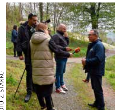
Ivanečka akcija, najveća u Hrvatskoj, privukla je i pažnju medija

–Nije jasno kako netko može natrpati krupni otpad na traktor, mučiti se odvozeći ga krišom u šumu i istovarivati ga, kad isti taj otpad može odvesti u Ivkom