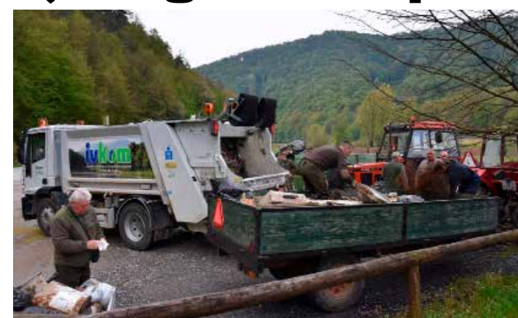
Na parkiralištu kod LD Šumski zec - između 10 i 12 m3 otpada