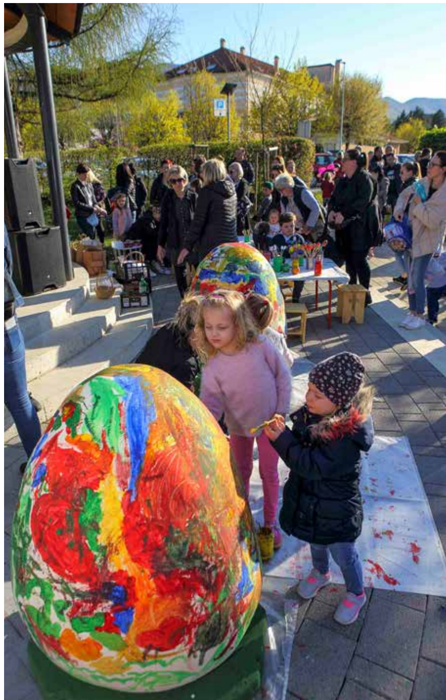
Klinci su uživali u bojanju pisanica

Skupština je usvojila Program rada za ovu godinu koji je prvenstveno usmjeren na nastavak pomoći osobama s tjelesnim invaliditetom, daljnje uklanjanje arhitektonskih prepreka, sudjelovanje članova u raznim, njima primjerenim natjecanjima, a donesen je i Strateški plan rada udruge do 2028. godine. (ljr)