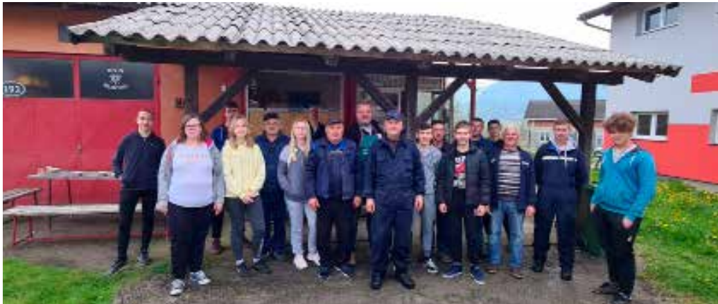
Volonteri Zelene čistke Bedenec 2022.

Vreski, Vuglači i Novaki. Osim standardnog otpada koji se nakupi kroz godinu, bilo je tu i odbačenog krupnog otpada pa se tako na skupljenoj hrpi u Bedencu mogla vidjeti i veća količina metala, posebno ple-tiva i žice, ali i puno plastike i stakla.