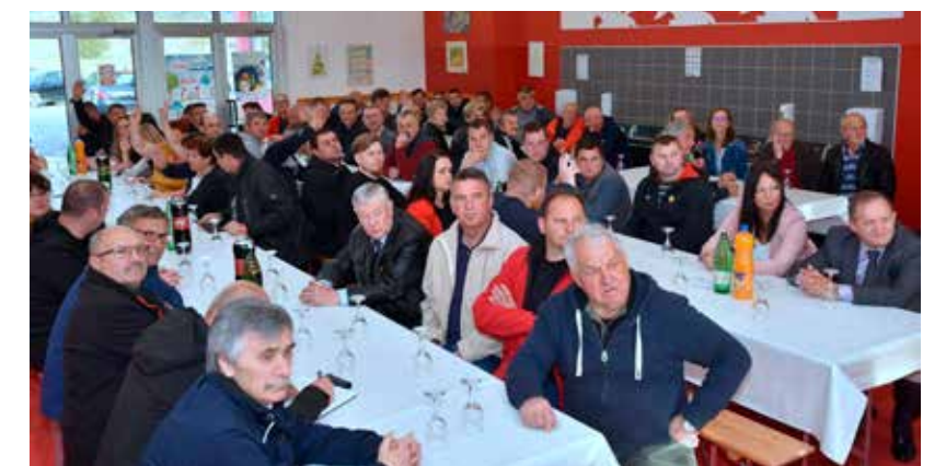
Brojni domaćini gosti okupili su se na proslavi jubileja

– Zahvaljujem svim članovima koji su tijekom svih dosadašnjih godina promovirali rekreaciju i zdrav život. DŠR Salinovec, koji je u tome bio prvi, na neki način sada ima misliju i odgovornost i dalje širiti rekreaciju na način da u nju uključuje sve generacije, jer rekreacija je i najbolja prevencija u zaštiti zdravlja. U Gradu Ivanču uvijek ćete imati podršku za vaše aktivnosti – poručio je, među ostalim, M. Batinić. (ljr)