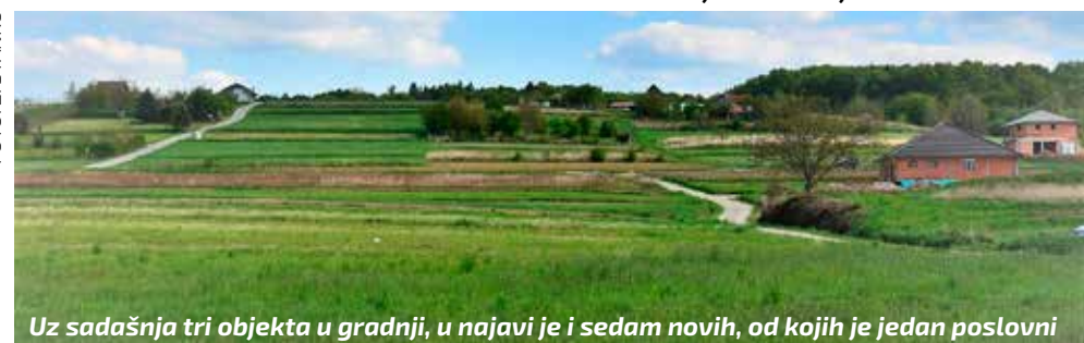
Uz sadašnja tri objekta u gradnji, u najavi je i sedam novih, od kojih je jedan poslovni