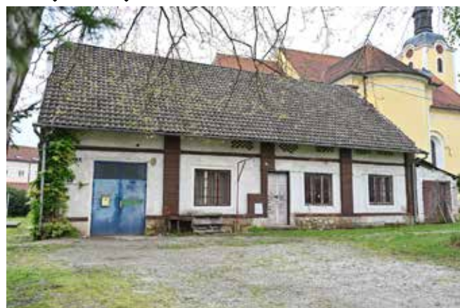
Prekrasan objekt u parku gradska uprava namjerava energetska obnoviti i preurediti ga za turističke svrhe

– Riječ je o investiciji od oko 2 milijuna kuna i nadamo se da će projekt proći, s time da bi kroz energetska obnova riješili čak 70 do 80% ukupne investicije, to zamjenu podne konstrukcije, sanaciju fasade i zamjenu kro-