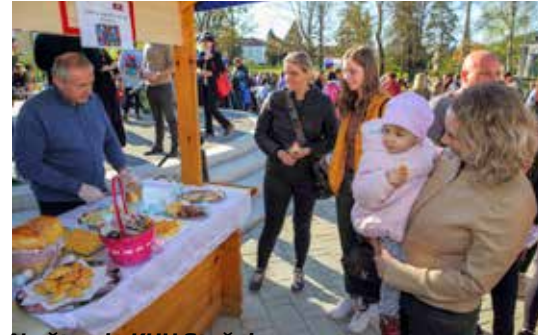
Na štandu KUO Stažnjavec

DŠR SALINOVEC Održana svečana sjednica u povodu 40. obljetnice rada i djelovanja