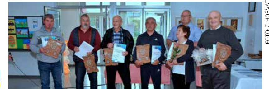
Dobitnici priznanja za osobito značajni doprinos radu DŠR-a

DŠR SALINOVEC Održana svečana sjednica u povodu 40. obljetnice rada i djelovanja