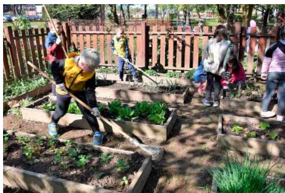
Tako se uređuje povrtnjak!