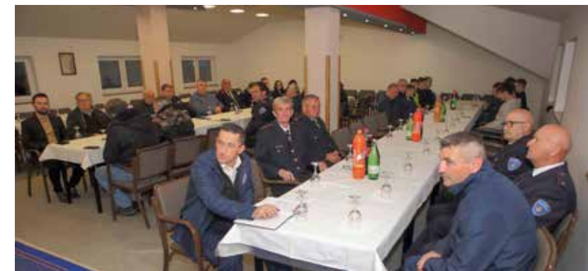
S godišnje redovite skupštine DVD-a Bedenec