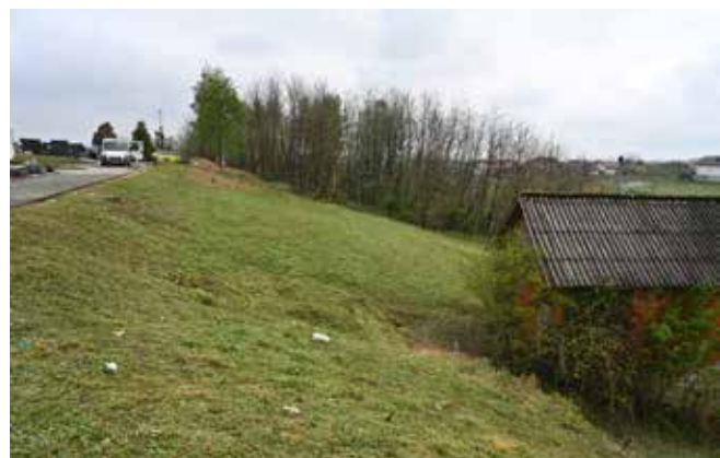
Zona proširenja groblja za uređenje prostora za 300 novih grobova i 110 grobnica

STARI OBJEKT U PARKU Jedini objekt preostao od kompleksa Starog grada Ivanec