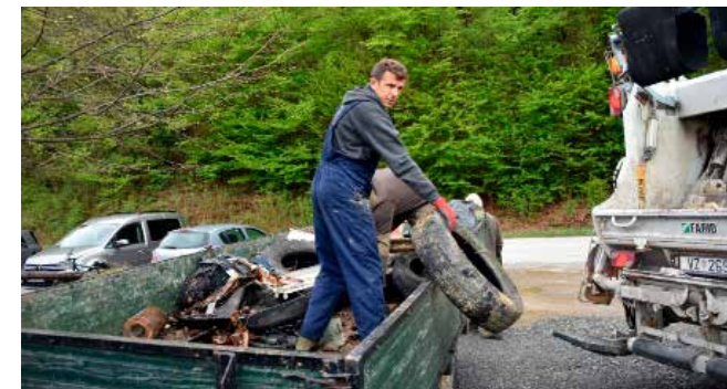
Zašto gume u prirodu, kad mogu besplatno u Ivkom?

dionici zelenih čistki ovoga kraja i ove su se godine okupili na ručku u prostorima Lovачkog doma Šumskog zeca i, nakon uspješne Zelene čistke 2022., provesti ugodno vrijeme s ljubaznim domaćinima. (ljr)