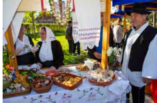
Društvo prijatelja narodnih običaja Maska