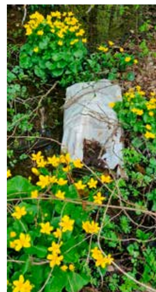
Kakvo ruglo! Plastična vreća među predivnim kaljužnicama

Ove godine ostvaren je plan čiji je cilj bio očistiti cijelo naselje od smeća. Jer iako raduje da u Ribić Bregu većih divljih deponija nema, odbačenog smeća koje pojedinci odbace u prolazu, na žalost, još uvijek ima, i to iz godine u godinu.