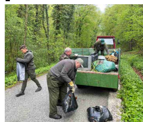
Sav ovaj otpad izvađen je iz graba, potoka i šuma

–Okupilo nas se petnaestak. Izvlačili smo otpad u Seljanskom dolu i okolici. Skupili smo nekih 6-7 vreća – izjavio je Vidaček koji je s ekipom došao u LD Šumski zec.