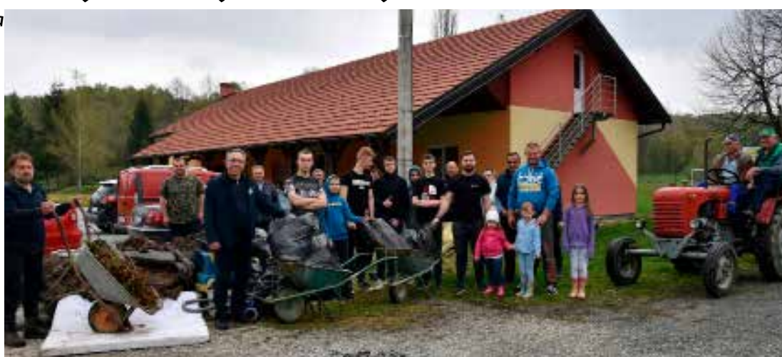
Lukavčani su i ove godine, 9. put zaredom, bili sudionici Zelene čistke

Domaćini u svoje akcije redovito uključuju mladež i djecu te na taj način kod njih razvijaju ekološku svijest i odgovorne mlade ljude čiji bi glas netko možda mogao i čuti te odlučiti nakon toga da svoj madrac ili stari televizor ipak ne baci