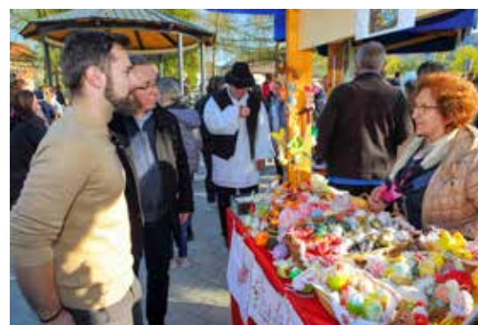
Gradski čelnici u obilasku štandova

Uskrsni sajam prerastao je u prelijepo društveno okupljanje koje je proteklo u dobroj atmosferi, kupovanju sitnih darova za uskrsni poklon bližnjima, dok su pak naši najmanji vrijeme proveli u bojanju pisanica i u cijelom nizu veselih igara. Druženje je završilo u Kinodvorani, gdje su odgojiteljice Dječjeg vrtića Ivančice za mališane priredile lutkarsku predstavu Tri mačke i zec. (ljr)