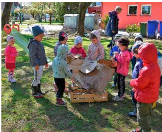
Zeleni odgoj u Dječjem vrtiću Ivančice

ZANIMLJIVO I POUČNO Meteorološka postaja na krovu Područne škole u Margečanu