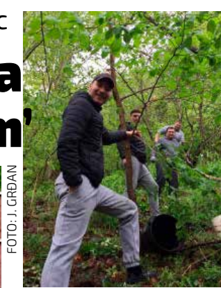
Zbog nepristupačnog terena izvlačenje otpada doslovce od ruke do ruke

lokaliteta, na koji je, tvrdi, netko odložio – kadu!