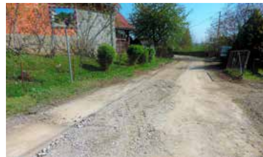
Ceste su oštećene, ali bit će i obnovljene, a svaka će dobiti novi asfalt