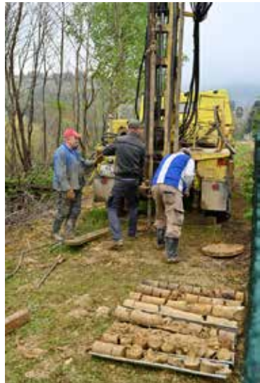
Bušenja i uzorkovanje materijala na području predviđenom za proširenje groblja

U tom kontekstu je gradski vijećnik Goran Spasojević (NL