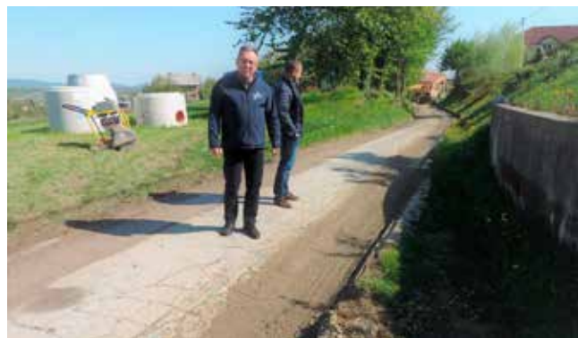
Molim mještane za razumijevanje i strpljenje, radovi su golemi

nim dionicama iskopi idu u dubinu od 3,5 do 4 metra) te prometa teških tereta. Na više lokacija su nakon radova ostale udarne rupe i ulekućke. Promet je otežan i jasno je da zbog toga dio građana negoduje. Bilo je i prigovora na kakvoću materijala za za nasip iskopa, što je od strane izvođača objašnjeno objektivnim teškoćama u nabavi adekvatnih agregata. Svi prigovori građana koje prima gradska uprava, kao i problemi uočeni od strane