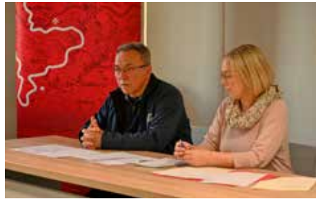
Batinić: Sugeriram postavljanje vaga u Vuglovcu, Jerovcu, Prigorcju i Margečanu

Nabava vaga nastavak je aktivnosti Grada usmjerenih na pomoć pčelarskom sektoru. Podsjetimo, prošlog ljeta također je održan sastanak s ivanečkim pčelarima zbog iznimno teške godine pa im je tako Grad osigurao pomoć od 50 kuna po pčelinjoj zajednici. Grad je spreman i dalje pomoći pčelarima kao nositeljima iznimno važne ekološke i gospodarske aktivnosti pa će, u slučaju bilo kakvih poremećaja uzrokovanih vremenskim neprilikama ili drugim mogućim havarijama, pčelarima sigurno priskočiti upomoć. (aj)