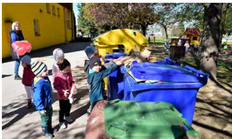
Hm, kamo ide koje smeće?

plastičnih boca. Tako će se dodatno uljepšati vrtićko dvorište, koje već niz godina i na širem planu slovi za jedno od najuređenijih.(aj)