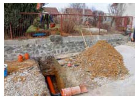
Izvođenje priključaka u Gečkovcu