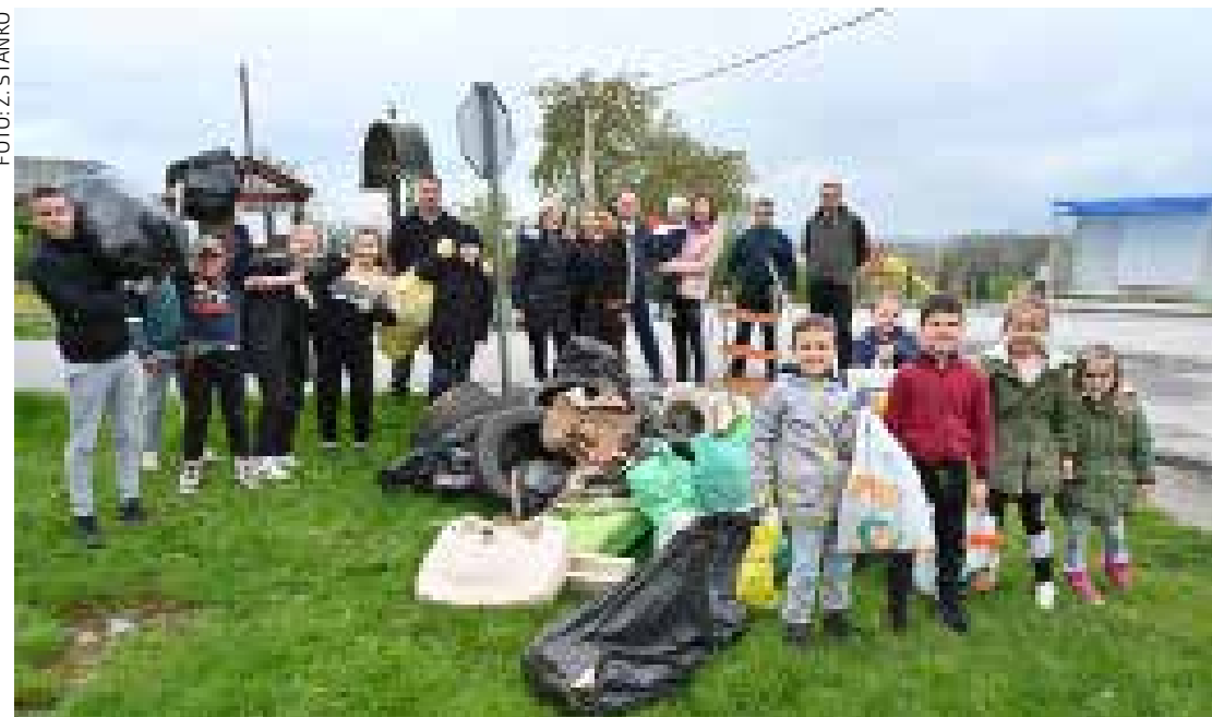
Malih sudionika Zelene akcije na Ribić Bregu više nego odraslih

U akciju se uključilo 30-ak djece i odraslih te očistilo okoliš od guma, plastike, papira i limenki