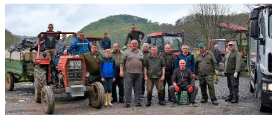
Akcija LD-a Šumski zec

KOD ŠUMSKOG ZECA Lovačko društvo Šumski zec, UŠR Stažnjevec i MO Seljanec