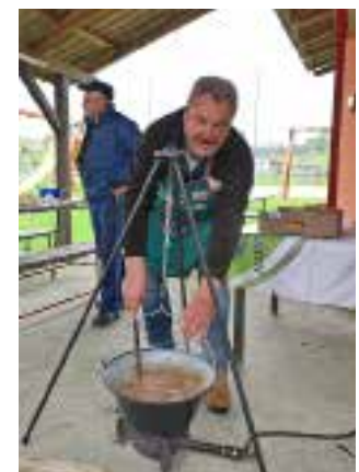
Grah u kotliću – za prste polizati!

GRAĐANI IZ VUKOVIĆEVE I ODGOJNI DOM PAHINSKO