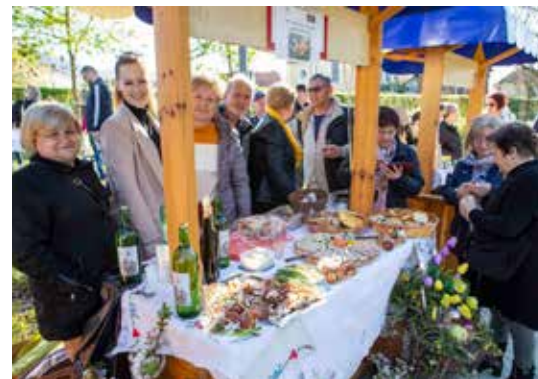
Vesela ekipa KUD-a Salinovec i Skrajskih pajdaša