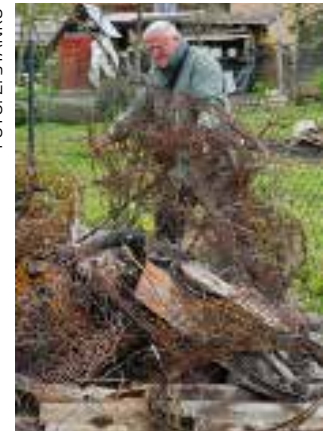
Zar je gomili žice mjesto u prirodi?