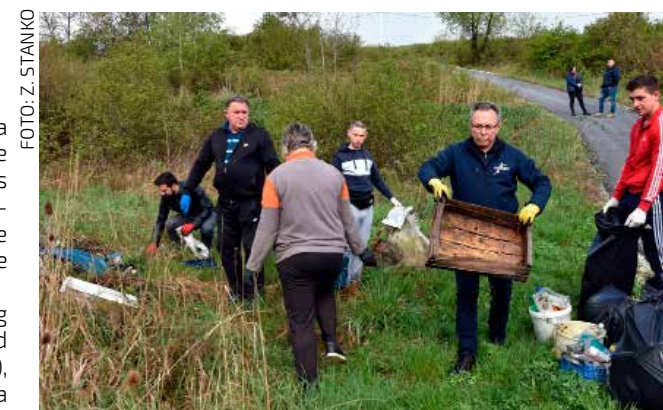
Zelenu čistku u Prigorcima pridružili su se i gradski čelnici

nij. Sve smeće sada je uklonjeno, granje ćemo zapaliti i nakon toga površinu očistiti, u nadi da više nikome neće pasti na pamet da ovdje počne ponovno dovoziti otpad – poručio je predsjednik MO-a V. Kušteljega.