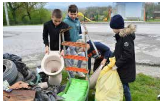
Ostvaren je plan - očišćeno je cijelo naselje

Ribić Breg se nakon Zelene čistke pretvorio u zeleni breg, a njegova posebnost je i ove godine u činjenici da je broj uključene djece bio veći od broja odraslih mještana. U akciji je, naime, sudjelovalo 16-ero djece i desetero odraslih. Izvršna je to najava i stečena navika za buduće akcije, ali i za dobru eko budućnost naselja.