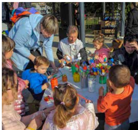
Ugodni dječji kutak