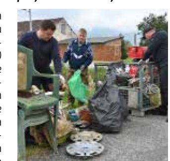
Gomila otpada izvučena je iz graba pokraj ceste

Očišćen je zaseok Krtnjeki te potez od kapelice u Jerovcu do pružnog prijelaza u Kuljevčici