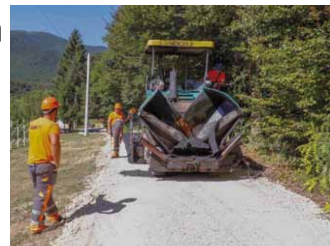
Na dionici u Željeznici