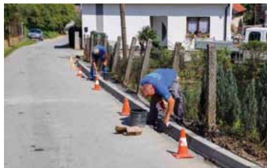
Postavljanjem rubnjaka sprečava se slijevanje oborinskih voda na privatne površine

Strojevi Ivkoma d.d., kome je Grad povjerio izvođenje radova, prvo su počeli kopati u dijelu ulice gdje je bilo potrebno riješiti problem zadržavanja voda na cesti. One su posebno velike probleme pričinjavale u zimskim mjesecima, kada su se zaleđivale i predstavljale