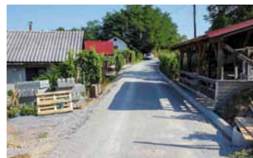
Prva faza je završena, a nastavak slijedi nakon berbe grožđa

području zahvaćenom klizištu mirno privedu kraju. Inače, ovo klizište aktiviralo se prije nekoliko godina te oštetilo gradsku cestu, pri čemu je ona pukla pa se stvorila „stepenica“ od oko 40 cm. Klizište je ugrozilo i sigurnost i stabilnost okolnih klijeti, koje su također popucale.