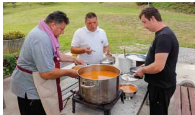
Ručak za dobrodošlicu mještanima na svečanost blagoslova

DŠR SALINOVEC Jubilarna 10. biciklijada „Med skrajski bregi“