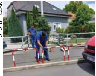
Sigurnosne barijere u spoju Rajterova-Malezova

Stupići su postavljeni i na svim ulazima u gradski park,