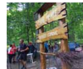
Na Černim mlakama

Iako, zbog epidemioloških prilika, ljetos na vrhu Ivančice nisu održane uobičajene sportske igre, brojni su posjetitelji lijep dan iskoristili za boravak u prirodi, druženje i opušta-