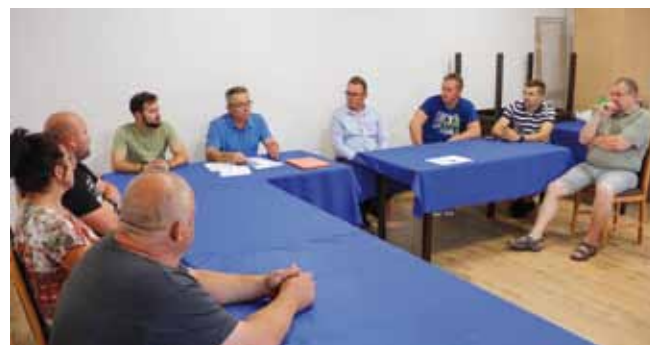
Vodstva jerovečkih mjesnih odbora gradonačelniku su izrazila punu podršku

U više navrata argumentirao je da ne postoji zakonska osnova temeljem koje bi ičije vanjsko smeće moglo u Jerovec. U korist toga govore brojni dokumenti u posjedu Grada Ivice i Ivkoma d.d. Riječ je o Ugovoru o korištenju sredstava Fonda za zaštitu okoliša u sufinanciranju programa sanacije odlagališta u Jerovcu; Dodatku osnovnog ugovora o korištenju sredstava Fonda; o Studiji ciljanog sadržaja utjecaja na okoliš za sanaciju i nastavak odlaganja do zatvaranja odlagališta Jerovec; o glavnom i izvedbenom projektu sanacije odlagališta; Planu sanacije i zatvaranja Jerovca; Elaboratu gospodarenja otpadom iz 2018; Dinamici zatvaranja odlagališta