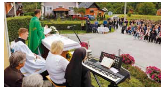
Misa kod kapelice sv. Križa

Salinovečka biciklijada vrijedna je rekreacijska manifestacija koja ima i turistički karakter, a kojom se na razini Grada Ivanca potiče razvitak cikoturizma. (ljr)