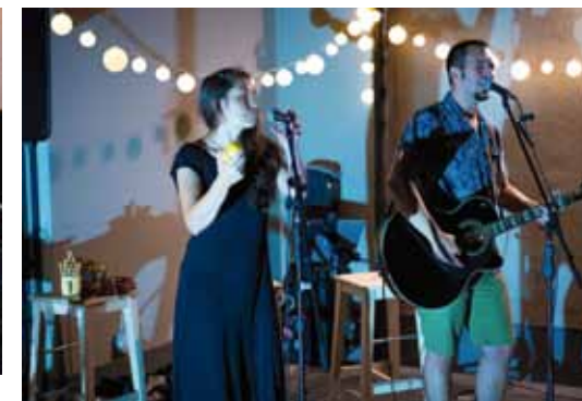
Na terasi Kluba mladih zabavno uz Juraja Jurline

ljene nastupom Juraja Jurline. U paviljonu u gradskom parku organiziran je i acoustic night Dina Jelusića, odnedavno člana legendarnih britanskih Whitesnakea.