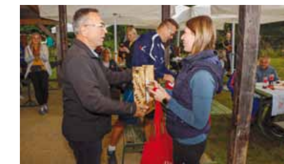
Čestitke i pokloni svim ekipama