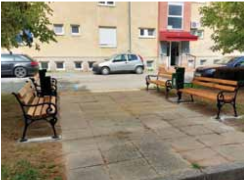
Nove klupe kod zgrada u Gajevoj ulici