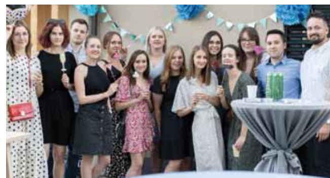
Ivanečka mladež na službenom otvorenju prostora

dugi rok zadovoljene potrebe za prostorom triju ivanečkih udruga koje okupljaju velik broj članova.