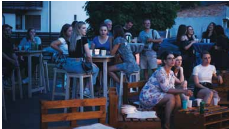
Glazbeni ugodaj na terasi

Zgrada raspolaže sa četiri velika suvremena prostora za rad udruga, čajnom kuhinjom, atraktivno dizajniranom nadstrešnicom s južne strane i vanjskom terasom. Kompleks je ograđen novom ogradom, a eksterijer posve uređen i na tom prostoru mladi su kroz ljetne mjesece organizirali više druženja i glazbenih priredbi.