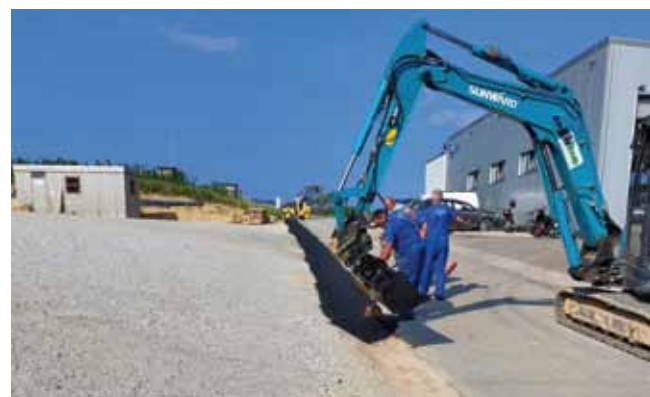
Gradnja mulde uz NC u Gačicama

stambenih zgrada u Ulici Ljudevića Gaja postavljene su četiri nove klupe za odmor i predah stanara te dva nova koša za smeće.