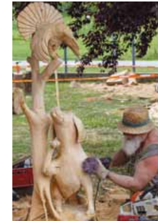
Iz kvrgavog stabla umjetnik je izvuкао predivan lovački motiv