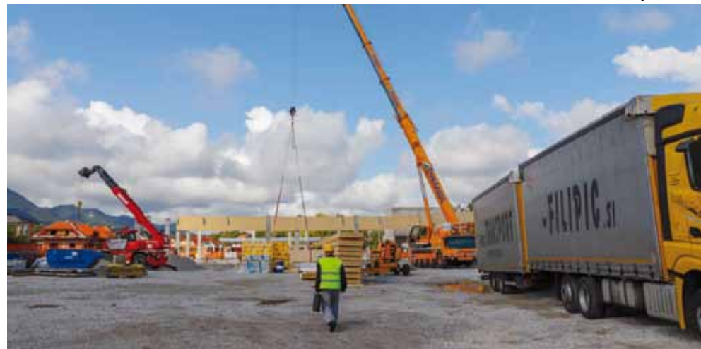
Gradi se na površini od čak 7.600 m 2

–Trenutačno se teškim dizalicama montira drvena krovna