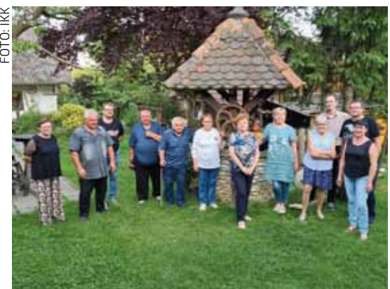
Sa izborne skupštine Ivanečkog kluba kolekcionara

KOLEKCIONARI Održana Izborna skupština Ivanečkog kluba kolekcionara