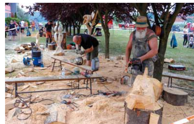
Likovna kolonija u Salinovcu jedinstvena je u Hrvatskoj

Festival je održan pod pokroviteljstvom Grada Ivanca i TZ-a, a sjajan domaćin bio mu je DŠR Salinovec