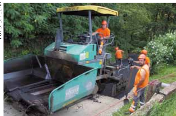
Asfaltiranje ceste prema Pethrasti u Salinovu

Postupak javne nabave za uređenje ovih odvojaka je raspisan, a procijenjena vrijednost radova je oko 2,6 milijuna kuna. Gradić će se i javna rasvjeta. Ovi radovi vrijedni su 400.000 kuna, a njihovo je obavljanje povjereno Elektro Golubu iz