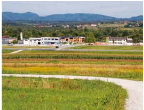
Nova građevinska zona - na istočnom izlazu iz Ivanca u pravcu Ivanečkog Naselja

◆ Glavnina zone bit će namijenjena isključivo stanovanju, dok će koridor uz državnu cestu biti rezerviran za poslovne sadržaje