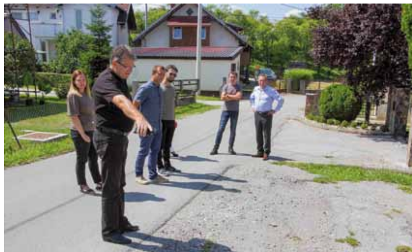
Na licu mjesta tražila su se rješenja za probleme koje građanima stvaraju oborinske vode

i po njemu ćemo rješavati sve uočene problematične lokacije. Iako je plan da se dotad u ove radove uloži blizu 2 milijuna kuna u gradnju i održavanje, sigurno je da će ulaganja biti i veća. Ove godine smo za gradnju sustava oborinske odvodnje osigurali 362.000 kuna te još 150.000 kuna za održavanje – istaknuo je gradonačelnik. (ljr)