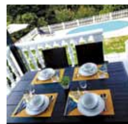
Gradonačelnik M. Batinić: Grad će potpore dodjeljivati aktivno i kontinuirano