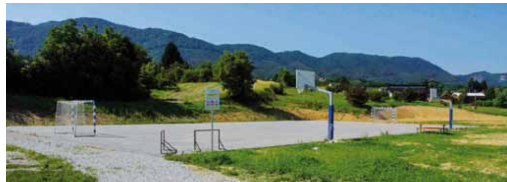
Projekt SRC-a Lančić-Knapić kandidira se za sufinanciranje iz EU fondova

Što se tiče Studija Nexar i dosadašnje suradnje s Gradom, u pitanju nisu neki respektabilni financijski iznosi. Moj zamjenik je već ispunio sve obveze prema Povjerenstvu za sukob interesa i zatražio od njega mišljenje. Prije nego što bilo što insinuirati, dajte dokaz! Nemojte neargumentirano optuživati i insinuirati jer svima nam je dobro poznato lice i naličje ove vaše priče.