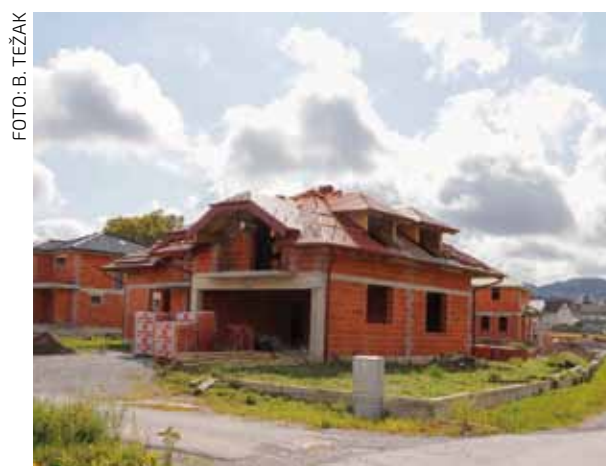
I nova zona planira se urediti po modelu urbane komasacije kakav je Grad primijenio u Preradovićevoj ul., koja sada građevinski „bukti“

U prvom koraku provest će se javna nabava za izradu projektne dokumentacije cestovne infrastrukture, dok će se u narednom periodu etapno pristupiti otkupu zemljišta i izgradnji. S obzirom na velik interes javnosti, o ovoj ćemo temi izvještavati kontinuirano.