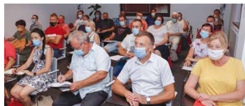
Velik interes za gradski Program turističkih potpora

– Ovaj Program logičan je nastavak već prije započetih aktivnosti na razvoju turizma u našem kraju (Muzej planinarstva, brendiranje Ivanca kao Planinarskog grada, obnovljena Piramida i Stričevo na Ivančici, Mlinarska šetnica itd.). Na žalost, te je aktivnosti, taman kad su se zahuktale, zaustavila korona. Poboljšanje epidemiološke situacije sada iskoristavamo kako bismo