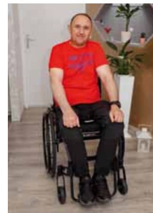
Mladenu stižu modernija invalidska pomagala

Nabava kolica i pomagala je u tijeku i bit će realizirana idućih dana, a o svemu ćemo posebno izvijestiti. (lir)