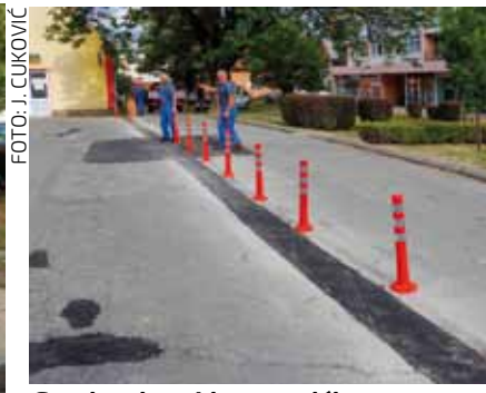
Gumirani parking stupići na parkiralištu u Nazorovoj