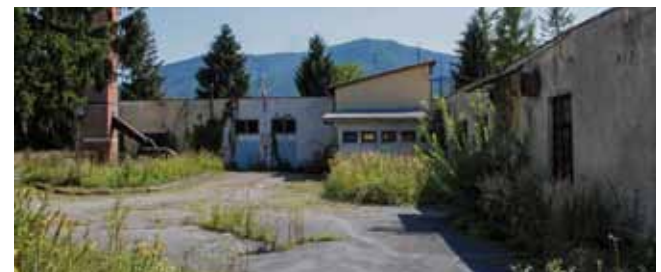
Pošto država nije reagirala na nalog da pokosi krug Varteksa, Grad je angažirao izvođača te račun ispostavio Ministarstvu graditeljstva

Pošto ministarstvo nije reagiralo na nalog da očisti krug Varteksa od raslinja i korova, to je u kolovozu učinio Grad te fakturu za obavljen posao poslao Ministarstvu graditeljstva.