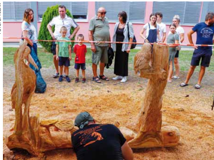
Mnoštvo posjetitelja u obilasku nesvakidašnje umjetničke manifestacije