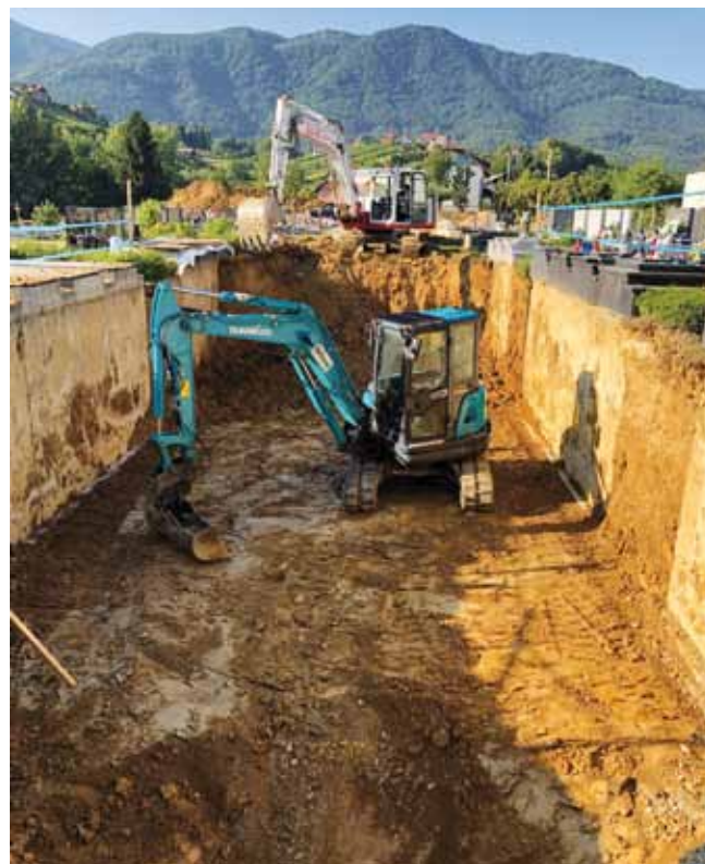
Održan i sastanak s predstavnicima vlasnika grobnica na kome su im izložena konačna rješenja

Po tom pitanju je održan i sastanak s predstavnicima vlasnika grobnica na kome su im izložena konačna rješenja, a oni su se s njima suglasili. Promemorija sa sastanka poslana je i svim