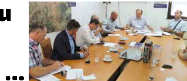
Potpisivanje ugovora o izvođenju radova na Aglomeraciji Ivanec