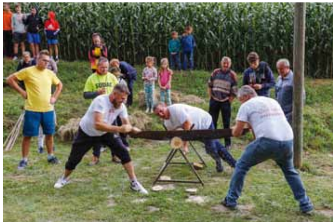
Čini se jednostavno, ali piliti – treba znati!

– Posebno smo ponosni što se ove godine susretima odazvao rekordni broj djece. Zahvala za uspješno provedene igre ide brojnim volonterima koji su danima pripremali sve potrebno kako bi oko 150