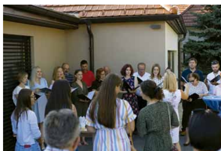
Ivanečki zbor pjesmom je proslavio ulazak u nove prostore

Uputila je zahvalu i svim volonterima koji su doprinijeli realizaciji ideje u čijem je fokusu bilo dobivanje prostora koje će mladi urediti i koristiti po svojoj volji. A upravo mladi bili su ti koji su kroz protekle dvije godine ne samo radili (čistili, uređivali, montirali namještaj i opremu, terasu opremili ručno