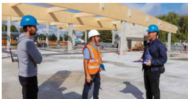
Radovi napreduju brzo jer otvaranje novog objekta planira se već potkraj listopada

URBANO UREĐENJE U Ivanca tijekom ljeta, na više lokaliteta