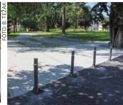
Stop ulasku vozila u park!