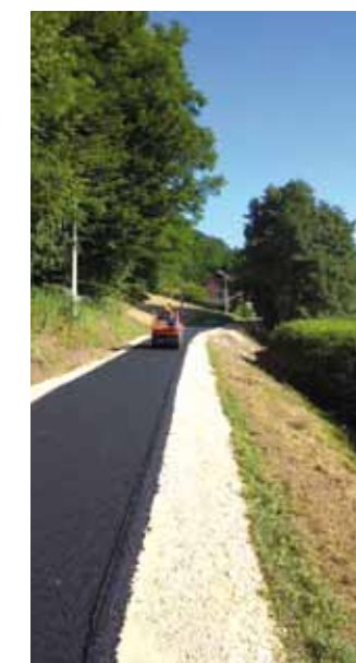
Asfaltiranje ceste u Osečkoj

Iz ovoga proizlazi da će u modernizaciju gradskih cesta i ulica Grad Ivanec ove godine uložiti rekordnih 7,05 milijuna kuna, a pod novim asfaltom i nogostupima naći će se novih 4,8 km nerazvrstanih prometnica. (ljr)