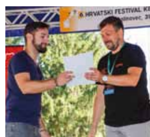
Zahvala domaćina pokrovitelju

Sudionici su svoje umijeće pokazali u izradi glavne skulpture velikih dimenzija motornom pilom te u disciplini speedcarving. Kiparima mašte nije nedostajalo pa su tako pred očima posjetitelja iz neuglednih drvenih trupaca pilom „izvlačili“ razne motive, od vilenjaka i ženskih likova, od sova, čukova, tetrijeba, kozoroga i drugih šumskih