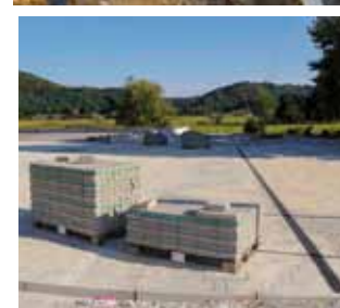
Tlakavcima se opločava 1.000 m 2 budućeg manjeg trga

Radovi teku po planu i završit će ovog mjeseca