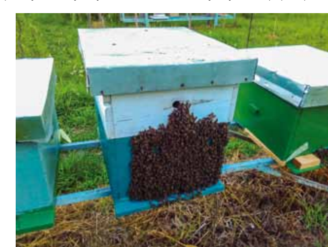
Pčele nemaju dovoljno meda ni za sebe...

Tom su prilikom pčelari istaknuli kako tešku