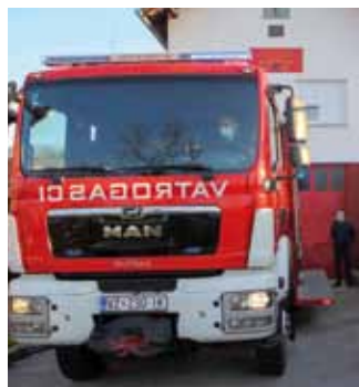
Za vatrogastvo iz proračuna nikad više nego dosad; novo vozilo je ove godine dobilo DVD Radovan

znatna sredstva za pojedine investicije povuče temeljem raspisanih javnih poziva od strane Fonda za energetske učinkovitost.