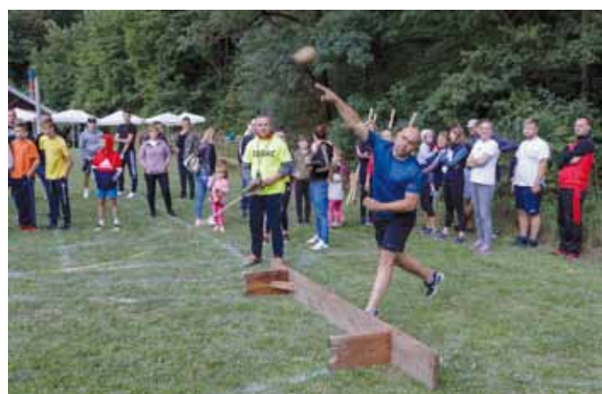
Bacanje kamena s ramena tradicionalna je disciplina Stažnjevečkih susreta

Razne discipline i šašava nadmetanja nasmi-jala su i opustila građane te pokazale u koliko su mjeri željni druženja i zabave