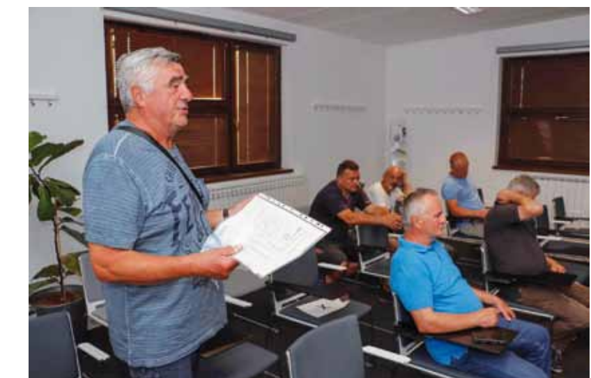
Pčelari: Najteža godina u zadnja tri desetljeća!