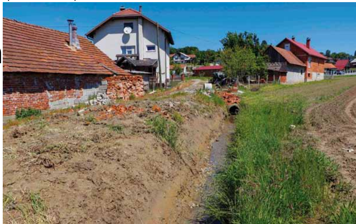
Obavljeni radovi u Bedencu

Naravno da su na ulice odmah izašli i sami građani, koji su skrenuli pažnju na još nekoliko problematičnih mjesta pa se na licu mjesta razgovaralo o načinima rješavanja problema na mjestima gdje je nužno intervenirati kako bi se spriječilo da građanima oborinske vode ulaze u dvorišta, nanose šljunak i poplavljaju podrum. Već idućih dana na pojedinim mjestima su u tom cilju