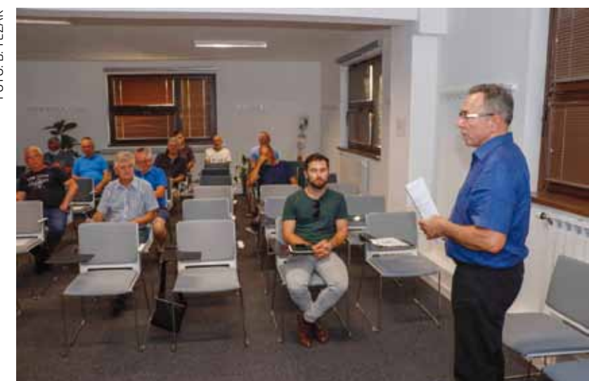
Batinić: Grad će pomoći pčelarima