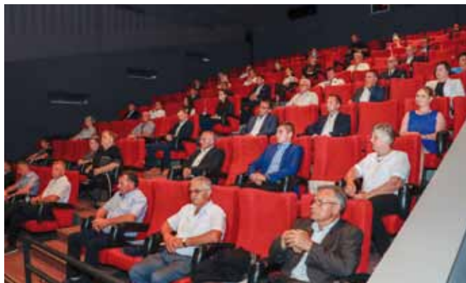
Sa svečane sjednice Gradskog vijeća o 625. obljetnici Ivanca

– Brzu cestu čekamo već 20 godina, a ona je važna kao žila kucavica koja će povezati Medimursku, Varaždinsku i Krapinsku županiju. Dakako da je važna i pruga. Omogućite nam da konač-