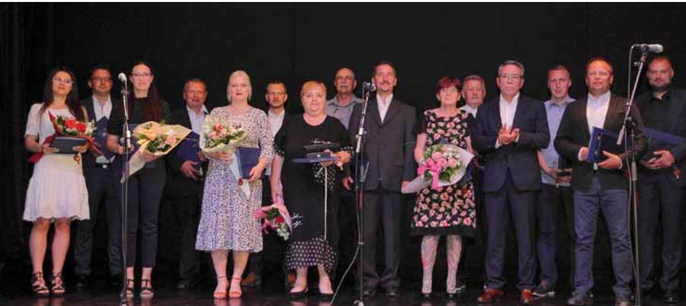
Dobitnici javnih priznanja Grada Ivanca 2021. godine

Skrenuo je pažnju i na potrebu pojednostavljivanja propisa oko realizacije projekata iz EU fondova. Nedopustivo je da Grad, kazao je, projekt poput gradnje ceste u Prigorcu, napravi za 6 mjeseci, ali zato je cijela procedura koju su provodila resorna ministarstva i posrednička tijela trajala 4 godine! K tome, tako dugo dok cijeli takav proces i službeno nije završen, Grad ne može kandidirati novi projekt na EU mjeru, već je prisiljen s njima godinama čekati.