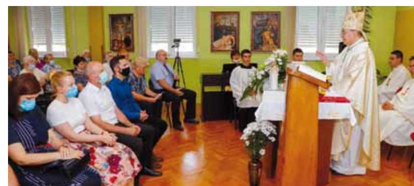
Misno slavlje predvodio je biskup Bože Radoš

–Grad Ivanec iznimno je ponosan na ovaj Dom. Drago mi je što ste, i unatoč epidemijskoj situaciji, uspjeli ovako svečano proslaviti ovu lijepu obljetnicu. Briga za stare i nemoćne u fokusu je Grada Ivanca. Pozivam vas da kod budućih projekata koristite usluge Projektnog ureda koji