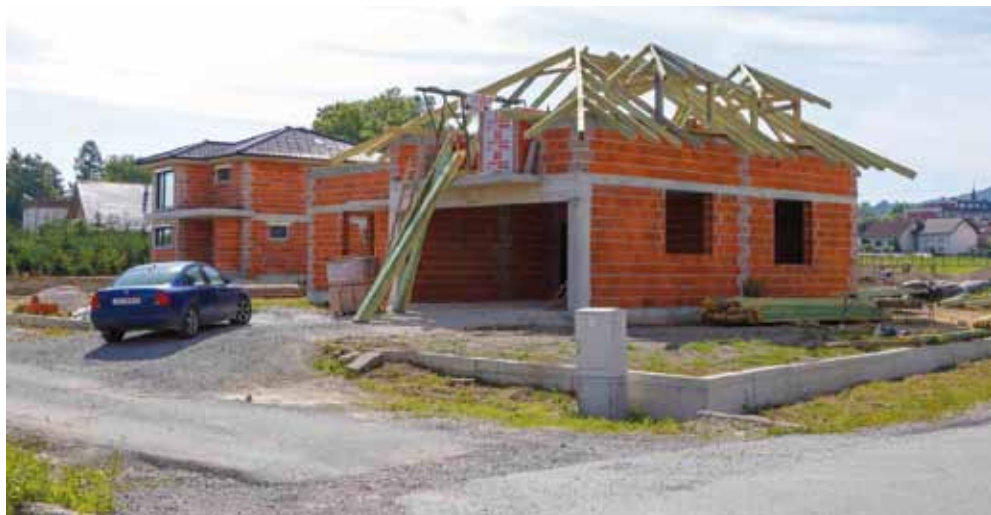
Grđevinski radovi u novoj zoni u punom su jeku

PRERADOVIĆEVA ULICA U tijeku investicija poduzeća Botković Trade d.o.o.