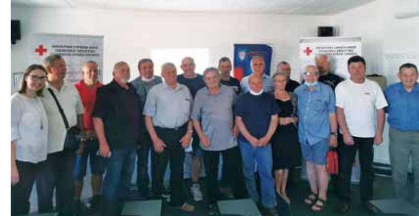
Klub 100+ ivanečkog Crvenog križa