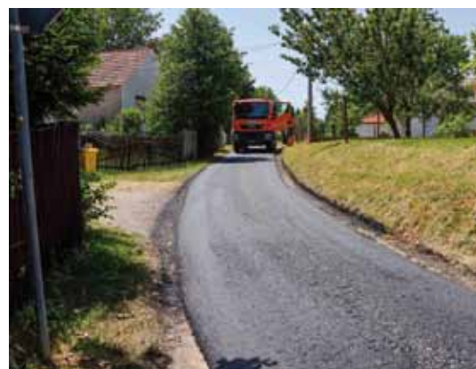
Moderniziran je odvojak Ratkaji u MO-u Gačice