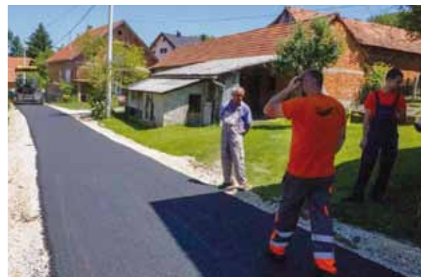
U MO-u Stažnjecima su asfaltirane sve dionice planirane za 2021.

Radovi su vrijedni milijun kuna, a u cijelosti ih financira Grad Ivanec