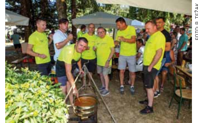
U dobrom raspoloženju uz kotlić