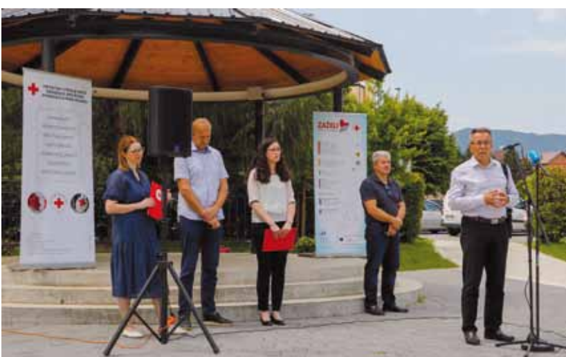
U partnerstvu – novi projekti radi stvaranja još kvalitetnijeg socijalnog okruženja

Ovim projektom je na području grada Ivanca zaposleno 5, a na području općine Maruševac 2 žene na poslovima njege i pomoći u kući starijim i bolesnim osobama. One se brinu o ukupno 65 osoba u prosječnoj dobi od 72 godine. Pomažu im u nabavi hrane, potrepština i lijekova, u održavanju čistoće stambenog prostora, u donošenju drva za ogrjev, u obradi vrta itd. Svi troškovi se u 100%-nom izno-