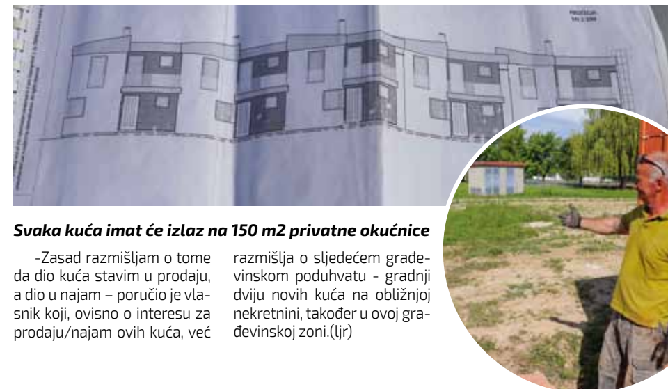
Svaka kuća imat će izlaz na 150 m 2 privatne okućnice

Sve objekte investitor pod krov namjerava staviti do kraja ove godine te ih zatvoriti ugradnjom stolarije, dok će završna faza radova uslijediti iduće godine. Ono što nije dobro, ističe Botković, jest veliko poskupljenje materijala, čije cijene skaču nebu pod oblake (da li zbog povećane potražnje radi obnove područja stradalih u potresu?), zbog čega još uvijek ne može izvesti preciznu kalkulaciju konačnih prodajnih cijena.