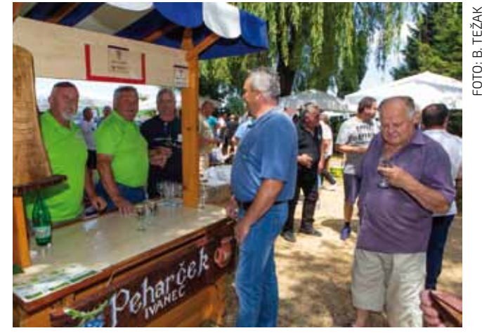
Peharčeki su podijelili više od 100 litara vina