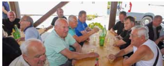
Lijepo se ponovno sastati, popričati, obnoviti uspomene

pu uputio zahvalu na dodjeli prostora za rad braniteljskih udruza u Gajevoj 11. Zahvalio