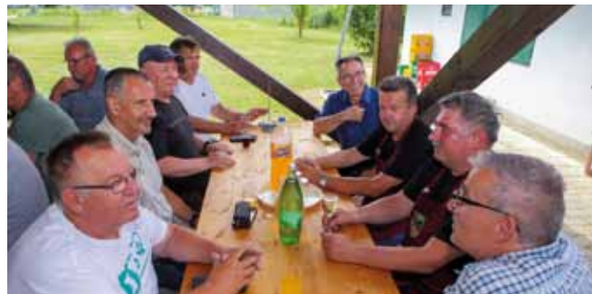
Druženje pripadnika 2. ivanečke bojne 104. brigade

–Već smo počeli s pripremanja za izložbu ratnih fotografija u Muzeju planinarstva u povodu 30. obljetnice od početka Domovinskog rata i oslobađanja vojnog objekta na Ivančici. Planiramo i posjet području Pakraca i Lipika, za koje je vezan ratni put 104. brigade – najavio je Geci te Gradu Ivan-