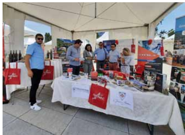
Na štandu Grada Ivanca i partnera na 7. gospodarskom sajmu u Varaždinu

Ova baza podataka povezat će se s nacionalnim sustavom identifikacije zemljišnih parceli ARKOD te na taj način svima zainteresiranima omogućiti geografski pregled lokacija. Unos