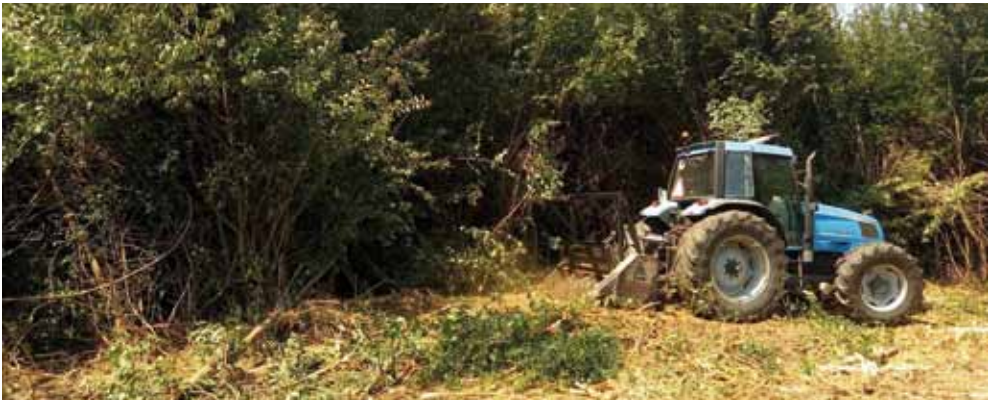
Ne možete ili ne želite obrađivati svoje livade ili njive? Dajte podatke za prodaju ili najam!

Prema Zakonu o poljoprivrednom zemljištu, vlasnici svoje poljoprivredne površine moraju održavati i to najmanje dvaput godišnje. Mnogima je to problem iz raznih razloga.