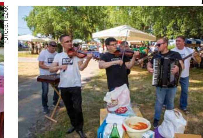
Faringaši su si zadali zadaću da zasviraju kod svake ekipe

ekipi nas je 15! – rekoše nam za kotlićem MM Projekta. Filing im se pokazao dobar, jer – ekipa je osvojila pobjednički naslov!