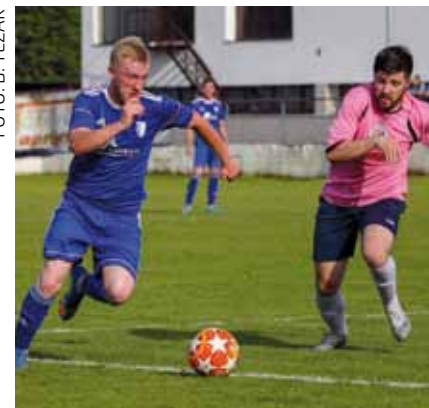
S utakmice Ivančica – Plitvica Gojanec (4:1)

Ivančica je zatim na vrućem gostovanju u Dunjkovcu svladala drugoplasiranu momčad lige, Međimurec, s 3:1, u utakmici gdje je naprosto pregazila domaću momčad. Terenski su dominirali i uputili 15 udaraca na gol domaćina, pri čemu se osobito istaknuo Božak, koji je postigao sva tri pogotka. Time je ujedno prekinuo niz od četiri uzastopna poraza svoga kluba u prvenstvu.