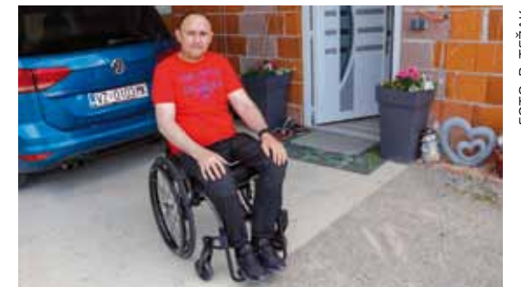
Mladenu će nabava elektromotornog pogona za kolica omogućiti veću mobilnost i samostalnost

–U takvim okolnostima promijeni vam se cijeli život. Kuću je trebalo prilagoditi za invalidska kolica, urediti poseban sanitarni čvor i cijeli život iznova preorganizirati. Bezgranično sam zahvalan dečkima koji