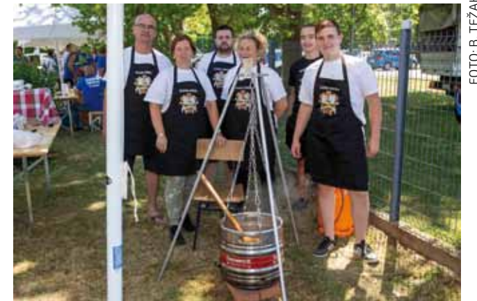
Ekipa Glasne kubure iz Kamenice: Htjeli su i puknuti iz topa, ali možda neki drugi put

nije nagovarala da kušaju gulaš i obavezno popiju gemišt, medicu, viljamovku, šljivku i ostala tekuća pitanja koja su se hladila po kantama i badnjevima.