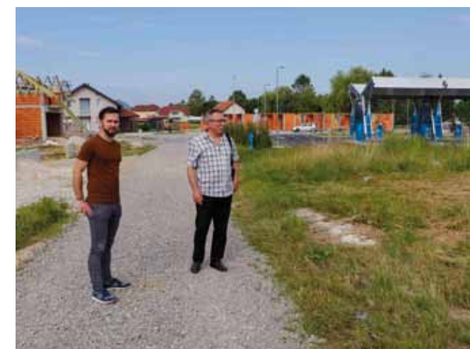
Čelnici Grada u obilasku: Do jeseni u zoni C-3 asfaltiranje dviju prometnica za potrebe stanara i poslovnih subjekata