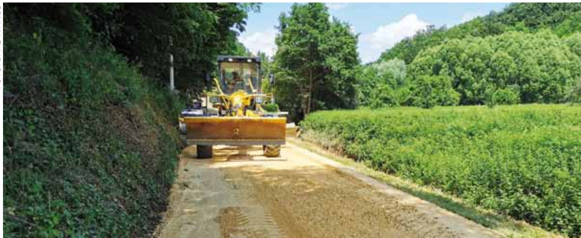
Priprema za asfaltiranje ceste u Osečkoj, kod groblja u Margečanu