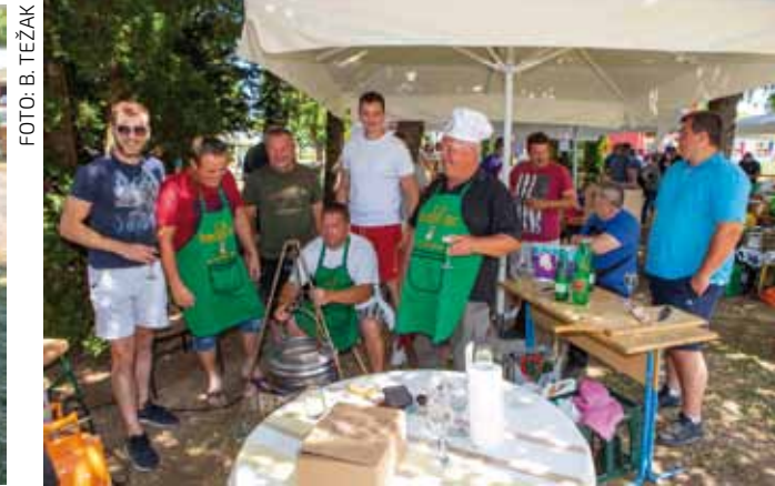
Dobro raspoloženje kod Šumskog zeca iz Margečana