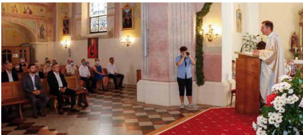
Svečanu misu u povodu blagdana sv. I. Krstitelja predvodio je župnik vlč. K. Stojko

zahvalio gradonačelniku Batiniću na iznimno dobro i uspješnoj suradnji Grada i Župe te osobito zadovoljstvo iskazao radovima na uređenju kapelice sv. Ivana Krstitelja na vrhu Ivančice koja dobiva novo ruho. Time će se završiti radovi započeti prije puno godina, a kojima će se omogućiti svim vjernicima da na vrhu najviše zagorske gore slave Ivana Krstitelja. Onoga koji je ukazao na Isusa kao Jaganjca koji oduzima grijehe svijeta te svoje učenike uputio da više ne slijede njega, nego Onoga koji je došao i kojemu on nije dostojan razriješiti ni obuću na nogama.(aj,ljr)