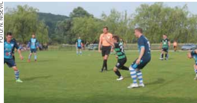
NK Mladost Margečan – Budućnost Vidovec (1:5)