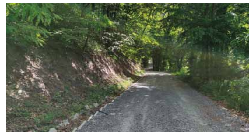
Kanalice su bile zapunjene lišćem, pijeskom i zemljom

strukture za 2021. godinu. Poput mnogih sličnih radova koje na cijelom administrativnom gradskom području provodi gradska uprava, i ovaj zahvat jedan je u nizu malih komunalnih radova usmjerenih prema poboljšanju lokalne infrastrukture i kvalitete života stanovništva u mjesnim odborima. (ljr)