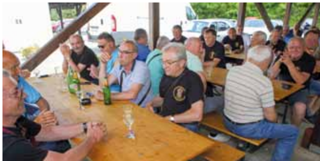
Nakon dugih korona dana – ponovno na okupu