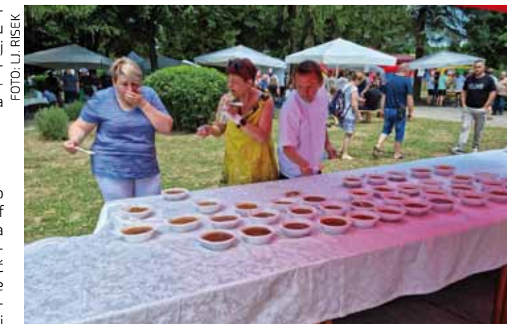
Prosudbeno kuharsko povjerenstvo: Stvarno im nije bilo lako!

Recept za najgulaš: Moraš biti z Ropasa!