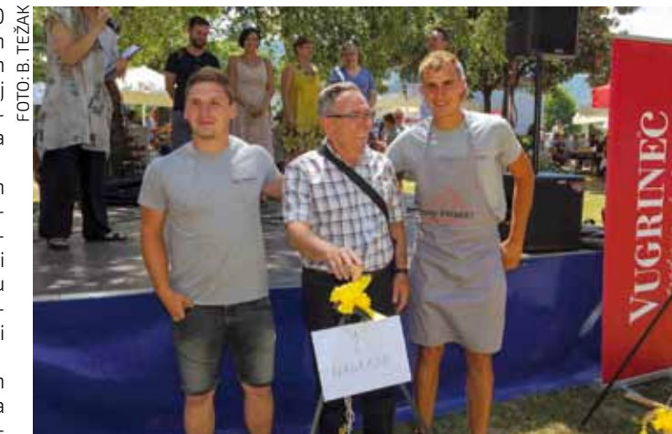
Filing ih nije prevario: Prvo mjesto MM Projektima iz Ivanca!

Kotliću su poklon Grada Ivanca, a kuhače donacija Stol interijera Mladena Canjuge.