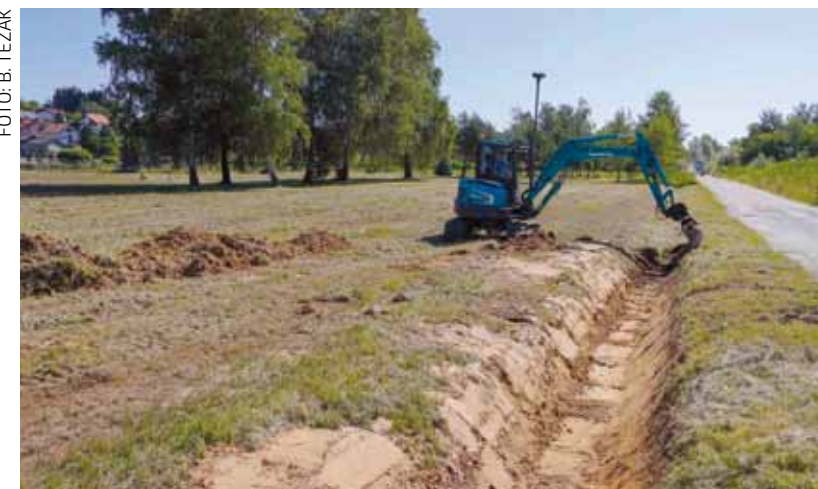
Prokopan je kanal kojim će oborinske vode ubuduće nesmetano otjecati