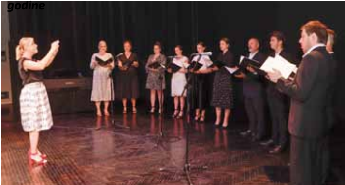
Vokalni sastav KUD-a Rudolf Rajter Ivanec

–Ove godine konačno počinje i Aglomeracija Ivanec. Ovaj dio Hrvatske sačuvao je industriju. Imamo i nova ulaganja u proizvodna industrijska postrojenja i pogone. Sjever Hrvatske ne treba ulaganja u šetnice. Mi trebamo ulaganja u gospodarstvo i u otvaranje novih prometnih koridora – istaknuo je.