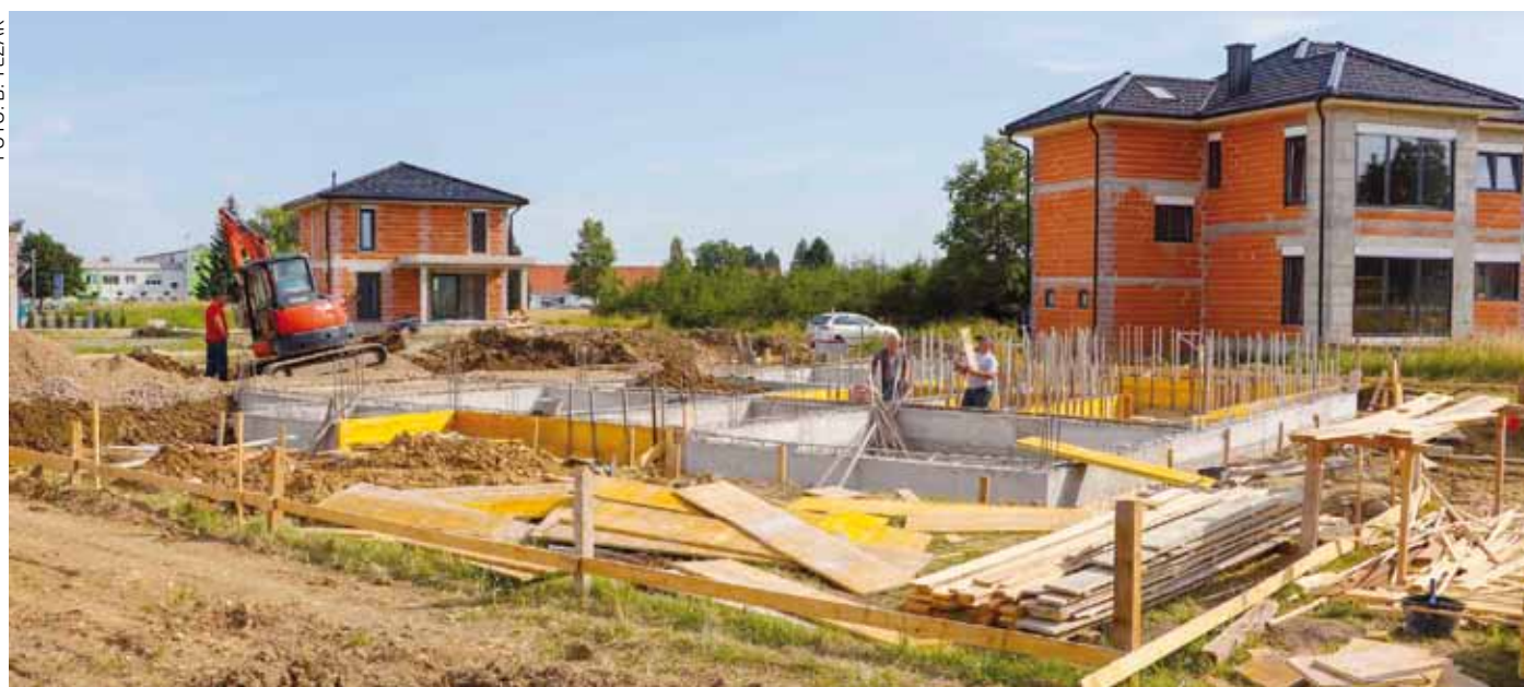
Neprestano se otvaraju nova gradilišta individualnih stambenih objekata