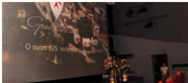
Film o Ivanu uz 625. obljetnicu grada

no prometno „prodišemo“, kako bi se Sjeveru Hrvatske omogućio daljnji napredak. Ovdje imamo povoljne trendove, nezaposle-