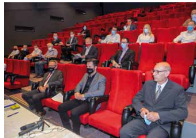
Konstituirajuća sjednica održana je u Kinodvorani Ivanec