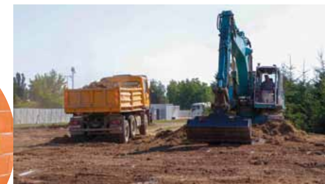
SPAR kreće s gradnjom novog prodajnog centra

Inače, SPAR kreće s investicijom vrijednom 5 milijuna eura, a u budućem prodajnom prostoru najavljuje zapošljavanje 40 novih radnika.