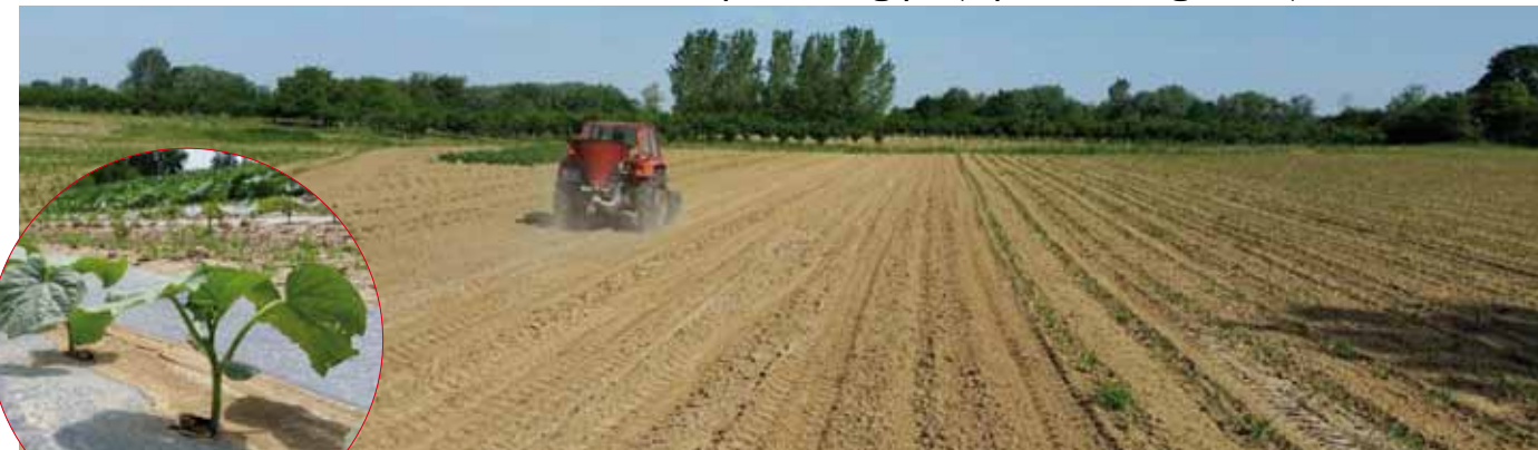
I na našem području ima proizvođača koji bi rado vaše zapuštene površine obradili i na njima pokrenuli poljoprivrednu proizvodnju

Grad poziva sve vlasnike da dostave podatke o svom zemljištu u cilju formiranja jedinstvene baze podataka te da time svoje zapuštene njive stave na raspolaganje za prodaju ili davanje u najam