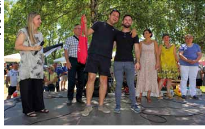
Vesjelje ekipe Susjedstva iz Preradovićeve osvojenom nagradom