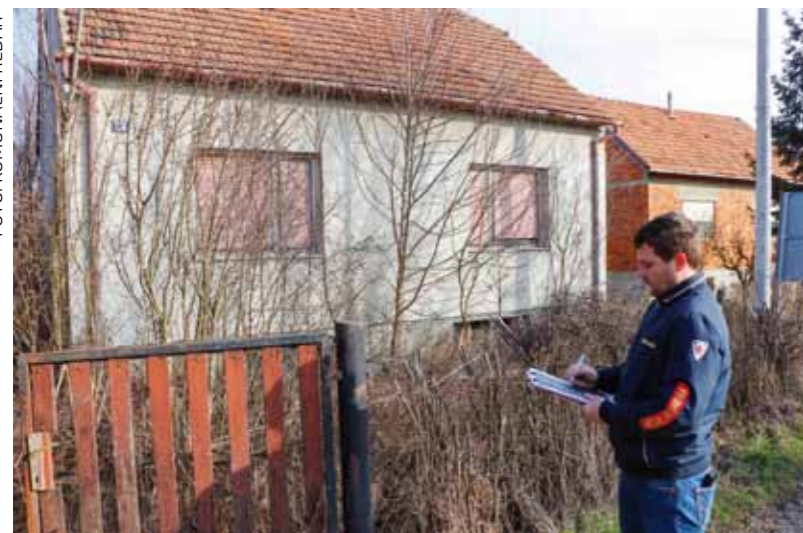
Zakonska obveza svakog vlasnika/korisnika jest održavanje okućnice i uklanjanje stabala i raslinja