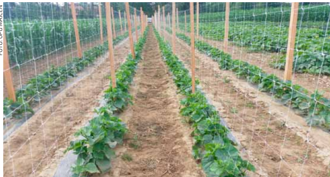
Nasad kornišona OPG-a Majcen

PEHARČEK Članovi Udruge vinogradara dobrovoljnim radom uređuju prostore za rad