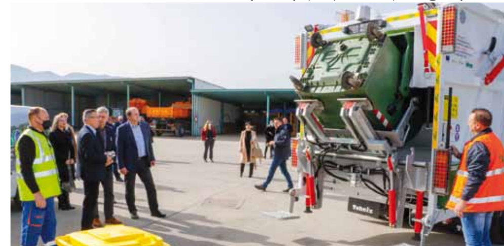
Na primopredaji novog vozila nabavljenog iz EU sredstava

IVKOM Suvremeno vozilo za prikupljanje odvojenog otpada