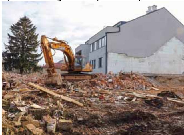
Rušenje trošne zgrade nekadašnjeg Metalca

♦♦ MIPCR0 na mjestu porušene zgrade najavljuje gradnju objekta s 25 do 30 stanova, s podzemnom garažom i poslovnim prostorima