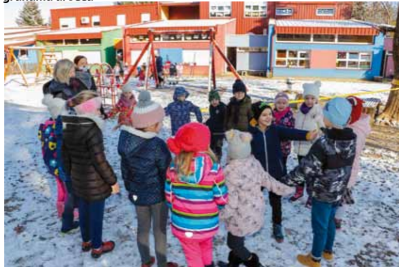
Veselo i šareno, kako na svadbi i mora biti!