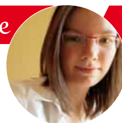
Piše: Ana Škriljevečki, mag. hist.