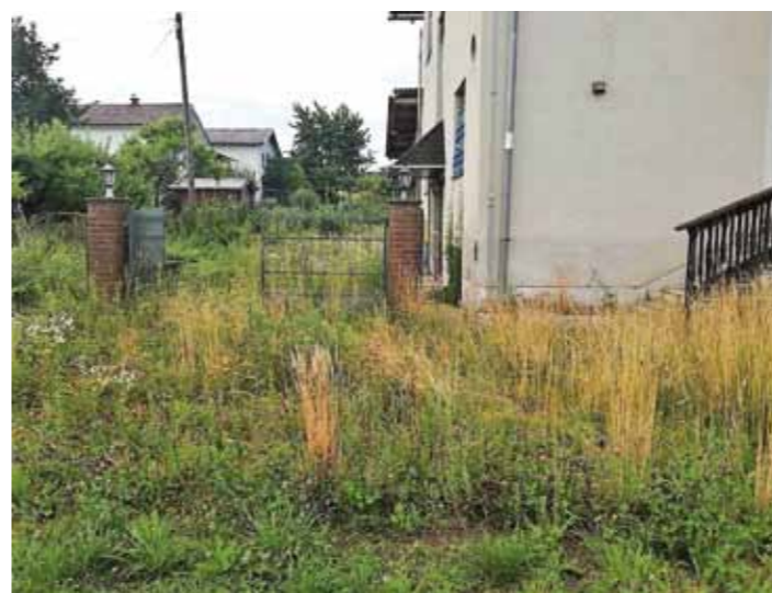
Održavajte urednim svoja dvorišta i okućnice

POLJOPRIVREDNO REDARSTVO Poziv svim vlasnicima poljoprivrednog zemljišta