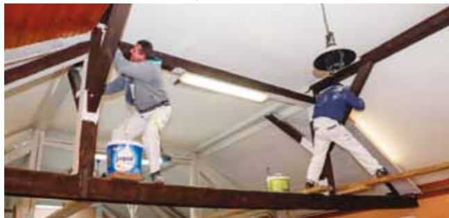
Dosad zapuštena dvorana pretvara se u ugodan prostor koji će biti na raspolaganju svim mještanima

♦♦ U cijelosti se adaptiraju velika dvorana, kuhinja, pomoćni prostor i sanitarni čvorovi, a staro grijanje zamijenit će novi radijatori i kondenzacijski kotao