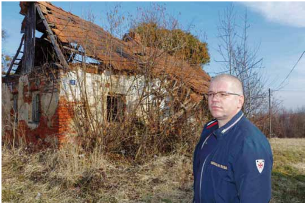
Komunalni redar ima ovlasti za izdavanje naloga za uklanjanje ruševine ili cijele građevine

Gradski komunalni redar može intervenirati i temeljem Zakona o građevinskoj inspekciji. On vam može narediti sljedeće: uklanjanje ruševine zgrade ili cijele građevine, otklanjanje oštećenja pročelja i pokrova postojeće zgrade koji nisu nosiva konstrukcija, kao i usklađivanje provedbe i uklanjanje zahvata u prostoru koji nije građenje. Također, može narediti i privremenu obustavu izvođenja radova, do vršetka vanjskog izgleda zgrade te izlaganje energetskog certifikata.