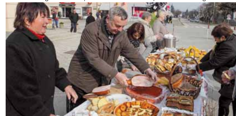
Domaći uskrsni specijaliteti (s uskrsne izložbe u Ivancu 2018.)