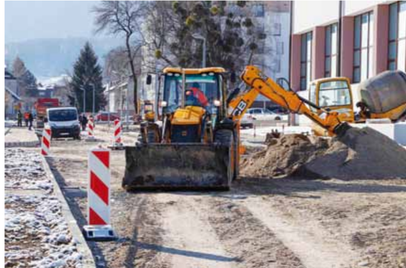
Nogostupi će biti sagrađeni obostrano duž cijele ulice

PUNIKVE Grad Ivanec obnavlja mjesni društveni dom, radovi vrijedni više od 375.000 kuna