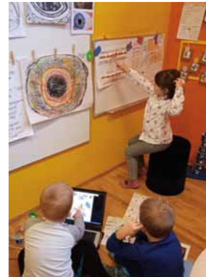
„Okno - propušćivač za sve kaj vidimo“

Potvrđuje to i podatak da se praksa iz DV Ivančice prikazuje odgojiteljima, ali i studentima ranog i predškolskog odgoja i pedagogije diljem Hrvatske i inozemstva kao primjer izvrsnosti u radu s mališanima.