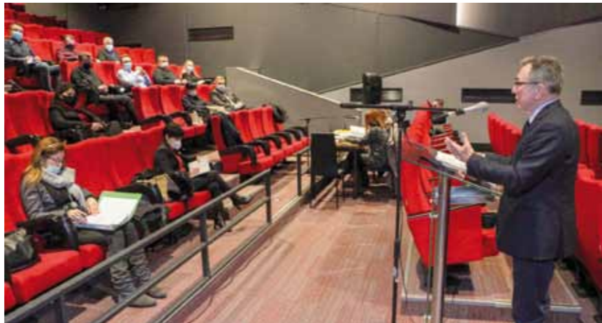
Niz vijećničkih pitanja za gradonačelnika na aktualnom satu Gradskog vijeća

jednog od društvenih objekata na Banovini (škole, vrtića, ambulante) ili obiteljske kuće, prema potrebi lokalne zajednice. Imali smo inicijativu građana da baš Grad otvori poseban račun za prikupljanje novčanih donacija jer neki nemaju povjerenja u neke druge institucije. Do ovog trenutka još uvijek nemamo točnu povratnu informaciju s terena u koji ćemo objekt uložiti prikupljena sredstva jer Vlada još nije utvrdila što će se sanirati europskim, a što državnim novcem – izjavio je gradonačelnik. (Ijr)