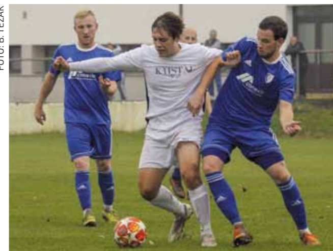
Potrebno je puno rada i treninga kako bi se momčad ponovno dovela u prijašnju formu

Ivančica je u svojoj trećoj trening utakmici svladala Dubravku