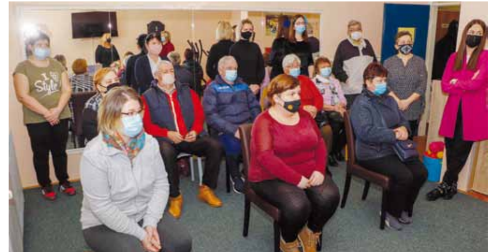
Osobni asistenti na edukaciji u prostorijama Ivanečkog sunca

OBLJETNICA Udruga osoba s intelektualnim oštećenjem Ivanečko sunce