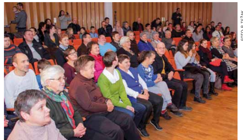
Udruga Ivanečko sunce svoje korisnike nastoji ih uključiti u život lokalne zajednice