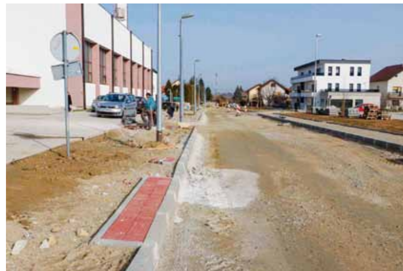
Već se naziru buduće moderne konture Kumičićeve ulice

S obzirom na opseg svih navedenih radova, njihov se završetak očekuje sredinom proljeća. (lir)