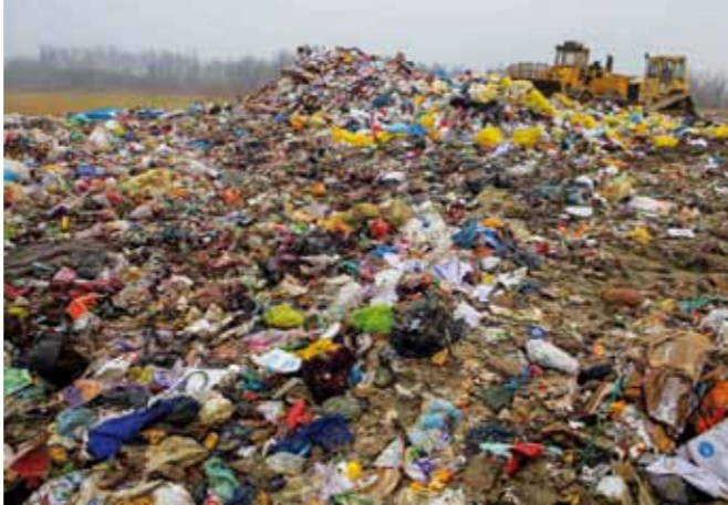
Pokušaj blokade Aglomeracije Ivanec uslijedio je nakon jasnog „ne“ odlaganju varaždinskog smeća u Jerovcu

da svaka strana u projektu maksimalno skрати rokove odlučivanja kako bi se što prije dovršili postupci odabira najpovoljnijeg naručitelja i definiralo dodatno financiranje. Također, Hrvatske vode će uložiti dodatne napore i pomoći da se uočeni problemi što hitnije riješe, a sve kako se ne bi usporavao i dodatno opterećivao ionako zahtjevan projekt. Kako je istaknuto, nema alibija da se nešto ne odradi. Ako Hrvatske vode budu imale informaciju da negdje nešto neopravdano dulje stoji, preuzet će direktnu odgovornost i djelovati vertikalno u cilju uklanjanja problema i ubrzanja donošenja i provedbe odluka. (ljr)