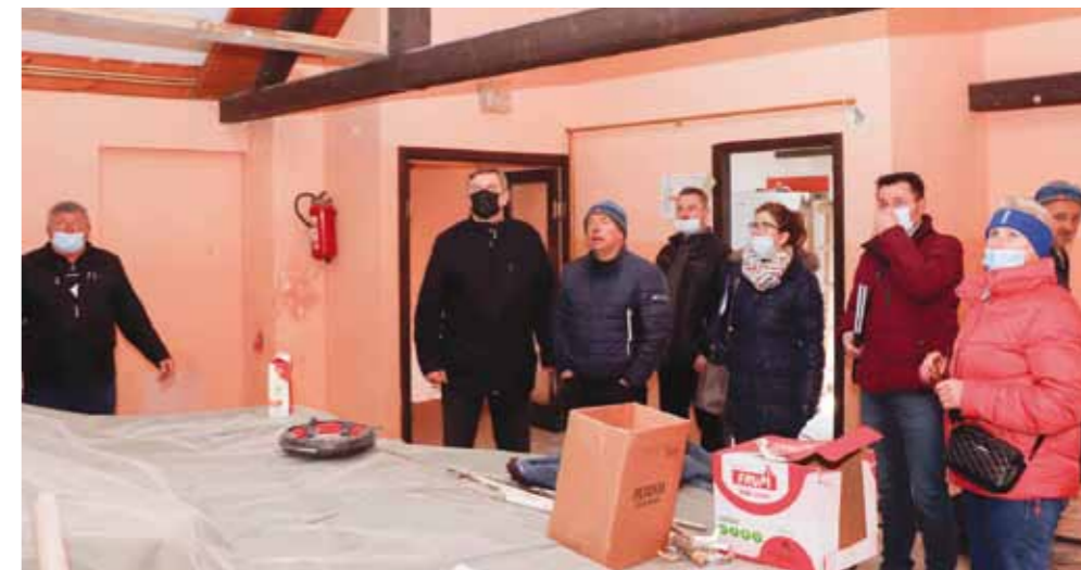
U obilasku objekta s predstavnicima Grada, MO-a, izvođača, nadzora...

Investitor radova je Grad Ivanec, iz čijeg će se proračuna podmiriti troškovi ugovorenih radova koji su vrijedni blizu 375.000 kuna. (lir)