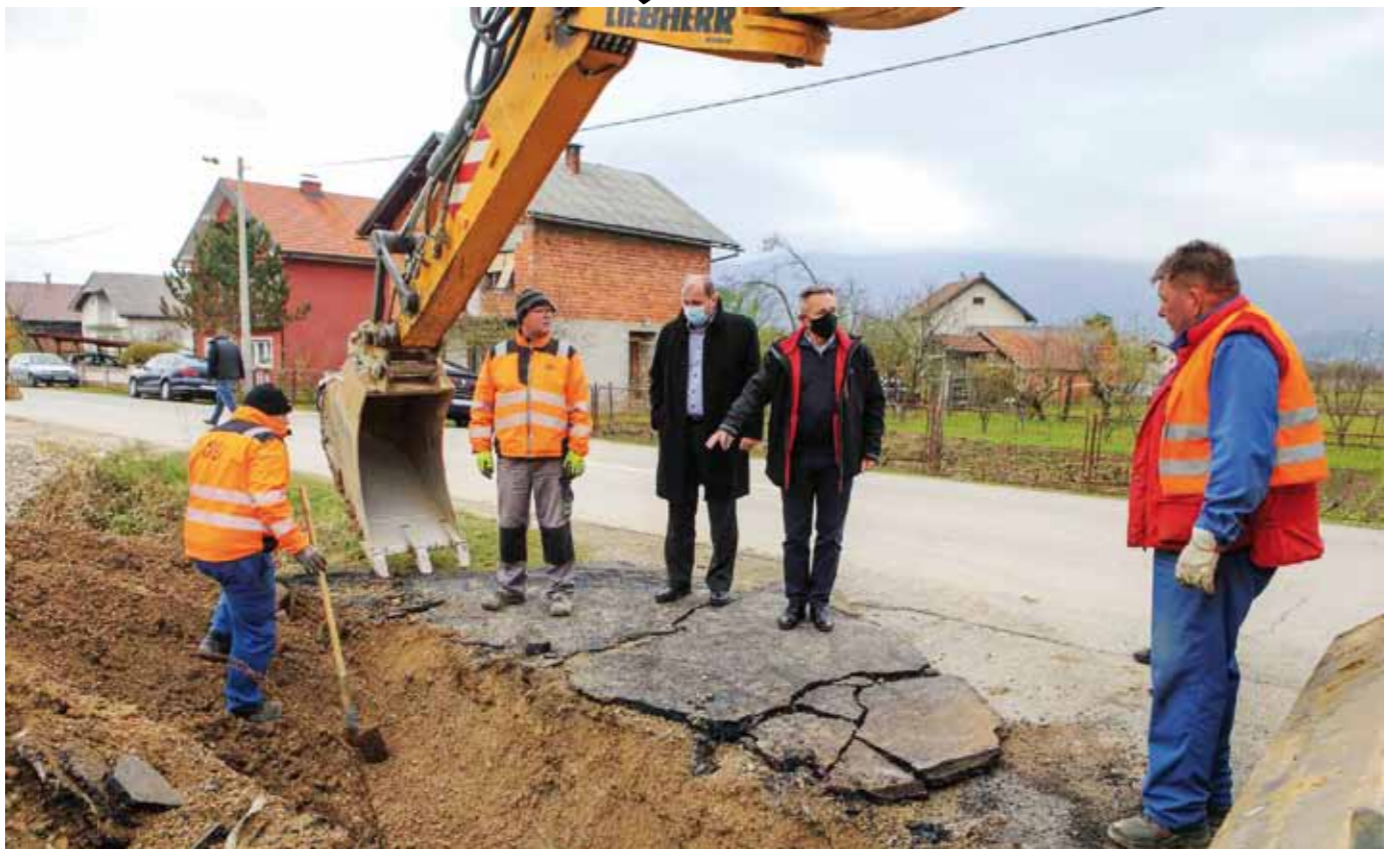
Dogovoreno je maksimalno ubrzanje svih preduvjeta za početak radova na Aglomeraciji Ivanec (ilustracija)

proračunu za 2021. osigurao predviđenih 3,04 milijuna za ovu godinu. Međutim, sada je uslijedilo novo poskupljenje pa bi Grad Ivanec trebao izdvojiti dodatnih 1,8 milijuna za Aglomeraciju. To je za gradski proračun golemo opterećenje koje će teško podnijeti s obzirom na pad prihoda zbog korona krize. Stoga apeliram na odobrena sredstva.