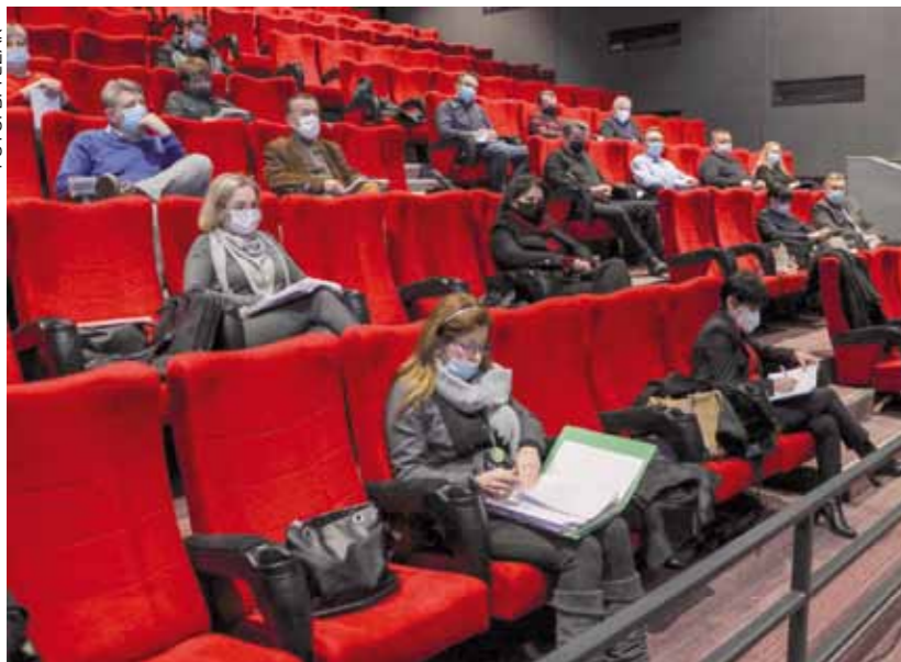
Sa 43. sjednice Gradskog vijeća Ivanec