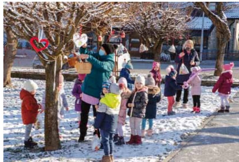
Nakon noćne svadbe, ptičeki su malenima ostavili poklončiće na granama drveća