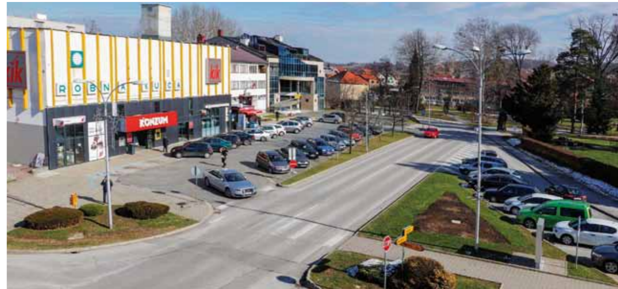
U cilju uređenja gradske špice potrebno je riješiti imovinsko-pravne odnose, velikom većinom na zemljištu u vlasništvu države i FINA-e