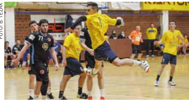
Nakon duge pauze zbog korone, prvu utakmicu su domaći rukometaši odigrali s Varaždinom 1930

RK IVANČICA Nakon višemjesečne pauze, ponovo na parketu