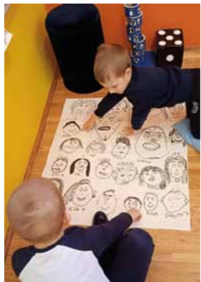
Naši sjajni klinci!