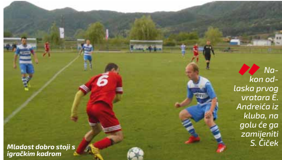
Mladost dobro stoji s igračkim kadrom