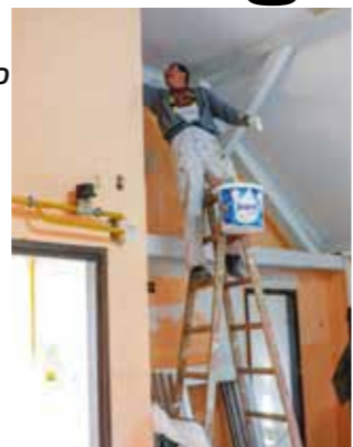
Opsežni radovi u velikoj dvorani društvenog doma