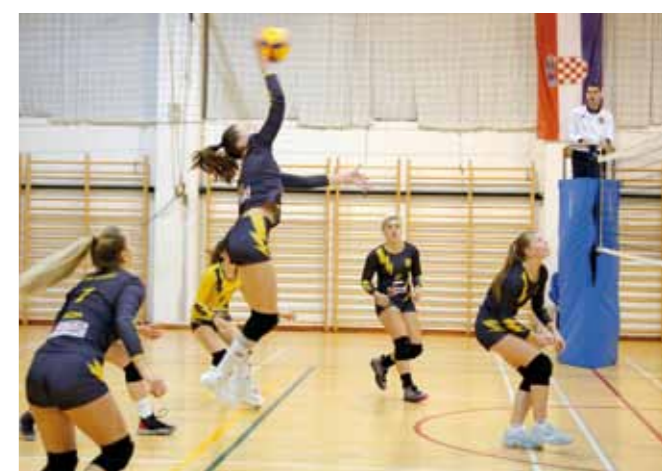
ŽOK Ivanec nalazi se u samom vrhu prvenstvene tablice