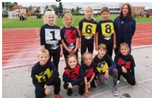
Nabava brentača omogućit će obuku mladih na tzv. vatrogasnoj stazi

Inače, spomenuti projekt DVD-a obuhvaća i rad sa članovima vatrogasne mladeži. Za njihovu poduku nabavljene su dvije brentače, čime su