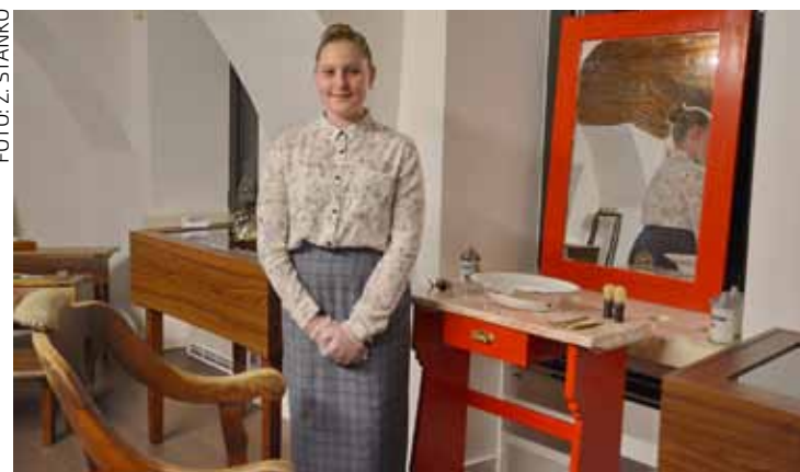
Uz povijesne stvari iz muzejske ostavštine

Središnjim programom, jednoglasnog naziva „Pavica“, predstavljani su život i djelovanje P.