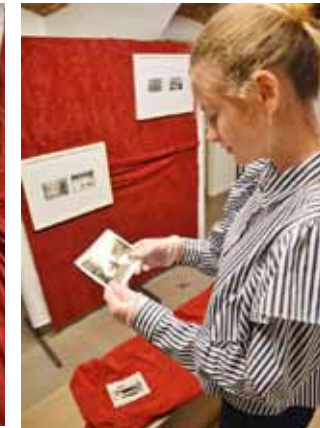
Pogled u prošlost