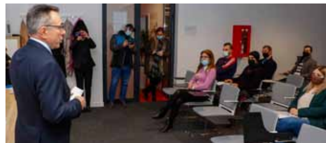
U prvom ovogodišnjem krugu ugovori o dodjeli stambenih poticaja potpisani su s 15 korisnika

Bude li potrebno, u proračunu će se osigurati dodatna sredstva za poticanje rješavanja stambenog pitanja