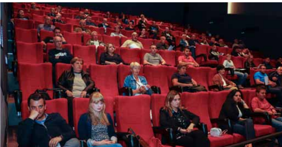
Velik interes građana grada Ivanca za energetske obnovu obiteljskih kuća

računati građani koji energetske obnovu financiraju sami, bez drugih javnih izvora financiranja i takvima će Grad energetske obnovu sufinancirati u vrijednosti