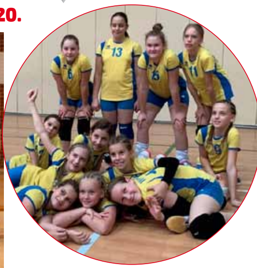
Ekipa ŽOK-a, 2009. god. - najbolja među ženskim mladim uzrastima