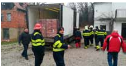
Članovi DVD-a Salinovec uključili su se u pomoć mještanima Slana

Članovi DVD-ova u sklopu Vatrogasne zajednice grada Ivanca među prvima su priskočili u pomoć pogođenim područjima. Iz VZ Ivanec odmah je na raspolaganje stavljeno 20-tak operativnih vatrogasaca s 3 kombi vozila i autoljestavama. Već 30. prosinca je od strane glavnog vatrogasnog zapovjednika zaprimljena zapovijed o mobilizaciji autoljestava DVD-a Ivanec i