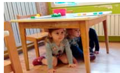
Sigurno mjesto u vrtiću