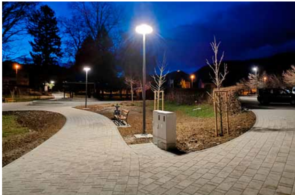
Noćna panorama parka pod LED rasvjetom

Nadalje, 1,3 milijuna kuna predviđeno je za održavanje nerazvrstanih cesta. Tu ulazi šljunčanje, čišćenje odvodnih jaraka i cesta od nanosa otpada i mulja, sanacija oštećenog asfalta, krpanje udarnih rupa, izrada muldi,