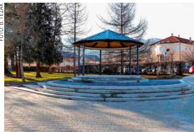
Novi paviljon – otvorena pozornica za predstojeća zabavna, glazbena i kulturna događanja u parku