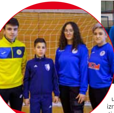
Najbolji sportaši grada Ivanca u 2020.

Dobro je dočekan i vijest da je prva seniorska momčad NK Ivančice, član 4. lige Čakovac –Varaždin, izabrana za najbolju mušku ekipu, dok je u ženskoj konkurenciji ovaj naslov osvojila 1. seniorska ekipa ŽOK-a Ivanec. Što se tiče NK Ivančice, momčad se plasirala u viši rang natjecanja, u jesenskom dijelu prvenstvene sezone 2019./2020. osvojila je 2.