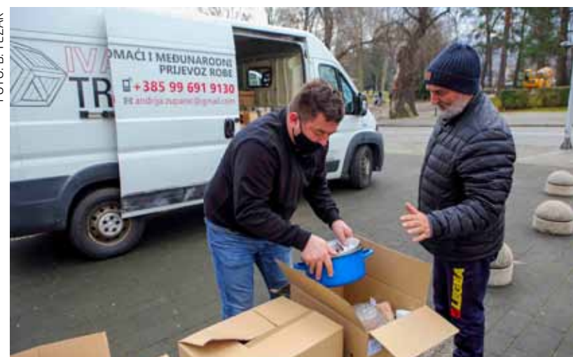
Sude koje su u akciji na gradskoj špići skupili građani upućeno je u sela glinskoga kraja

s prikupljanjem i isporukom donacija, a roba se može predati radnim danom od 8 do 14 sati.