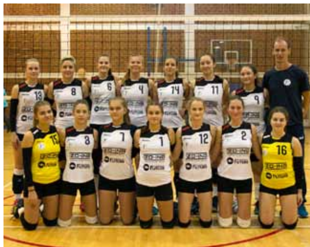
Zlatne - seniorke Ženskog odbojkaškog kluba Ivanec

IZBOR NAJBOLJIH SPORTAŠA I SPORTSKIH EKIPA GRADA IVANCA U 2020.