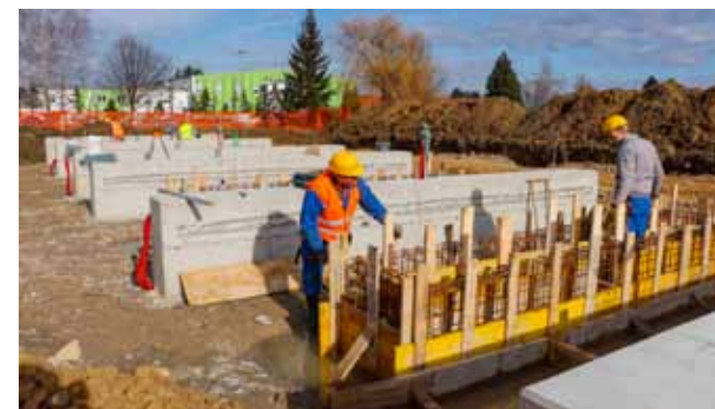
Nova praonica automobila gradi se na ulasku u Preradovićevu ulicu

Iskusni MIPCR radove izvođač razmjerno brzo pa je odmah nakon zemljanih radova krenulo betoniranje. (ljr)