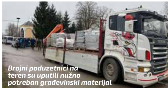
Brojni poduzetnici na teren su uputili nužno potreban građevinski materijal