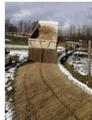
Šljunčanje nerazvrstane ceste u Punikvama (Šikad)

I ove radove naručio je Grad, a financiraju se iz gradskog Programa održavanja komunalne infrastrukture. (ljr)