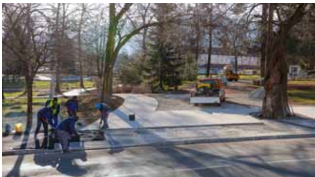
Završni radovi na uređenju spojnih staza i kontaktnih površina

priveden projekt građevinske rekonstrukcije glavnog ivanečkog parka. Ono što još preostaje u sljedećoj fazi jest dovoz zemlje, poravnavanje površina, sjetva trave i hortikulturno uređenje,