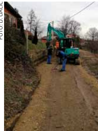
Sanacija bankina na potezu od groblja prema Vukovićevoj ulici

PLIN Zašto su građanima stigle puno veće akontacijske rate za plin za razdoblje od 1. siječnja do 31. ožujka?