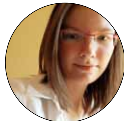
Piše: Ana Škriljevečki, mag. hist.

da su to okrutno vrijeme iskoristili drotnari (zamkari) koji su jadrnim životinjicama postavljali zamke po prijelazima u šumi. U to vrijeme čuvari lova u lovištima pronalazili su dnevno oko pedeset-šezdeset zamki, što je dovelo do nemilosrdnog uništavanja korisne divljači.