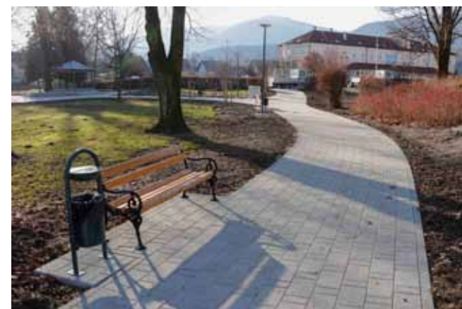
Vizura moderniziranog parka: Staze opločane tlakavcima, nove klupe i koševi, LED rasvjeta

Ivkom je montirao i nove klupe i koševe za smeće. Postavljeno je ukupno 15 klupa i 18 koševa. Vrijednost svih navedenih radova u drugoj fazi je blizu 1,3 milijuna kuna.