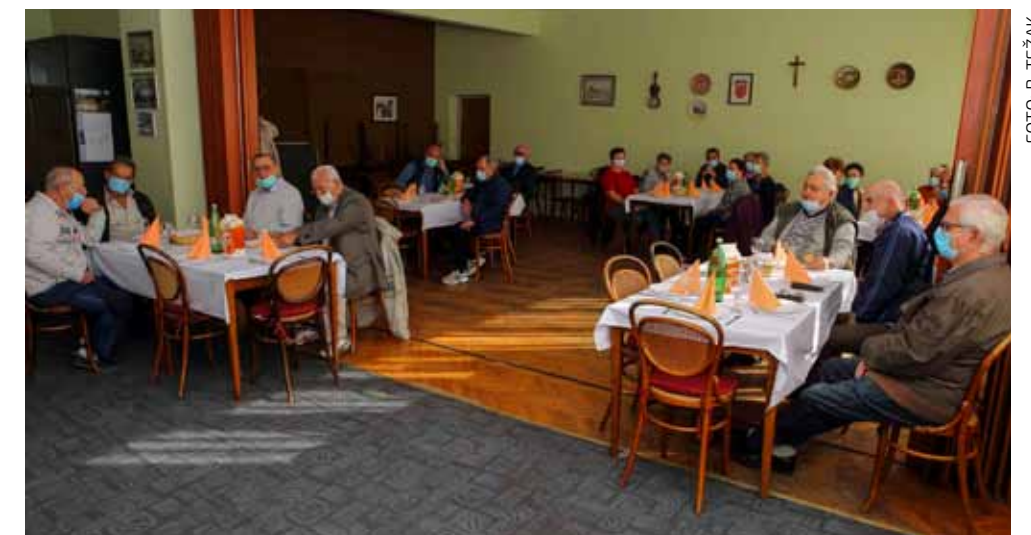
Za naše najstarije sugrađane (rad udruga, razne pomoći) u proračunu je osigurano više od 350.000 kuna

SOCIJALNA SKRB U gradskom proračunu osigurana sredstva za najosjetljiviju populaciju