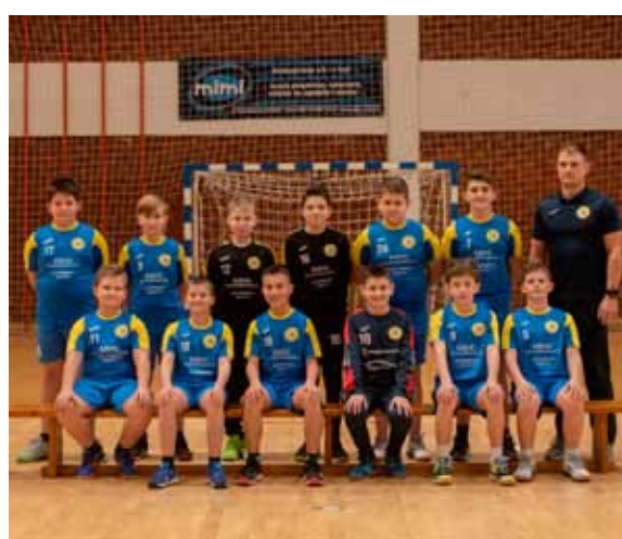
Momčad RK Ivančice, god. 2010. - najbolja mlada ekipa u 2020.