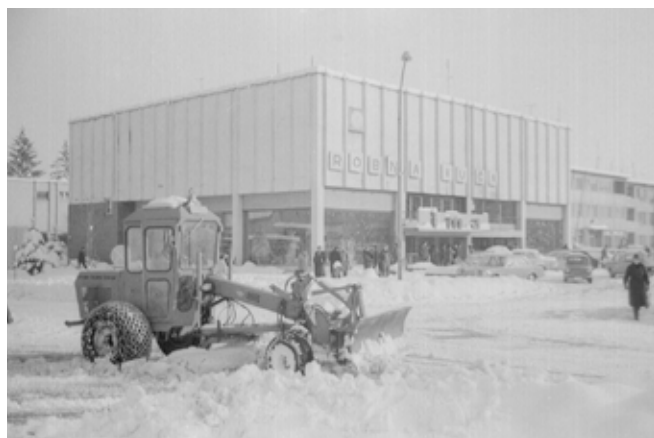
Zima u Ivancu, osamdesete godine 20. stoljeća

Iako su zime za davnih dana bile poprilično neumoljive, Ivančani su ipak znali iskoristiti ono dobro što su donijele. Uživanje u debelom snijegu i skijanje na Ivančici zimske su radosti koje zasigurno mnogi pamte iz svojeg djetinjstva, a i danas neki s nestrpljenjem čekaju debeli snježni pokrivač.