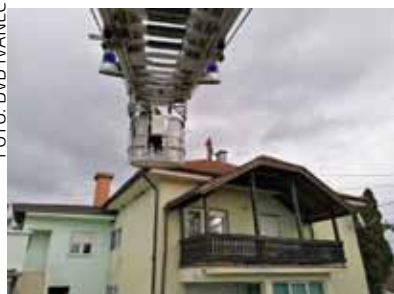
Ivanečki vatrogasci pomagali su stradalima u Sisku

posade. No, kako je potres nanio ozbiljne materijalne štete i na našem području, trojica vatrogasaca su doslovno s intervencija koje su odrađivali u Ivanu i Lepoglavi upućeni u ispomoć kolegama u Sisak. Kroz 12 dana članovi DVD-a Ivanec skidali su oštećene dijelove građevinskih objekata, prekrivali krovovišta i sl. Iako nisu zaprimili službenu zapovijed, članovi DVD-a Bedenec, Radovan, Margečan i Salinovec samoinicijativno su provodili aktivnosti na potresom pogođenom području. DVD Bedenec je odvezio robu stradalima u Glini. DVD Margečan je preko glinskog Caritasa bio angažiran u podjeli hrane i higijenskih potrepština po okolnim naseljima te u sanaciji dimnjaka i krovovišta u glinskim selima.