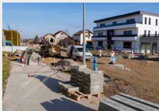
Kumičićeva ulica i dalje je najveće gradilište na gradskom području

Druge faze radova, koja je obuhvaćala njegovu građevinsku rekonstrukciju, počela je najesen lani, tako da je tijekom jesenskih i zimskih mjeseci park bio veliko gradilište. Postojeće staze strojno su produbljene i proširene, postavljen je geotek-