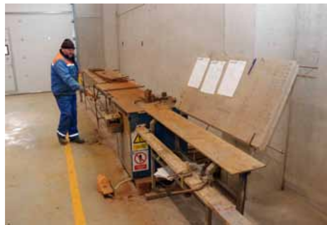
U dijelu nove hale – savijanje i proizvodnja građevinskih armatura za vlastite potrebe

–U tih nekoliko mjeseci sagrađen je potpuno nov objekt koji dijelom koristimo za skladištenje građevinske opreme i materijala, dok je drugi dio namijenjen proizvodnji i obradi građevinskih