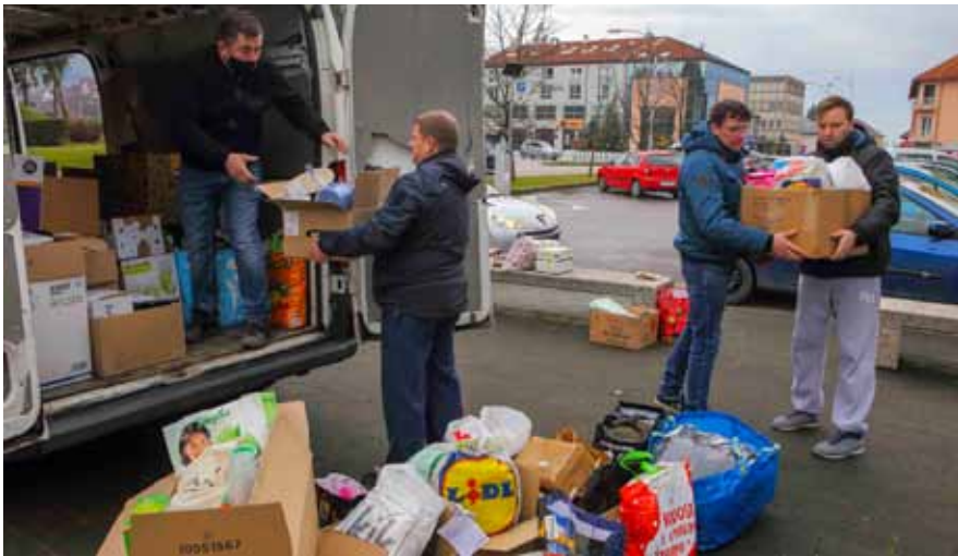
Brojni građani odazvali su se u pomoć stradalaj Banovini

-Tijekom proteklih četiriju mandata sa svojim sam timom i suradnicima inicirao i završio brojne projekte. Ima još nekih velikih, kapitalnih, koje namjeravam dovršiti, ali otvoriti i nove, koji će Ivancu dati ono što se danas popularno zove završni „touch“, i to sa stilom. Mislim da sam ovime odgovorio na vaše pitanje. (ljr)