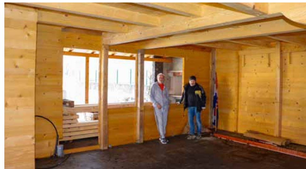
Interes za drvene kuće povećan je nakon potresa, jer njih, kažu, potres ne može srušiti

Tvrtka se inače približava svojih jubilarnih 30 godina rada; osnovana je 1992. i u svom pogonu sa 30 strojeva primarno se bavi strojnom obradom metala i proizvodnjom dijelova za strojeve. Sve informacije dostupne su na web stranici tvrtke ili na e-mailu ibs@ibs-ivanec.hr