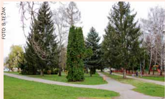
Ove godine gradnja biciklističkog poligona kod škole i vrtića

KOMUNAL Za gradnju objekata i uređaja komunalne infrastrukture 6,92 mil. kuna