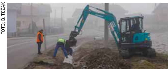
I ove godine povećana sredstva za uređenje oborinske odvodnje u naseljima našega kraja

Najviše za javnu rasvjetu te za nerazvrstane ceste i javne zelene površine