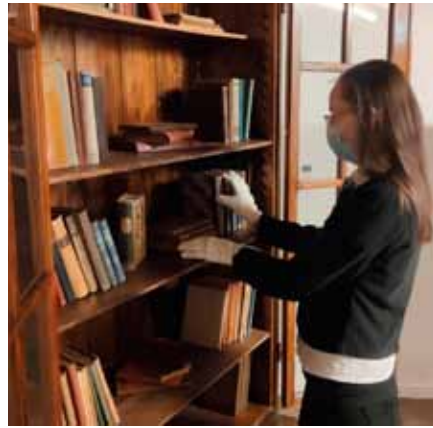
Program osmislila povjesničarka Ana Škriljevečki

Gusti snijeg nagnao je brojne šumske životinje u potragu za hranom. Poljske jarebice, fazani i zečevi izvirili su iz svojih skloništa i lugova. Blumschein navodi