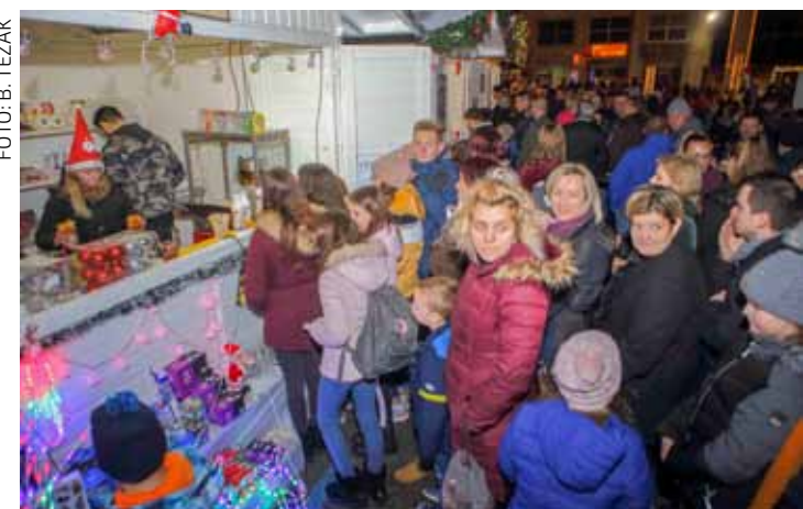
Vjerujemo da ćemo krajem ove godine ponovno moći gledati ovakve prizore u sklopu Adventa 2021./2022.

Rad Gradske knjižnice Grad će sufinancirati s 531.600 kuna, dok je daljnjih 735.000 kuna predviđeno za Kino Ivanec, po-