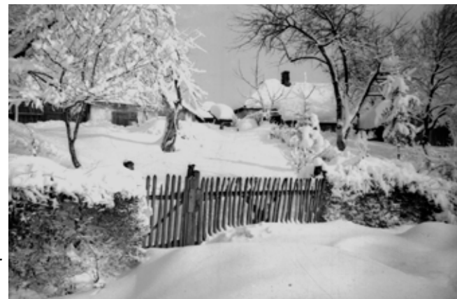
Snijeg u ivanečkome kraju, druga polovica 20. stoljeća

Žestoka studen zamrzнула je i toplo vrelo koje izvire iz ugljene naslage, nedaleko željezničke stanice u Ivancu, piše H. Blumschein o zimi 1939./1940.