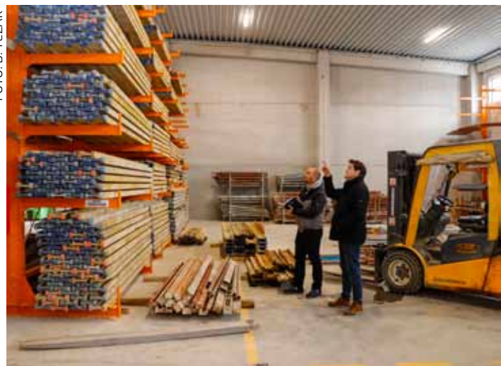
U unutrašnjosti hale

olakšanim uvjetima skladištenja i manipulacije s opremom u novome objektu, gdje su pohranjene visokoplošne oplaste, fasadne skele, razni elementi i druga oprema za građenje.