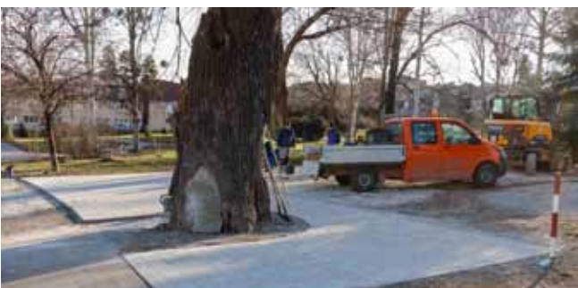
Uređen je i prostor oko najstarije „stanovnika“ Ivanca – povijesne lipe

ODRŽAVANJE Kako će se ove godine održavati komunalna infrastruktura na području grada Ivanca