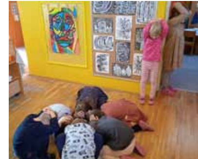
Vježbe i radionice za mališane Dječjeg vrtića Ivančice