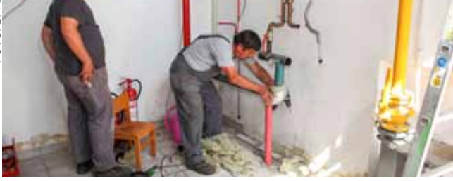
Građani od Grada mogu ostvariti do bespovratnih 10.000 kuna potpore