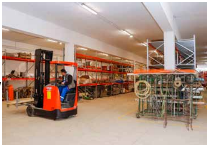
I staro skladište uzorno je uređeno

Voditelj gradilišta Hrvoje Banić iznimno je zadovoljan