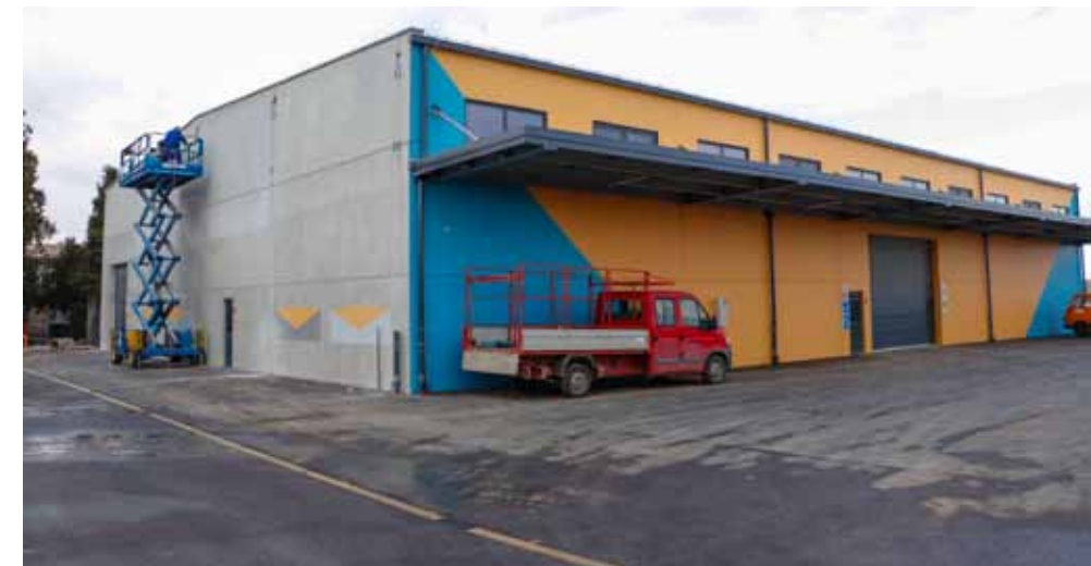
Nova proizvodno-skladišna hala u poslovnom krugu MIPCR-a u Georgijevičevoj ulici

NOVA PODUZETNIČKA INVESTICIJA U građevinskoj zoni uz ivanečku obilaznicu