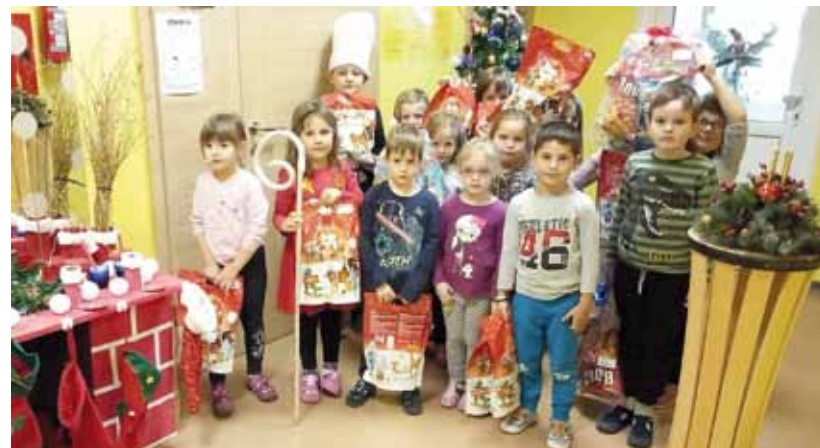
Darovi su stigli i mališanima Dječjeg vrtića Bambi