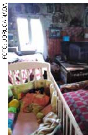
Novčana potpora odobrena je za obitelj s djecom za poboljšanje ovakvih, očajnih stambenih uvjeta

Sve zamolbe nisu pozitivno riješene, prvenstveno one koje nisu u skladu s kriterijima za koje zaklada