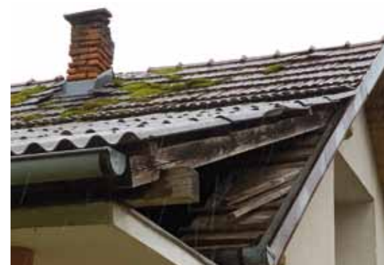
Štete i na objektima našeg područja, potres je „pomaknuo“ krovnište