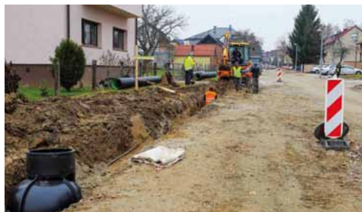
Polaganje cijevi za oborinsku odvodnju

U sklopu radova bit će uređene i zelene površine uz prometnicu, što je inače započeto još prije par godina, kada je u toj ulici bio odstranjen agresivan drvodred, čije je korištenje „dizalo“ nogostupe i privatne ograde. Na njegovo mjesto zasaden je mladi drvodred s vrstama primjerenim za urbanu sredinu. Također, slijedi i postavljanje rubnjaka i polaganje novog sloja asfalta na odvojak Kumičićeve ulice, prema dječ-