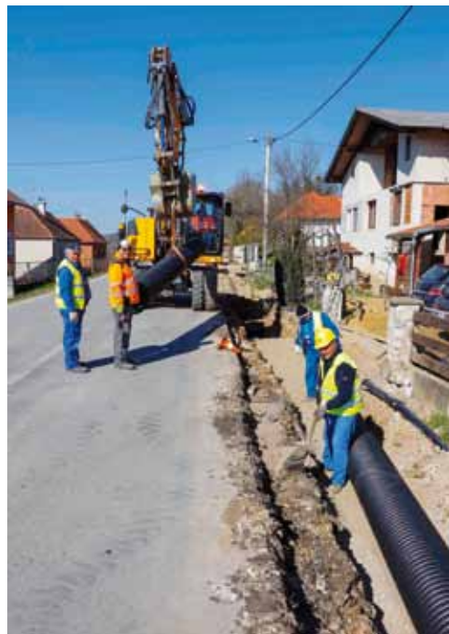
Gradnja kanalizacije u Bedencu iz EU fondova je završena; ove godine slijede radovi na Aglomeraciji Ivanec