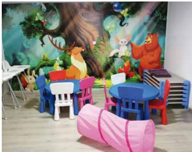
Šareni pedagoški vrtićki kutići

Za prihvata djece prostor je uređen na način da je cijelo pri-