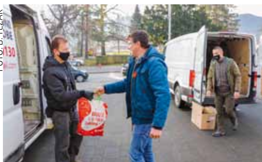
5. Građani su donosili hranu, higijenske potrepštine, sve što može pomoći ljudima