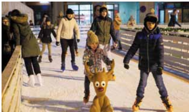
Vjerujemo da ćemo ove godine opet imati Advent u Ivancu