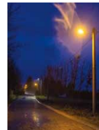
Rasvjeta u zaseoku Kralji prema Tiglinu