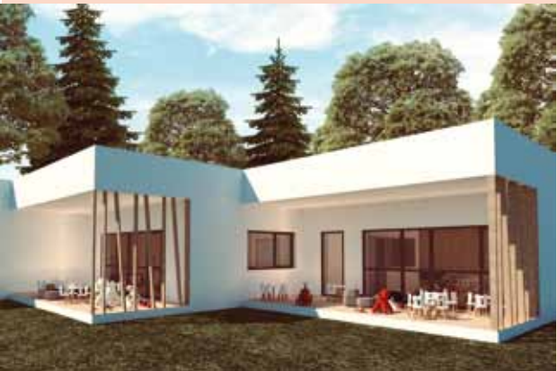
Osigurana su i sredstva za dogradnju Dječjeg vrtića u Ivancu