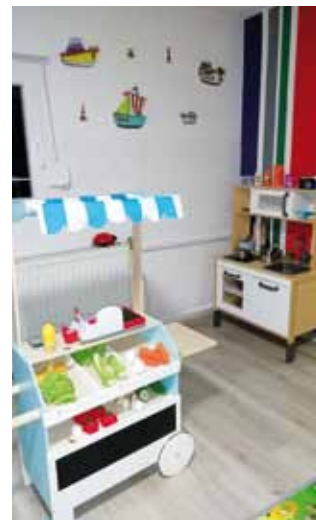
Kutić za kuhanje

Mališane očekuju prostori uređeni po svim propisanim standardima