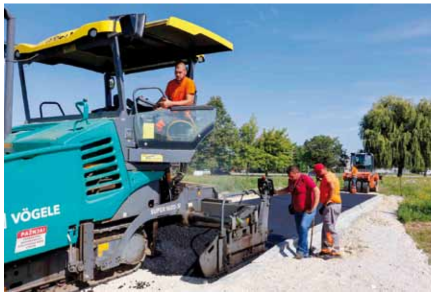
Za asfaltiranje ulica, cesta i uređenje prometnih površina - gotovo 3 mil. kn

U Ivcu se moderniziraju ulice i parkovi, otvaranjem građevnih zona intenzivirana je individualna stanogradnja, bilježimo uzlet poslovnih investicija. U naseljima širom grada asfaltirale su se nerazvrstane ceste i gradili nogostupi, vodovodi, oborinska odvodnja, sanirala su se klizišta, otvarali i opremali novi društveni domovi, gradila dječja igrališta.