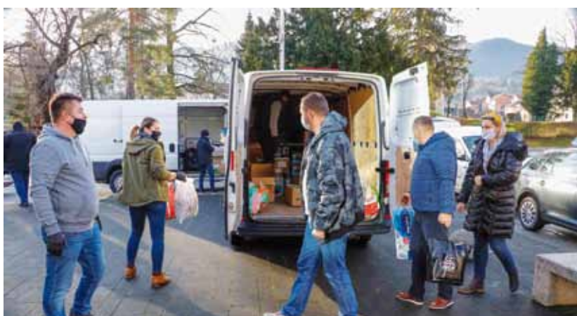
Prikupljanje pomoći za razorena područja u akciji koju su na špići organizirale sportsko-rekreativne i druge udruge