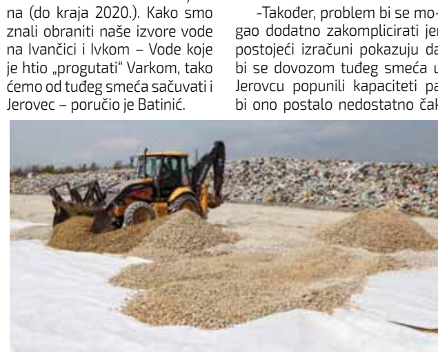
Nijednim dokumentom nikad nije bila predviđena mogućnost odlaganja tuđeg smeća na odlagalištu Jerovec

–Na Grad Ivanec vrši se ozbiljna presija da prihvatimo 1.500 tona miješanog otpada iz grada Varaždina i okolnih JLS-ova, sa zahtjevom da se cijela ta količina odloži u samo dva tjedna (do kraja 2020.). Kako smo znali obraniti naše izvore vode na Ivančici i Ivkom – Vode koje je htio „progutati“ Varkom, tako ćemo od tuđeg smeća sačuvati i Jerovec – poručio je Batinić.