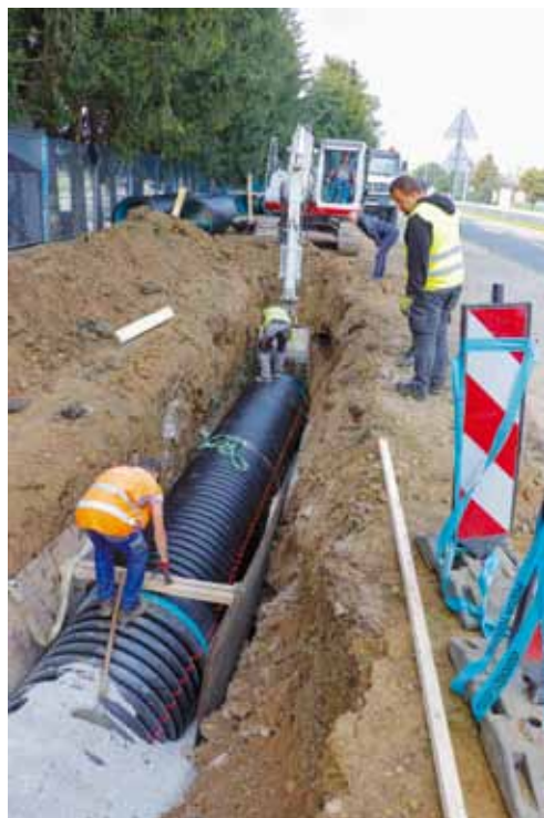
Grad pojačano ulaže u oborinsku odvodnju, isto nastavlja i ove godine