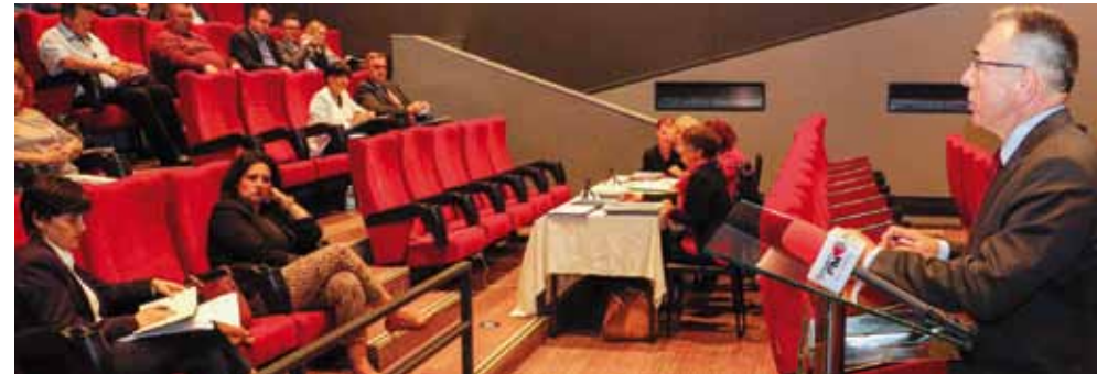
Većina vijećnika na elektroničkoj je sjednici poduprla proračun za 2021.(na slici: S jedne od prethodnih sjednica Gradskog vijeća)

Unatoč svim navedenim argumentima, SDP je glasovao protiv predloženog proračuna.