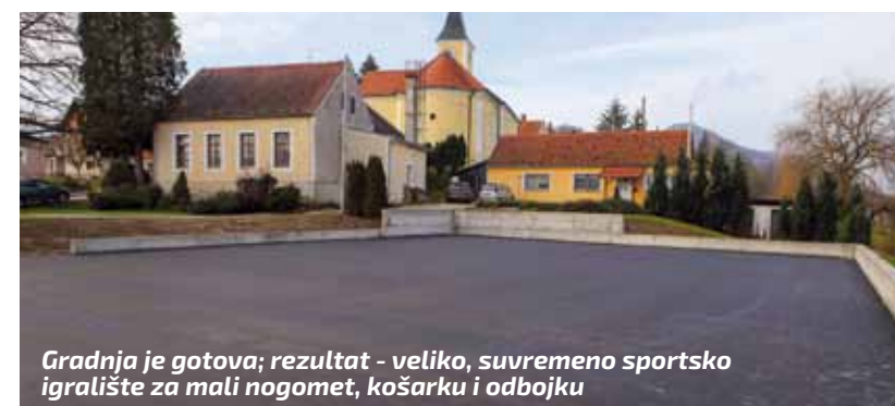
Gradnja je gotova; rezultat - veliko, suvremeno sportsko igralište za mali nogomet, košarku i odbojku