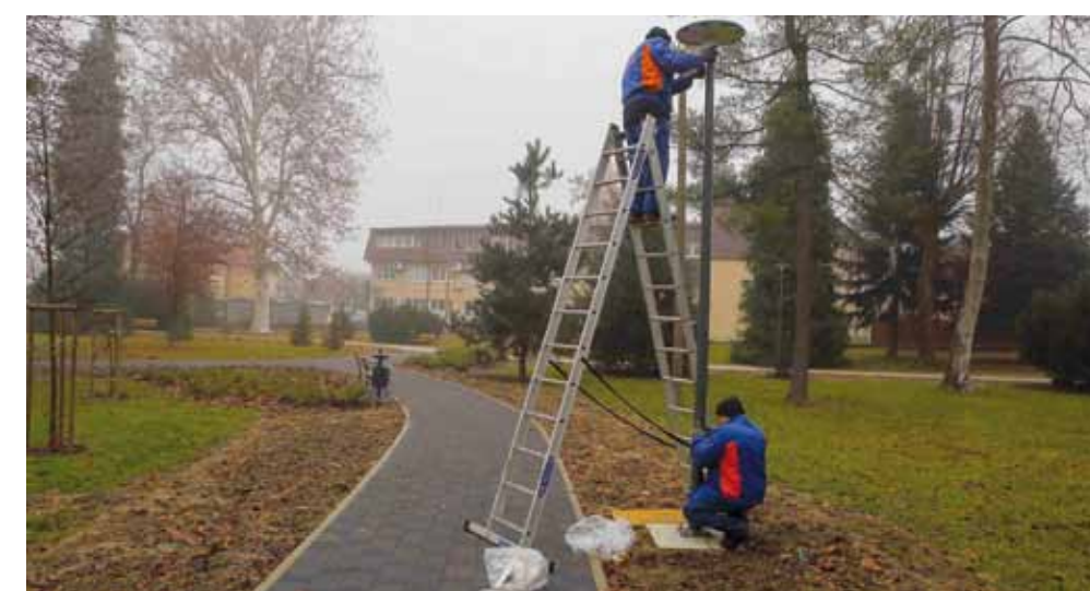
Na kandelabre su djelatnici Ivkoma d.d. postavili LED rasvjetna tijela

Ukupno je podignuto 16 kandelabra, od kojih 13 u parku, a tri