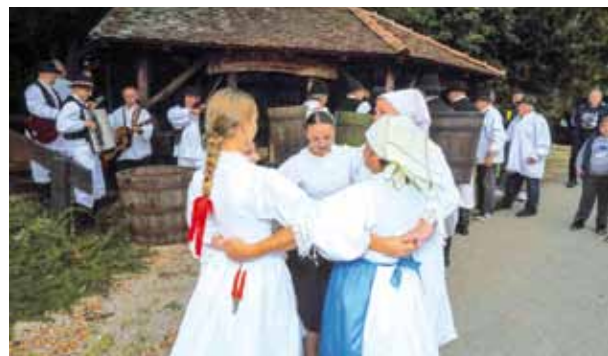
Grad je osigurao novčana sredstva za rad udruga