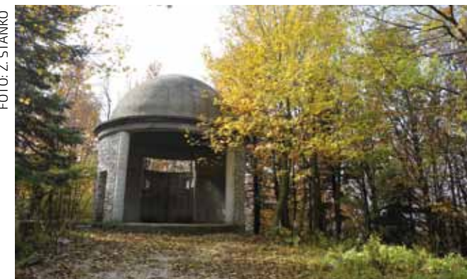
Kapelica na Ivančici: Sredstva za dovršetak i stavljanje u funkciju su osigurana

Time će se kapelica (koja nedovršena stoji već više od 15 godina) napokon završiti, a time ujedno i spriječiti njena devastacija, to više što je primijećeno da pojedini izletnici u unutrašnjosti objekta pale vatre