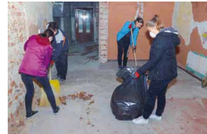
Jedna od brojnih volonterskih akcija Kluba mladih provedenih u bivšem Retru

lontiranje u raznim segmentima. Izrada promo videa ujedno je najava aktivnosti koje će Grad