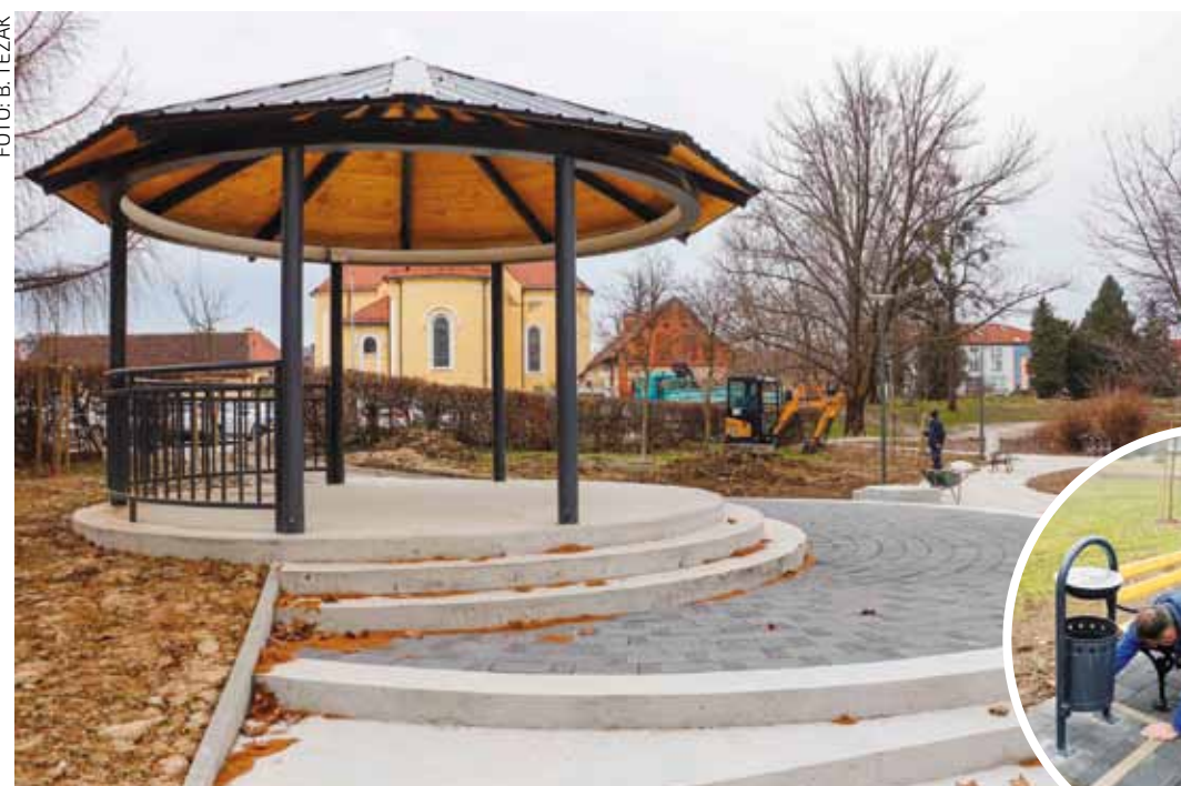
Na mjestu starog izgrađen je novi paviljon, postavljaju se nove klupe i koševi

Investitor svih radova je Grad Ivanec koji je temeljem provedenog javnog natječaja građevinsku rekonstrukciju parka povjerio poduzeću TTG iz Višnjice. Vrijednost ovih radova je 1,05 milijuna kuna.