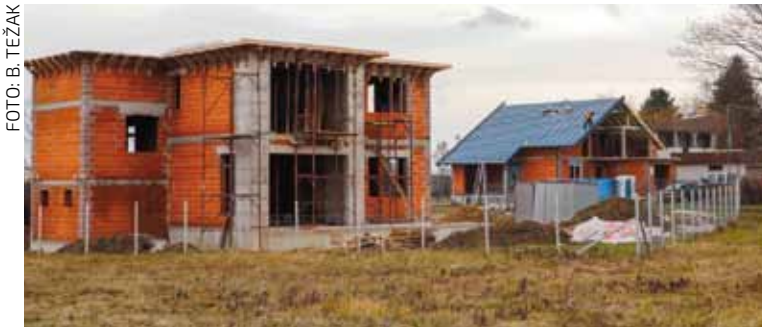
Nova stambena zona ubrzano se popunjava novim individualnim stambenim objektima

GRAĐEVINSKI BUM U ivanečkoj zoni stambeno-poslovne gradnje koju je aktivirao Grad Ivanec