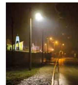
Osvijetljena je i dionica kod kapelice u Jerovcu

Kao što je bilo i planirano, uoči Božića Grad je zasvijetlio više dionica u Jerovcu, Lovrečanu te u Ivanečkoj Mihanovićevoj ulici. Ukupno je postavljeno 14 novih svjetiljki kojima su zasvijetljene dotad mračne dionice te pješačima osvijetlile put i promet učinile sigurnijim. (ljr)