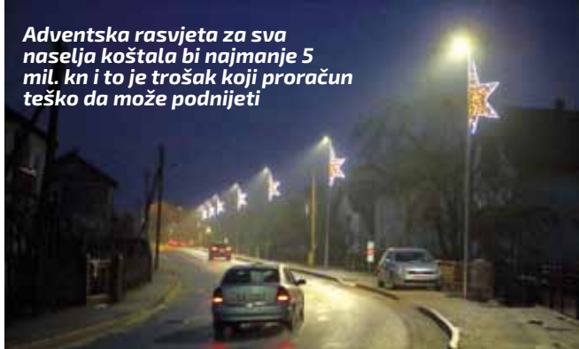
Adventska rasvjeta za sva naselja koštala bi najmanje 5 mil. kn i to je trošak koji proračun teško da može podnijeti

Usvojeni su i planovi djelovanja u 2021. vezanih uz sigurnosnu situaciju i to Plan djelovanja Grada Ivanca u slučaju prirodnih nepogoda te Plan razvoja sustava civilne zaštite na području grada u 2021. godini, s trogodišnjim financijskim učincima. Ovu, potonju temu prati i dokument pod nazivom Analiza sustava civilne zaštite na području grada Ivanca u 2020. godini.(lir)