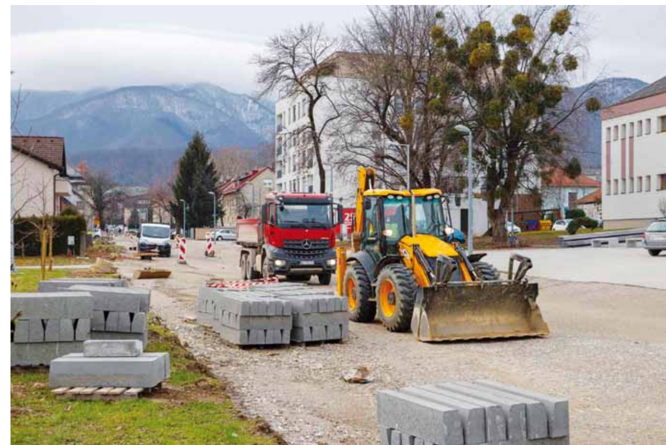
Gužva i strojevi u Kumičićevoj ulici, polažu se rubnjaci

komunalnih zahvata u cilju uređenja primarne infrastrukture. Rekonstruiran je vodovod, uređeni su novi vodovodni i plinski priključci, rasterećen je kolektor u Kovačićevoj ulici s ciljem sprečavanja poplavl-