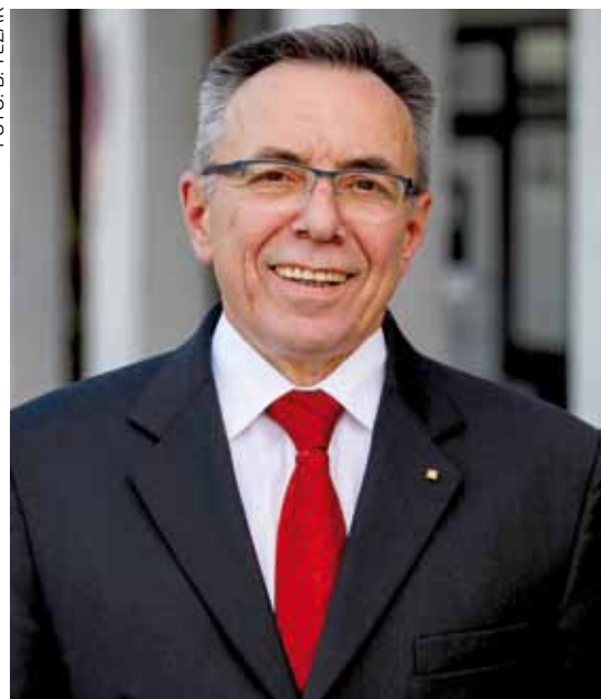
Gradonačelnik Milorad Batinić

4. Gradsko vijeće na javnoj sjednici raspravlja o prijedlogu proračuna, analizira programe i proračunsku politiku koju je predložio gradonačelnik te donosi proračun najkasnije do 31. 12. tekuće godine