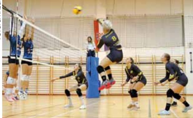
Odličan start ivanečkih seniorki u novoj sezoni, sada samo priželjkuju povratak treninzima i natjecanjima