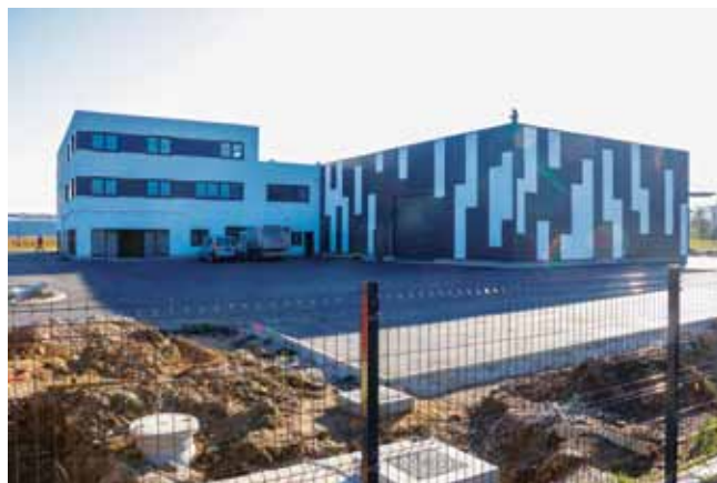
Realizacija poduzetničkih investicija u Ivancu (BGW u Industrijskoj zoni); u najavi su i nove