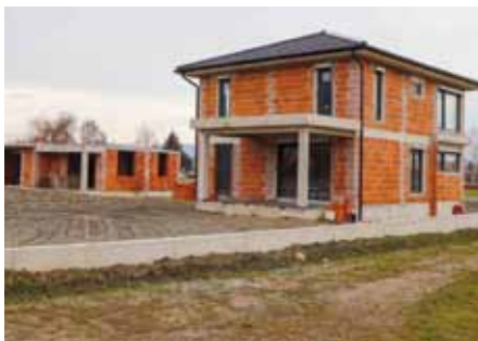
Svojevrsni građevinski „bum“ u novoj stambenoj zoni

Poštovani građani i građanke, dopustite mi da vam na početku ovog obračanja zaželim sretnu Novu godinu, zdravlje, zadovoljstvo u osobnom životu, uspjeh u poslu te ono što svi najviše želimo - povratak u normalne životne tokove. Znam da vam je zbog poštosti s kojom se suočavamo prošla godina bila teška i da je svima uvelike izmijenila način života.