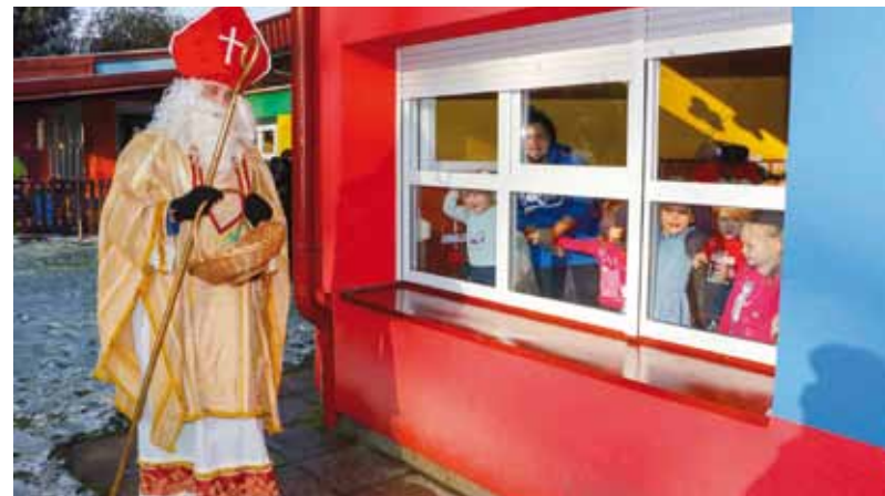
Sv. Nikola djecu je iznenadio pokucavši im na prozore

Pokloni, čiju je nabavu sufinancirao Grad Ivanec za ukupno 417 djece, osigurani su za polaznike svih programa vrtića Dječjeg vrtića Ivančice i njegova područnog odjela u Radovanu, uključujući i pedagoške igradnice te malu školu, kao i za polaznike Dječjeg vrtića Bambi. (lir)