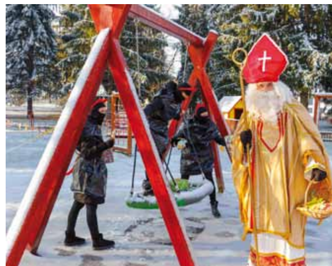
Razigranih Krampusi nitko se nije bojao

Zdenka Gotal iz Ivanca zabilježila je da su djeca pjevala pjesmu Doznala su dječica da će doći Svijećnica (...), Poslala nas Majka Božja da Vam svjetlo donesemo. Vi s Bogom sad ostajte, nam pa ništa ne zamjerite, mi pa bumo dalje išli do Marije Svijećnice , koja je poznatija pod nazivom „Oj, krstjani preljubljeni“. U grupama koje postoje različite verzije ove pjesme pa se tako Vesna Štruklec sjeća da su