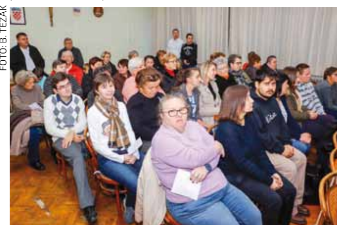
Članovi Ivanečkog sunca osobe su kojima je neophodna pomoć šire zajednice

Njegov prijavitelj bio je Hrvatski savez udruga osoba s intelektualnim teškoćama, a partner na njemu je i Udruga Regoč iz Slavonskog Broda. Odobren projekt vrijedan je 527.177,12 kuna i financira se iz Europskog socijalnog fonda. Kompletanu pomoć u prikupljanju dokumentacije, slanju i ishođenju potrebnih rješenja koji su bili prvi korak kod prijave, udruzi je pružio Projektni ured Grada Ivanca za EU fondove, a on će joj za cijelo vrijeme njegova trajanja i dalje pružati svu potrebnu stručnu i operativnu pomoć.