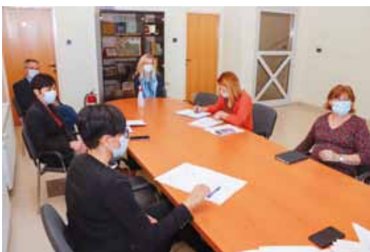
S prve radne sjednice Upravnog odbora Zaklade Grada Ivanca

Novčane potpore odobrene su za poboljšanje uvjeta stanovanja jednoj obitelji s djecom koja živi u trošnoj kućici, bez kupatone, zatim, za pokrivanje dijela troškova terapija za teško bolesnu djecu te za nabavu lijekova pojedinim osobama s invaliditetom. Potpora stiže i pojedinim građanima koji su zbog nesreća na poslu, fizičkih oštećenja i nemogućnosti daljnjeg rada dospjeli u probleme egzistencijalne naravi te osobama koje se