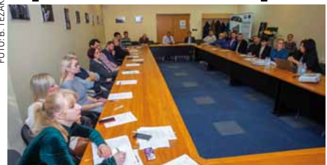
S obzirom na nemogućnost održavanja sastanaka uživo, Grad putem Poslovnog kluba Online ostaje u kontaktu sa svojim poduzetnicima

♦♦ Cilj gradske uprave jest direktno od poduzetnika dobiti stavove i prijedloge koje potom ugrađuje u ključne gradske programe i dokumente