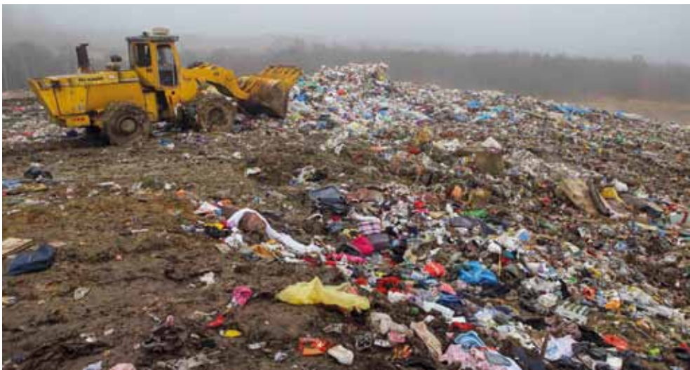
Ministar T. Čorić mogao bi svojom Odlukom stvoriti osnovu za dovoz tuđeg smeća u Jerovec ; hoće li se to dogoditi?

–Što se tiče vaše izjave o navodnom mačehinskom odnosu Grada Ivanca prema Jerovcu, takav navod oštro odbacujem jer naprosto nije istinit. Potvrđuju to i podaci o kapitalnim ulaganjima u Jerovec u razdoblju 2017.-2020. i to: za izgradnju nogostupa, modernizaciju nerazvrstanih cesta, javnu rasvjetu, gospodarenje otpadom i komunalne usluge (besplatan odvoz otpada za sva domaćinstva na području Jerovca) – 1,94 milijuna kuna; zatim, za uređenje društvenog doma Jerovec Gornji – 520.000 kuna. Dakle, sve zajedno gotovo 3 milijuna kuna i to samo za kapitalne projekte (bez programa održavanja i sl.) – obrazložio je Batinić.