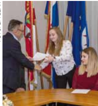
U ove godine 50 studenata na gradskoj listi za stipendije

STIPENDIJE Objavljena konačna lista dobitnika stipendija Grada Ivanca