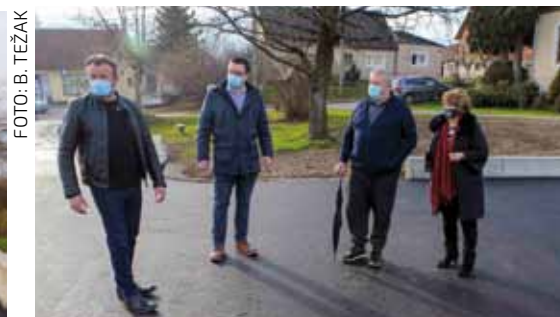
Gradski vijećnici s područja Margečana i članovi Vijeća MO-a na novom igralištu