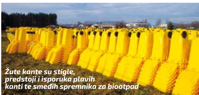
Žute kante su stigle, predstoji i isporuka plavih kanti te smeđih spremnika za biootpad

–Kad je o ovome riječ, postavlja se i pitanje: Kako onda Varkom i Čehok namjeravaju riješiti mulj iz pročistača Lepoglava (gdje je Varkom preuzeo kompletnu distribuciju pitke vode te sljedom toga i provedbu projekta Aglomeracije Lepoglava)? Odnosno, da li prijetnjom Gradu Ivancu direktno miniraju vlastiti projekt u Lepoglavi koji je tehnoški vezan uz Aglomeraciju Ivanec? – pita se Batinić. (Ijr)