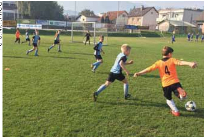
U-9 na terenu