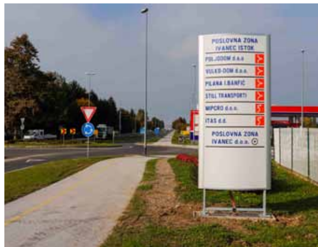
„Totem“ na ulazu u Poslovnu zonu Ivanec – istok

– Proteklih dana napokon su potpisani ugovori za gradnju regionalnog odlagališta u Piškornici, što znači da bi za nekoliko godina postrojenje trebalo biti izgrađeno i stavljeno u funkciju. Budući da bi se u Piškornicu trebao voziti i otpad s područja Varaždinske županije, to znači da će se odlagalište u Jerovcu zatvoriti. Nadam se samo da nakon toga nećemo biti šokirani cijenama odvoza komunalnog otpada do Piškornice – izjavio je gradonačelnik. (ljr)