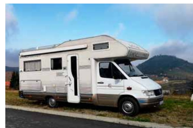
Lokaliteti podno Ivančice i Sv. Duha privlače i vlasnike kampera