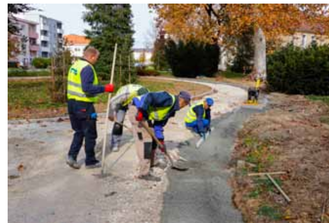
Priprema staza u parku za postavljanje tlakavaca

◆◆ Bit će podignuto ukupno 16 kandelabra s kojih će park i parkiralište osvijetljavati suvremena LED rasvjeta