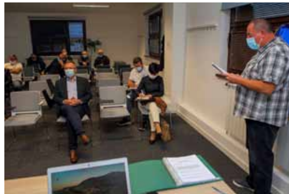
Sa skupštine Hrvatskog časničkog zbora Ivanec

-Prva zadaća koja nas očekuje jest sastanak s predsjednicima ostalih braniteljskih udruga te predstavljanje planiranog načina rada Časničkog zbora. Tijekom Domovinskog rata časno smo vodili ljude i branili domovinu, a građani od nas očekuju da svoj rad nastavimo i u mirnodop-