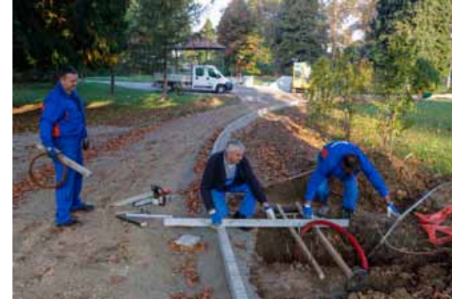
Ivkom d.d. u parku gradi betonske podloge za postavljanje stupova za javnu rasvjetu

A nakon što je u cijelom parku položio oko 620 metara cijevi i podzemnih kablova za potrebe javne rasvjete, Ivkom d.d. je počeo i s izgradnjom betonskih podloga za kandelabre s kojih će