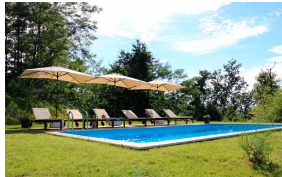
Vodič je dostupan na internetskim stranicama Grada i Poslovne zone Ivanec

TURIZAM Grad Ivanec i Poslovna zona izradili vodič za građane koji bi svoje objekte željeli iznajmljivati