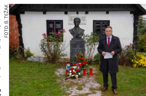
M. Batinčić: Kraš je bio je istinski antifašist i borac za prava radnika