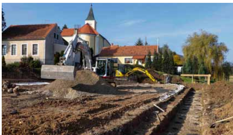
Buduće igralište dobiva konture; s desne strane je iskop za potporni zid