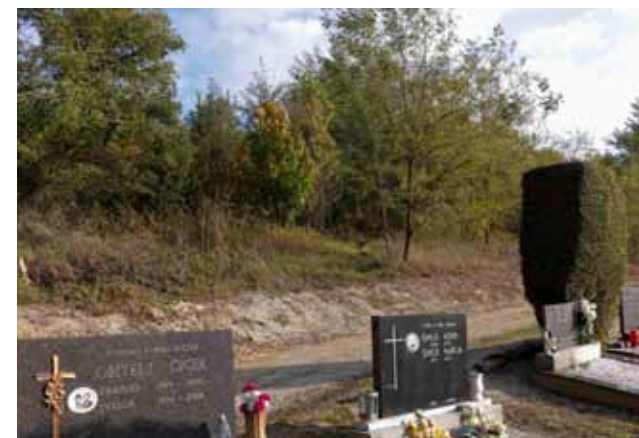
U Margečanu je širenje groblja predviđeno prema sjeveru

Ovime bi se i za jedno i za drugo naselje za izvestan broj godina osigurao dovoljan broj mjesta za ukope pokojnika. Stoga je Gradsko vijeće i donijelo odluku o izradi urbanističkih planova kojima će se na vrijeme i u skladu sa svim propisima struke utvrditi svi prostorni uvjeti za daljnji razvoj i širenje oba groblja. (ljr)