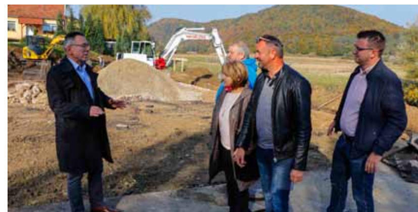
Domaćini nisu skrivali zadovoljstvo radovima koje „sanjaju“ godinama

RADOVAN Rasprava na sjednici Gradskog vijeća Ivanec