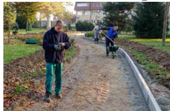
Uz staze su postavljeni rubnjaci

Trenutačno su u punom jeku radovi na stazama. Nakon obavljenih iskopa i zemljanih radova, polaganja geotekstila i kamenog materijala te ostalih pripremnih radova, uz staze su postavljeni rubnjaci. U trenutku zatvaranja ovog izdanja Ivanečkih novina odvijale su se i pripreme za njihovo popločavanje tlakavcima.