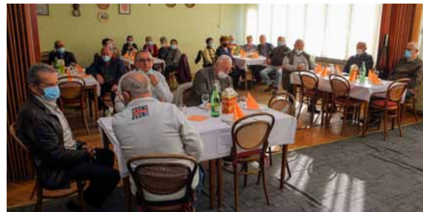
Sa Skupštine Udruge umirovljenika Ivanec

-Pozivam vas da budete oprezni, da se pridržavate preventivnih mjera i učinite sve kako biste sačuvali svoje zdravlje. A naročito vas pozivam da u ovim teškim vremenima sačuvate vedar duh i pozitivan stav – poručio je umirovljenicima gradonačelnik te im predao dar Grada – aparat za kavu. (ljr)