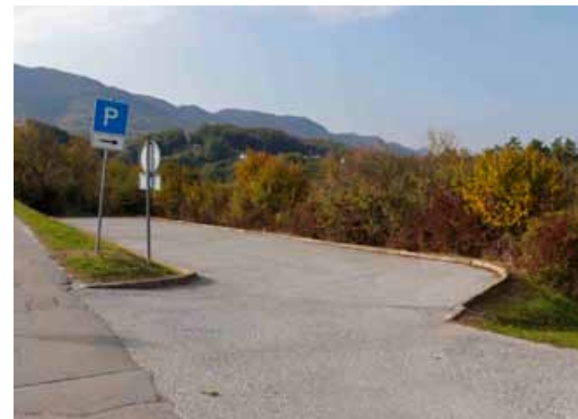
Groblje u Ivancu širit će se prema zapadu, a sadašnje parkiralište će se produljiti i uvesti promet njime u jednom smjeru

GROBLJA Donesene odluke o izradi urbanističkih planova uređenja groblja