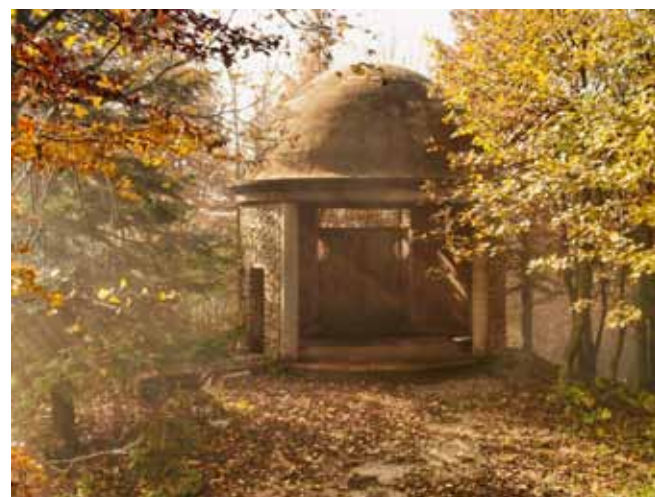
Grad Ivanec i župa sv. M. Magdalene – uređenje kapelice još ove godine

Svim tim omogućilo bi se stavljanje objekta u funkciju. Iduće godine prišlo bi se uređenju okoliša i kontaktnih površina oko kapelice. (ljr)