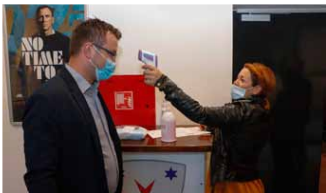
Na sjednicu uz poštivanje svih propisanih mjera

Grad je zabilježio i rast pojedinih prihoda, npr. prihodi od korištenja imovine povećani su za 237.700 kn. Kako bi povećao i prihode od prodaje imovine, Grad je prišao sređivanju i pripremi za prodaju imovine koju je stekao nasljedstvom od građana, a za koju je u međuvremenu iskazan inte-