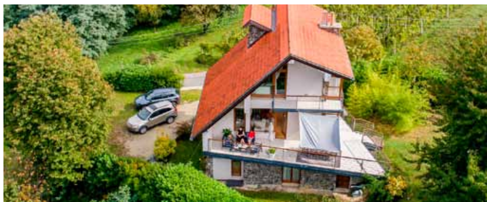
Uvode se i nove mjere potpore za razvoj turističke djelatnosti i OPG-ova (na slici: Evina kuća, Lančić)

Gradić će se novi paviljon, sličan postojećem, ali od modernih materijala. Zamišljeno je da pa-