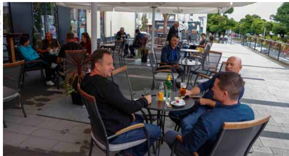
Ugostitelje je Grad Ivanec u cijelosti oslobodio plaćanja poreza na promet