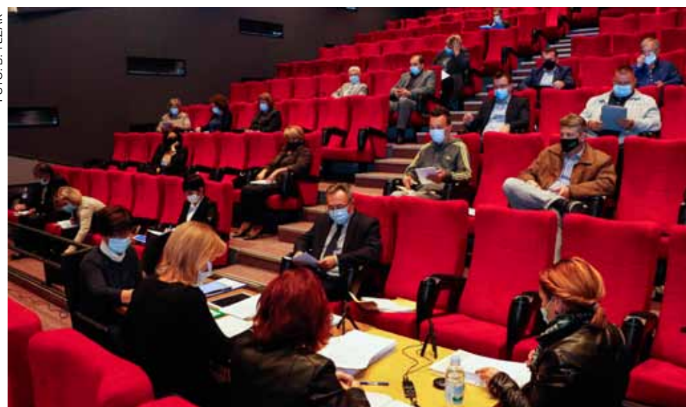
S 39. sjednice Gradskog vijeća

Osvrćući se na izostanak nekih drugih planiranih prihoda na koje se računalo, naveo je izostanak očekivane vanjske pomoći za oborinsku odvodnju uz ŽC u Bedencu od 1,17 mil. kn (ali za to postoji mogućnost u 2021. godi-