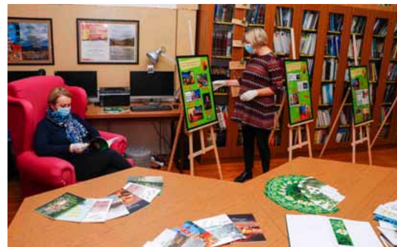
Izložba u Gradskoj knjižnici otvorena je do 15. studenog

– Za potrebe otvorenja izložbe snimljen je video kojim smo sadržaj manifestacije prenijeli na nove medije i tako ga učinili