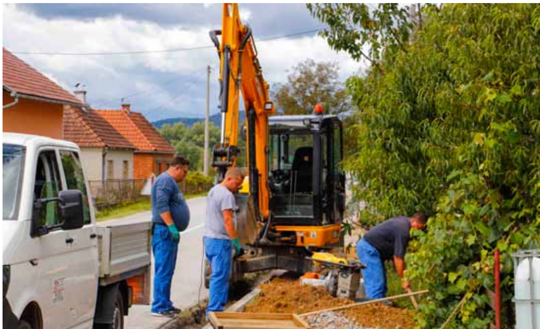
Pad prihoda od komunalne naknade (700.000 kn) nije umanjio aktivnosti i poslove Grada na održavanju komunalne infrastrukture

M. Batinić: Turističkoj zajednici grada Ivanca, gdje će dobiti sve potrebne informacije o postavljanju tzv. smeđe signalizacije. Za postavljanje svakog putokaza mora se izraditi tehničko-prometni elaborat te ishoditi građevinska dozvola na koju suglasnost trebaju izdati HC, ŽUC ili Grad, ovisno o tome tko upravlja cestom.