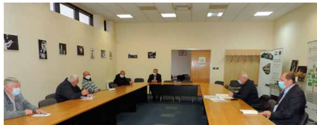
Sa sastanka u Gradskoj vijećnici s predstavnicima građana – vlasnika grobnica

Ivkom d.d. će ujedno provesti internu reviziju i utvrditi tko je u firmi odgovoran za teške propuste i nepravilnosti u nadzoru gradnje zbog kojih će tvrtka o vlastitom trošku izvesti opsežne dodatne radove i samim tim pretrpjeti