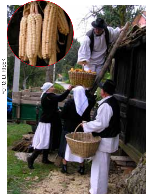
Društvo Maska: Spremanje kukuruza (2010.)

Uz Božju pomoć jesenski su se radovi privodili kraju, a danas nam o toj suvakašnjoj sela ostaju samo priče naših djedova i baka.