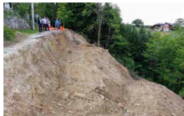
Zbog izrazito strmog terena (zapadno klizište), radovi su bili zahtjevni