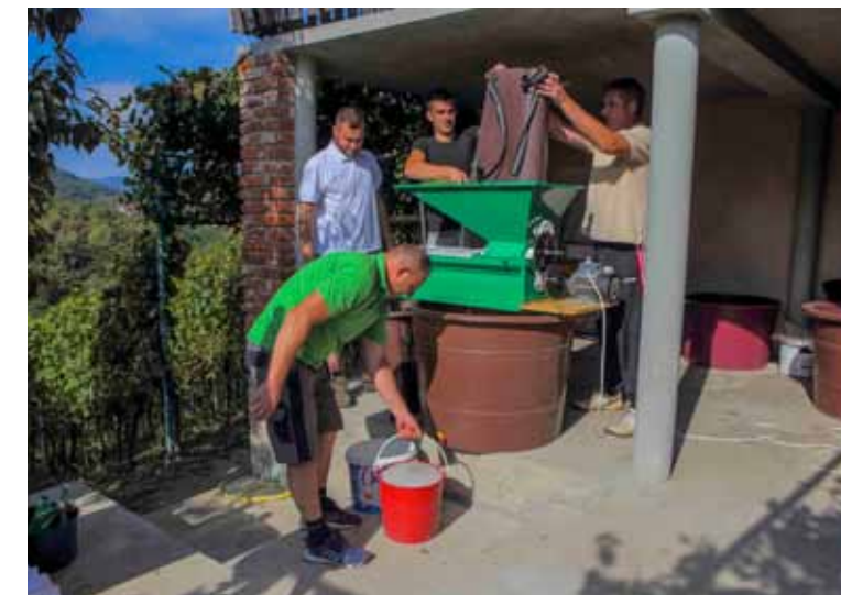
Dečki znaju s tehnikom...