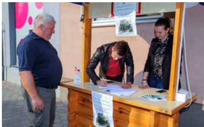
Predbilježbe na štandu za sadnice ivanečke lipe trajale su samo dan i pol

– Zbog velikog interesa građana naručili smo proizvodnju dodatnih količina od reznica, potencijalnih plemki, koje su sa stare lipe uzete ove godine