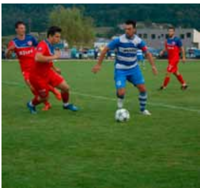
Mladost je na domaćem terenu porazila Beretince s 3:1