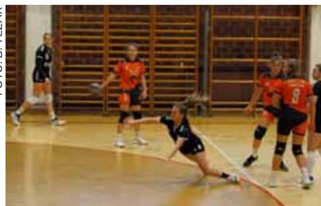
U novoj sezoni „pucaju“ na 1. mjesto u ligi