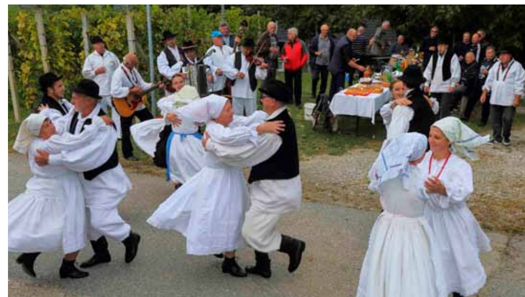
Muzikaši i ples „po starinski“, a sve to uz pun stol delicija iz domaće kuhinje