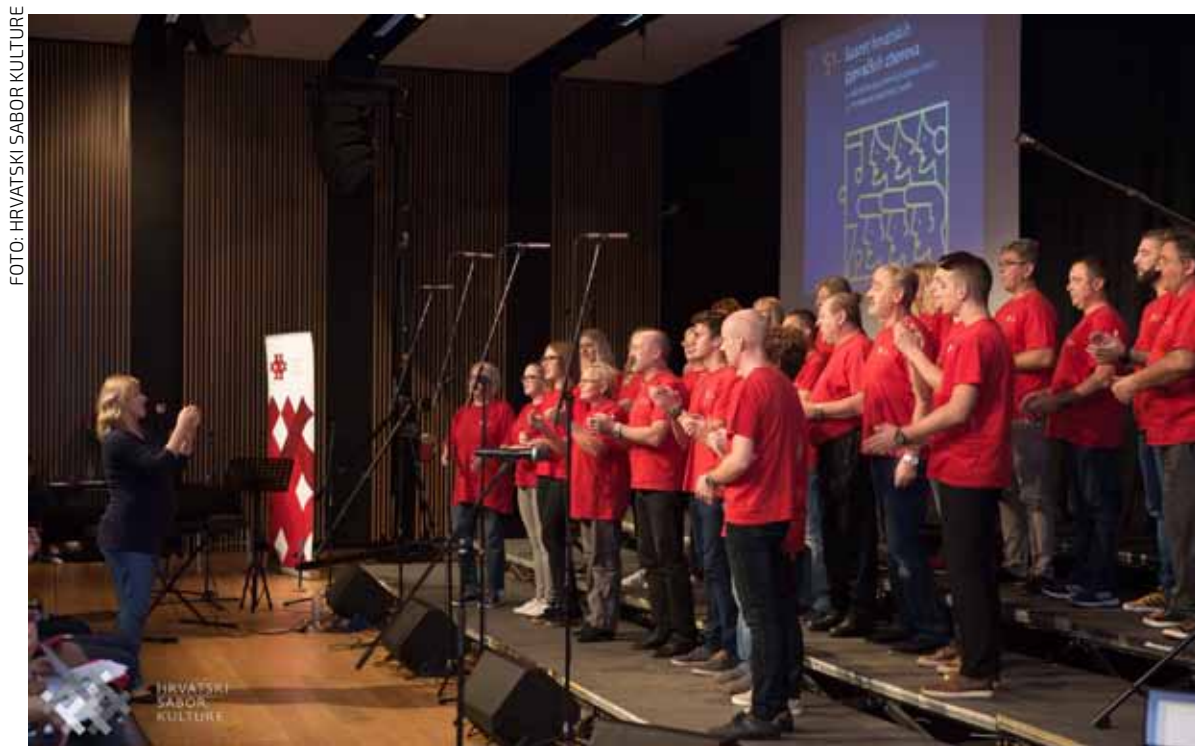
Na sufinanciranje Ministarstvu kulture kandidiran je i projekt ivanečkog KUD-a R. Rajter

Na javni poziv Ministarstva kulture za 2021. godinu besplatno je izrađeno i za sufinanciranje prijavljeno desetak projekata za udruge u kulturi grada Ivanca