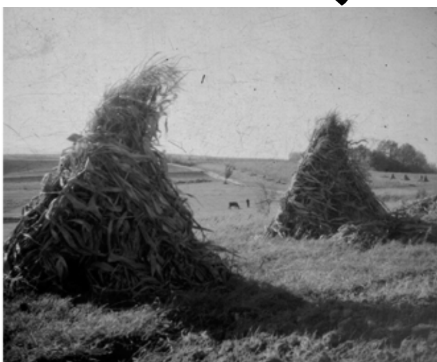
Stavice na polju, druga polovica 20. st., Muzej planinarstva

Te godine berba u vinogradima započela je kasno što nije uobičajeno za naš kraj. „Naši seljaci bili su od nekada naučeni barem