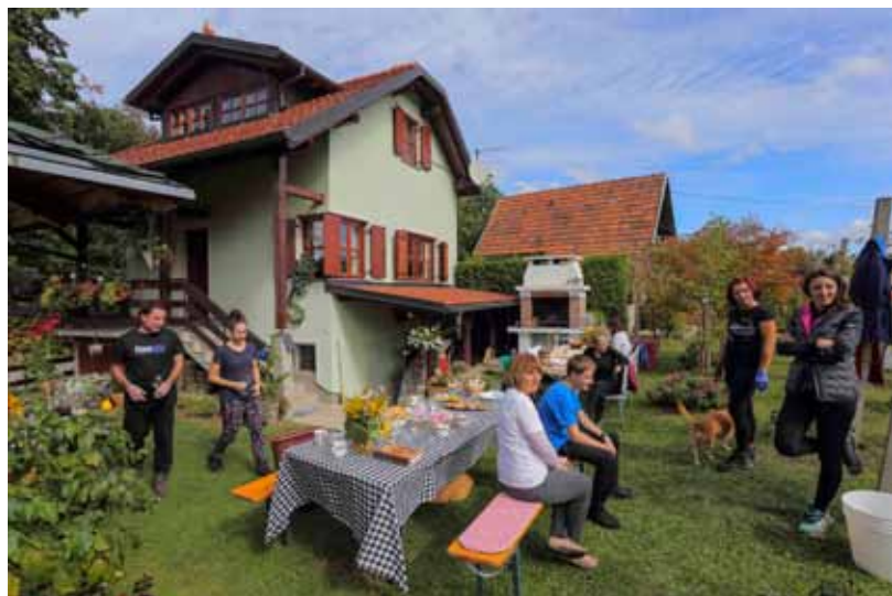
Od New Yorka, Poljske i Zagreba do Ivanca – stota berba na Vrhima se ne propušta!