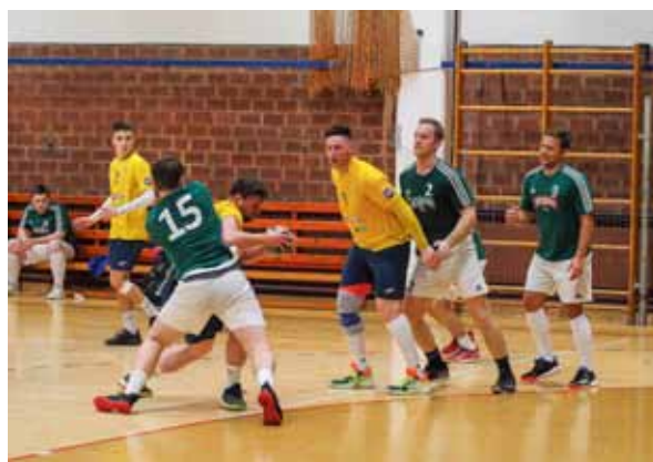
I rukometaši su s olakšanjem dočekali odluku Stožera CZ kojom se vanjskim korisnicima omogućuje korištenje školskih sportskih dvorana

Službeni početak prvenstvene sezone 2020./2021. bio je u subotu, 26. rujna. Međutim, momčad Ivančice kao domaćin toga dana ipak nije odigrala utakmicu 1. kola 2. HRL Sjever s ekipom Sesvete 2. Naime, odluka županijskog Stožera CZ kojom se vanjskim korisnicima ponovno dopušta korištenje školskih sportskih dvorana došla je prekasno a da bi se igrači mogli pripremiti, a utakmica optimalno organizirati i odigrati. Stoga je odgođena za tjedan dana kasnije.(nn)