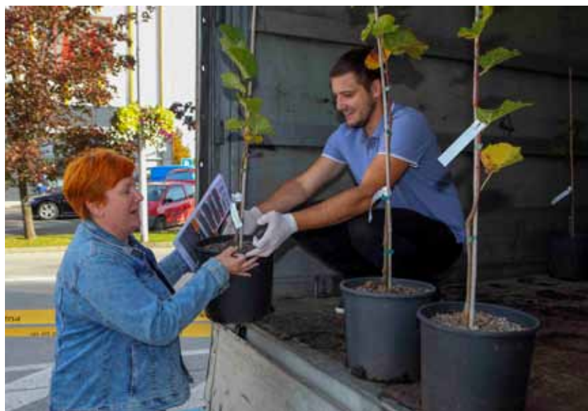
Podijeljeno je 140 mladih stabalaca

Putem specijalizirane platforme, ovaj je događaj postao vidljiv na razini cijele EU pa su tako zainteresirani pratitelji mogli čitati i o načinu na koji Grad Ivanec u suradnji sa znanstvenicima Šumarskog instituta i sa svojim građanima čuvaju i štite ivanečku lipu kao istinsku povijesnu i prirodnu posebnost. (lj)