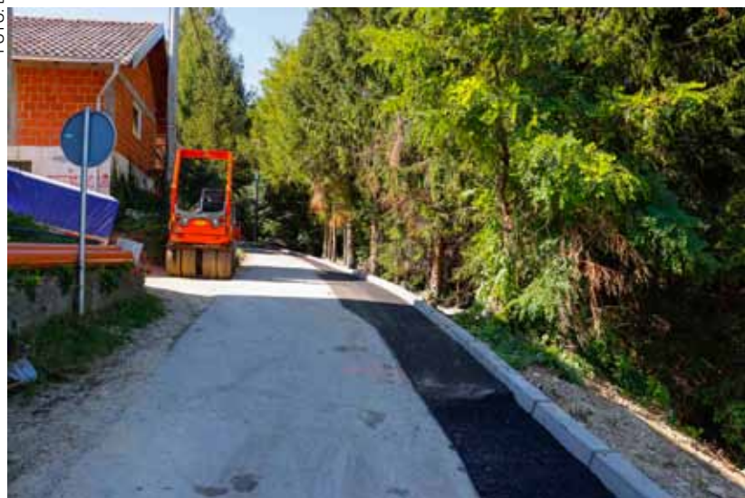
Novom prometnicom sigurno do nekretnina

Osobito problematično bilo je ono sa zapadne strane, koje je potpuno razorilo cestu te ugrozilo okolne objekte. Prometnica je, naime, otklizala više od 20 metara niz strmu padinu, čime je mještanima odsječen prilaz nekretninama. Kako bi im omogućio da dođu do svojih klijeti i vinograda, intervenirao je Grad te im uređio put iz pravca Željeznice.