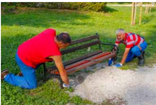
Demontaža starih klupa; zamijenit će ih nove

gradit će se i novi paviljon. Sadašnji paviljon sagrađen je početkom 20. stoljeća i građevinski stručnjaci procijenili