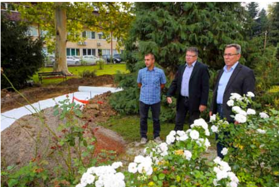
Gradonačelnik M. Batinić sa suradnicima u obilasku radova u parku

Radovi obuhvaćaju gradnju kandelaberske rasvjete, parkovnih staza, novog paviljona te nabavu i postavljanje novih klupa i koševa za smeće