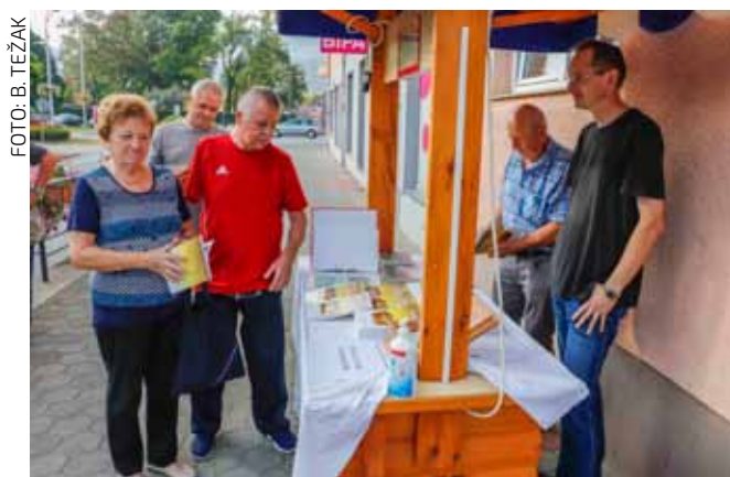
Prolaznici su rado zastajali i uzimali Ivanečku škrinjicu

Glavni i odgovorni urednik publikacije je Siniša Krznar, a u njoj su zastupljeni tekstovi iz povijesti, kolekcionarstva i etnografije ši-