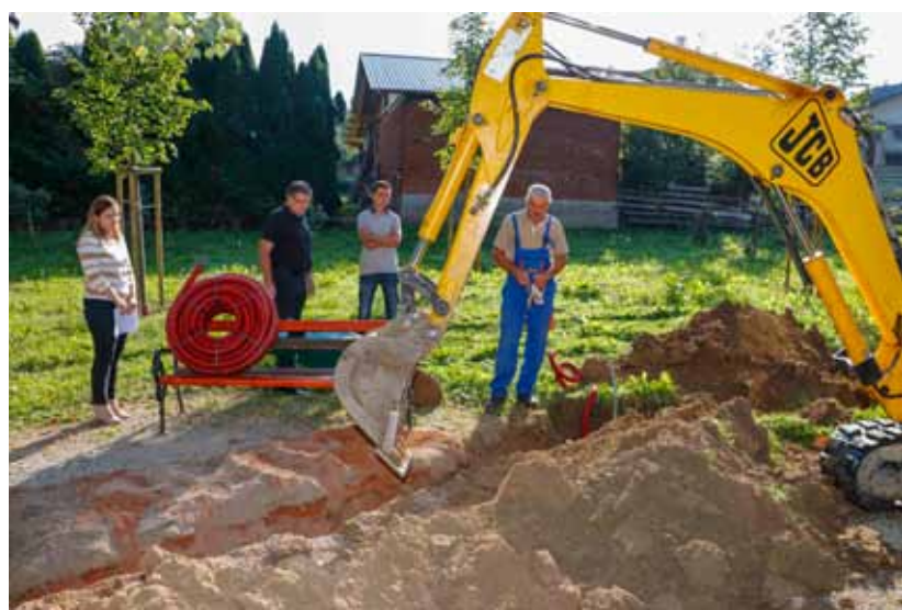
Ivkom je u cijelom parku položio cijevi i kabele za kandelabersku rasvjetu

U ponedjeljak, 21. rujna, otvoreni su i radovi na uređenju staza. Gradi se oko 620 metara glavnih i sporednih staza, a na njih će se položiti oko 1.330 m 2 opločnika (tlakavaca). Uredit će se sve staze u parku, s time da će glavne