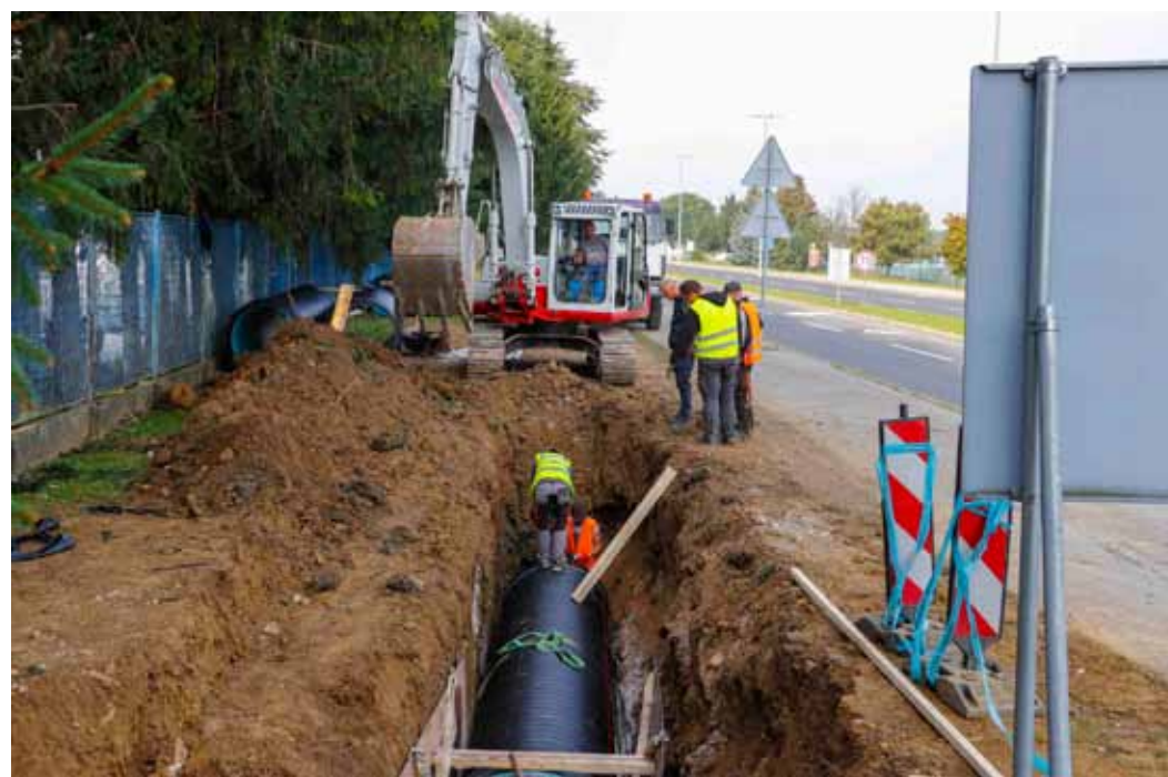
Gradnja prelavnog okna na dijelu kolektora u Ul. I. G. Kovačića

Pošto su izračuni pokazivali jedno, a praksa nešto sasvim drugo, u cilju sprečavanja poplavlivanja Grad i Ivkom – Vode dogovorili su da se problem riješi na navedeni način, što je tijekom rujna i učinjeno.