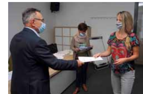
Čestitka! Veseli da je riječ o mladim ljudima koji su odlučili ostati živjeti u Ivanu i okolici

STANOGRADNJA Zaključeni novi ugovori o dodjeli bespovratnih gradskih sredstava za poticanje rješavanje stambenog pitanja