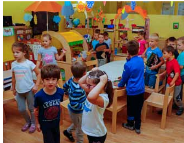
Dosadašnja dvorana pretvorena je u prekrasan prostor za 7-godišnjake

–Proveli smo natječaj i zaključili ugovor za izradu projektne dokumentacije za dogradnju kao temelj za ishođenje građevinske dozvole. Predviđena je dogradnja vrtića za 50–a mališana u dobi od 1 do 3 godine. S radovima na dogradnji vrtića planiramo početi sljedeće godine – poručuje gradonačelnik Batinić. Što se tiče vrtića u Radovanu i svojevremeno iskazanog interesa od strane poduzetnika koji bi gradio novi vrtić,