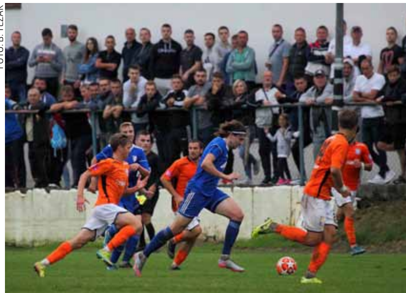
Nakon sedam kola Ivančica je ubilježila samo 7 bodova