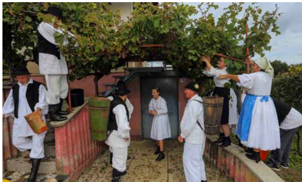
Braja je obrana u rekordnom vremenu

i nekoliko fotografija iz objektiv našeg fotografa Branka Težaka. Živjeli!(ljr)