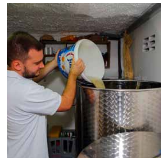
Manje ga je nego lani, ali je litno