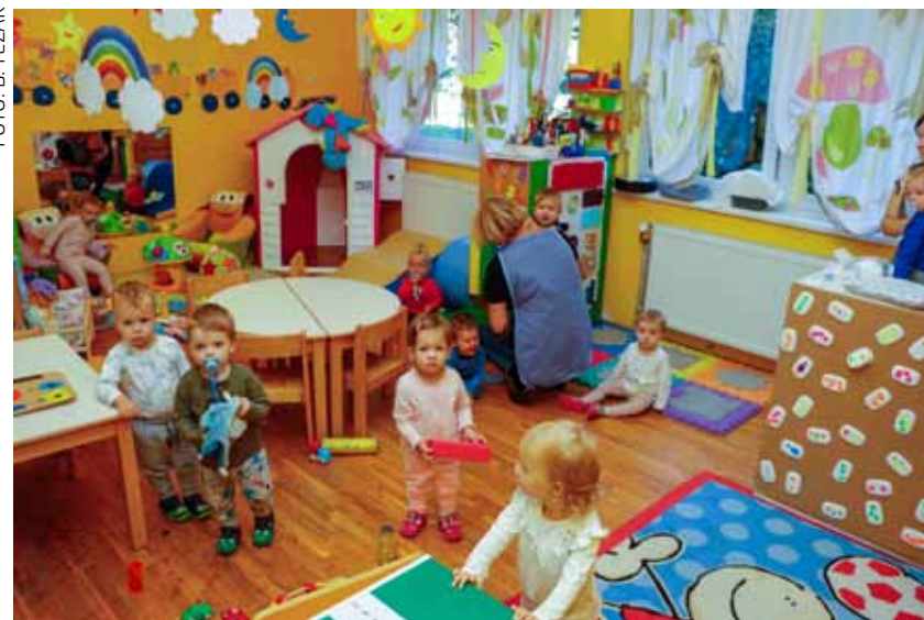
Pune ruke posla u jasličkoj skupini!