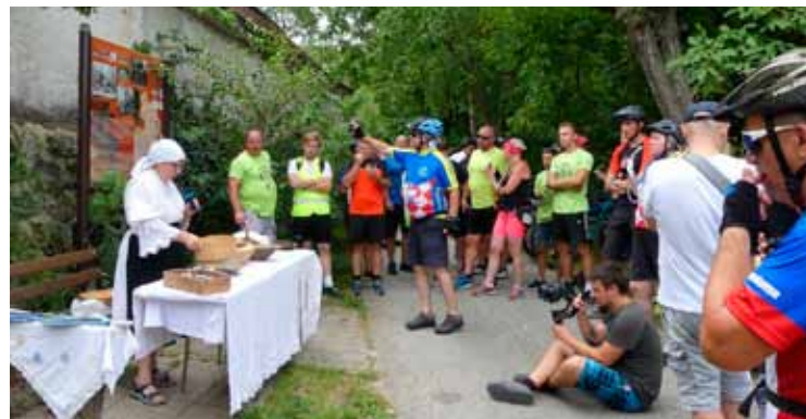
Kod nekadašnjeg melina obitelji Levanić na Bistrici

Salinovec, za sve je sudionike organizirana okrepa kod nove škole. Bicikljadu je organizirao DŠR Salinovec, a održana je pod pokroviteljstvom Grada Ivanca te uz potporu i znatan angažman gradske Turističke zajednice.(ljr)