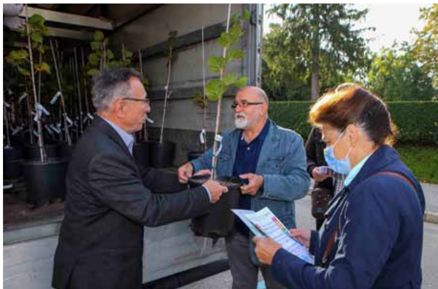
Građani su s veseljem preuzimali sadnice klonirane lipe

i one će za sadnju biti spremne 2021. Grad planira mladim lipama lipe zasaditi parkove, površine u ivanečkim gospodarskim zonama i druge javne površine. A klon pod simboličnim rednim brojem 1 do daljnjega ostaje u Šumarskom institutu i on će, kad dođe vrijeme, biti zasađen na mjestu stare lipe, kada stablo dođe do svog biološkog kraja – izjavio je gradonačelnik Milorad Batinić koji se ujedno i pridružio podjeli sadnica te uputio zahvale svim građanima koji su zasadili lipe.