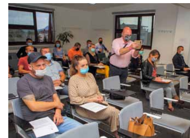
U drugom ovogodišnjem krugu ugovore s Gradom potpisalo je 20 mladih obitelji

♦♦ Zajedno s onima koji su ugovore zaključili početkom srpnja, broj obitelji koje sada koriste gradske poticajne mjere povećan je na 34