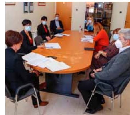
Na prvoj, konstituirajućoj sjednici zaklade Grada Ivanca

◆ Početna sredstva za rad osigurao je Grad Ivanec, koji je na poseban bankovni račun položio 50.000 kuna