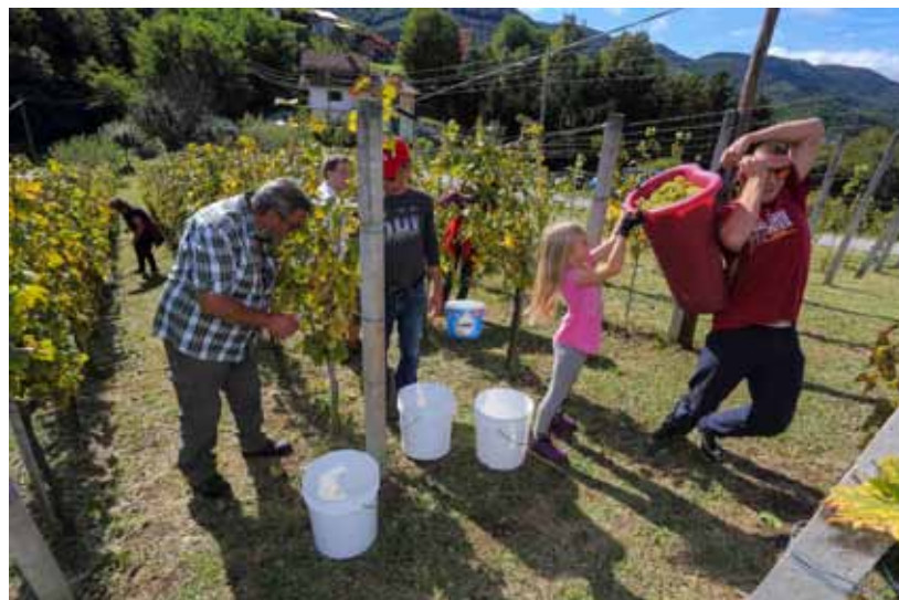
Stota berba u vinogradu obitelji Sever

MARATON Na stazi preko Ivančice, dugoj 42 kilometra