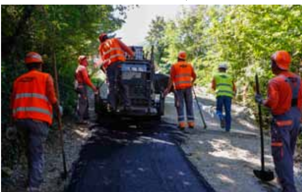
Završni radovi – polaganje asfalta na novouređenu cestu uz klizišta na Jazvečinama