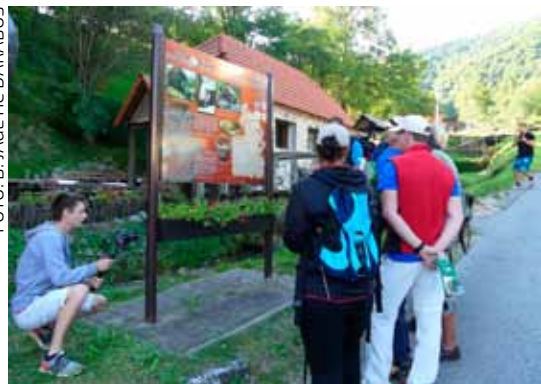
Snimanje kadrova za promo video kod Friščićevo mlinu

TURISTIČKA ZAJEDNICA Na najatraktivnijim lokalitetima širom grada Ivanca