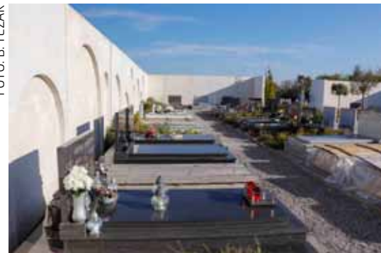
Nakon Svih svetih Ivkom d.d. počinje s radovima na gradnji dubinske i površinske odvodnje na novom groblju Ivanec