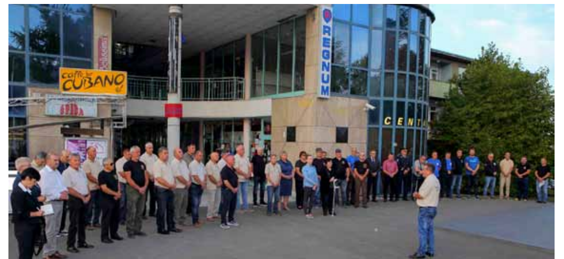
Debeljak: Nije nam dana nikakva druga mogućnost osim da sami, oružjem i srcem, oslobodimo Hrvatsku

Novo izdanje donosi zanimljive tekstove 16 autora tematski vezane uz povijest, kolekcionarstvo i etnologiju šireg ivanečkog kraja