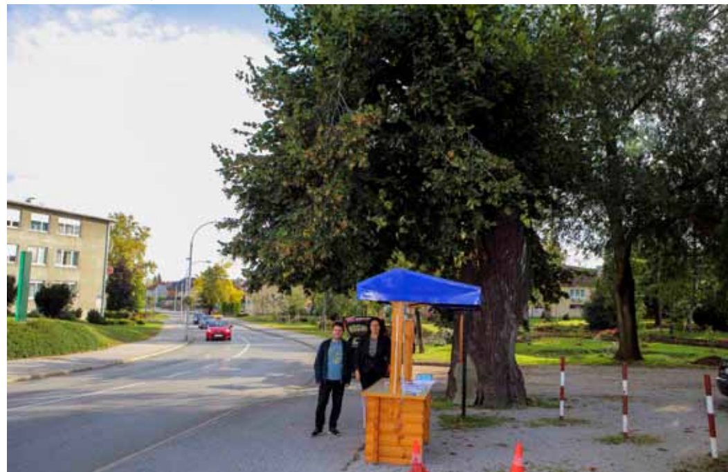
Na štandu, simbolično postavljenom ispod stare lipe, građane su čekale svjedodžbe o podrijetlu lipe i leci o održivom razvoju

i one će za sadnju biti spremne 2021. Grad planira mladim lipama lipe zasaditi parkove, površine u ivanečkim gospodarskim zonama i druge javne površine. A klon pod simboličnim rednim brojem 1 do daljnjega ostaje u Šumarskom institutu i on će, kad dođe vrijeme, biti zasađen na mjestu stare lipe, kada stablo dođe do svog biološkog kraja – izjavio je gradonačelnik Milorad Batinić koji se ujedno i pridružio podjeli sadnica te uputio zahvale svim građanima koji su zasadili lipe.