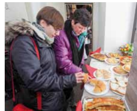
Druženje uz domaće krušne delicije

turiste te tehnički opis šetnice duge oko 6,5 km.