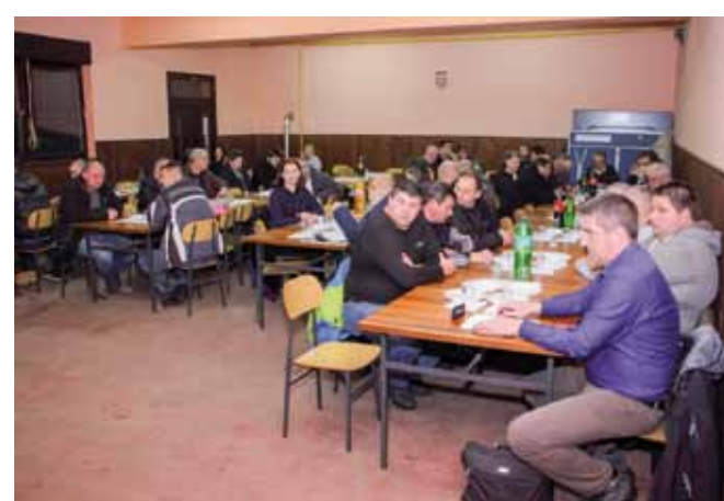
DŠR Lančić – Knapić jedno je od najboljih sportsko – rekreativskih društava u Hrvatskoj