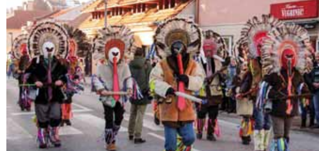
Petrajinski kurenti iz Petrijanca u zanimljivim pernatim maskama

duje već gotovo tri desetljeća. Uz tradicionalne gumile, domaćini su se ove godine prvi put predstavili novom skupinom ivančica . Uz njih, na trgu je galamilo i halabučilo još 20 skupina, među njima i velike grupe kurenata iz slovenskog Podlehnik, Vidma i Leskovca, iz Murskog Središća, Turčišća, Domašinja, Nedelišća, Lobora, Cestice, Petrijanca, Donje i Gornje Voće, Lepoglave,