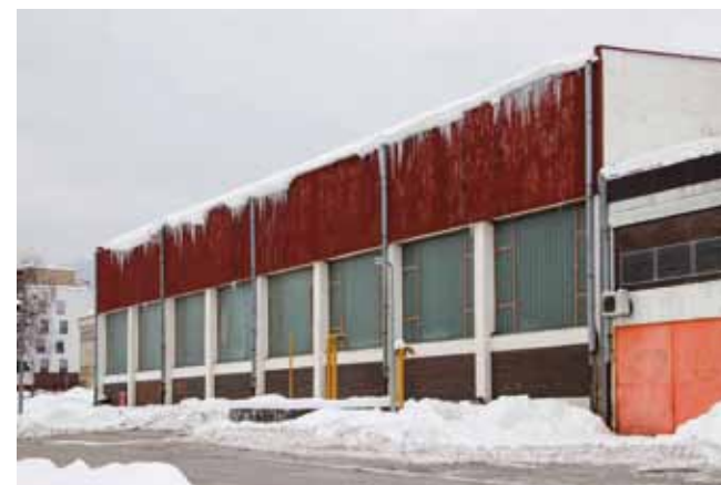
Energetska obnova predviđa i zamjenu kopelit stakla na srednjoškolskoj sportskoj dvorani

Sredstva su namijenjena energetske obnovi školske zgrade i to kotlovnice, stolarije, kopelit stakla na objektu školske sportske dvorane, kompletne rasvjete u dvorani kao i dogradnji postojeće Sunčane elektrane na krovu škole. (lir)