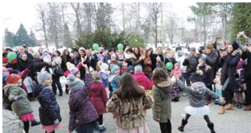
U parku se i zaplesalo

Razigrana Ptičja svadba ponovno se potvrdila kao jedna od najpopularnijih manifestacija u našemu gradu. (lir)