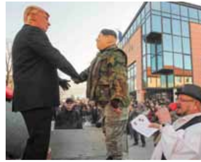
Povijesno pomirenje: Ljuti protivnici zagrlili se u Ivancu