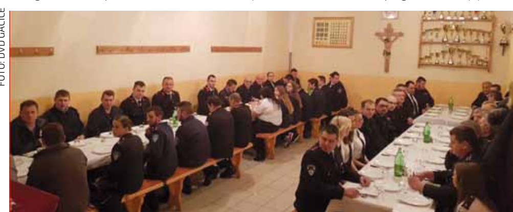
DVD Gačice nositelj je društvenog života svoga naselja