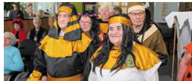
Egipćani u Caritasovu domu

Prvi Lafra fest održan u Caritasovu domu sv. Ivana Krstitelja u Ivancu pokazao je da veselje fašničkih dana ne zaobilazi ni najstariju populaciju. Potvrdile su to maskirane skupine iz šest domova koje su se prošpancirale pred prosudbenim povjerenstvom i izvele prigodan program. Uz domaćine iz Caritasova doma, koji su se ove godine predstavili slikarskom kreacijom iz van Goghove radionice , a prikazali su i maske s kojima su proteklih godina sudjelovali