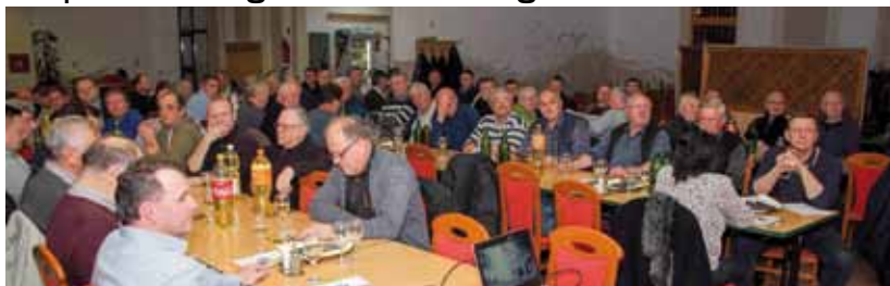
Godišnjoj skupštini Peharčeka nazočilo je 120 od ukupno 179 članova

UDRUGA PEHARČEK 120 vinogradara na godišnjoj skupštini vinogradarske udruge