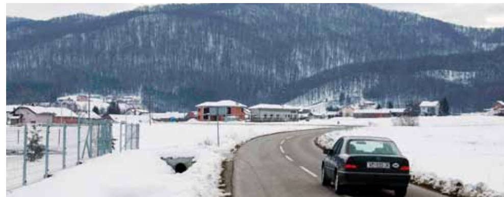
Opasno za djecu i pješake na cesti Seljanec – Margečan; Gradu je ova jedan od prioritarnih projekata, ali iz ŽUC-a još nema informacije o radovima u 2018.

No, dogodi li se da rente do- ista neće biti, a da većina grad- skih vijećnika i ubuduće ostanu pri izglasanoj odredbi da mje- štani u okolici deponija ne treba- ju plaćati odvoz smeća, troškove