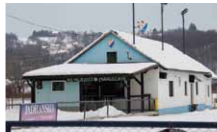
Grad Ivanec je u proračunu za 2018. osigurao sredstva za krovšte na objektu NK Margečan