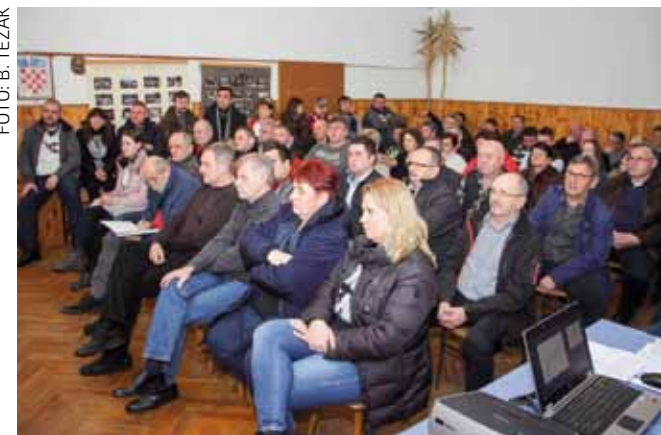
Dobro posjećena skupština salinovečkog DŠR-a