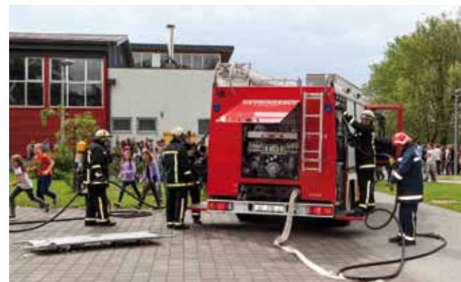
DVD Ivanec svoj će jubilej obilježiti nizom manifestacija u svibnju, Mjesecu zaštite od požara

Dobrovoljno vatrogasno društvo Ivanec, najstarije vatrogasno društvo na području bivše ivanečke općine i ujedno, najdugovječnija od svih udruga na području našega grada, počela je s pripremama za obilježavanje visokog jubileja – 130. godišnjice kontinuiranog rada i djelovanja. Ivanečki vatrogasci svoju će godišnjicu obilježiti cijelim nizom manifestacija koje će se odvijati svakog vikenda u svibnju, Mjesecu zaštite od požara.