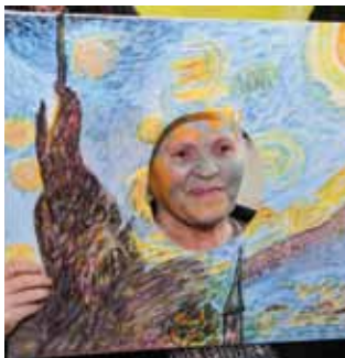
Nesvakidašnja maska inspirirana slikarstvom Vincenta van Gogha

Hopaci iz Gornje Voće. Nakon što je osuđen kao simbol svega zla i lošeg, maškare su potom Fašnika zapalile, a nakon toga urnebesnu zabavu nastavile u dvorani KTC-a u Ivancu, uz glazbu, ples, krafne te dobro iće i piće. Pokrovitelj Fašnika je Grad Ivanec, koji je i ove godine osigurao novčanu i logističku potporu ovoj manifestaciji. Suorganizaciju potpisuje Turistička zajednica grada Ivanca. (Ijr)