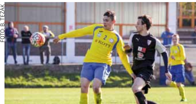
Ivančica je počela s pripremama za proljetni dio prvenstva u 1. ŽNL Varaždin