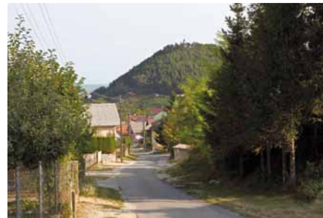
Cestovna dionica od centra Prigorca do Rapikovca će se rekonstruirati i kolnik proširiti na 4,50 metara

Kompletna investicija koja obuhvaća izgradnju 2,9 km ceste u Prigorcu i uređenje parkirališta na Rapikovcu financirat će se iz vanjskih izvora, bez kune udjela iz proračuna Grada Ivanca