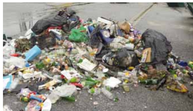
Neprihvatljivo! Pomiješan otpad ubuduće se neće preuzimati