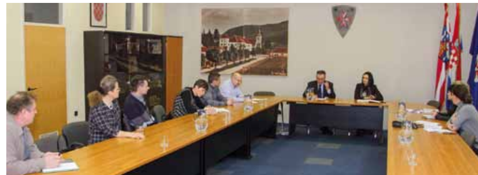
Na sastanku s predstavnicima Srednje škole i vlasnicima drvoprerađivačkih tvrtki i obrta