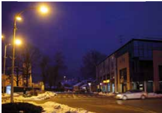
Treba li gradsku špicu dodatno rasvijetliti?

la biti uređena prema normama koja propisuje Pravilnik iz 2007., nemam osjećaj da se mićemo s početne točke. Kad možemo očekivati da se to riješi na području Ivanca i šire?