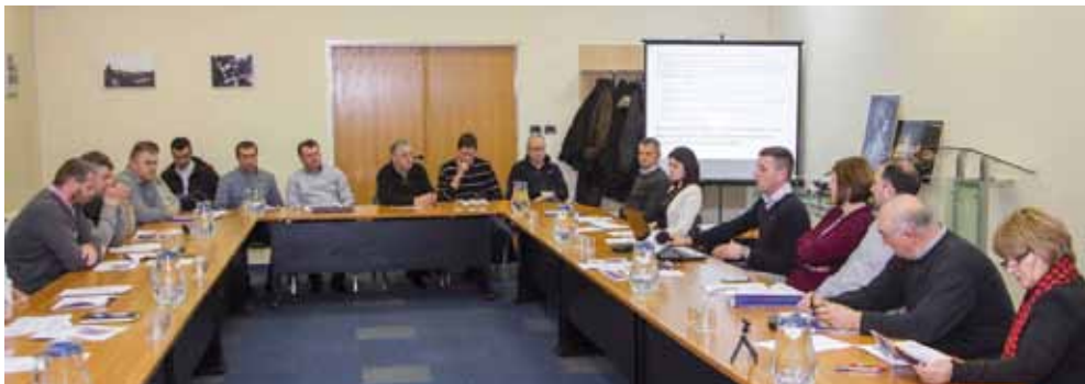
Čak 91,5 milijuna kuna za najveći infrastrukturni projekt u povijesti Ivanca iz EU fondova