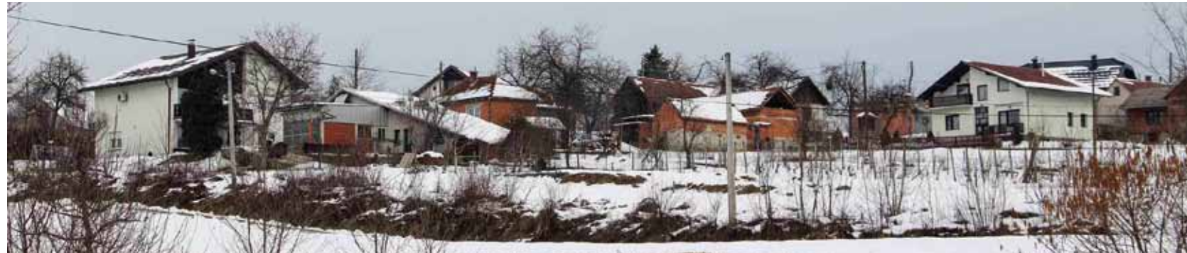
Zaselak Stančići: Ivkom vode zadužene su za izradu projektnog zadatka za kanalizacije u naseljima koja su ostala izvan obuhvata velikih projekta

Nastavak slijedi u idućem broju Ivanečkih novina.