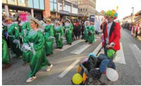
Ivanečka Maska ove godine u znaku ivančica

IVONJSKI FAŠINK U organizaciji Društva prijatelja narodnih običaja Maska