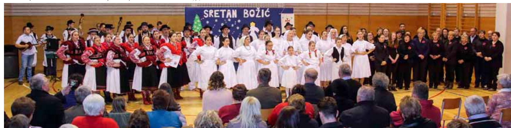
„Narodi nam se“, u izvedbi svih sudionika programa

BOŽIĆNA RADOST U OŠ Ivanec tradicionalna Božićna priredba