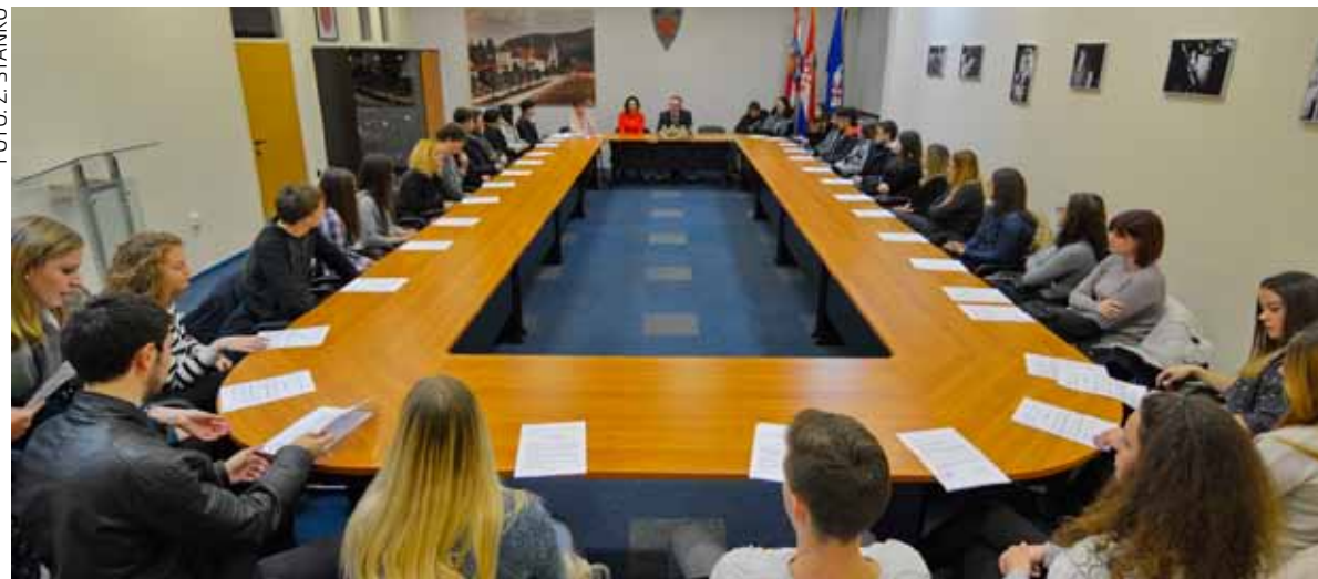
Stipendisti Grada Ivanca u akademskoj godini 2017./2018.

Gradonačelnik M. Batinić: Znamo da 500 kuna stipendije nije puno za studentske troškove; razmotrit ćemo stanje u proračunu 2018. i sagledati mogućnosti povećanja stipendija