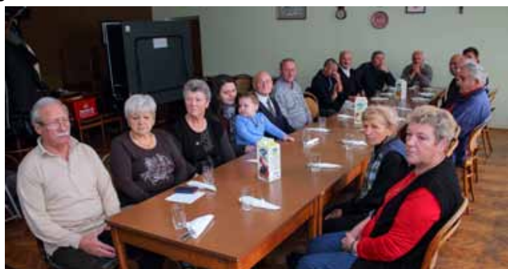
Udruga invalida Ivanec na prigodnom skupu u povodu Međunarodnog dana osoba s invaliditetom

poruka državnim institucijama. U Dječjem vrtiću Grad je financirao zapošljavanje medicinske sestre koja pruža pomoć i djeci s poteškoćama u tjelesnom i intelektualnom razvoju, a u vrtiću je opremljena i tzv. senzorna soba. Usto, Grad je sudjelovao i u opremu posebne sobe u OŠ, koja služi za potrebe odmor djece s invaliditetom – istaknula je M. Držaić. U nastavku svečanosti najboljim rekreativcima uručena su priznanja, a potom je druženje nastavljeno na ležernom tonu, uz domjenak, glazbu i kolače. (Ijr)