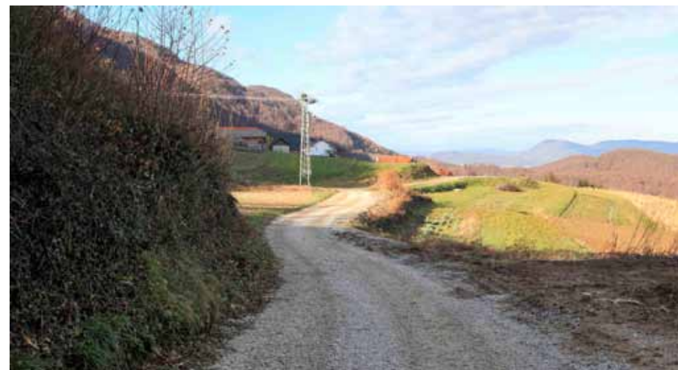
U izgradnju ceste EU sredstvima - cesta u Prigorcu ove će godine biti među najvećim gradilištima na području grada Ivanca

Projektom je predviđena rekonstrukcija ceste od centra Prigorca do parkirališta Rapikovec, uređenje oborinske odvodnje i pješačke staze, asfaltiranje odvojka Strugari, izgradnja novih 65 parkirnih mjesta, asfaltiranje ceste do Izletišta te uređenje makadamske ceste do Šumija; kompletna investicija (100%) financirat će se europskim sredstvima