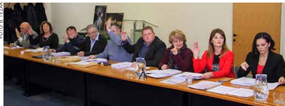
Gradski proračun za 2018. godinu donijet je većinom od 14 glasova vijećnika HNS-a, HSU-a, HSS-a i HDZ-a

Zbog neusklađenosti sa zakonom nije prihvatio ni amandman kojim je Klub vijećnika SDP-a tražio povećanje sredstava za redovitu djelatnost Zajednice sportskih udruga, a da se sredstva za to pribave sa stavke planiranih kapitalnih ulaganja u