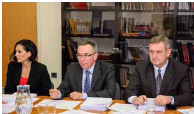
Niz pitanja vijećnici su uputili gradonačelniku Batiniću kao predlagачu proračuna

Proračun Grada Ivanca za 2018. uvodno je, kao njegov predlagatelj, obrazložio gradonačelnik Milorad Batinić, naglasivši da je u potpunosti usklađen sa Zakonom o proračunu, sa Strategijom razvoja grada Ivanca 2014.-2020. i svim strateškim gradskim dokumentima te da je o njemu provedena javna rasprava.