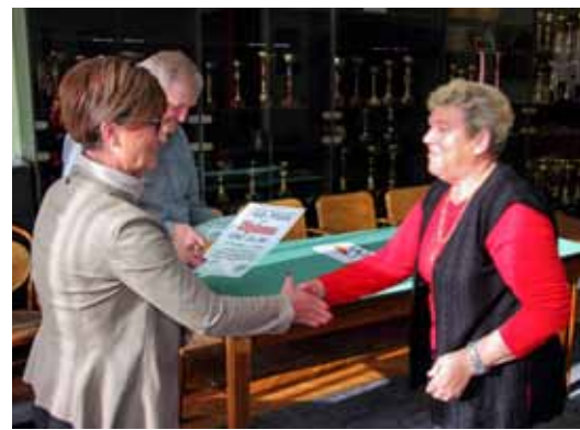
Priznanja najboljima u rekreacijskim natjecanjima

–Grad Ivanec otklonio je sve arhitektonske barijere koje su bile u nadležnosti