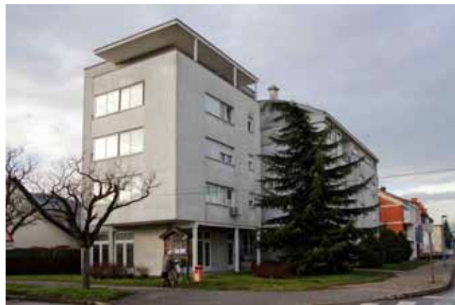
Počelo postavljanje instalacija u najatraktivnijim prostorima u istočnom dijelu braniteljske zgrade

Instalacijsko opremanje najatraktivnijeg, istočnog dijela zgrade, predstavlja početak radova na unutarnjem uređenju, a u ovoj fazi izvest će se radovi vrijedni 40.000 kuna, koji predstavljaju preduvjet za daljnji nastavak radova tijekom ove godine.