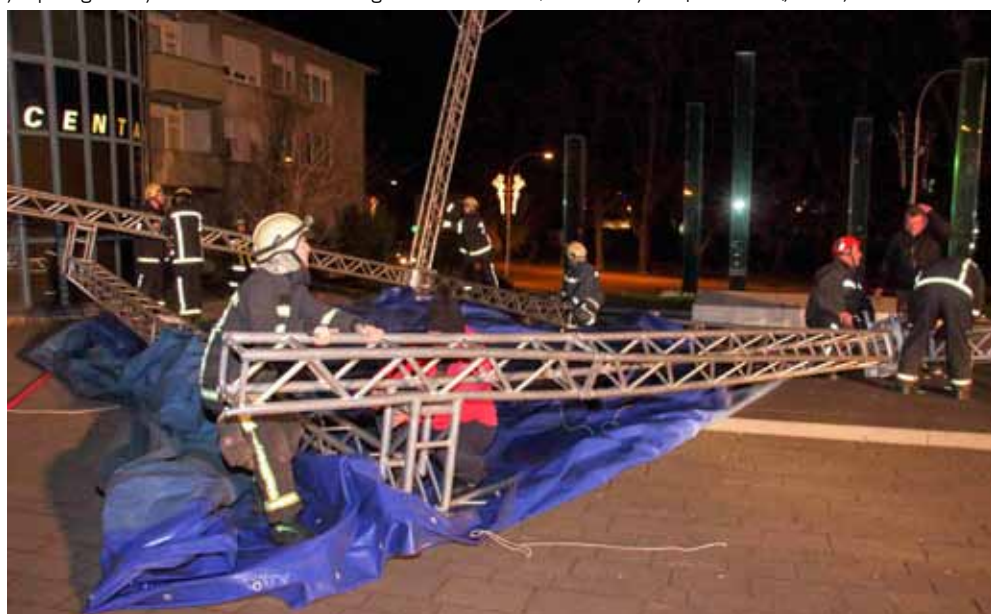
Umjesto lijepog dočeka Nove godine – havarija na gradskoj špici

MOTOMRAZOVI Stari božićni gosti ponovno obradovali djecu i mališane