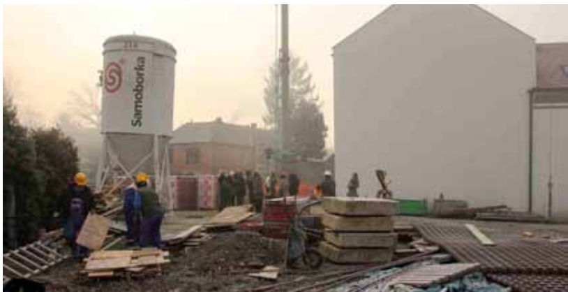
Lijepi prosinački dani iskorišteni su za betonske i zidarske radove