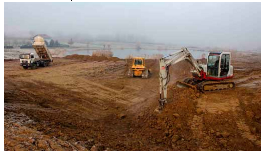
Izvedeni su radovi na planiranju i uređenju površine od oko 3.500 četvornih metara

Ivanečka javnost, a naročito građani Lančić – Knapića s odobravanjem su dočekali početak radova u sklopu budućeg Rekreacijskog centra Lančić na Matišićevom bajeru. Kao što je i bilo najavljeno, tu su prošlog mjeseca izvedeni opsežni radovi na pripremi i planiranju terena.