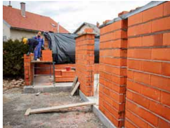
Počela je gradnja nove muzejske zgrade