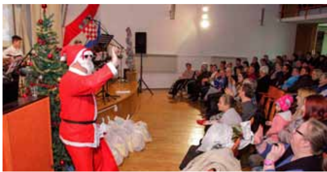
Veseli posjet Djeda Božićnjaka članovima Ivanečkog sunca