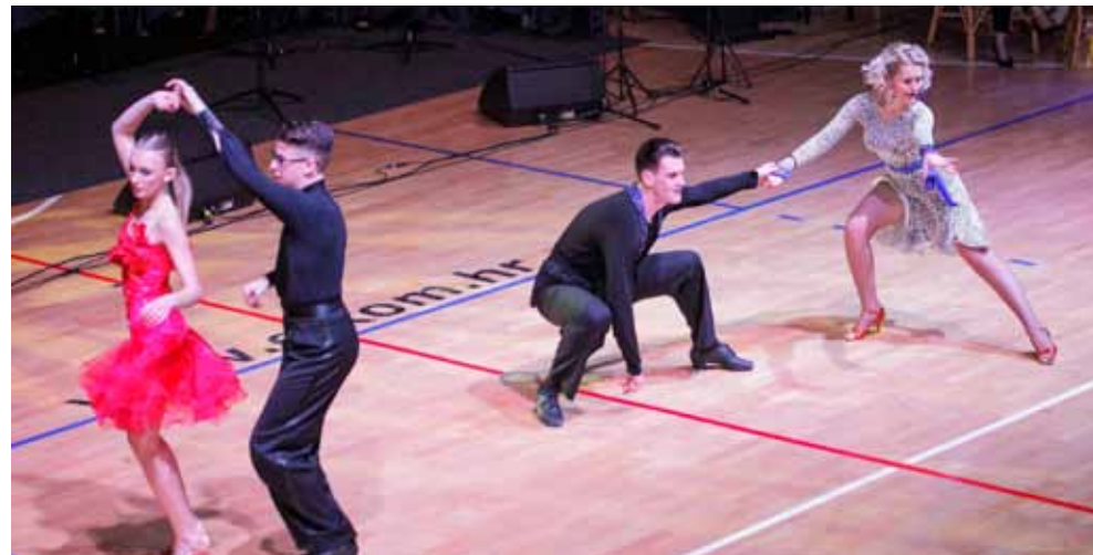
Publika je pljeskom nagradila sjajni nastup ivanečkih plesnih parova

U skladu s tradicijom, za sve izvođače je nakon koncerta priređeno druženje, na kome se svim izvođačima i njihovim voditeljima obratio i zahvalio im na prekrasnom glazbenom ugodaju gradonačelnik Milorad Batičić. I sam dirnut nesvakidašnje lijepom koncertnom atmosferom, uputio im je čestitke na njihovu radu, uspjesima, atmosferi koju su priuštili građanima te ih pozvao da svojim nastupima i češće kroz godinu razvesele građane.(ljr)