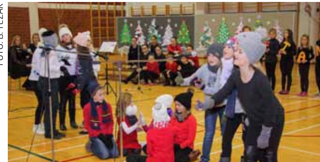
Djeca su izvela i više duhovitih igrokaza

Priredbom održanoj u školskoj sportskoj dvorani, učenici Osnovne škole Ivanec u srijedu su, 20. prosinca, u pravom smislu te riječi uronili u duh Božića, a ujedno su prikazom svoga stvaralaštva raznježenim roditeljima