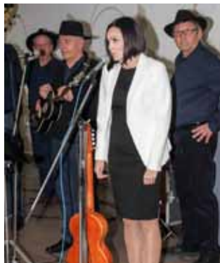
Pozdravne riječi i želje za dobrim zdravljem uputila je zamjenica gradonačelnica

Ove riječi, koje smo zabilježili u susretu s jednom starijom gospođom iz Gečkovca,