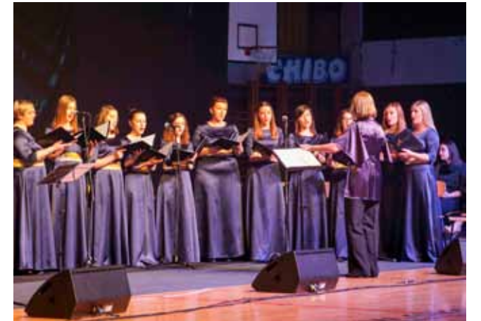
Dimenzija više uz pjesmu četverostrukih državnih prvakinja, pjevačica VA Sakcinski

Publika je sjajno prihvatila i drugi, moderniji dio koncerta, ispunjenim stranim skladbama