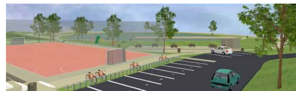
Idejno rješenje budućeg Rekreacijskog centra Lančić

Uređenje Rekreacijskog centra Lančić nedvojbeno će dati velik zamah razvitku turizma, ali i sportske rekreacije ovoga područja, pogotovo s obzirom na iznimno aktivan DŠR Lančić – Knapić, koji je jedna od perjanica sportske rekreacije ne samo na lokalnoj, već i na nacionalnoj razini. (ljr)