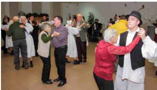
Gradski vijećnici i vijećnice te članovi KUD-a Salinovec s bakama i djedovima otplesali su Bečki valcer

na najbolji način dočaravaju atmosferu na božićnom susretu i druženju koje je Grad Ivanec u subotu, 12. prosinca, slijedom dugogodišnje tradicije, priredio za najstarije građane Ivanca. Na druženje je bilo pozvano 876 građana starijih od 76 godina