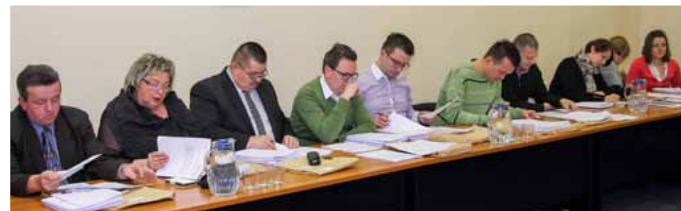
Duga rasprava o proračunu na trosatnoj sjednici Gradskog vijeća

obnovu zgrade u Nazorovoj ulici 6 (zgrada MIO i HZZO-a, u kojoj je Grad Ivanec na trajno korištenje od države dobio cijeli 2. kat).