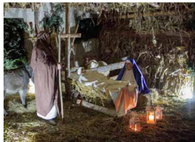
Pastoralna atmosfera betlehemske štalice

Članovi Udruge građana Prigorec, učenici, učitelji i mještani uložili su mnogo truda u oživotvorenje najčarobnije od svih biblijskih priča