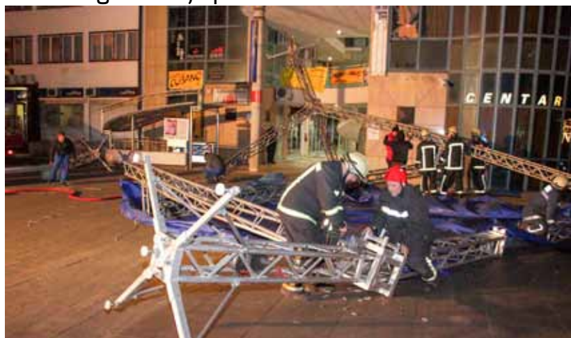
Uslijed snažnog udara vjetra, krovna konstrukcija bine odbačena je na Mipcroovu zgradu

A upravo to i jest ono što je gradonačelnik M. Batinić u prvim trenucima Novoga ljeta planirao zaželjeti svim našim građanima. Dakle, neka 2018. godine svima bude ljepša, zdravija, zadovoljnija i sretnija. A klimatske promjene i njihove posljedice su, na žalost, nešto s čime smo se tek počeli suočavati i što će vjerojatno postati jedan od novih, globalnih problema s kojim će se boriti generacije 21. stoljeća.