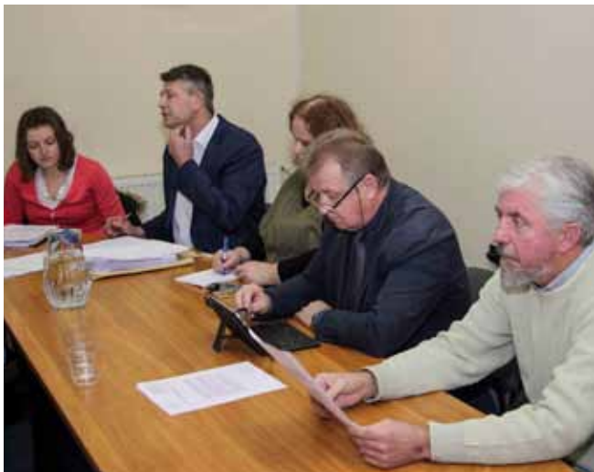
Sjednici su nazočili i predstavnici gradskih tvrtki i ustanova

Odbio je i amandman kojim je SDP tražio smanjenje stavke za informiranje u korist uvođenja novih stipendija. Obrazložio je to najnovijim podacima (dodjela stipendija 2017.) koji pokazuju da su stipendije dobili svi studenti koji su se prijavili na natječaj za dodjelu socijalnih stipendija. Na natječaj se, naime, prijavilo 80 kandidata. Od toga broja 14 prijava je odbačeno jer nisu