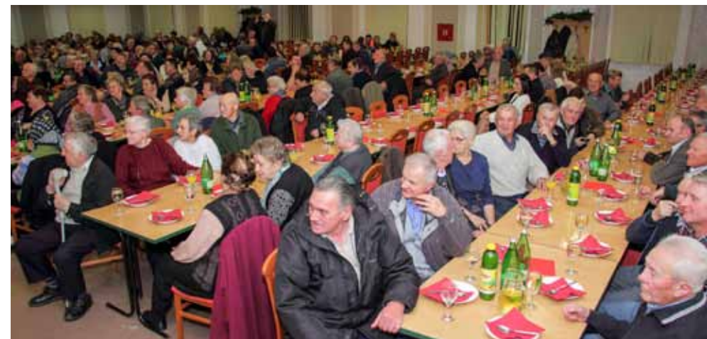
Na druženju se okupio velik broj najstarijih građana s cijelog gradskog područja