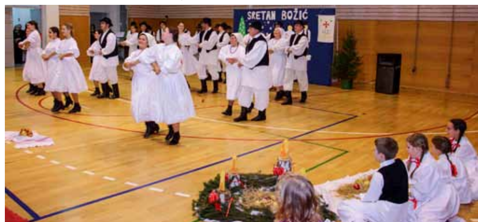
Božićni program KUD-a Salinovec