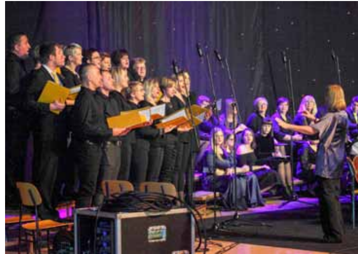
Prvi put pred „velikom“ publikom, i to uspješno – Zbor djelatnika OŠ Ivanec