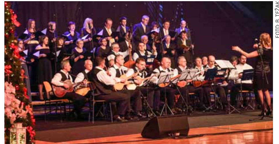
Zbor KUD-a Rudolf Rajter i Tamburaški orkestar KUD-a Itas Ivanec