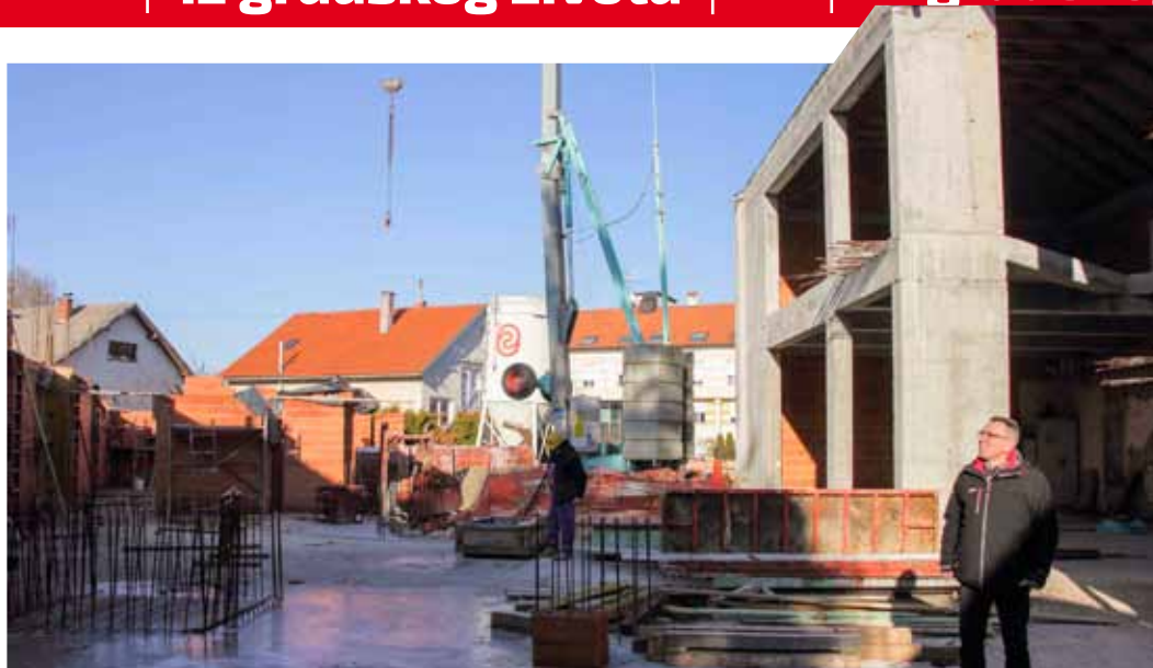
Druga faza radova – budući objekt polako „izranja“ iz temelja

Ivanečki dio projekta vrijedan je nešto više od 696.800 eura, a ako prode, predviđeno je da se oko 1,7 milijuna kuna usmjeri u građevinske radove. Također, projekt muzeja kandidiran je i na javni poziv Ministarstva kulture RH. (ljr)