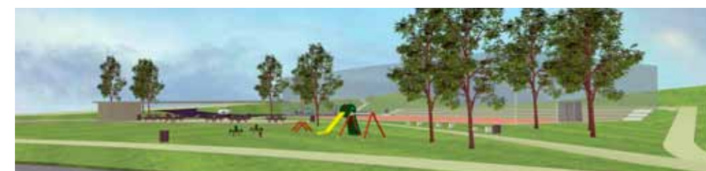
Šetnice oko bajera za bicikljanje i rolanje