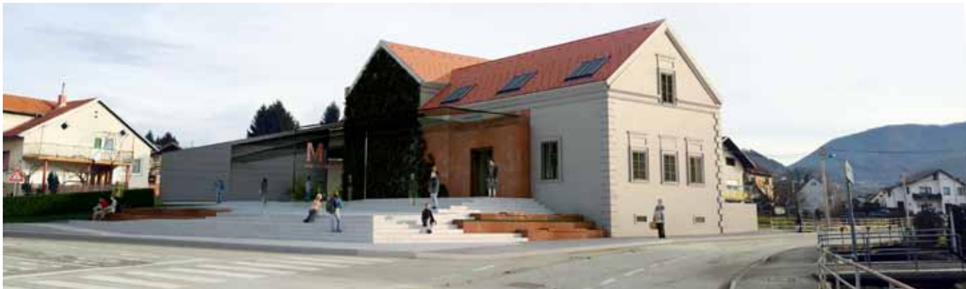
Ovako će izgledati muzej u konačnoj izvedbi

SJAJNA VIJEST Za izgradnju 2,9 km ceste u Prigorcu i parkirališta na Rapikovcu