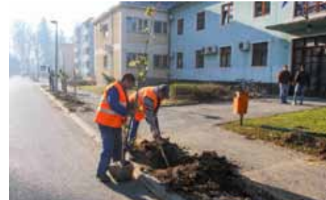
... a nakon toga zasađena su mlada stabla valjkastog graba i norveškog javora