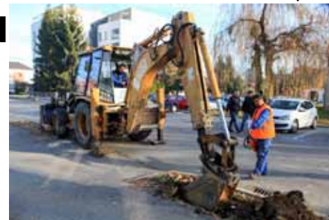
Panjevi starih javora strojno su iskopani i odstranjeni...

Ove radove također je izveo Hidroing, a financirale su ih Hrvatske vode. Projektom je predviđeno i postavljanje zaštitne metalne ograde uz cestu te rigol s rubnjakom, a što je u obvezi županijske uprave za ceste. (S. Vincek)