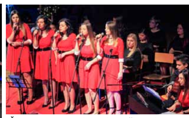
Ženska vokalna skupina Kaliop u živom ritmu stranih skladbi

Nakon koncerta, koji je završio skandiranjem uz Radetzky marš, svi sudionici potom su se neformalno nastavili družiti u predvorju Srednje škole. Oduševljen koncertom i visokom kvalitativnom i umjetničkom razinom programa, čestitke im je uputio gradonačelnik Milorad Batinić te ih pozvao da za svoje koncertne nastupe odsad što više koriste novu kinodvoranu. Koncert je održan u suradnji Grada Ivanca i svih navedenih KUD-ova. (lir)