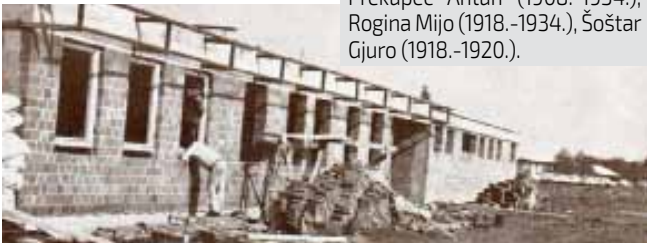
Gradnja nove tvornice na današnjoj lokaciji