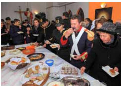
Druženje uz tradicionalna jela koje su pripremile članice Udruge građana Prigorec

vica, kruha iz krušne peći i drugih tradicionalnih jela koja su nekad rudari sa sobom nosili u okno.