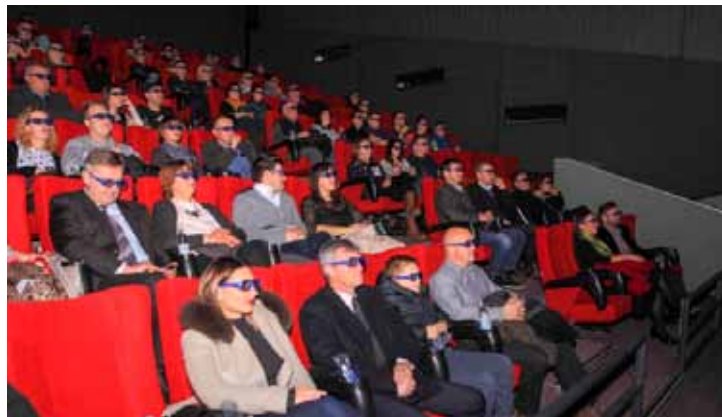
Prva kinoprojekcija u novoj dvorani