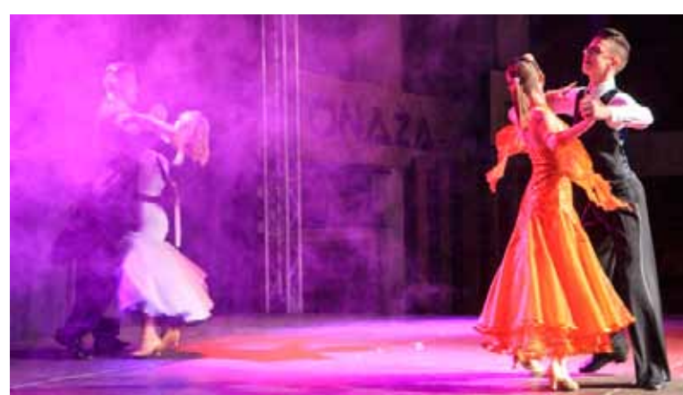
Ivanečki plesni parovi u ritmovima bečkog i engleskog valcera