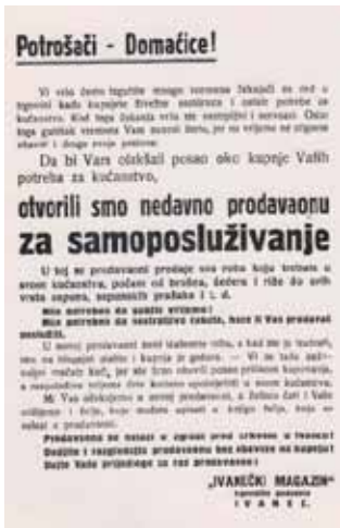
Ovakav marketing za 50-te godine prošlog stoljeća bio je vrlo suvremen i napredan

Veliku ulogu u prosvjedaivanju ljudi u smislu prihvaćanja kupovine u samoposluživanju odigrali su ivanečki učitelji, koji su sva-