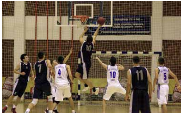
Na kraju jesenskog dijela prvenstva Ivančica je 8. s 12 osvojenih bodova, dok je naslov prvaka osvojio Podravac iz Virja.