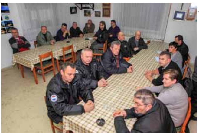
S godišnje izvještajne skupštine Hrvatskog časničkog zbora Ivanec

To je, među ostalim, na Skupštini Hrvatskog časničkog zbora Ivanec, održanoj u srijedu, 7.