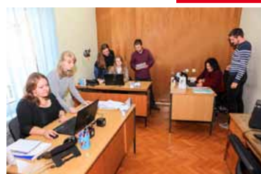
PROJEKTI URED ZA EU FONDOVE