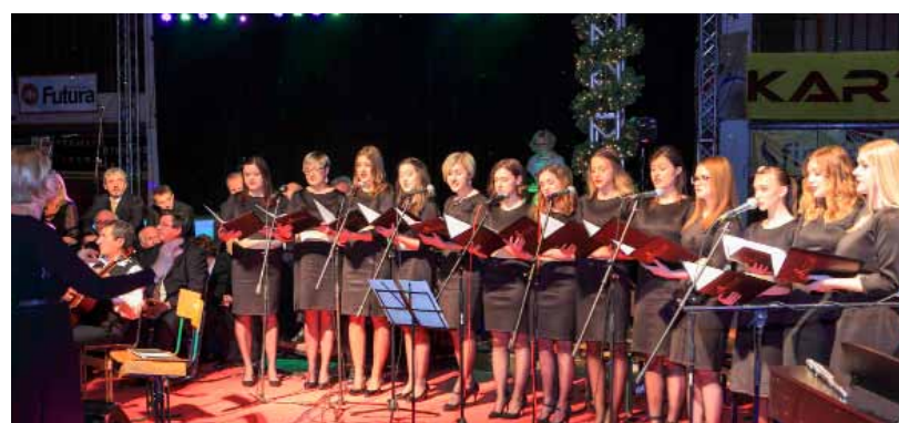
Vokalni ansambl Sakcinski u vrhunskom izdanju