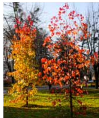
U Kumičićevu ulicu stiže u proljeće prekrasni likvidambar

U proljeće će se zasađiti i mladi drvoed u Ul. E. Kumičića, na mjestu posječenih brijestova, čije je agresivno korijenje „podiglo“ nogostupe i ograde te oštetilo instalacije komunalne infrastrukture (uključujući i kanalizaciju), što se smatra prema parku) zasađen je valjkasti grab, a s druge strane – norveški javor.