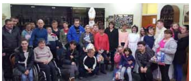
Udruga Ivanečko sunce za svoje članove redovito priređuje nikolinjska druženja