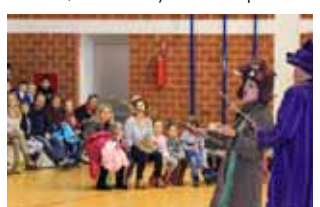
Predstava u prepunoj dvorani

U povodu Nikolinja, ovu je predstavu djeci poklonio Grad Ivanec, a ulazak je bio besplatan.