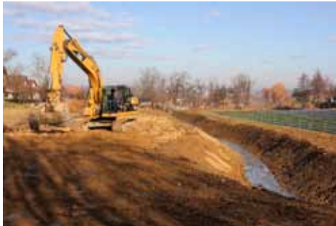
Radovi na potoku Vuglovčak

U Kumičićevoj ulici zasađiti će se mladi likvidambar. Riječ je o prekrasnom listopadnom stablu, koje obično naraste do 15 metara. Vrlo je