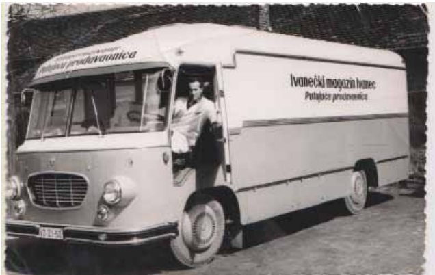
Ivanečki magazin je 1963. godine pokrenuo poslovanje Putujuće trgovine