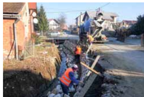
Obale potoka Vukovca na najkritičnijem dijelu učvršćene su kamenom

Riječ je o nastavku radova na ovom potoku, koji su na inicijativu Grada Ivanca započeli prošle godine, kada je očišćeno i uređeno oko 500 metara potočnog korita. Radovi su bili neophodni, kako bi se spriječilo izlivanje iz korita i poplavljanje okolnih površina, koje je bilo učestalo u zadnje vrijeme. Provedeni su tek nakon završetka poljoprivredne