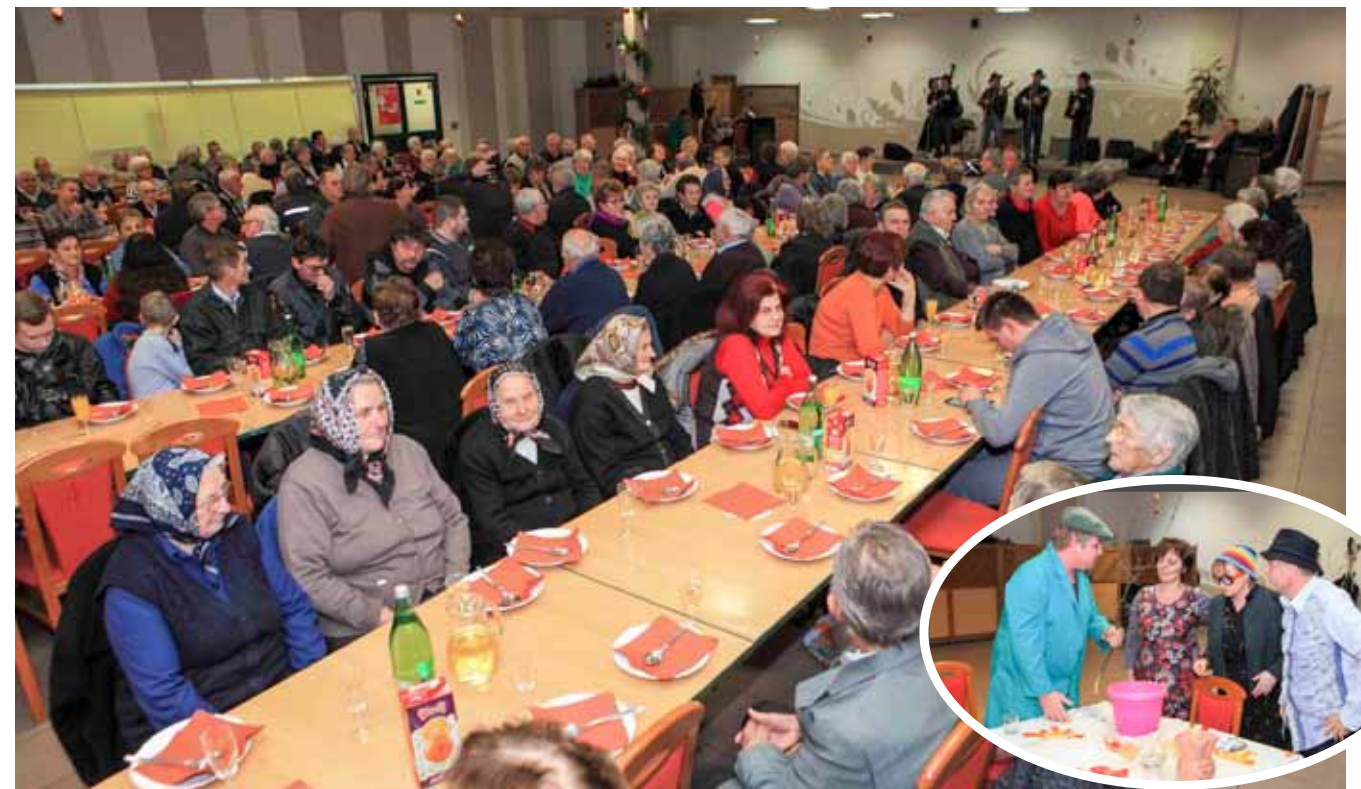
Na božićnom druženju okupilo se više stotina naših najstarijih sugrađana

jednak način i nas netko prisjetiti kad jednom dođemo u zlatne godine. Zahvaljujem vam na odazivu i želim vam dobro zdravlje i život sa što manje bolesti i tegoba – kazao je gradonačelnik te svima uputio blagdanske čestitke.