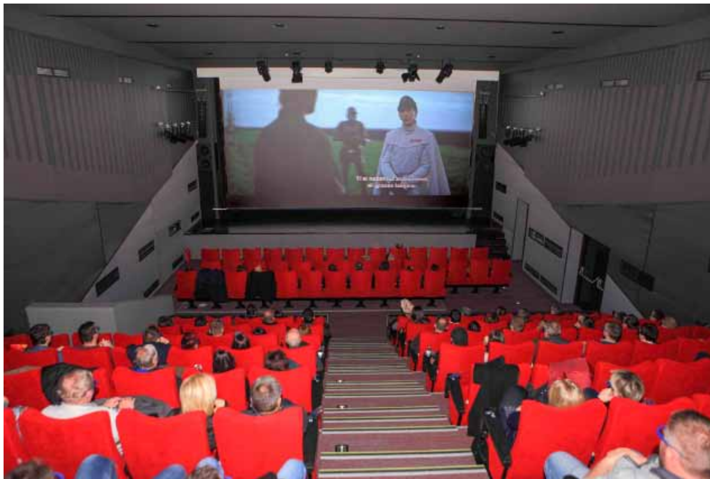
Pogled s tribina prema bini

–Zbog visoke razine ulaganja Grada kroz proteklih desetak godina prvenstveno u gospodarstvu i komunalnu infrastrukturu, društveni život građana u tom je razdoblju trpio. Ova kinodvorana rezultat je strateškog zaokreta Grada Ivanca prema novom razvojnom ciklusu. A on je vezan uz gradnju nove i modernizaciju postojeće