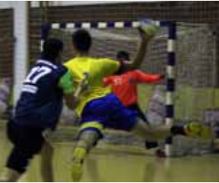
Sudački par iz Garešnice oštetio Ivančicu

Rukometaši Ivančice u završetku jesenskog dijela prvenstva u 1. HRL Sjever odigrali su još dvije prvenstvene utakmice i obje izgubili. U utakmici 12. kola poraženi su na od momčadi Nove Gradiške s 31:34, a tjedan dana kasnije i od Đakova s 26:29.