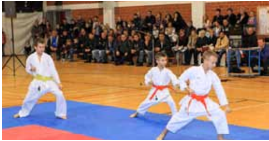
Demonstracija kata - pokreta i tehnika koje prikazuju borbu sa zamišljenim protivnikom