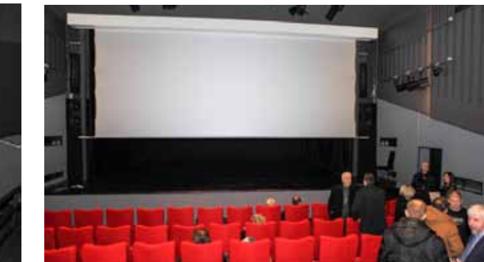
Specijalno kino platno je pokretno, njegovim dizanjem bina se pretvara u prostor za scenska i koncertna događanja