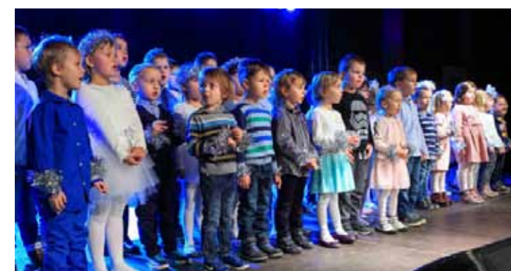
Mališani DV Ivančice su pjesmom i plesom raznježili publiku