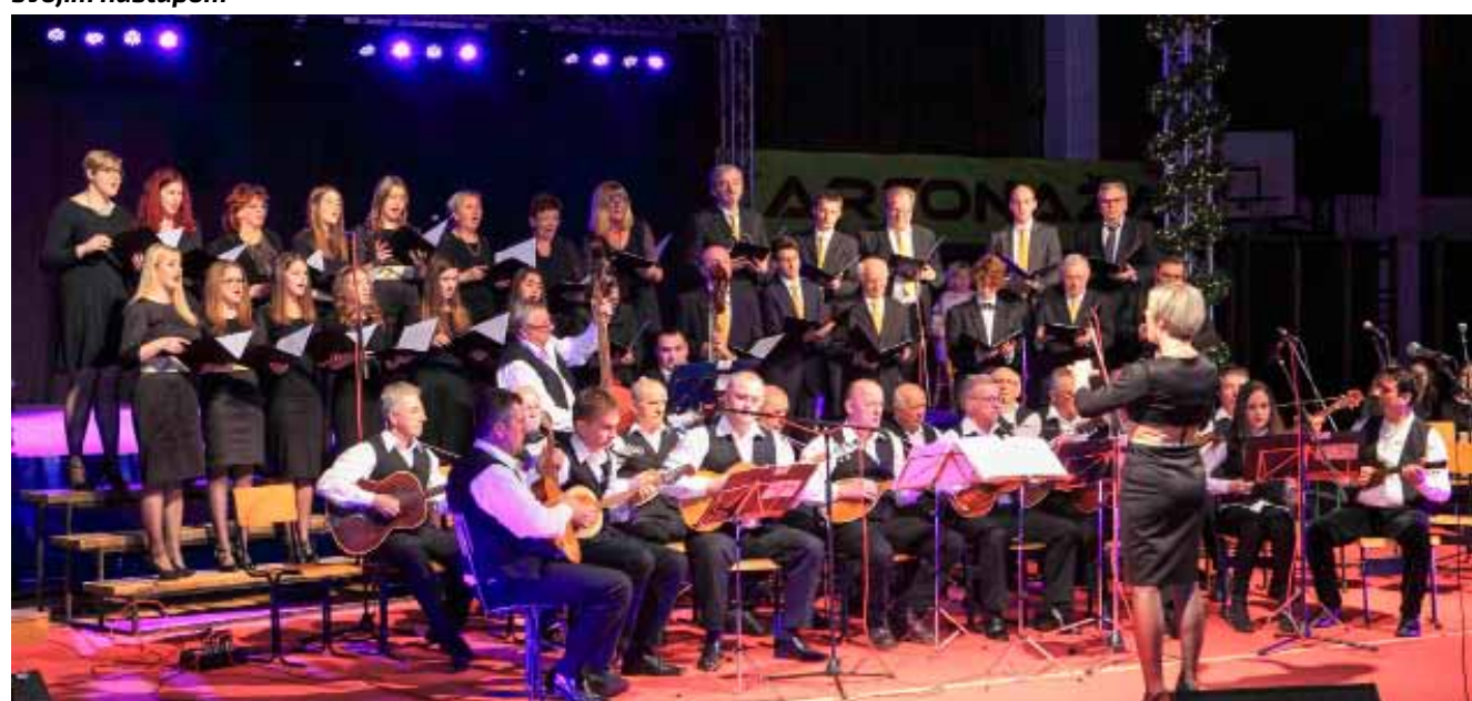
KUD Rudolf Rajter i Tamburaški orkestar KUD-a Itas