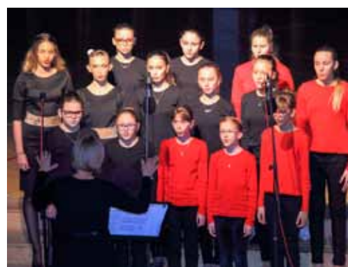
Zasluhuje najviše ocjene – Dječji zbor OŠ Ivanec