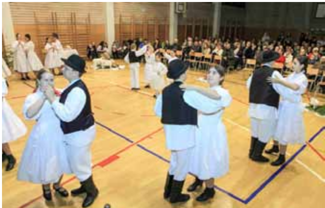
Božićno veselje u ritmu folklora

Budući da je KUD Salinovec nositelj folklornog stvaralaštva ne samo na području grada Ivanca, već i cijele regije i šire, što je dosad i potvrdio osvajanjem čelnih mjesta na natjecanjima u