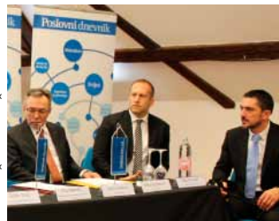
U dosadašnje tri porezne reforme Grad Ivanec ostao bez više od 5 milijuna kuna proračunskih sredstava

AKTUALNO M. Batinić o EU fondovima i poduzetništvu